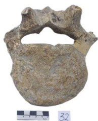
25 Haplomastodon chimborazi VÉRTEBRA TORÁCICA