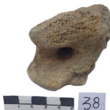
30 Haplomastodon chimborazi Frag. de ASTRÁGALO