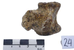
20 Haplomastodon chimborazi VÉRTEBRA CAUDAL