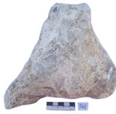
50 Haplomastodon chimborazi SÍNFISIS