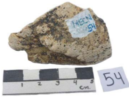
41 Haplomastodon chimborazi Frag. de DEFENSA

[fieldguides.fieldmuseum.org] [898] versión 1 6/2017