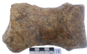
14 Haplomastodon chimborazi METACARPO III (L. D.)