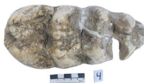
3 Haplomastodon chimborazi M3 JUV. (L. I.)