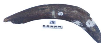
59 Haplomastodon chimborazi Frag. de VÉRTEBRA