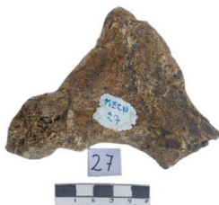
22 Haplomastodon chimborazi Frag. de VÉRTEBRA CERVICAL