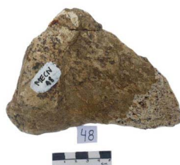
37 Haplomastodon chimborazi FALANGE I