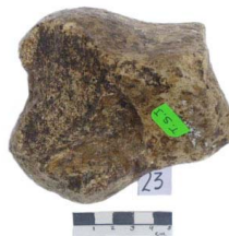
19 Haplomastodon chimborazi PIRAMIDAL (L. I.)