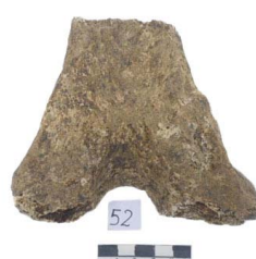
39 Haplomastodon chimborazi Frag. de VÉRTEBRA