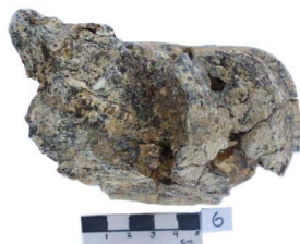
5 Haplomastodon chimborazi M2 (L. D.)