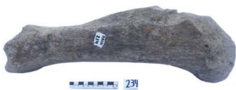
57 Haplomastodon chimborazi TIBIA (L. D.)