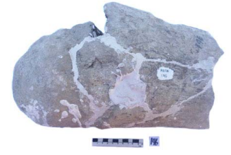
52 Haplomastodon chimborazi CABEZA DE FÉMUR