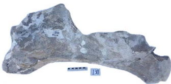
45 Haplomastodon chimborazi HÚMERO (L. I.)