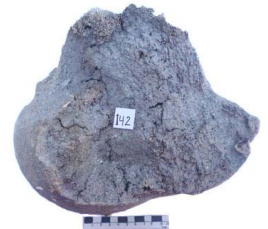
48 Haplomastodon chimborazi FÉMUR