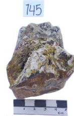
51 Haplomastodon chimborazi M1 o DP4 (L. I.)