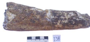
47 Haplomastodon chimborazi Frag. de RADIO