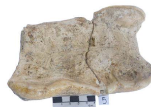
4 Haplomastodon chimborazi M3 muy desgastados