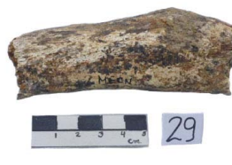
23 Haplomastodon chimborazi Frag. de COSTILLA