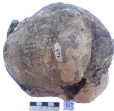
49 Haplomastodon chimborazi ASTRÁGALO (L. I.)