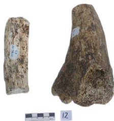
9 Haplomastodon chimborazi Frag. de RADIO