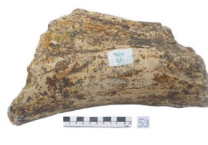
40 Haplomastodon chimborazi Frag. de FÉMUR