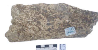
12 Haplomastodon chimborazi Frag. de COSTILLA (L. I.)