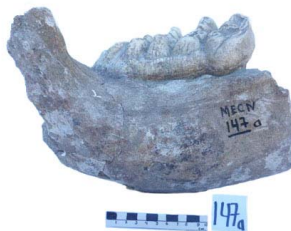
53 Haplomastodon chimborazi MANDÍBULA con M3,D,I,