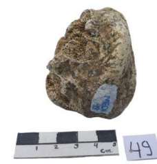
38 Haplomastodon chimborazi FALANGE II