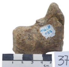
29 Haplomastodon chimborazi PISIFORME