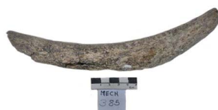
77 Haplomastodon chimborazi VÉRTEBRA