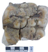
6 Haplomastodon chimborazi Frag. de M3