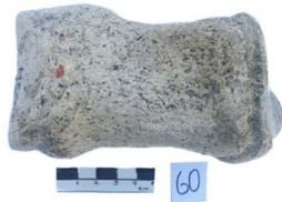
42 Haplomastodon chimborazi FALANGE I