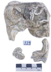
44 Haplomastodon chimborazi Frag. de M3