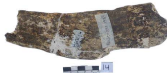
11 Haplomastodon chimborazi Frag. de COSTILLA (L. D.)