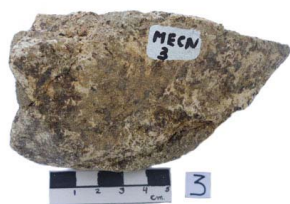
2 Haplomastodon chimborazi Frag. de VÉRTEBRA