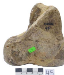
35 Haplomastodon chimborazi TARSO