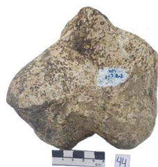
34 Haplomastodon chimborazi TARSO