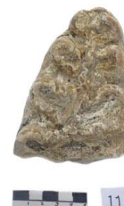
8 Haplomastodon chimborazi M3 (L. I.)