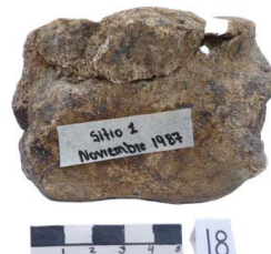
15 Haplomastodon chimborazi Frag. de VÉRTEBRA