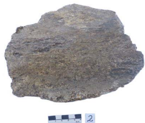
1 Haplomastodon chimborazi Frag. de PELVIS

[fieldguides.fieldmuseum.org] [898] versión 1 6/2017