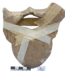
27 Haplomastodon chimborazi VÉRTEBRA TORÁCICA