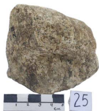
21 Haplomastodon chimborazi Frag. de RADIO DISTAL

[fieldguides.fieldmuseum.org] [898] versión 1 6/2017