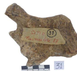
24 Haplomastodon chimborazi Frag. de ULNA PROXIMAL