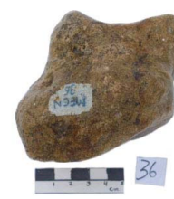
28 Haplomastodon chimborazi FALANGE II