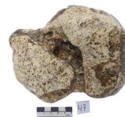
36 Haplomastodon chimborazi ASTRÁGALO (L. I.)