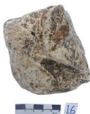
13 Haplomastodon chimborazi FÍBULA DIÁFISIS (L. I.)