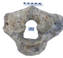
55 Haplomastodon chimborazi ATLAS