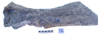
46 Haplomastodon chimborazi FÉMUR (L. D.)