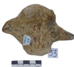
26 Haplomastodon chimborazi VÉRTEBRA CAUDAL