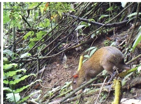
12 Dasyprocta punctata DASYPROCTIDAE Guatusa centroamericana Central American agouti