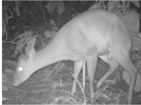
2 Mazama americana CERVIDAE Venado colorado Red brocket deer