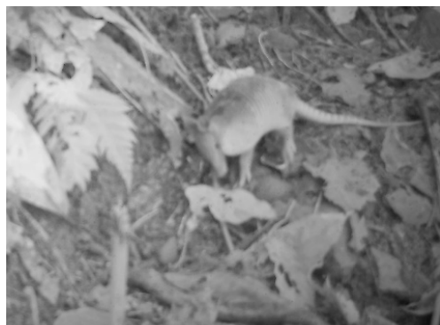
10 Dasypos novemcinctus DASYPODIDAE Armadillo narizón de nueve bandas Nine-banded armadillo