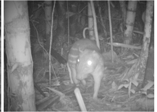
3 Cuniculus paca CUNICULIDAE Guanta de tierras bajas Spotted paca