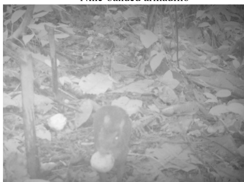
13 Dasyprocta punctata DASYPROCTIDAE Guatusa centroamericana Central American agouti