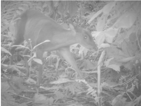
1 Mazama americana CERVIDAE Venado colorado Red brocket deer