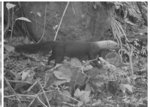
24 Eira barbara MUSTELIDAE Cabeza de mate Tayra