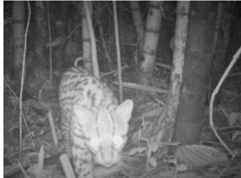
20 Leopardus pardalis FELIDAE Ocelote Ocelot