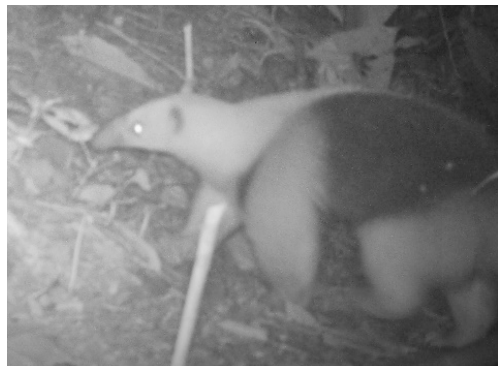
28 Tamandua mexicana MYRMECOPHAGIDAE Oso hormiguero de Occidente Western tamandua