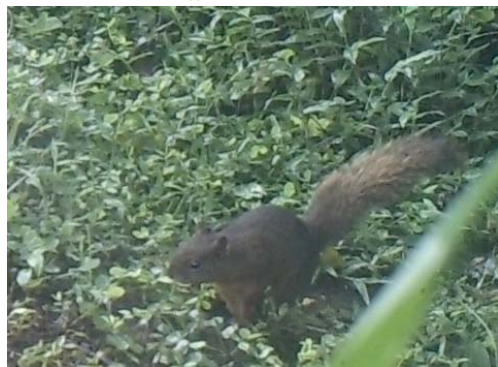
34 Sciurus granatensis SCIURIDAE Ardilla de cola roja Red-tailed squirrel