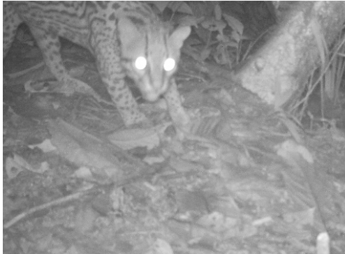
19 Leopardus pardalis FELIDAE Ocelote Ocelot