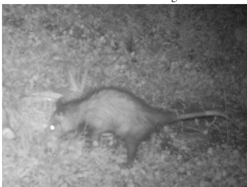
17 Didelphis marsupialis DIDELPHIDAE Zarigüeya común Common opossum