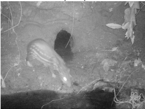
7 Cuniculus paca CUNICULIDAE Guanta de tierras bajas Spotted paca