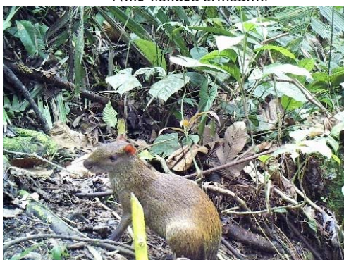
14 Dasyprocta punctata DASYPROCTIDAE Guatusa centroamericana Central American agouti