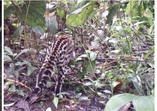
21 Leopardus pardalis FELIDAE Ocelote Ocelot