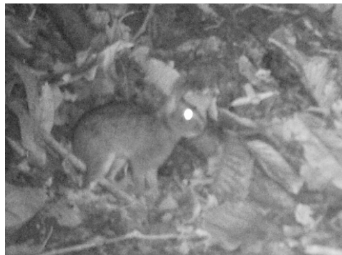
23 Sylvilagus brasiliensis LEPORIDAE Conejo silvestre Forest rabbit