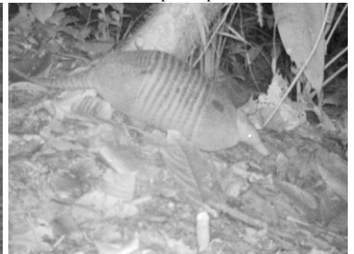
9 Dasypus novemcinctus DASYPODIDAE Armadillo narizón de nueve bandas Nine-banded armadillo