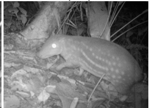
6 Cuniculus paca CUNICULIDAE Guanta de tierras bajas Spotted paca