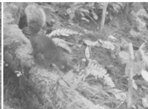
33 Sciurus granatensis SCIURIDAE Ardilla de cola roja Red-tailed squirrel