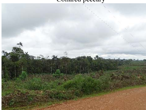
41 Remanentes de Bosque Tropical, Pedro Vicente Maldonado