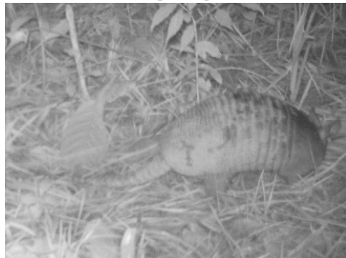
8 Dasypus novemcinctus DASYPODIDAE Armadillo narizón de nueve bandas Nine-banded armadillo