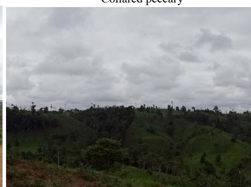
42 Remanentes de Bosque Tropical, Puerto Quito