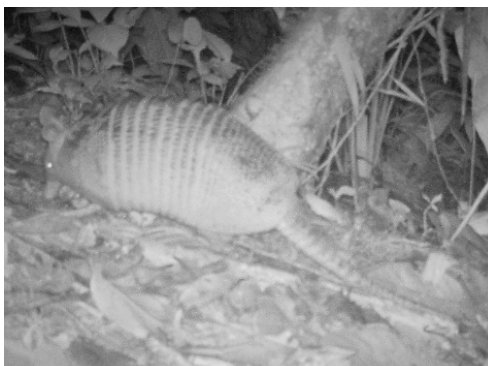
11 Dasypos novemcinctus DASYPODIDAE Armadillo narizón de nueve bandas Nine-banded armadillo