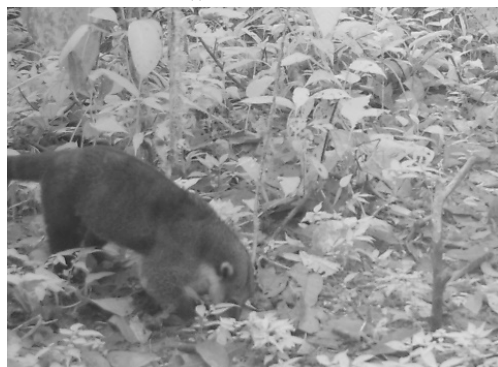
31 Nasua narica PROCYONIDAE Coatí de nariz blanca White-nosed coati