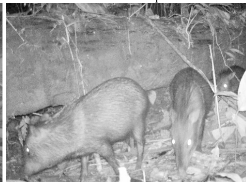
36 Pecari tajacu TAYASSUIDAE Pecarí de collar Collared peccary