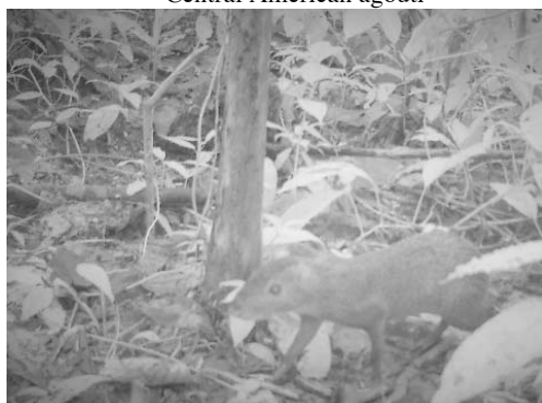
16 Dasyprocta punctata DASYPROCTIDAE Guatusa centroamericana Central American agouti