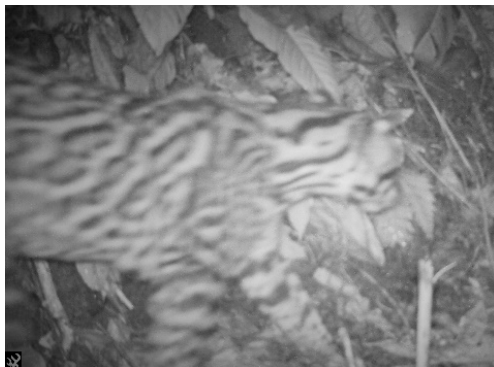
22 Leopardus pardalis FELIDAE Ocelote Ocelot