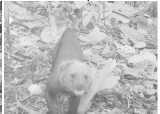
27 Eira barbara MUSTELIDAE Cabeza de mate Tayra