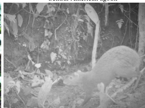
15 Dasyprocta punctata DASYPROCTIDAE Guatusa centroamericana Central American agouti