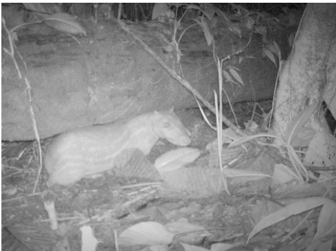
4 Cuniculus paca CUNICULIDAE Guanta de tierras bajas Spotted paca