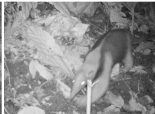
30 Tamandua mexicana MYRMECOPHAGIDAE Oso hormiguero de Occidente Western tamandua