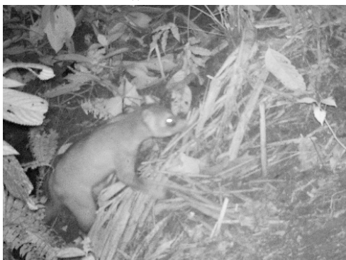
32 Procyon cancrivorus PROCYONIDAE Oso lavador cangrejero Crab-eating raccoon