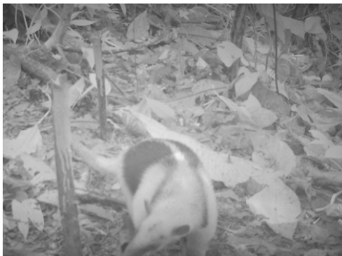
29 Tamandua mexicana MYRMECOPHAGIDAE Oso hormiguero de Occidente Western tamandua