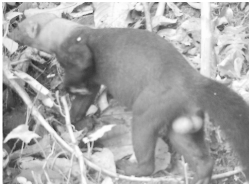
25 Eira barbara MUSTELIDAE Cabeza de mate Tayra