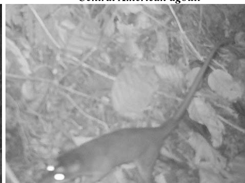
18 Metachirus nudicaudatus DIDELPHIDAE Raposa común de cuatro ojos Brown four-eyed opossum