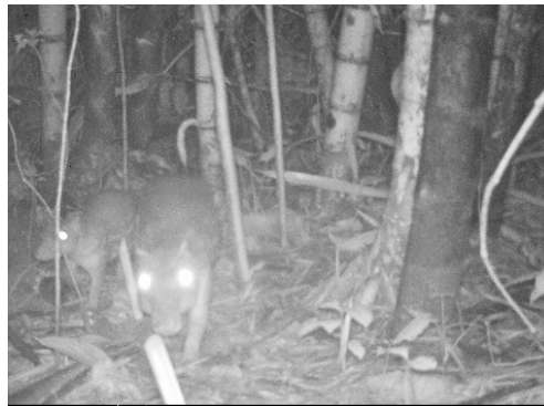
5 Cuniculus paca CUNICULIDAE Guanta de tierras bajas Spotted paca