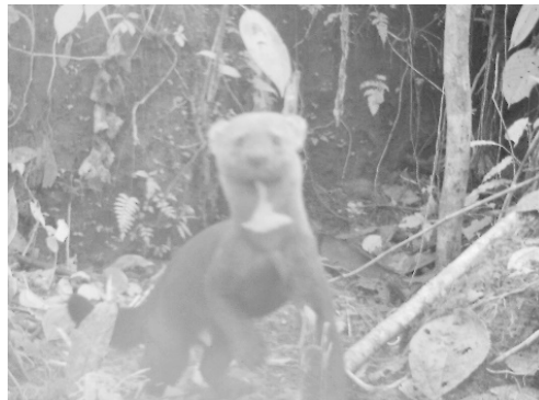
26 Eira barbara MUSTELIDAE Cabeza de mate Tayra