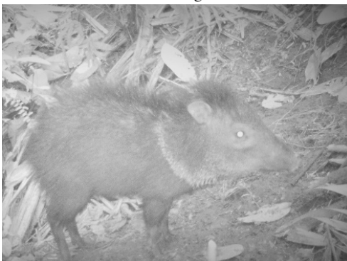
35 Pecari tajacu TAYASSUIDAE Pecarí de collar Collared peccary