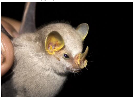
55. Mesophylla macconnelli * Murciélaguito cremoso PHYLLOSTOMIDAE