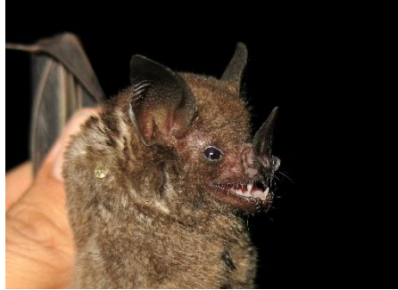
38. Carollia brevicauda * Murciélago frutero colicorto PHYLLOSTOMIDAE