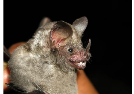
39. Carollia perspicillata * Murciélago frutero común PHYLLOSTOMIDAE