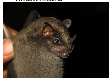
60. Platyrrhinus ismaeli * Murciélagito de nariz ancha de Ismael PHYLLOSTOMIDAE