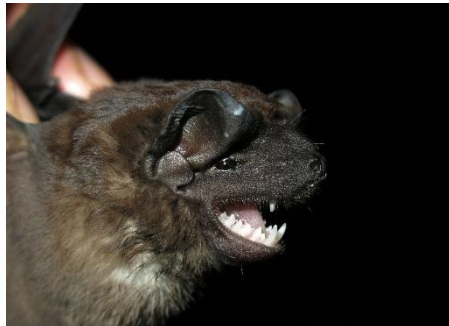
98. Molossus sinaloae * Murciélago mastín de Sinaloa MOLOSSIDAE