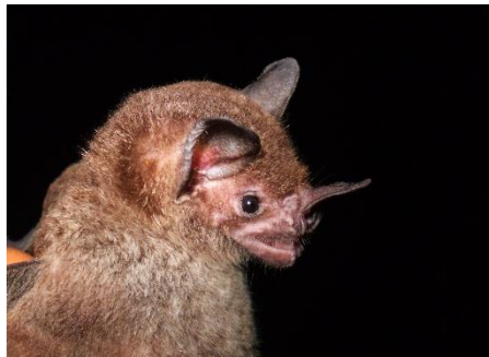
32. Phylloderma stenops * Murciélago de rostro pálido PHYLLOSTOMIDAE