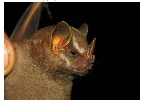
57. Platyrrhinus brachycephalus * Murciélagito de nariz ancha de cabeza pequeña PHYLLOSTOMIDAE