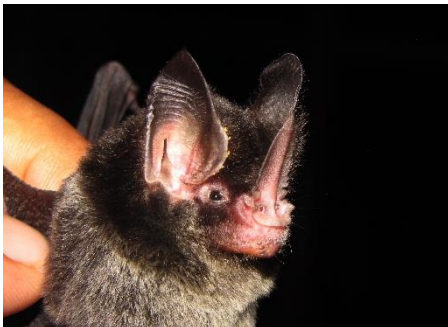
31. Mimon crenulatum ▲ Murciélago de hoja nasal peluda PHYLLOSTOMIDAE