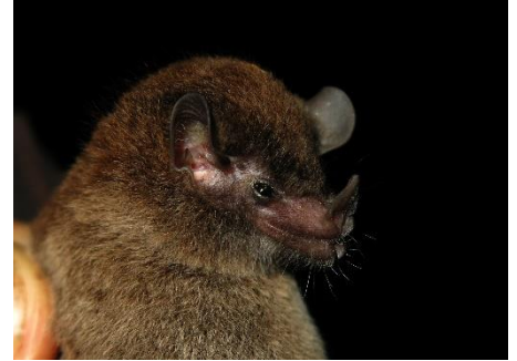
15. Lionycteris spurrelli * Murciélagito longirostro pequeño PHYLLOSTOMIDAE