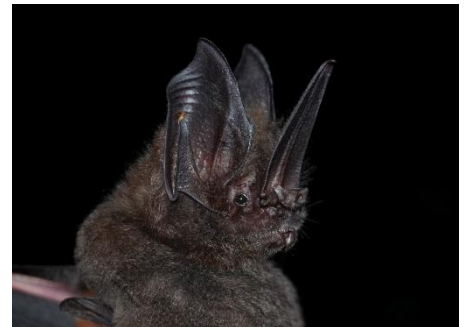
21. Lonchorhina aurita ▲ Murciélagito de espada PHYLLOSTOMIDAE