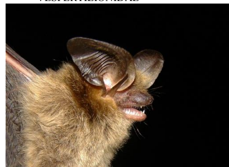
108. Histiotus velatus ■ Murciélago orejón del Trópico VESPERTILIONIDAE