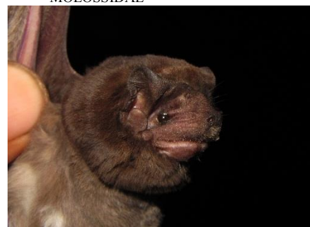
102. Promops davisoni ▲ Murciélago mastín gris MOLOSSIDAE