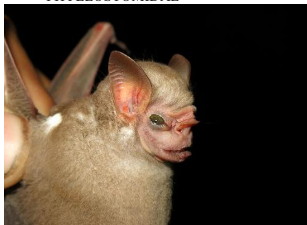
65. Sphaeronycteris toxophyllum * Murciélago apache (♀) PHYLLOSTOMIDAE