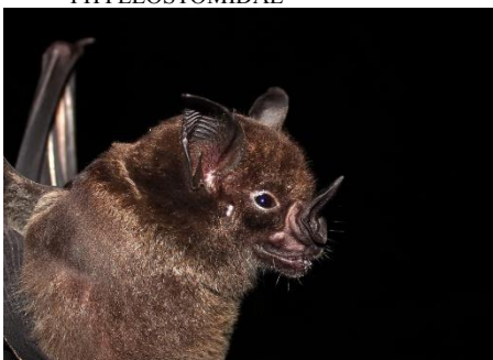
34. Phyllostomus hastatus * Murciélago hoja de lanza mayor PHYLLOSTOMIDAE