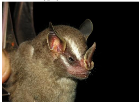
47. Artibeus gnomus * Murciélago frutero enano PHYLLOSTOMIDAE