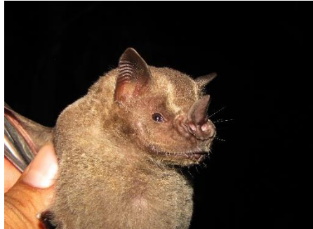
50. Artibeus planirostris ▲ Murciélagito frutero de rostro plano PHYLLOSTOMIDAE