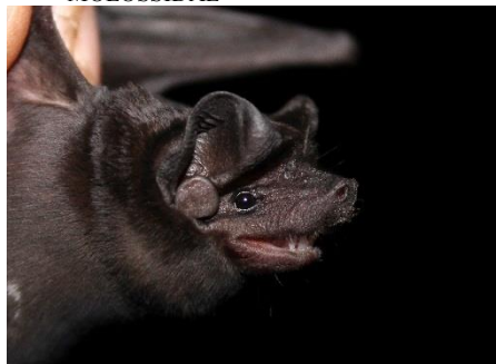
95. Molossus coibensis * Murciélago mastín de Coiba (forma negruzca) MOLOSSIDAE