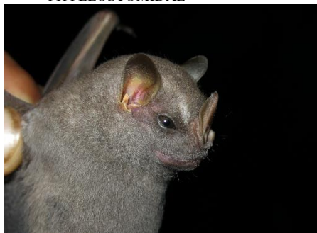
53. Chiroderma villosum * Murciélagito de líneas tenues PHYLLOSTOMIDAE