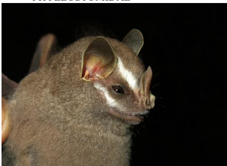
52. Chiroderma trinitatum * Murciélagito menor de listas PHYLLOSTOMIDAE