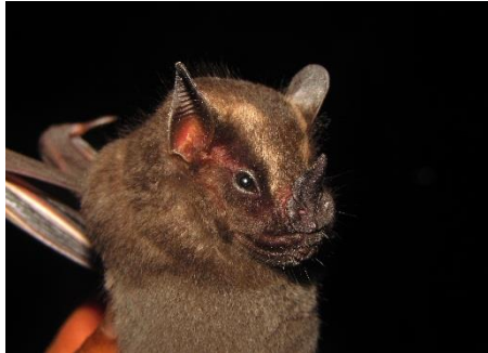
61. Platyrrhinus masu ▲ Murciélago de nariz ancha quechua PHYLLOSTOMIDAE

[fieldguides.fieldmuseum.org] [808] versión 1 08/2016