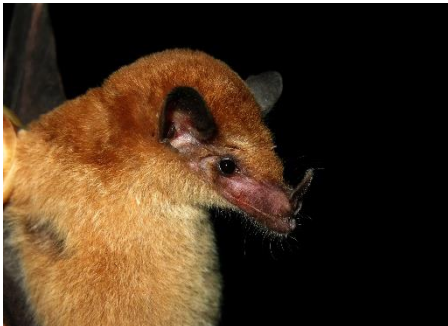
16. Lonchophylla robusta * Murciélagito longirostro acanelado PHYLLOSTOMIDAE