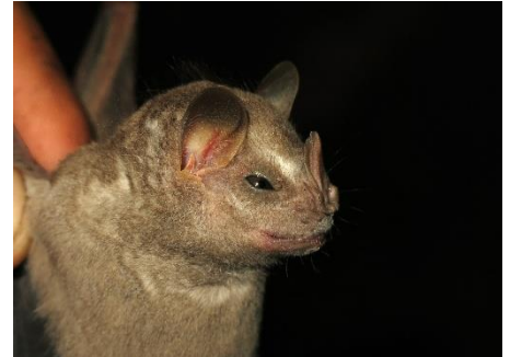
51. Chiroderma salvini * Murciélagito de listas claras PHYLLOSTOMIDAE