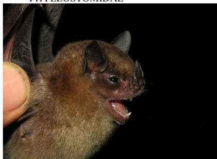
71. Sturnira tildae * Murciélago de charreteras rojizas PHYLLOSTOMIDAE