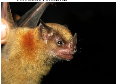
70. Sturnira oporaphilum * Murciélago de hombros amarillos de oriente PHYLLOSTOMIDAE