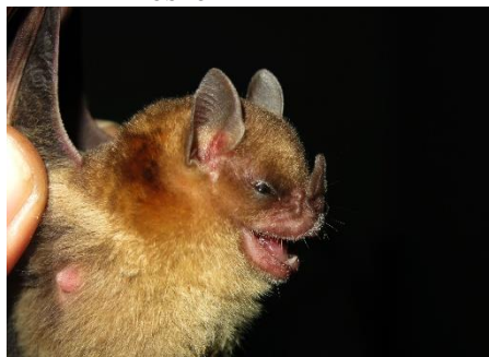
68. Sturnira luisi * Murciélago de hombros amarillos de Luis PHYLLOSTOMIDAE