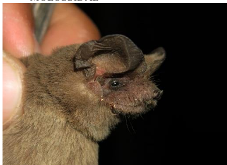
103. Tadarida brasiliensis * Murciélago mastín MOLOSSIDAE