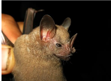
44. Artibeus concolor * Murciélaguito frugívoro pardo PHYLLOSTOMIDAE