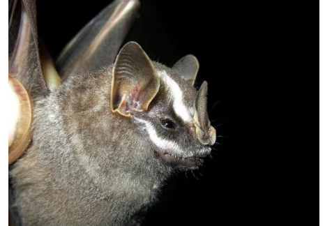
75. Vampyriscus bidens * Murciélaguito de lista dorsal PHYLLOSTOMIDAE