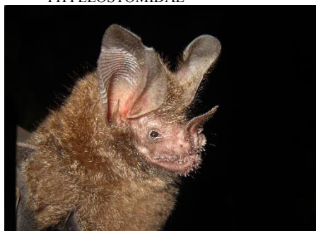
35. Trachops cirrhosus ■ Murciélago verrucoso, come-sapos PHYLLOSTOMIDAE