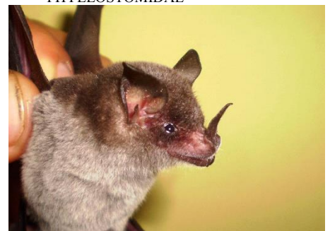
36. Trinycteris nicefori * Murciélago de orejas puntiagudas PHYLLOSTOMIDAE