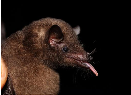
13. Choeroniscus minor * Murciélaguito longirostro amazónico PHYLLOSTOMIDAE

[fieldguides.fieldmuseum.org] [808] versión 1 08/2016