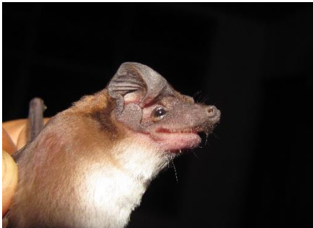
88. Cynomops planirostris ▲ Murciélago de cola libre de vientre blanco MOLOSSIDAE