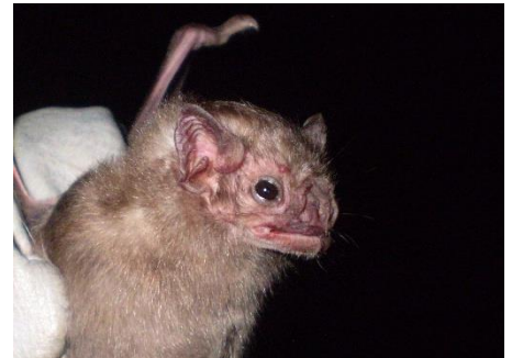
9. Diaemus youngi * Vampiro aliblanco PHYLLOSTOMIDAE