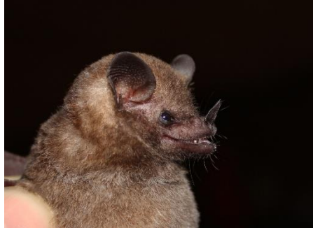
14. Glossophaga soricina * Murciélagito longirostro de Pallas PHYLLOSTOMIDAE