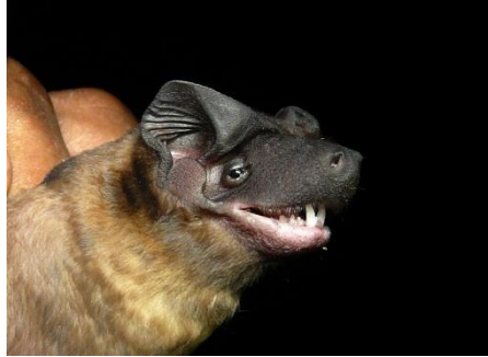
86. Cynomops abrasus ▲ Murciélago de cola libre MOLOSSIDAE