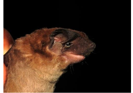
87. Cynomops greenhalli ▲ Murciélago cara de perro de Greenhall MOLOSSIDAE