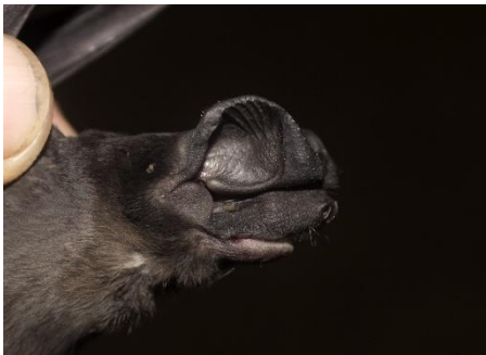
91. Eumops hansae * Murciélago de bonete de Sanborn MOLOSSIDAE