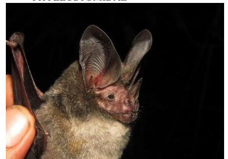
24. Lophostoma occidentale ▲ Murciélagito de orejas redondas Occidental PHYLLOSTOMIDAE