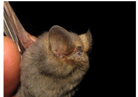
81. Amorphochilus schnablii ▲ Murciélago ahumado FURIPTERIDAE