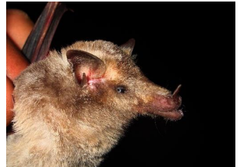
18. Platalina genovensium * Murciélagito longirostro peruano PHYLLOSTOMIDAE