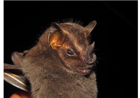
63. Platyrrhinus nigellus ▲ Murciélago de nariz ancha negrito PHYLLOSTOMIDAE