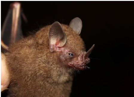
40. Rhinophylla fischerae * Murciélago pequeño frutero de Fischer PHYLLOSTOMIDAE