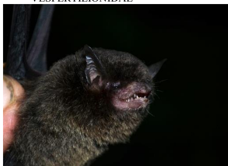
113. Myotis keaysi ▲ Murciélago negruzco VESPERTILIONIDAE