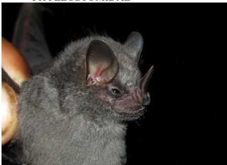
46. Artibeus glaucus * Murciélago frutero plateado PHYLLOSTOMIDAE