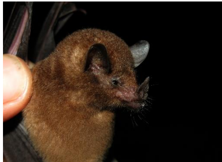
17. Lonchophylla thomasi * Murciélagito longirostro de Thomas PHYLLOSTOMIDAE