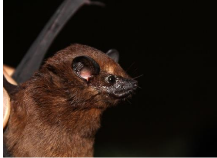
2. Cormura brevirostris * Murciélago de saco ventral EMBALLONURIDAE