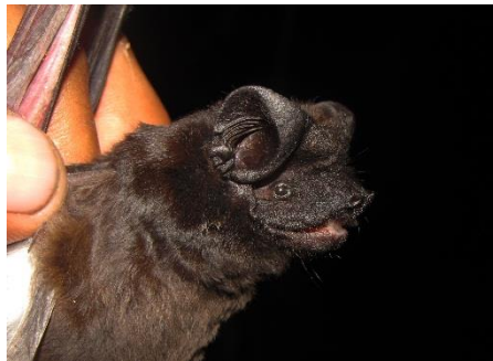
92. Eumops maurus ▲ Murciélago de bonete de Guyana MOLOSSIDAE