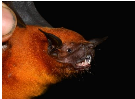
80. Noctilio albiventris † Murciélago pescador menor NOCTILIONIDAE