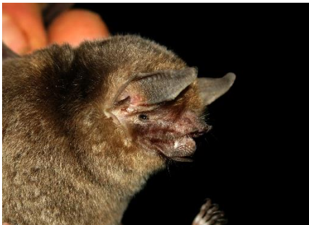
79. Pteronotus gymnotus * Murciélago de espalda desnuda MORMOOPIDAE