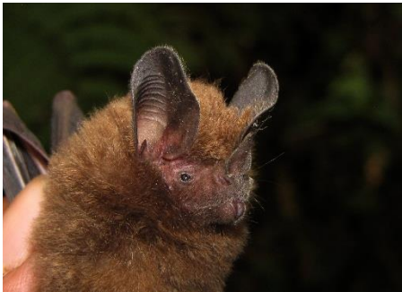
28. Miconycteris megalotis ▲ Murciélago de orejas peludas PHYLLOSTOMIDAE