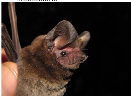
100. Nyctinomops laticaudatus ▲ Murciélago de cola MOLOSSIDAE