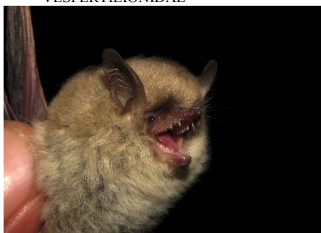
112. Myotis atacamensis ▲ Murciélaguito de Atacama VESPERTILIONIDAE