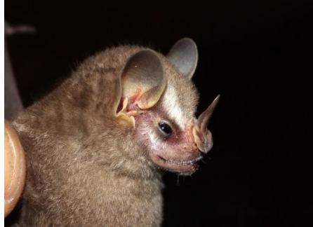
74. Vampyressa thuyone * Murciélago de orejas amarillas ecuatoriano PHYLLOSTOMIDAE