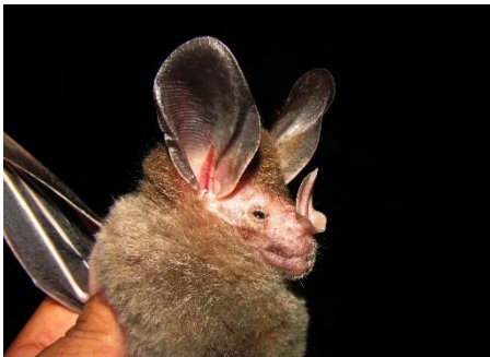
19. Chrotopterus auritus ▲ Falso vampiro PHYLLOSTOMIDAE