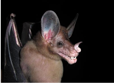
37. Vampyrum spectrum † Gran falso vampiro PHYLLOSTOMIDAE

[fieldguides.fieldmuseum.org] [808] versión 1 08/2016