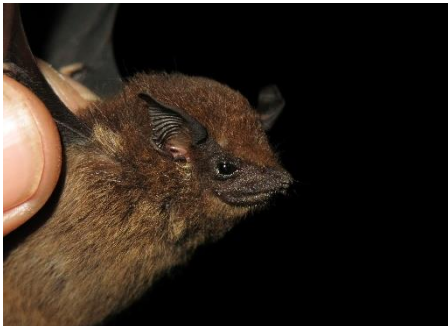
7. Saccopteryx leptura * Murciélaguito pardo de listas EMBALLONURIDAE