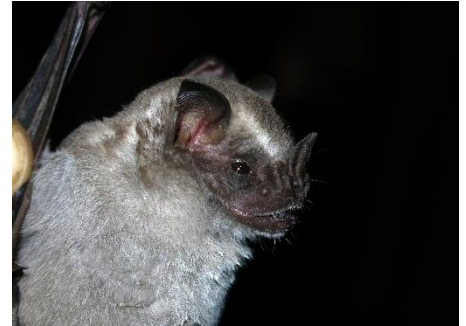
45. Artibeus fraterculus * Murciélago frutero fraternal PHYLLOSTOMIDAE