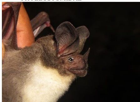
23. Lophostoma carrikeri ▲ Murciélagito orejudo de vientre blanco PHYLLOSTOMIDAE