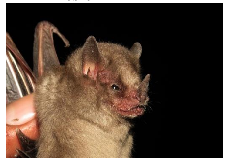
66. Sturnira bogotensis ▲ Murciélago de hombros amarillos de Bogotá PHYLLOSTOMIDAE