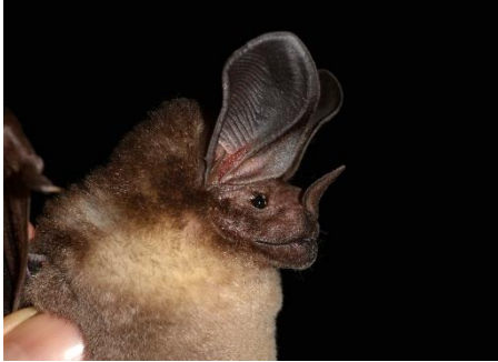
25. Lophostoma silvicolum † Murcie. de orejas redondas Garganta Blanca PHYLLOSTOMIDAE

[fieldguides.fieldmuseum.org] [808] versión 1 08/2016