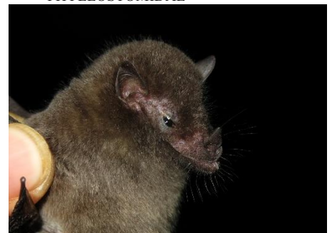
12. Anoura peruana * Murciélago longirostro sin cola peruano PHYLLOSTOMIDAE