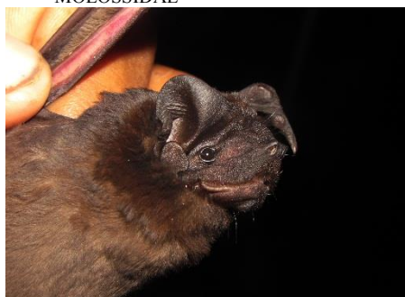
101. Promops centralis ▲ Murciélago mastín acanelado MOLOSSIDAE