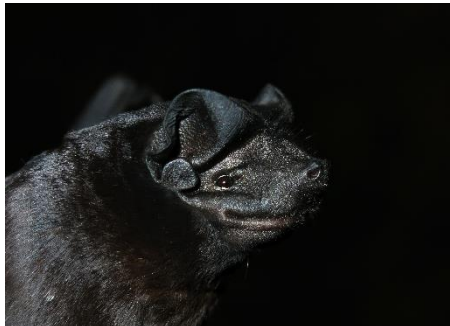
97. Molossus rufus * Murciélago mastín negro (forma negruzca) MOLOSSIDAE

[fieldguides.fieldmuseum.org] [808] versión 1 08/2016