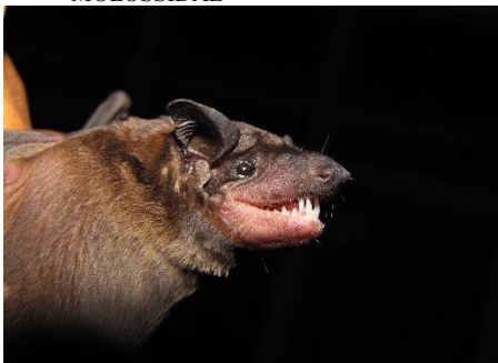
94. Molossops neglectus ▲ Murciélago cara de perro marrón MOLOSSIDAE