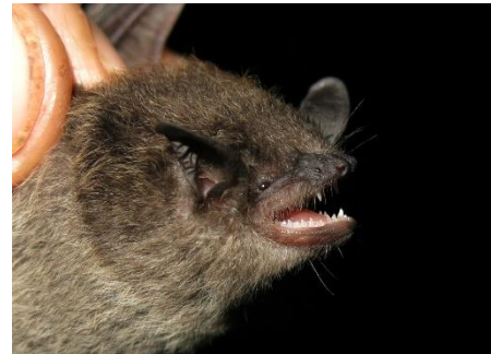
111. Myotis albescens * Murciélaguito plateado VESPERTILIONIDAE