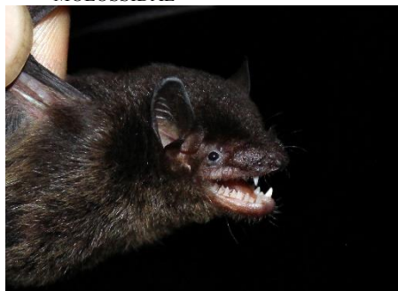
104. Eptesicus brasiliensis * Murciélago parduzco VESPERTILIONIDAE