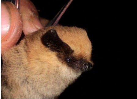
85. Tomopeas ravus * Murciélago de orejas romas MOLOSSIDAE

[fieldguides.fieldmuseum.org] [808] versión 1 08/2016