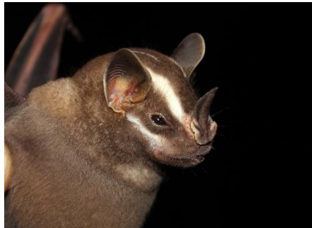
77. Vampyrodes caraccioli * Murciélago de listas pronunciadas PHYLLOSTOMIDAE