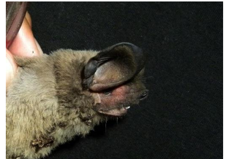
90. Eumops chiribaya † Murciélago de bonete de Chiribaya MOLOSSIDAE