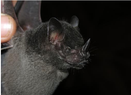
49. Artibeus obscurus * Murciélaguito frugívoro negro PHYLLOSTOMIDAE

[fieldguides.fieldmuseum.org] [808] versión 1 08/2016