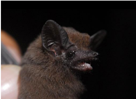
4. Peropteryx macrotis † Murciélago de sacos orejudo EMBALLONURIDAE