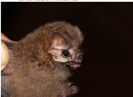
10. Diphylla ecaudata * Vampiro peludo PHYLLOSTOMIDAE