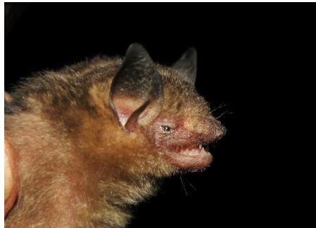
110. Rhogeessa io * Murciélago amarillo pequeño sureño VESPERTILIONIDAE