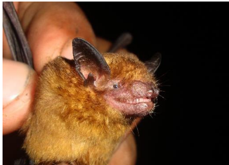
109. Rhogeessa hussoni ▲ Murciélago amarillo pequeño oriental VESPERTILIONIDAE

[fieldguides.fieldmuseum.org] [808] versión 1 08/2016