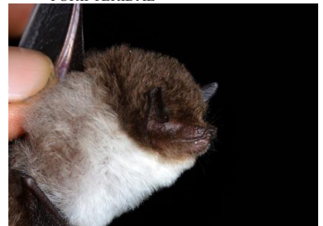
84. Thyroptera tricolor † Murciélago de ventosas de vientre blanco THYROPTERIDAE