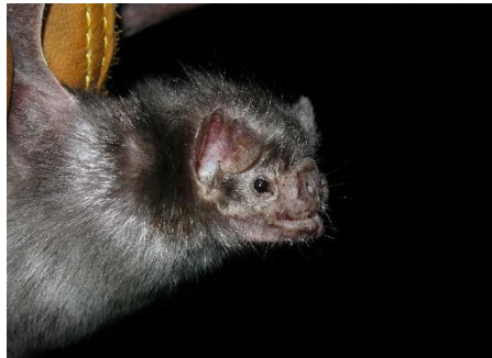
8. Desmodus rotundus * Vampiro común PHYLLOSTOMIDAE