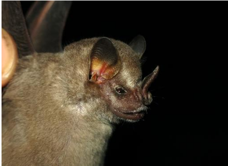
43. Artibeus cinereus * Murciélaguito frugívoro ceniciento PHYLLOSTOMIDAE