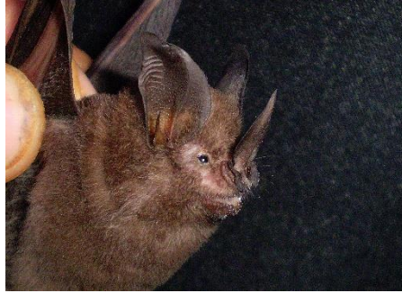
26. Macrophyllum macrophyllum * Murciélago pemilargo PHYLLOSTOMIDAE