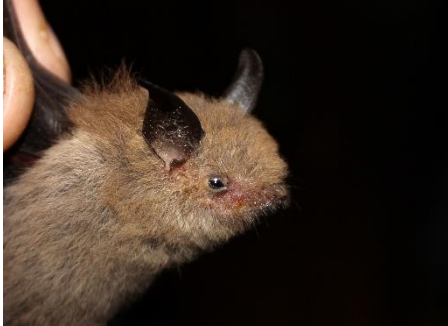
1. Centronycteris centralis * Murciélago peludo de Centro América EMBALLONURIDAE

[808] versión 1 08/2016