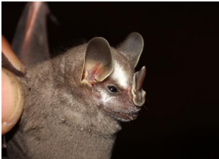
76. Vampyriscus brocki * Murciélaguito de Brock PHYLLOSTOMIDAE