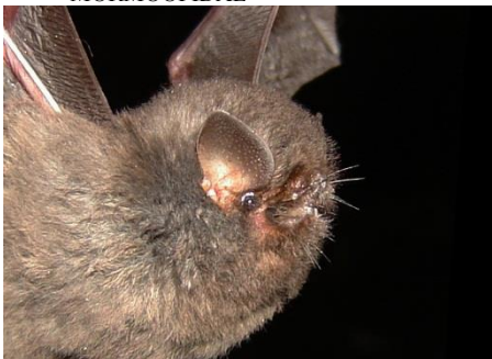
82. Furipterus horrens † Murciélago sin pulgar FURIPTERIDAE