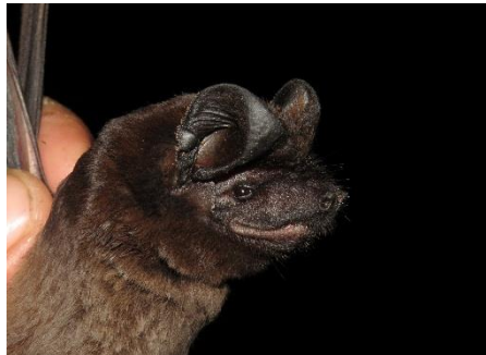
89. Eumops auripendulus ▲ Murciélago de cola libre común MOLOSSIDAE