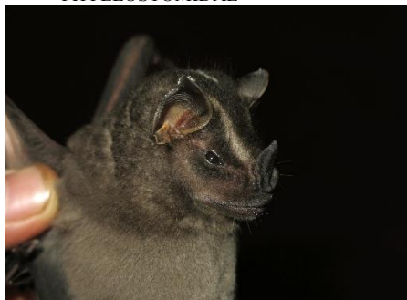
56. Platyrrhinus albericoi * Murciélagito de nariz ancha de Alberico PHYLLOSTOMIDAE