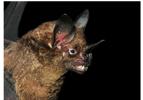
33. Phyllostomus elongatus * Murciélago hoja de lanza alargado PHYLLOSTOMIDAE