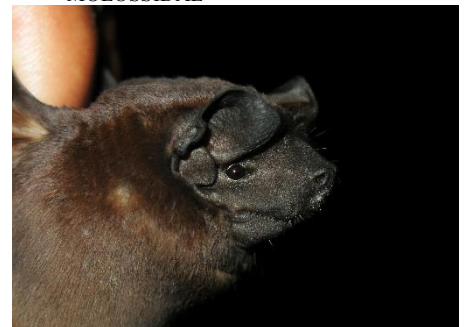
96. Molossus molossus * Murciélago casero MOLOSSIDAE