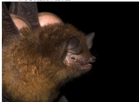
83. Thyroptera discifera * Murciélago de ventosas de vientre pardo THYROPTERIDAE