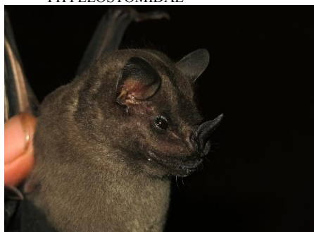
59. Platyrrhinus infuscus * Murciélagito de nariz ancha de listas tenues PHYLLOSTOMIDAE