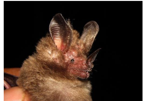
30. Miconycteris schmidtorum ▲ Murciélago de orejas peludas PHYLLOSTOMIDAE