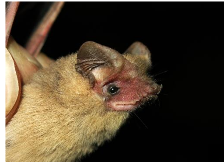
99. Mormopterus kalinowskii * Murciélago de cola libre de Kalinowski MOLOSSIDAE