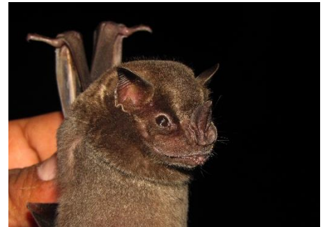
42. Artibeus aequatorialis ▲ Murciélaguito frugívoro común PHYLLOSTOMIDAE