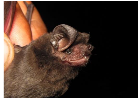
93. Eumops patagonicus ▲ Murciélago de bonete de la Patagonia MOLOSSIDAE