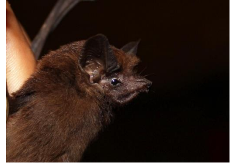
3. Peropteryx pallidoptera * Murciélago de sacos aliblanco EMBALLONURIDAE