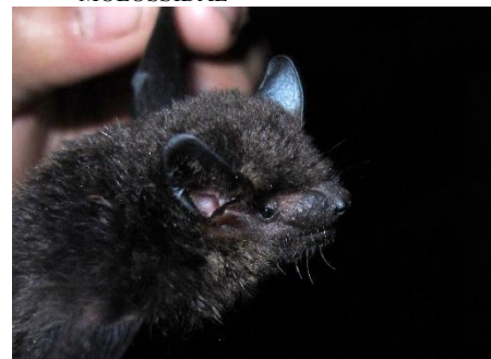
105. Eptesicus chiriquinus † Murciélago marrón chiriquino VESPERTILIONIDAE