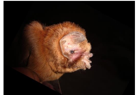
78. Mormoops megalophylla ▲ Murciélago fantasma MORMOOPIDAE