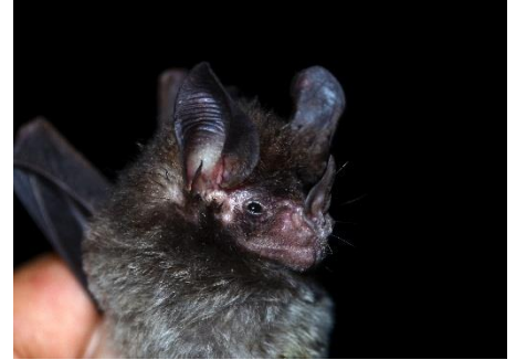
27. Miconycteris hirsuta ▲ Murciélago de orejas peludas PHYLLOSTOMIDAE