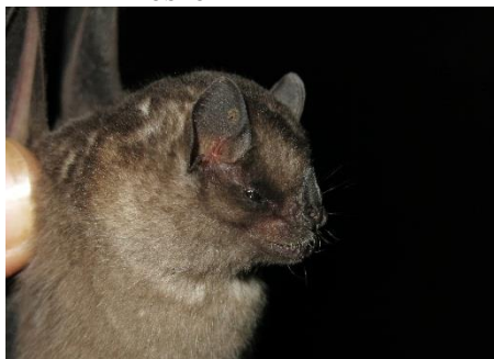
67. Sturnira erythromos * Murciélago frugívoro oscuro PHYLLOSTOMIDAE