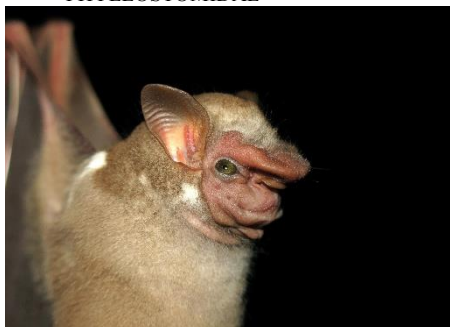
64. Sphaeronycteris toxophyllum * Murciélago apache (♂) PHYLLOSTOMIDAE