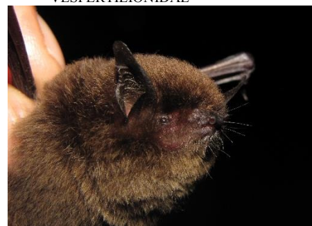
114. Myotis riparius ▲ Murciélaguito acanelado VESPERTILIONIDAE