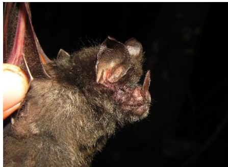
20. Glyphonycteris daviesi ▲ Murciélagito orejudo de Davies PHYLLOSTOMIDAE