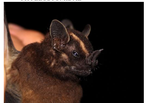
54. Enchisthenes hartii * Murciélagito frutero aterciopelado PHYLLOSTOMIDAE