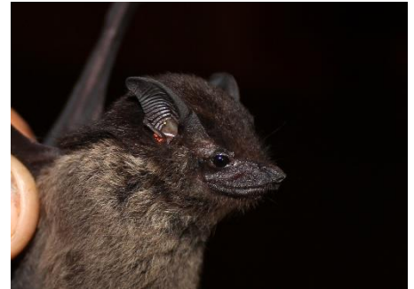
6. Saccopteryx bilineata * Murciélaguito negro de listas EMBALLONURIDAE