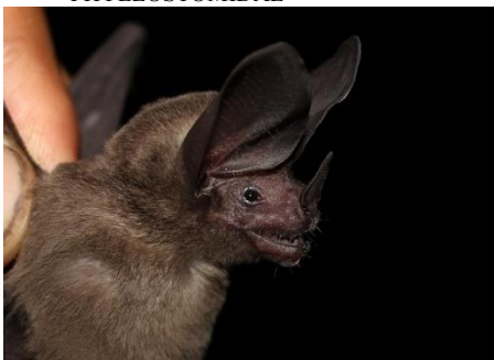
22. Lophostoma brasiliense * Murciélagito de orejas redondas pigmeo PHYLLOSTOMIDAE