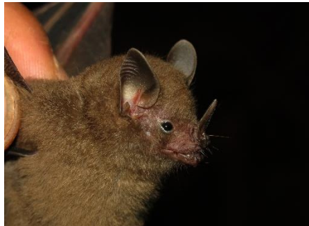
41. Rhinophylla pumilio * Murciélago pequeño frutero común PHYLLOSTOMIDAE