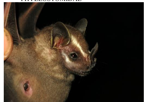
72. Uroderma bilobatum * Murciélago constructor de toldos PHYLLOSTOMIDAE