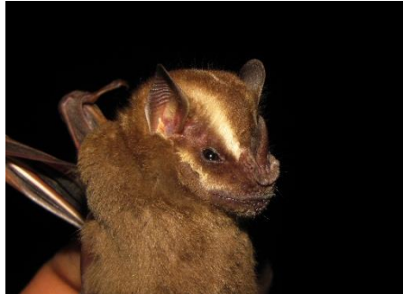
62. Platyrrhinus matapalensis ▲ Murciélago de nariz ancha de Matapalo PHYLLOSTOMIDAE