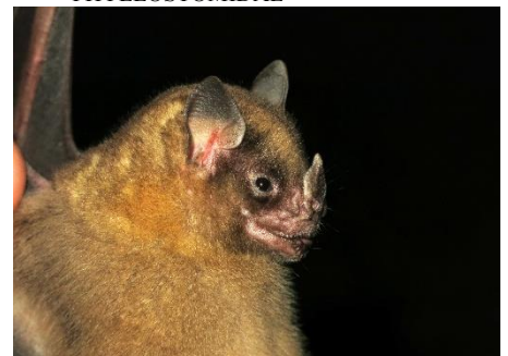
69. Sturnira magna * Murciélago de hombros amarillos grande PHYLLOSTOMIDAE