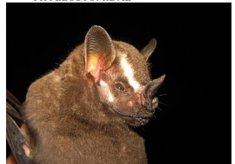
48. Artibeus lituratus ▲ Murciélaguito frugívoro mayor PHYLLOSTOMIDAE