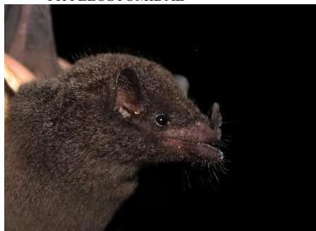
11. Anoura caudifer * Murciélago longirostro menor PHYLLOSTOMIDAE