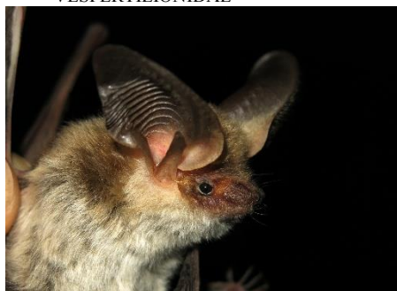
107. Histiotus montanus * Murciélago orejón andino VESPERTILIONIDAE