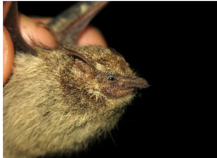
5. Rhynchonycteris naso * Murciélaguito narigudo EMBALLONURIDAE