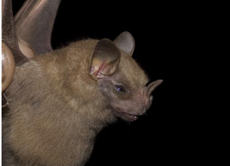
73. Uroderma magnirostrum * Murciélago amarillento constructor de toldos PHYLLOSTOMIDAE

[fieldguides.fieldmuseum.org] [808] versión 1 08/2016