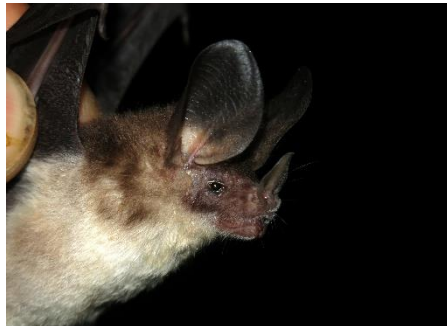
29. Miconycteris minuta * Murciélago orejudo de pliegues altos PHYLLOSTOMIDAE