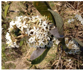
8. A. macrocarpon