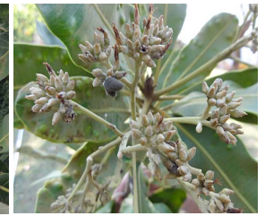
10. A. nobile