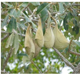
11. A. nobile