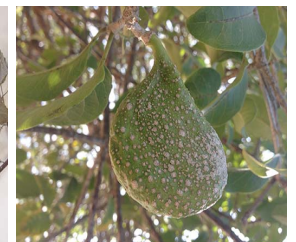
15. A. pyrifolium