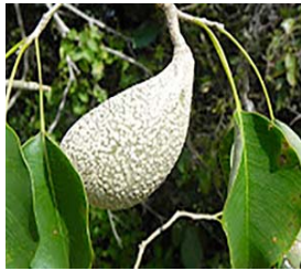
2. A. australe