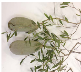
17. A. quebracho-blanco