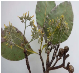
6. A. flaviflorum