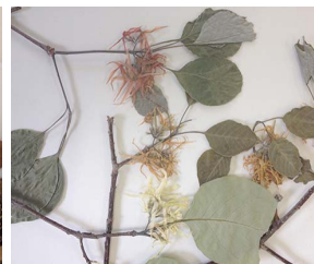
14. A. pyrifolium