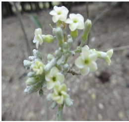
1. A. australe

[ fieldguides.fieldmuseum.org ] [768] versão 01 05/2016