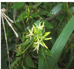
16. A. quebracho-blanco