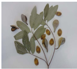
12. A. parvifolium