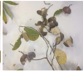
4. A. cuspa