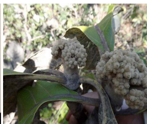
24. A. verbascifolium