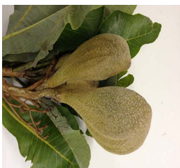
21. A. tomentosum