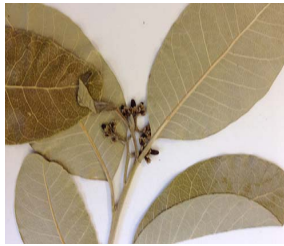
3. A. cuspa