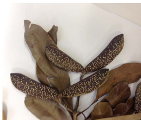
13. A. polyneuron