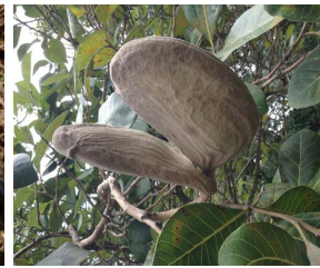
9. A. macrocarpon