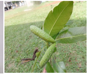
5. A. cilndrocarpon