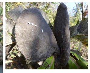
25. A. verbascifolium