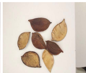
23. A. triternatum