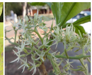
20. A. tomentosum