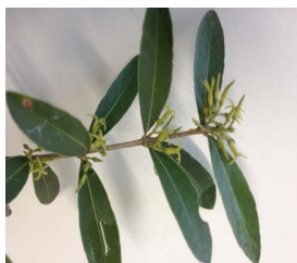
22. A. triternatum