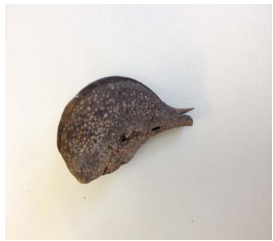
7. A. flaviflorum