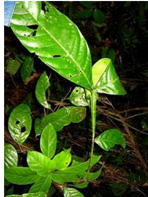
28 Guarea pterorhachis RS MELIACEAE