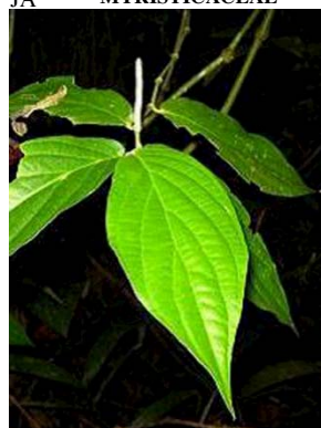
38 Piper aduncum GN PIPERACEAE