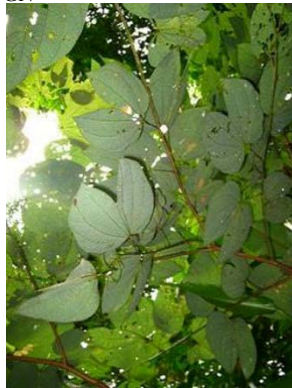
17 Schnella porphyrotricha GN FABACEAE