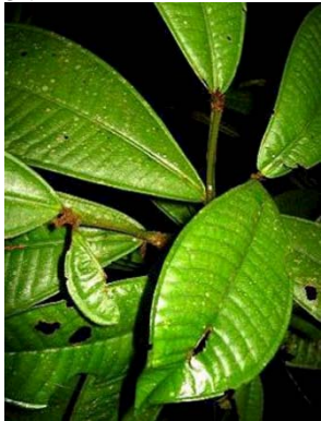
26 Graffenrieda sp. GN MELASTOMATACEAE