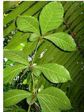
4 Cordia nodosa JA BORAGINACEAE