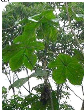
57 Cecropia sp. GN URTICACEAE