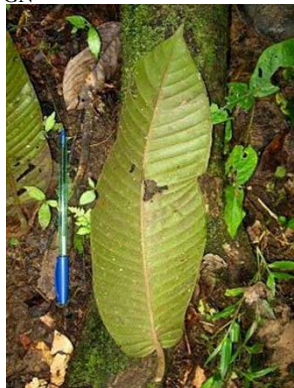
6 Marila sp. GN CALOPHYLLACEAE