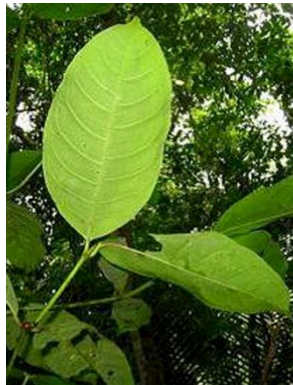
45 Fareaea sp.1 GN RUBIACEAE