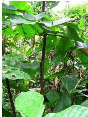
16 Inga sp.1 GN FABACEAE