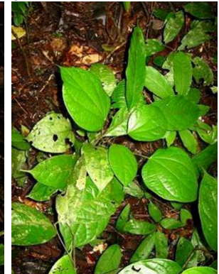
30 Abuta sp. GN MENISPERMACEAE