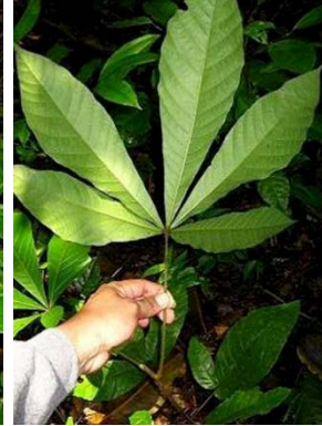
24 Herrania nitida JA MALVACEAE