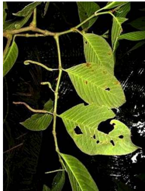
41 Piper sp.2 GN PIPERACEAE

[fieldguides.fieldmuseum.org] [731] versión 1 03/2016