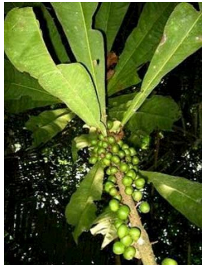
44 Clavija sp. JA PRIMULACEAE