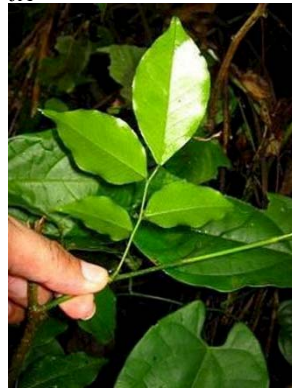
18 Swartzia sp. GN FABACEAE