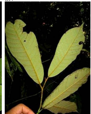
35 Virola sp. GN MYRISTICACEAE