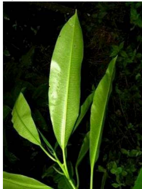
12 Sapium sp. GN EUPHORBIACEAE