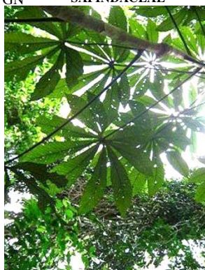
58 Pourouma sp. GN URTICACEAE