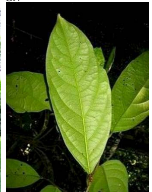
10 Hirtella sp. GN CHRYSOBALANACEAE