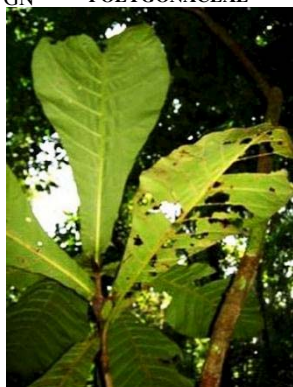
48 Pentagonia sp. RS RUBIACEAE