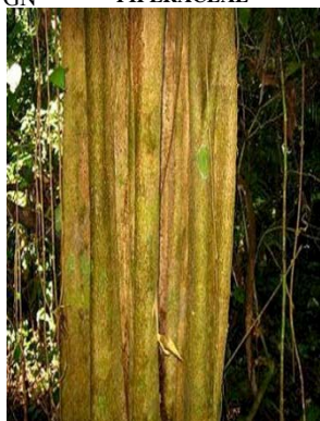
47 Macrocnemum roseum RS RUBIACEAE