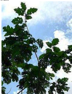
54 Solanum wrightii GN SOLANACEAE