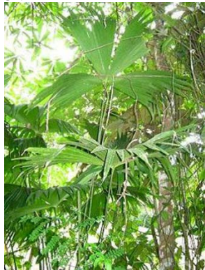
11 Carludovica palmata GN CYCLANTHACEAE