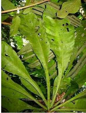
21 Gustavia longifolia GN LECYTHIDACEAE