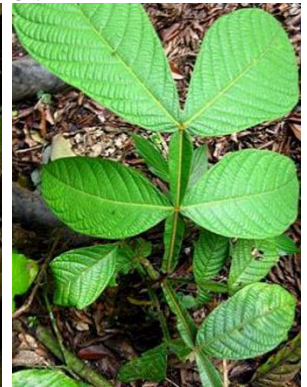
15 Inga sp.1 (plántula) GN FABACEAE