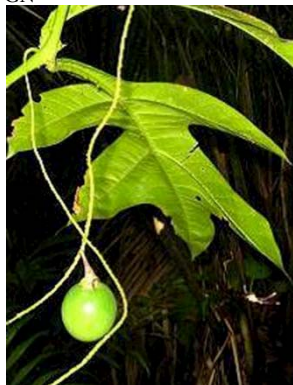
55 Solanum sp. GN SOLANACEAE