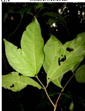
59 Rinorea viridifolia GN VIOLACEAE