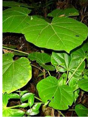
23 Matisia cordata GN MALVACEAE