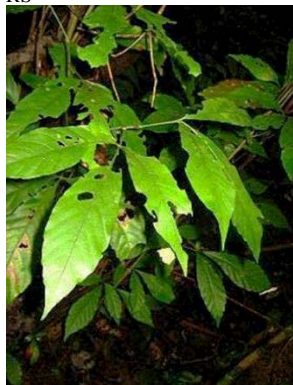
53 Allophylus sp. GN SAPINDACEAE