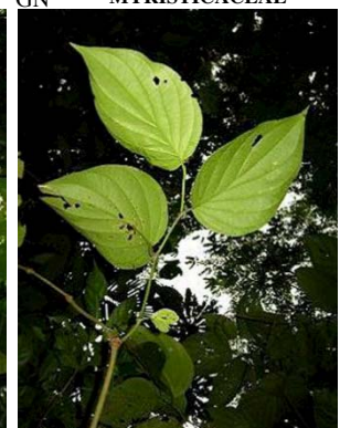
40 Piper sp.1 GN PIPERACEAE