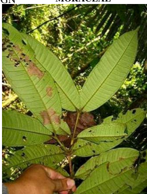
36 Calyptranthes sp. GN MYRTACEAE