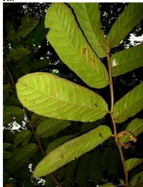
52 Tetrathylacium macrophyllum GN SALICACEAE