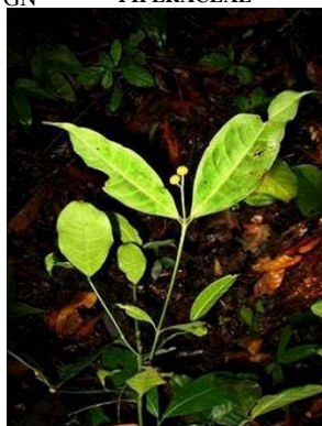
46 Fareaea sp.2 GN RUBIACEAE