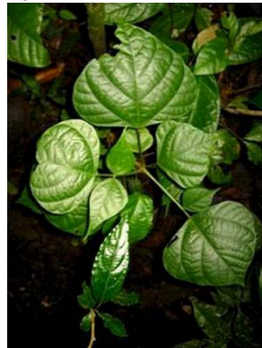
13 Erythrina sp. JA FABACEAE