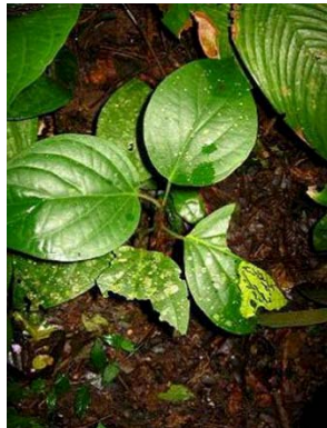
42 Piper sp.3 GN PIPERACEAE