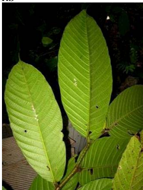
32 Perebea guianensis GN MORACEAE