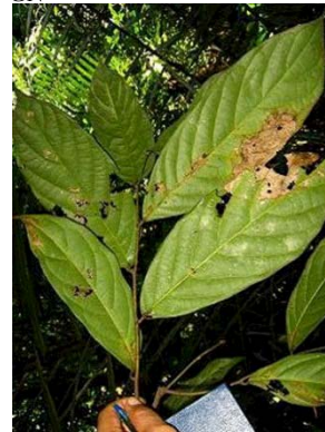
19 Ocotea sp. GN LAURACEAE