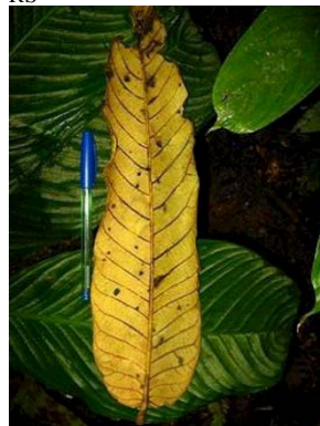
33 Virola divergens JA MYRISTICACEAE