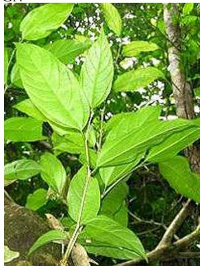
7 Celtis schippii RS CANNABACEAE