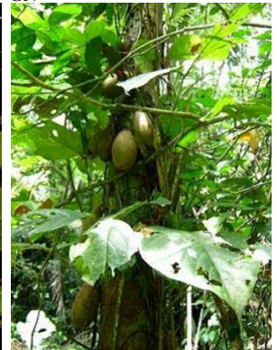
20 Grias neuberthii GN LECYTHIDACEAE