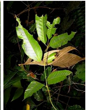
5 Protium sp. GN BURSERACEAE