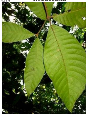
50 Simira cordata GN RUBIACEAE