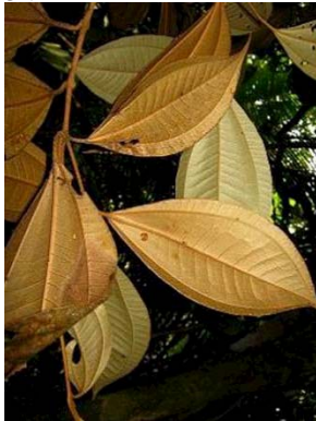
27 Miconia punctata RS MELASTOMATACEAE