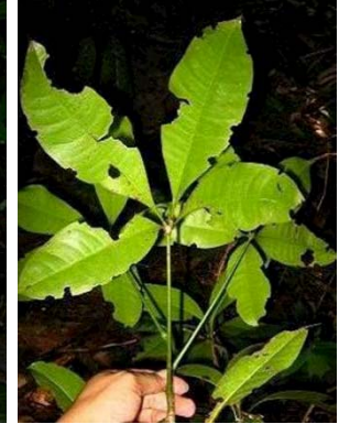
25 Pachira aquatica GN MALVACEAE