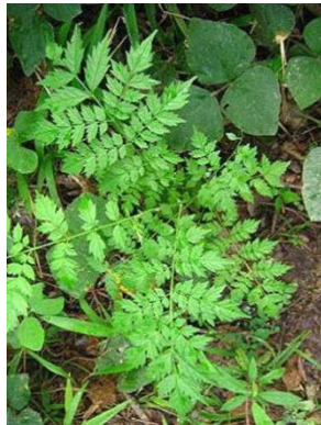
2 Jacaranda copaia GN BIGNONIACEAE