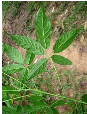
1 Schefflera sp. GN ARALIACEAE

[731] versión 1 03/2016