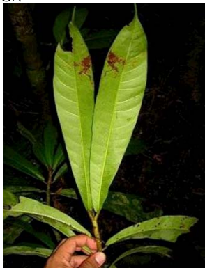
31 Naucleopsis sp. GN MORACEAE