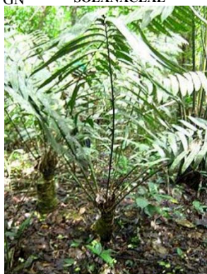
60 Zamia amazonum GN ZAMIAACEAE