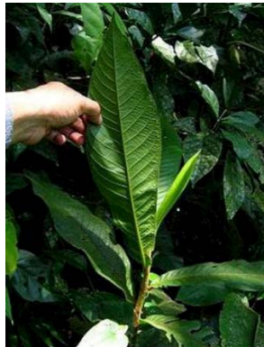
43 Triplaris sp. GN POLYGONACEAE