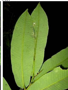
34 Virola flexuosa GN MYRISTICACEAE