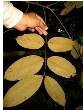
14 Hymenolobium nitidum GN FABACEAE