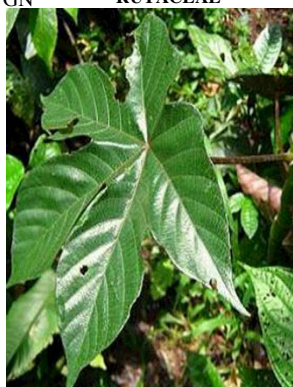
56 Cecropia membranacea GN URTICACEAE