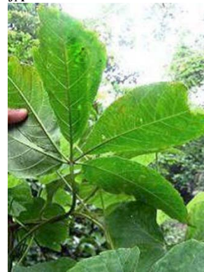
9 Jacaratia digitata MR CARICACEAE