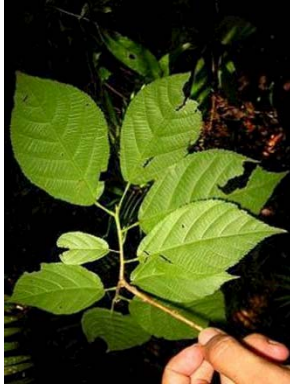
22 Apeiba aspera GN MALVACEAE