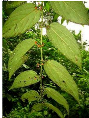
8 Trema micrantha RS CANNABACEAE