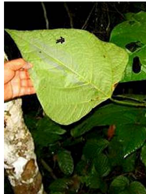
3 Bixa platycarpa GN BIXACEAE