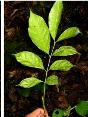
29 Guarea sp. MR MELIACEAE