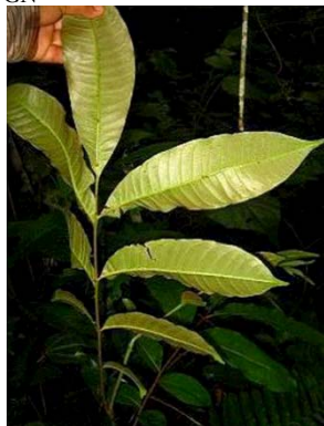
51 Zanthoxylum sp. GN RUTACEAE