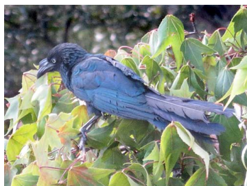
5 Crotophaga major CUCULIDAE