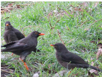
17 Turdus fuscater TURDIDAE