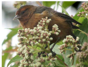
19 Conirostrum rufum THRAUPIDAE