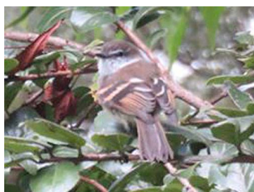
9 Mecocerculus leucophrys TYRANNIDAE