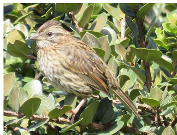
23 Zonotrichia capensis (Juv.) EMBERIZIDAE