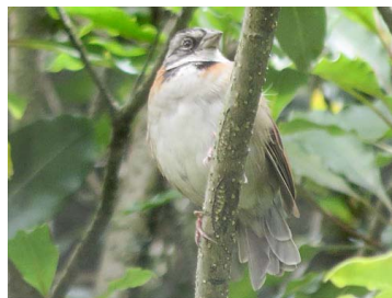
22 Zonotrichia capensis EMBERIZIDAE