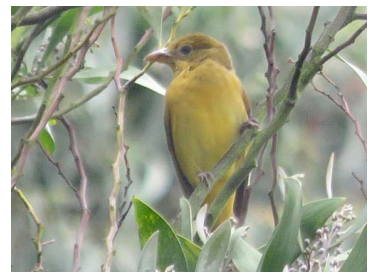
24 Piranga rubra (♀) CARDINALIDAE