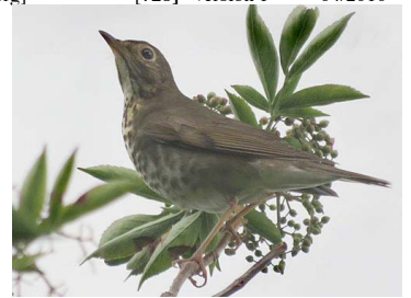
16 Catharus ustulatus TURDIDAE