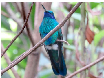
6 Colibri coruscans TROCHILIDAE