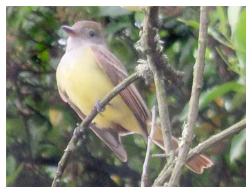
12 Myiarchus crinitus TYRANNIDAE