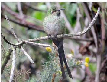
7 Lesbia nuna (♀) TROCHILIDAE