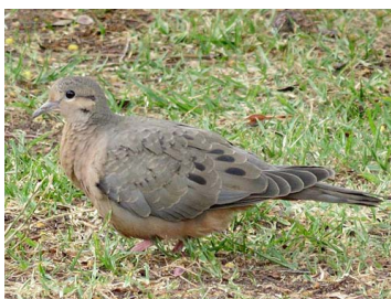
3 Zenaida auriculata COLUMBIDAE