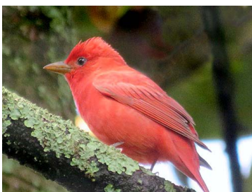
25 Piranga rubra (♂) CARDINALIDAE