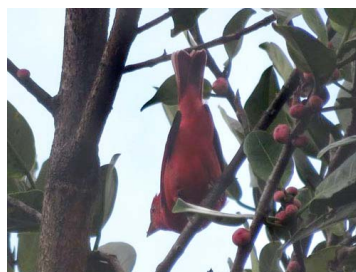
27 Piranga olivacea (♂) CARDINALIDAE