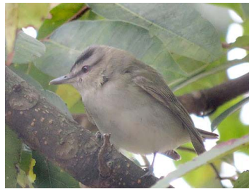
14 Vireo olivaceus VIREONIDAE