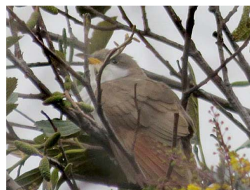
4 Coccozyus americanus COLUMBIDAE