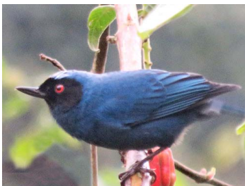
21 Diglossa cyanea THRAUPIDAE