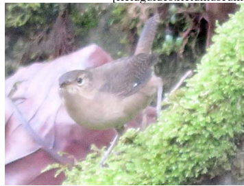
15 Troglodytes aedon TROGLODYTIDAE