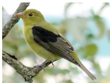
26 Piranga olivacea (♀) CARDINALIDAE