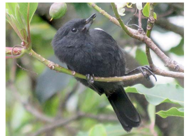
20 Diglossa humeralis THRAUPIDAE