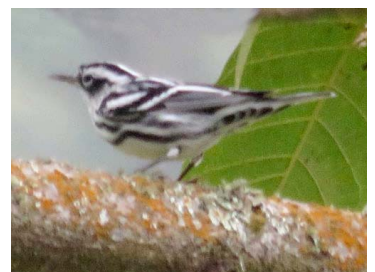
28 Mniotilta varia PARULIDAE