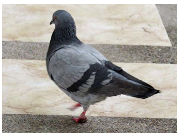
2 Columba livia COLUMBIDAE