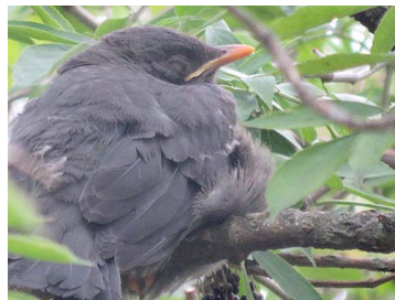
18 Turdus fuscater (Juv.) TURDIDAE