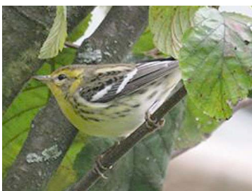
29 Setophaga fusca (♀) PARULIDAE