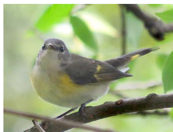
31 Setophaga ruticilla (♀) PARULIDAE