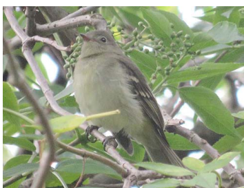
11 Elaenia frantzii TYRANNIDAE