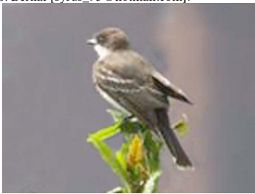
13 Tyrannus tyrannus TYRANNIDAE