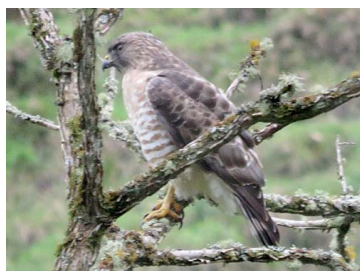
1 Buteo platypterus ACCIPITRIDAE

La facultad de ciencias y educación de la Universidad Distrital Francisco José de Caldas, se encuentra ubicada en la ciudad de Bogotá en el barrio la Macarena con coordenadas 4°36'48.3"N -4°03'49.0"W y una altitud de 2650 msnm. La Sede A del campus universitario se caracteriza por la presencia de una infraestructura y algunas plantaciones exóticas; además se encuentra un bosque en restauración con una variedad botánica nativa en su mayoría y algunas foráneas que proporcionan al ecosistema el aumento del índice de polinización, desarrollo de bioindicadores, Red trófica, alimentación a la avifauna, desarrollo al equilibrio del ecosistema y del suelo, aumentando los elementos esenciales para el desarrollo ambiental de la zona.