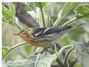
30 Setophaga fusca (♂) PARULIDAE