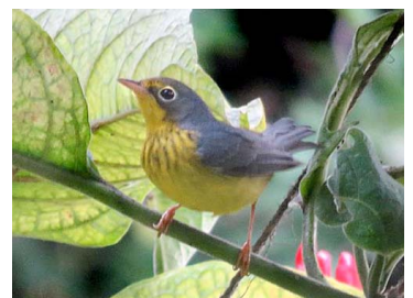
32 Cardellina canadensis PARULIDAE