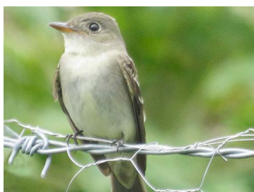
10 Contopus virens TYRANNIDAE