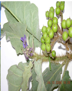
37 Solanum crinitipes SOLANACEAE