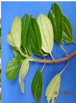
28 Peperomia fruticetorum PIPERACEAE