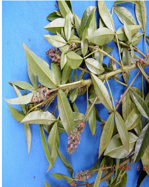
21 Otholobium mexicanum FABACEAE