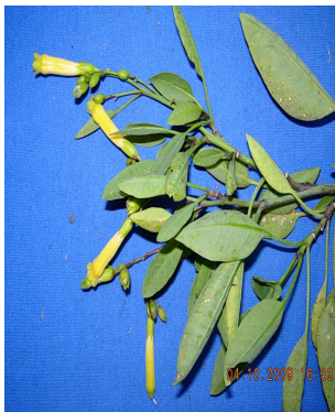
36 Nicotiana glauca SOLANACEAE