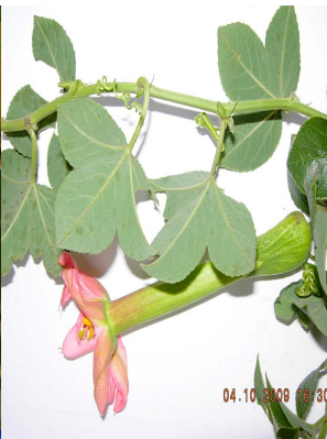
27 Passiflora mixta PASSIFLORACEAE