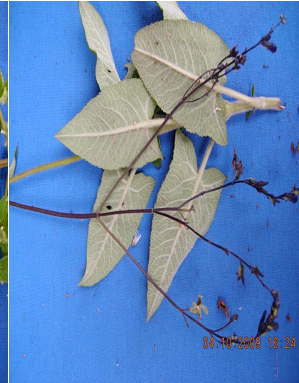
24 Salvia sagittata LAMIACEAE