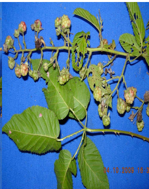
33 Rubus adenotrichos ROSACEAE