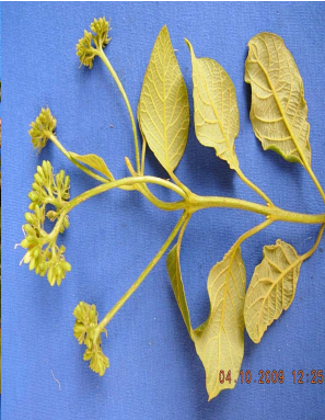
22 Aegiphila ferruginea LAMIACEAE