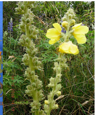
35 Verbascum phlomoides SCROPHULARIACEAE