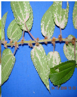
38 Phenax rugosus URTICACEAE