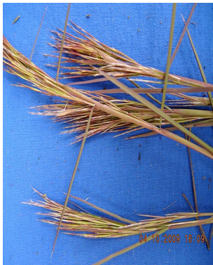
31 Schizachyrium condensatum POACEAE