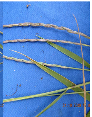
30 Elymus cordilleranus POACEAE