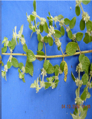
23 Minthostachys mollis LAMIACEAE