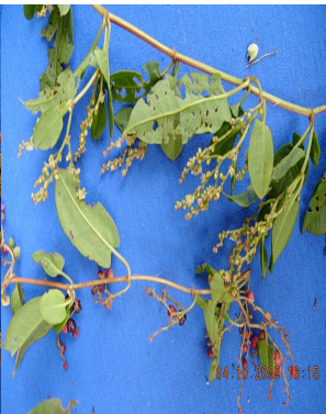
32 Muehlenbeckia tamnifolia POLYGONACEAE