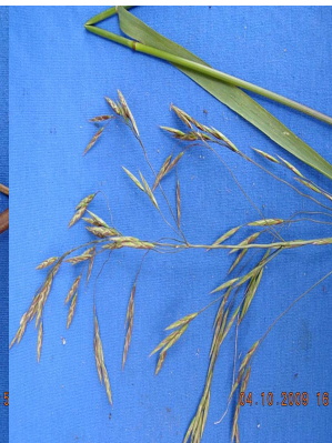
29 Bromus pitensis POACEAE