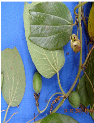
26 Passiflora alnifolia PASSIFLORACEAE