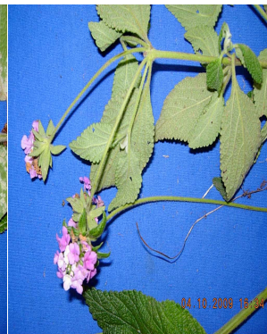
39 Lantana rugulosa VERBENACEAE