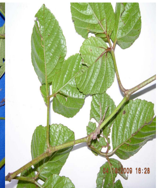
40 Cissus obliqua VITACEAE