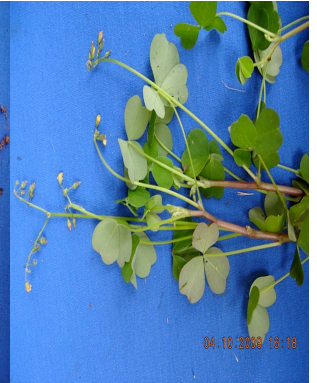
25 Oxalis spiralis OXALIDACEAE