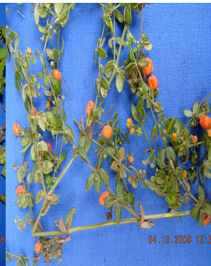
34 Galium hypocarpium RUBIACEAE