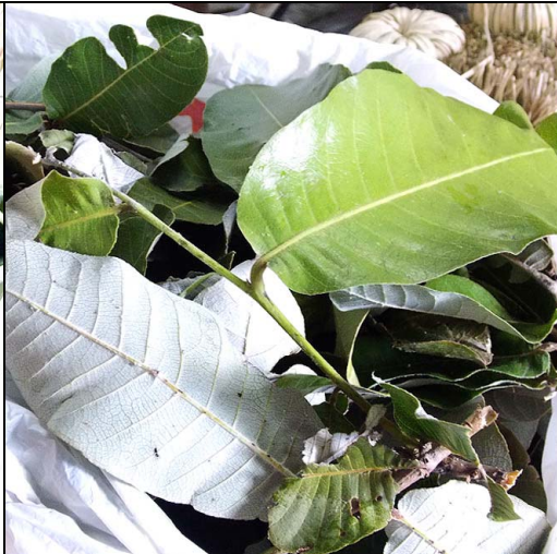
2 oitica CHRYSOBALANACEAE Licania rígida Benth.