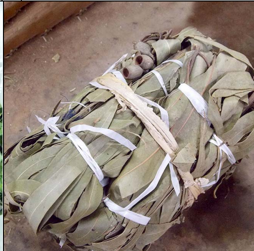
8 eucalipto MYRTACEAE Eucalyptus sp.