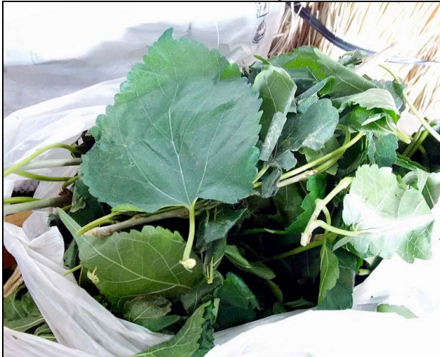
1 ameixa XIMENIACEAE Ximenia americana L.