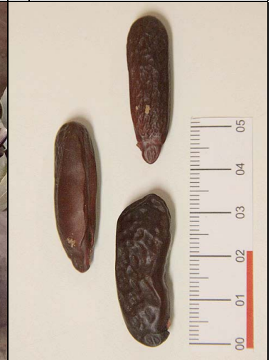
9 cumarú FABA Dipteryx odorata (Aubl.) Willd.