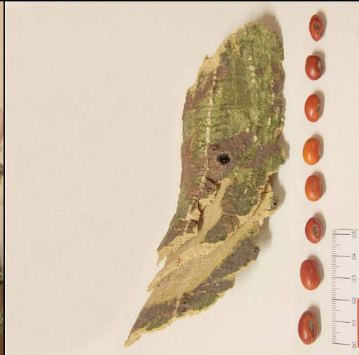
14 mulungu FABACEAE Erythrina velutina Willd.