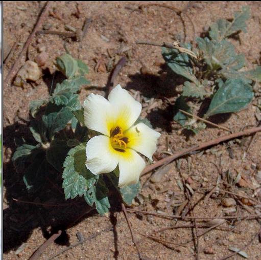
5 chanana PASSIFLORACEAE Turnera subulata Sm.