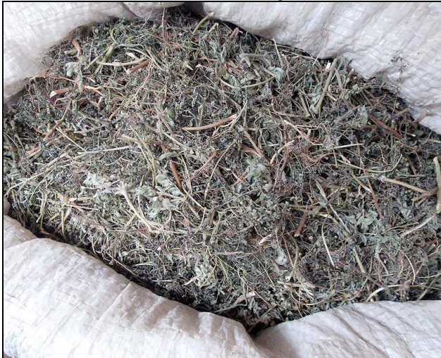
10 quebra-pedra PHYLLANTHACEAE Phyllanthus niruri L.