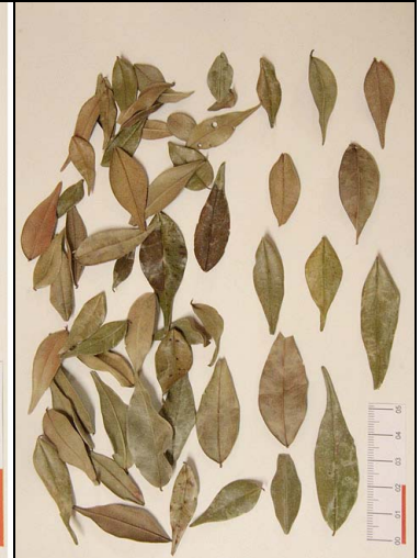
15 pedra-hume-cãa MYRT Myrcia silvatica (Barb.) Rodr.