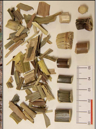
6 cana-do-brejo COST. Costus spiralis (Jacq.) Roscoe