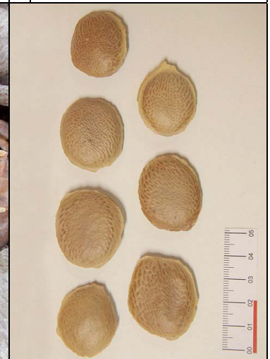
18 sucupira FABA Pterodon emarginatus Vogel