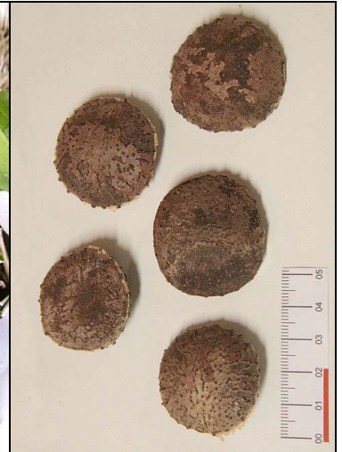
3 gindiroba CUCURB. Fevillea trilobata L.