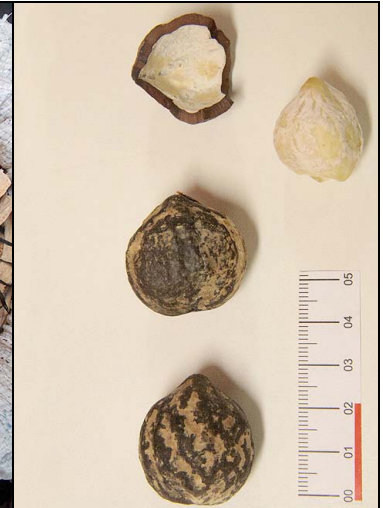
12 nogueira EUPH Aleurites moluccanus (L.) Willd.