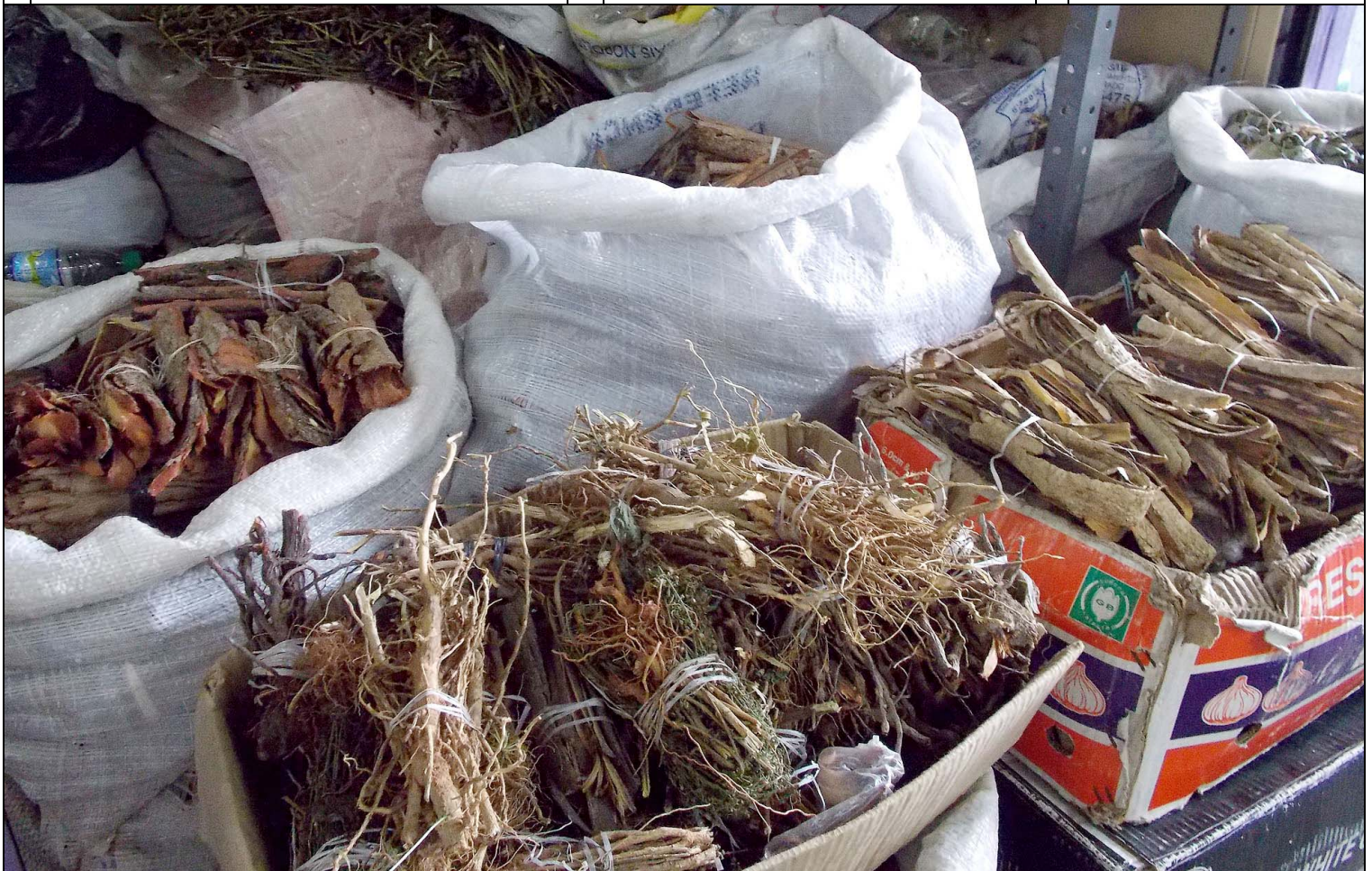
Plantas medicinais no Mercado Central Governador Adauto Bezerra