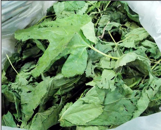
7 amora MORACEAE Morus nigra L.