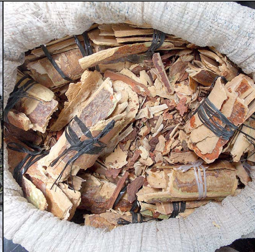
11 imburana-de-cheiro FABACEAE Amburana cearensis (Allemão) A.C.Sm