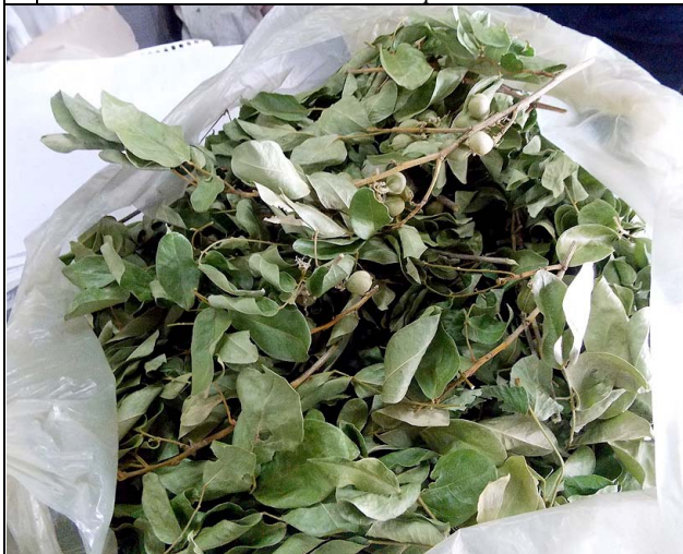
16 jaborandi FABACEAE Trischidium molle (Benth.) H.E.Ireland