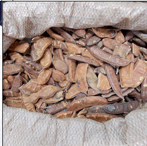
17 jucá FABACEAE Libidibia ferrea (Mart. ex Tul.) L.P. Queiroz