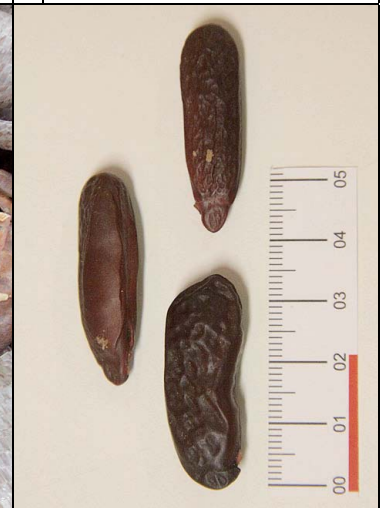
18 cumarú FABA Dipteryx odorata (Aubl.) Willd.