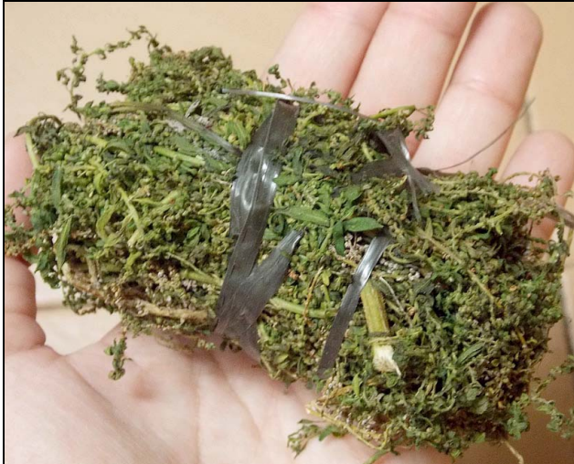
13 mastruz AMARANTHACEAE Chenopodium ambrosioides