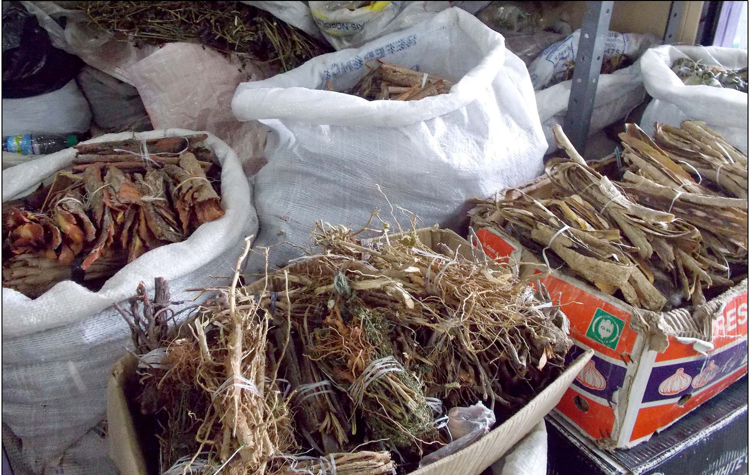
Plantas medicinais no Mercado Central Governador Adauto Bezerra