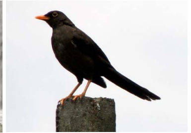
36 Turdus fuscater TURDIDAE