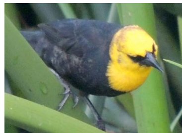
50 Chrysomus icterocephalus ♂ ICTERIDAE