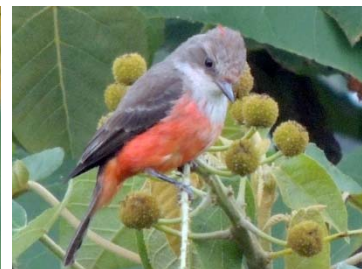
31 Pyrocephalus rubinus ♀ TYRANNIDAE