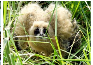
24 Pseudoscops clamator (polluelo) STRIGIDAE