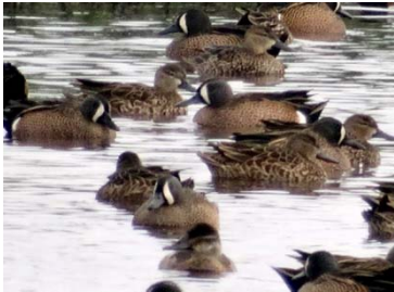
1 Anas discors ♂ ANATIDAE

El humedal Córdoba Itzata es uno de los ecosistemas de la EEP donde es evidente la apropiación de la comunidad y los esfuerzos por su conservación, en la actualidad dispone de un gran acervo genético representado en especies nativas, migratorias y exóticas de flora y fauna.