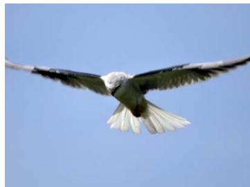
10 Elanus leucurus ACCIPITRIDAE