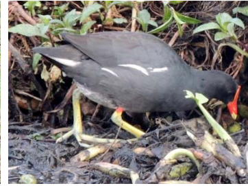
15 Gallinula galeata RALLIDAE