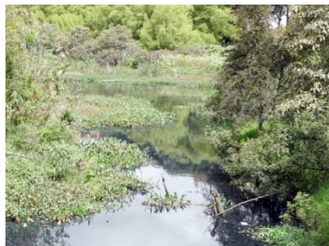
Humedal Cordoba TERCIO MEDIO