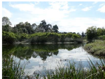
Humedal Cordoba TERCIO BAJO