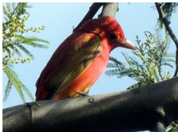
45 Piranga rubra (juvenil) ♂ CARDINALIDAE