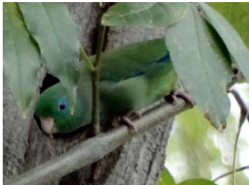
21 Forpus conspicillatus PSITTACIDAE