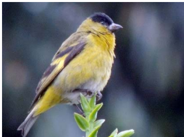
57 Sporaga spinescens FRINGILLIDAE