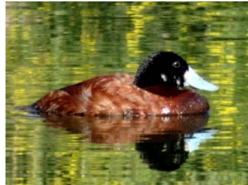
3 Oxyura jamaicensis ♂ ANATIDAE