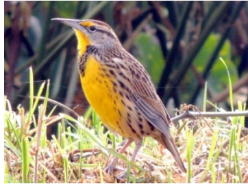
54 Sturnella magna ICTERIDAE