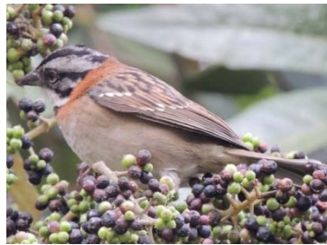
58 Zonotrichia capensis EMBERIZIDAE