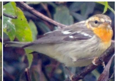
48 Setophaga fusca ♀ PARULIDAE