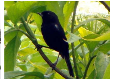
40 Diglossa humeralis THRAUPIDAE