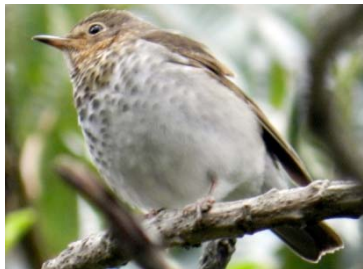
37 Catharus ustulatus TURDIDAE