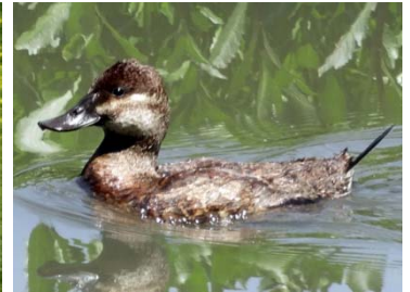
4 Oxyura jamaicensis ♀ ANATIDAE