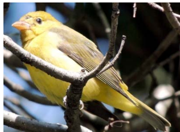
46 Piranga rubra ♀ CARDINALIDAE