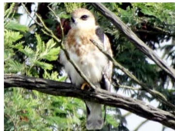
11 Elanus leucurus (juvenil) ACCIPITRIDAE