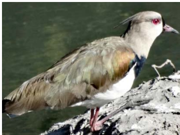
17 Vanellus chilensis CHARADRIIDAE