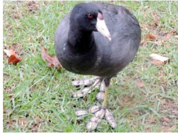
14 Fulica americana RALLIDAE