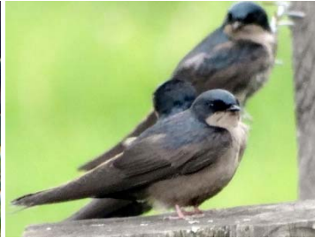
35 Notiochelidon murina HIRUNDINIDAE