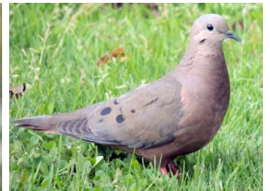
20 Zenaida auriculata COLUMBIDAE