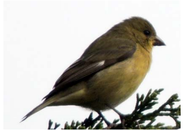
56 Astragalinus psaltria ♀ FRINGILLIDAE