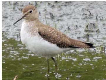
18 Tringa solitaria SCOLOPACIDAE