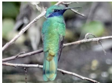
26 Colibri coruscans TROCHILIDAE