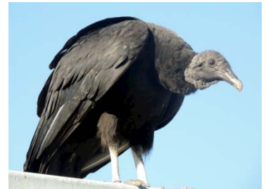
8 Coragyps atratus CATHARTIDAE