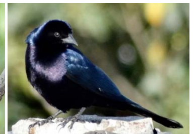
52 Molothrus bonariensis ♂ ICTERIDAE