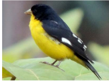
55 Astragalinus psaltria ♂ FRINGILLIDAE