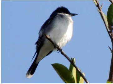
33 Tyrannus tyrannus TYRANNIDAE