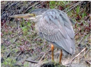
5 Butorides striata ARDEIDAE