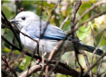
42 Thraupis episcopus CARDINALIDAE