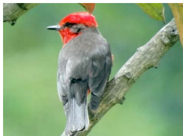
30 Pyrocephalus rubinus ♂ TYRANNIDAE