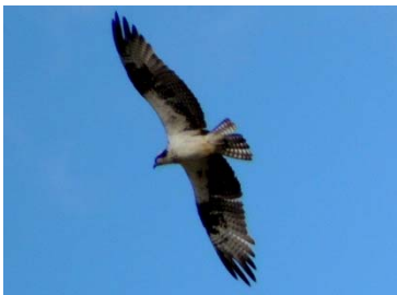
9 Pandion haliaetus PANDIONIDAE