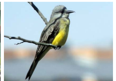
32 Tyrannus melancholicus TYRANNIDAE