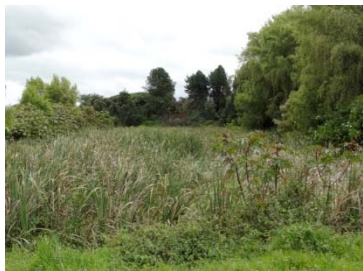
Humedal Cordoba TERCIO ALTO