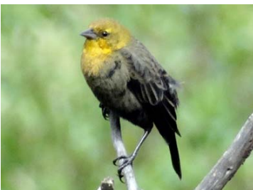
51 Chrysomus icterocephalus ♀ ICTERIDAE