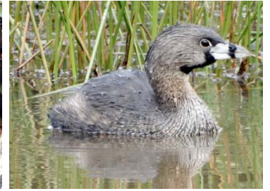
16 Podilymbus podiceps PODICIPEDIDAE