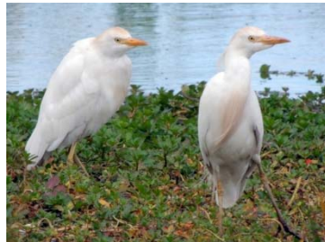
6 Bubulcus ibis ARDEIDAE