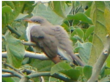
22 Coccyzus americanus CUCULIDAE