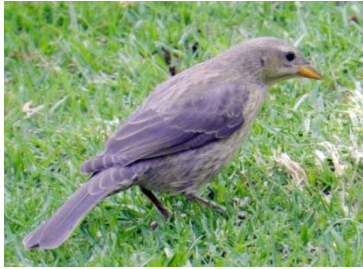
53 Molothrus bonariensis ♀ ICTERIDAE

Fotos de: Alejandro Pérez, César villamil, Alejandro Montañez. Producido por: A. Pérez, C. villamil, A. Montañez, con el apoyo de Jorge Enrique Morales UDFJC, © A. Pérez [alejandroperez@profesores.com], C. villamil, [emaushesed@yahoo.com] A. Montañez [M_jando@hotmail.com] Colectivo “Aves-tamiento en Humedales”. 636 versión 1 07/2014