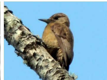
27 Picoides fumigatus PICIDAE