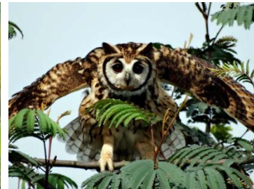
23 Pseudoscops clamator STRIGIDAE