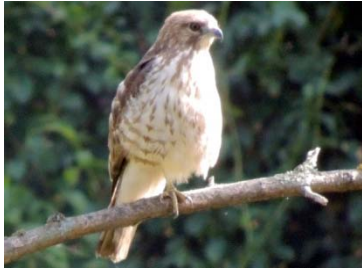
13 Buteo platypterus ACCIPITRIDAE

Fotos de: Alejandro Pérez, César villamil, Alejandro Montañez. Producido por: A. Pérez, C. villamil, A. Montañez, con el apoyo de Jorge Enrique Morales UDFJC, © A. Pérez [alejandroperez@profesores.com], C. villamil, [emaushesed@yahoo.com] A. Montañez [M_jando@hotmail.com] Colectivo “Aves-tamiento en Humedales”. 636 versión 1 07/2014