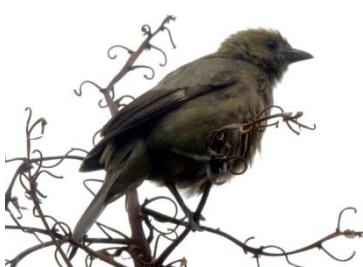
41 Thraupis palmarum THRAUPIDAE