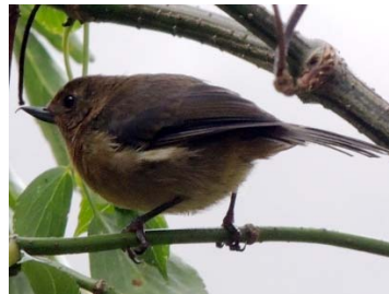
39 Diglossa albilatera THRAUPIDAE