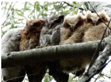
25 Otus choliba STRIGIDAE