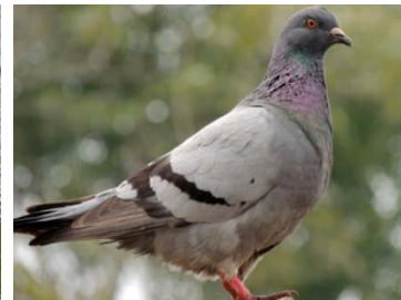
19 Columba livia COLUMBIDAE