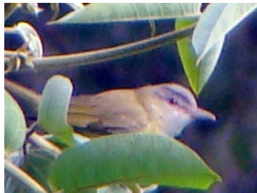
59 Vireo olivaceus VIREONIDAE