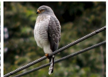
12 Rupornis magnirostris ACCIPITRIDAE