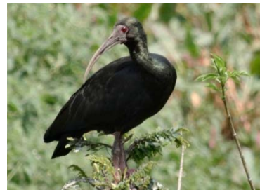
60 Phimosus infuscatus THRESKIORNITHIDAE