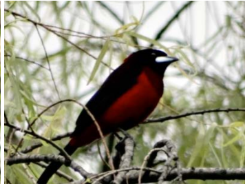
43 Ramphocelus dimidiatus THRAUPIDAE