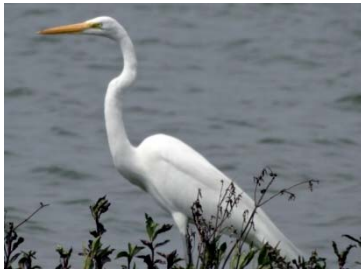
7 Ardea alba ARDEIDAE