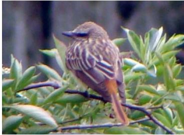
34 Myiodynastes luteiventris TYRANNIDAE