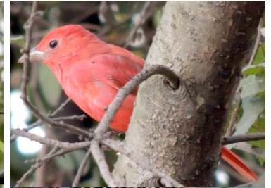
44 Piranga rubra ♂ CARDINALIDAE