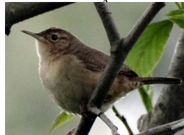
38 Troglodytes aedon TROGLODYTIDAE