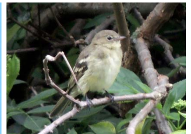
28 Elaenia frantzii TYRANNIDAE