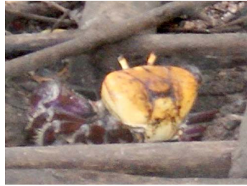
22 Ucides cordatus (Macho)