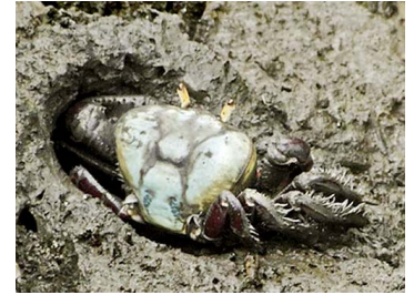
24 Ucides cordatus (Macho)