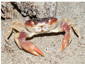
37 Gecarcinus lateralis (Macho)