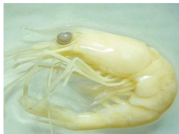
34 Macrobrachium faustum (Macho)