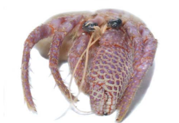
58 Coenobita sp. (Macho)