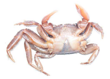
48 Pachygraspus sp.