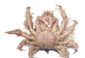
53 Microphrys cornutus