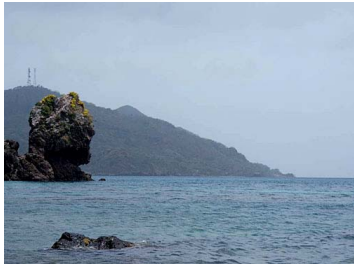
Cabeza de Morgan