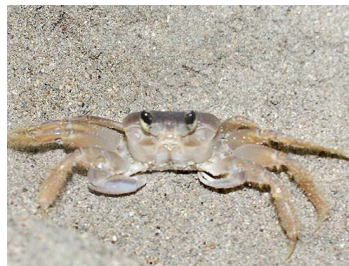
11 Occipodes cuadrata (Hembra)