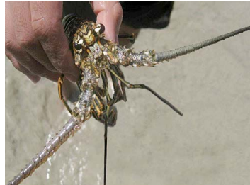
26 Panulirus argus (Macho)