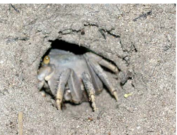
19 Cardisoma guanhumii (Hembra)