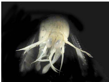
29 Neogonodactylus oerstedii