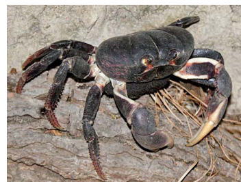
39 Gecarcinus ruricola (Hembra)