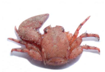
54 Petrolisthes jugosus