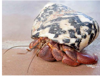
2 Coenobita sp. (Macho)