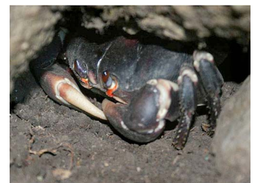
40 Gecarcinus ruricola (Hembra)