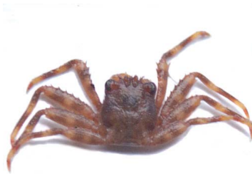
49 Sesarma sp.