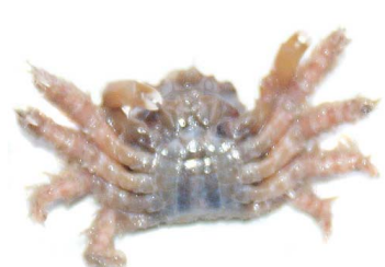
51 Mithraculus sculptus