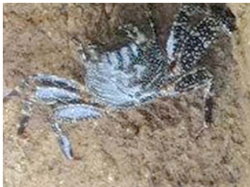
45 Pachygraspus gracilis