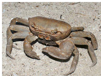
18 Cardisoma guanhumii (Hembra)