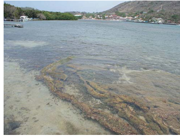
Litoral en Providencia