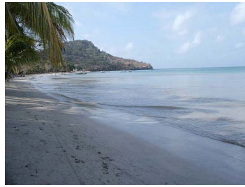
South beach, Providencia