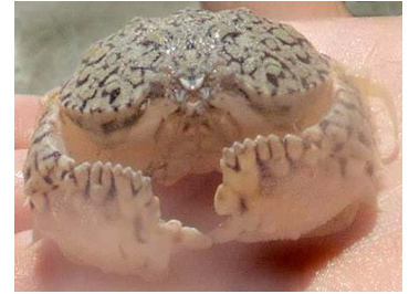
4 Calappa sp. (Macho)