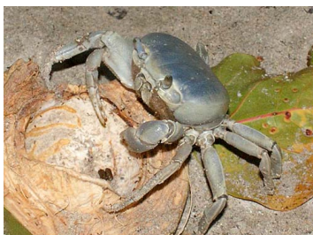
17 Cardisoma guanhumii (Hembra)