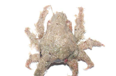
52 Microphrys cornutus