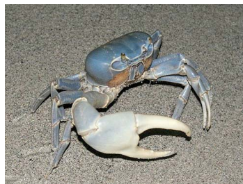
15 Cardisoma guanhumii (Macho)