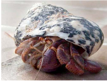
1 Coenobita sp. (Macho)