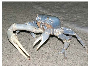
14 Cardisoma guanhumii (Macho)