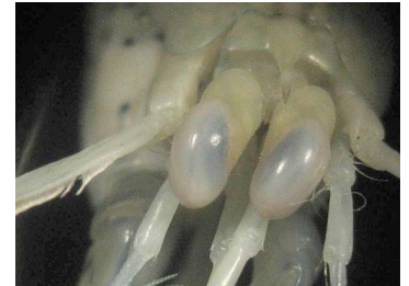
28 Neogonodactylus oerstedii