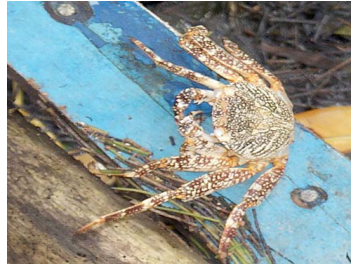
43 Grapsus grapsus (Hembra)