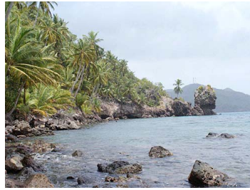
Litoral Santa Catalina