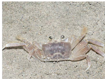
10 Occipodes cuadrata (Hembra)