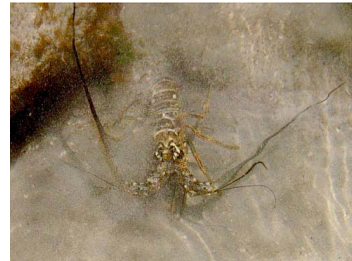
27 Panulirus argus (Macho)