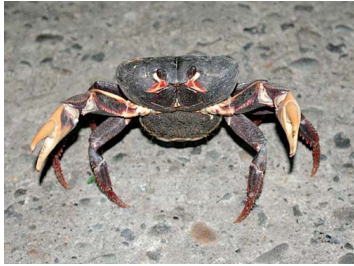
41 Gecarcinus ruricola (Hembra)