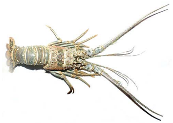
25 Panulirus argus (Macho)