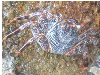
46 Grapsus sp.