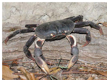
38 Gecarcinus ruricola (Hembra)