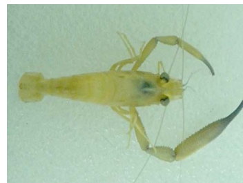
35 Macrobrachium faustum (Macho)