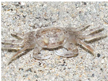
9 Occipodes cuadrata (Hembra)