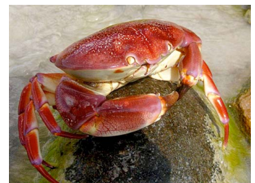
20 Carpilus corallinus (Macho)