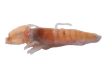
57 Alpheus sp.