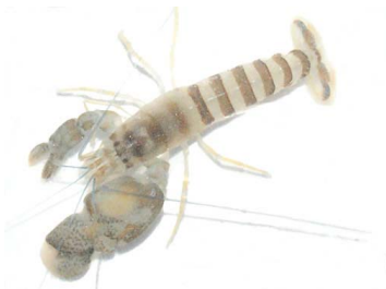
33 Alpheus sp. (Macho)