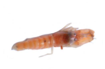
56 Alpheus sp.