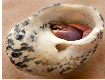
3 Coenobita sp. (Macho)