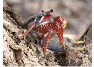
44 Grapsus grapsus (Hembra)