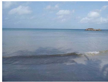
South beach, Providencia