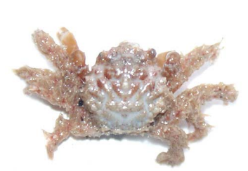
50 Mithraculus sculptus