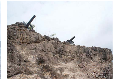
Fuerte de Morgan