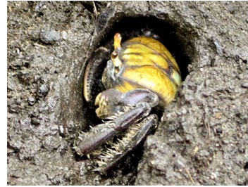
23 Ucides cordatus (Macho)