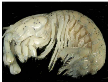
30 Neogonodactylus oerstedii