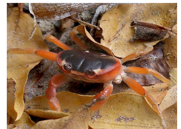
36 Gecarcinus lateralis (Macho)