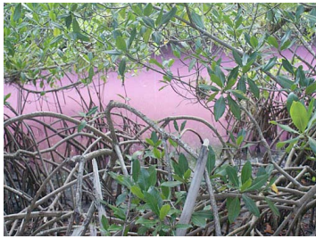
Zona de Mangle