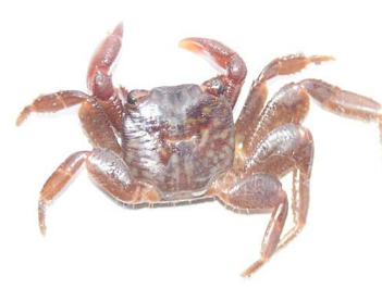
47 Pachygraspus sp.