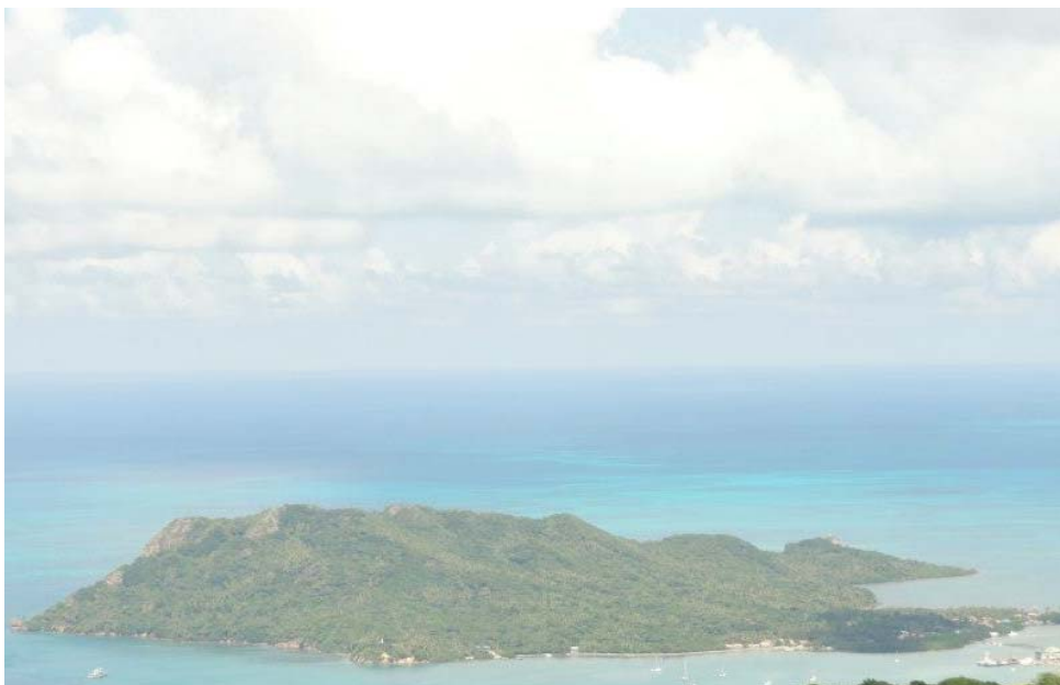
Isla de Santa Catalina Vista desde El PICO, formación geológica que se levanta en el corazón de Providencia.

A continuación se presenta una guía a color de la carcinofauna dulceacuícola, terrestre y litoral de las islas de Providencia y Santa Catalina. Las fotos fueron tomadas con la ayuda de una Cámara profesional Sony Alfa 300.