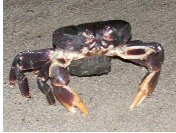
42 Grapsus grapsus (Hembra)