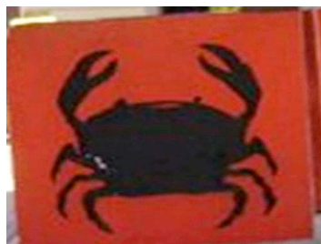
El cangrejo en los paraderos de Providencia