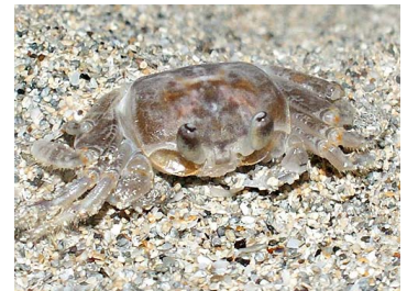
8 Occipodes cuadrata (Hembra)