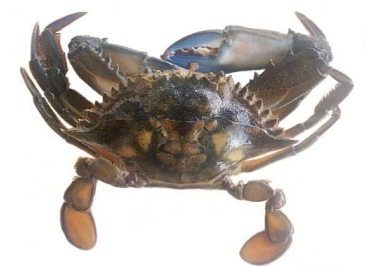
12 Callinectes similis (Macho)