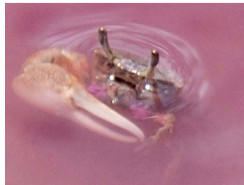
7 Uca sp. (Macho)