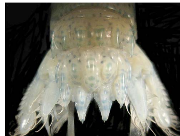
31 Neogonodactylus oerstedii