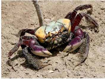
21 Ucides cordatus (Macho)