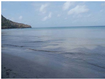
South beach, Providencia