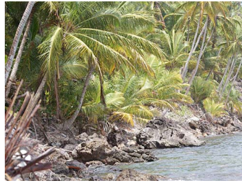
Litoral en Santa Catalina