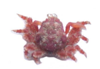
55 Macrocoeloma sp.