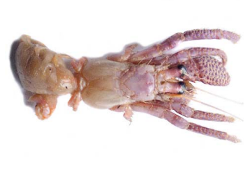
59 Coenobita sp. (Macho)