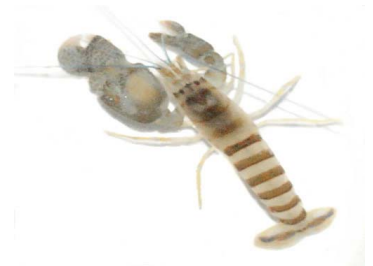
32 Alpheus sp. (Macho)