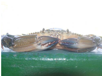
13 Callinectes similis (Macho)