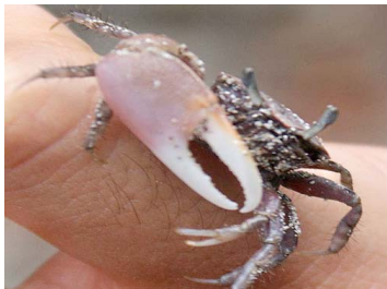
5 Uca sp. (Macho)