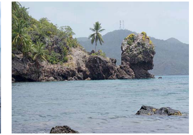
Cabeza de Morgan