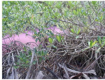
Zona de mangle