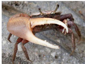
6 Uca sp. (Macho)