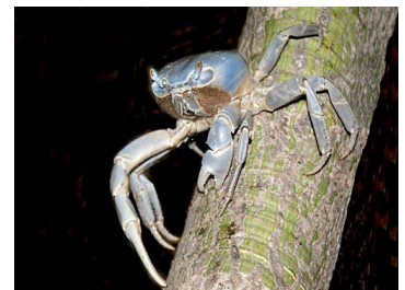
16 Cardisoma guanhumii (Macho)