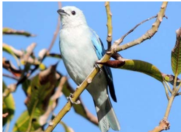
57 Thraupis episcopus THRAUPIDAE