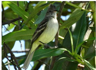
41 Elaenia flavogaster TYRANNIDAE