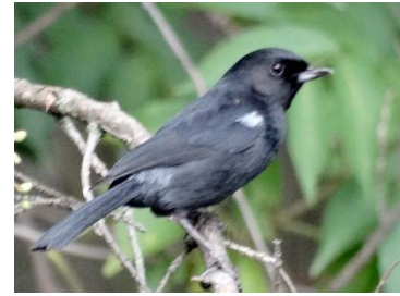
55 Diglossa humeralis THRAUPIDAE