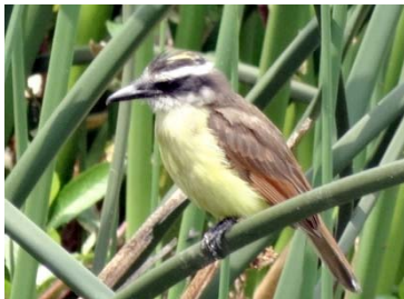
42 Pitangus sulphuratus TYRANNIDAE