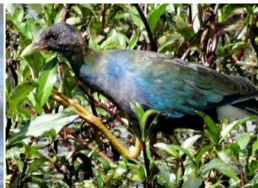
19 Porphyrio martinicus RALLIDAE