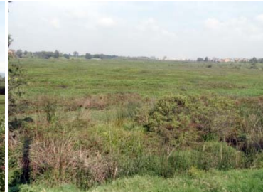
Humedal Juan Amarillo TERCIO BAJO