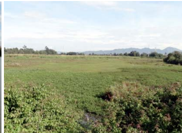
Humedal Juan Amarillo TERCIO MEDIO