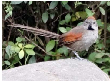
38 Synallaxis subpudica FURNARIIDAE