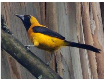
66 Icterus chrysater ICTERIDAE