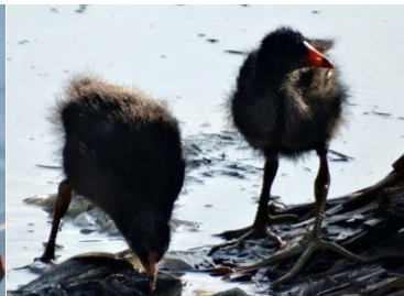
22 Gallinula galeata (polluelo) RALLIDAE