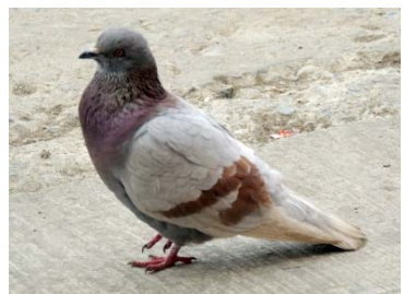
29 Columba livia COLUMBIDAE