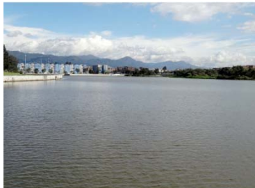
Humedal Juan Amarillo TERCIO ALTO