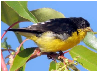
77 Astragalinus psaltria ♂ FRINGILLIDAE