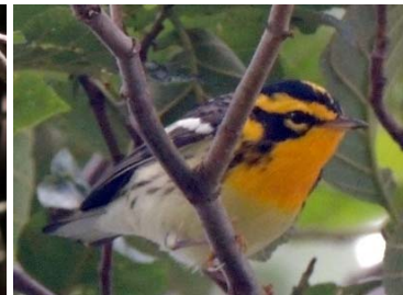
63 Setophaga fusca ♂ PARULIDAE