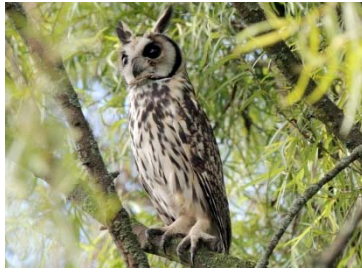
35 Pseudoscops clamator STRIGIDAE