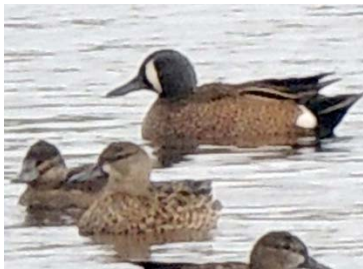
1 Anas discors ♂ ANATIDAE