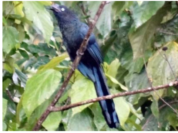
34 Crotophaga major CUCULIDAE