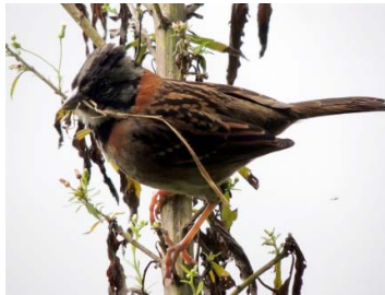
58 Zonotrichia capensis EMBERIZIDAE