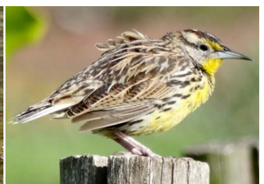
72 Sturnella magna ICTERIDAE