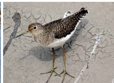
27 Tringa solitaria SCOLOPACIDAE