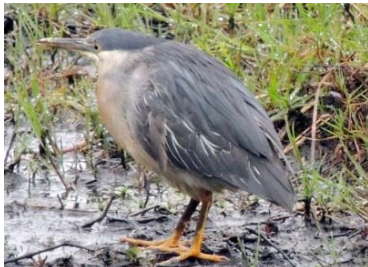
5 Butorides striata ARDEIDAE