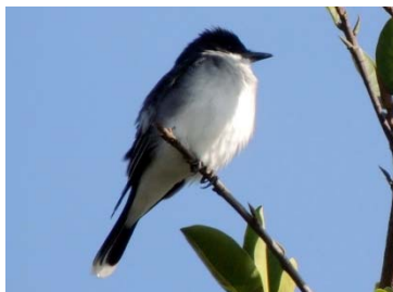
47 Tyrannus tyrannus TYRANNIDAE