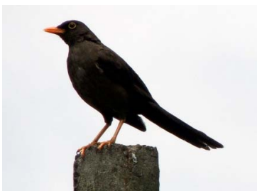
51 Turdus fuscater TURDIDAE