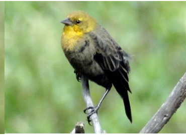
75 Chrysomus icterocephalus ♀ ICTERIDAE