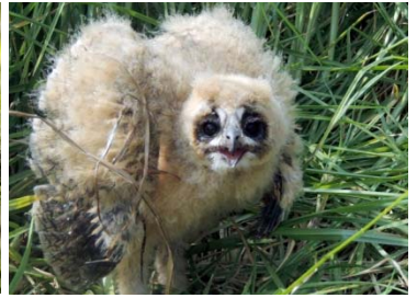
36 Pseudoscops clamator (polluelo) STRIGIDAE