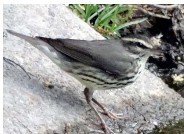
65 Parkesia noveboracensis PARULIDAE