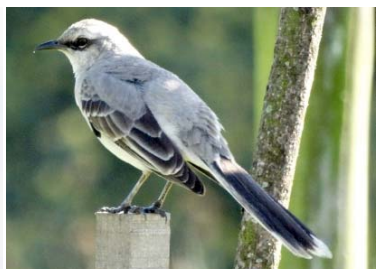
52 Mimus gilvus MIMIDAE