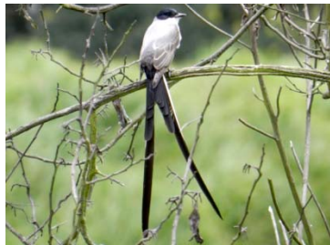
43 Tyrannus savana TYRANNIDAE