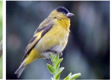
76 Sporaga spinescens FRINGILLIDAE