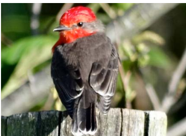
45 Pyrocephalus rubinus ♂ TYRANNIDAE