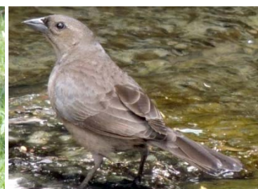
71 Molothrus bonariensis ♀ ICTERIDAE