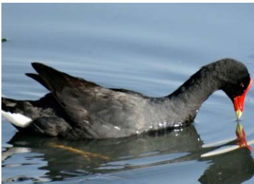
21 Gallinula galeata RALLIDAE