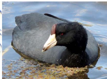
18 Fulica americana RALLIDAE