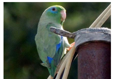
32 Forpus conspicillatus PSITTACIDAE