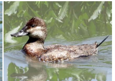
4 Oxyura jamaicensis ♀ ANATIDAE