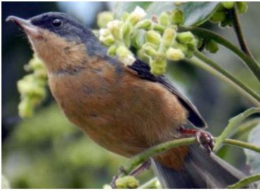
53 Diglossa sittoides THRAUPIDAE

Fotos de: Alejandro Pérez, César villamil, Alejandro Montañez. Producido por: A. Pérez, C. villamil, A. Montañez, con el apoyo de Jorge Enrique Morales UDFJC, © A. Pérez [alejandroperez@profesores.com], C. villamil, [emaushesed@yahoo.com] A. Montañez [M_jando@hotmail.com] Colectivo “Aves-tamiento en Humedales”. 623 versión 2 07/2014