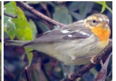
64 Setophaga fusca ♀ PARULIDAE