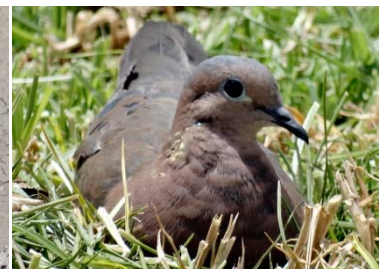
28 Zenaida auriculata COLUMBIDAE