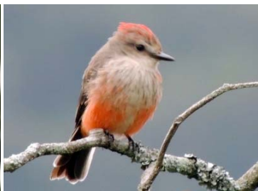
46 Pyrocephalus rubinus ♀ TYRANNIDAE