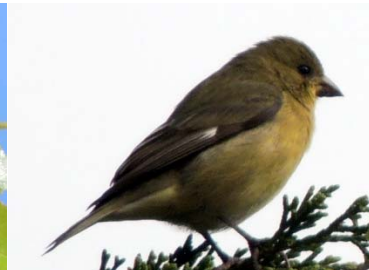
78 Astragalinus psaltria ♀ FRINGILLIDAE