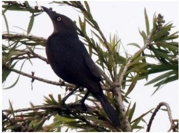
73 Quiscalus lugubris ICTERIDAE

Fotos de: Alejandro Pérez, César villamil, Alejandro Montañez. Producido por: A. Pérez, C. villamil, A. Montañez, con el apoyo de Jorge Enrique Morales UDFJC, © A. Pérez [alejandroperez@profesores.com], C. villamil, [emaushesed@yahoo.com] A. Montañez [M_jando@hotmail.com] Colectivo “Aves-tamiento en Humedales”. 623 versión 2 07/2014