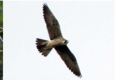
16 Falco peregrinus FALCONIDAE