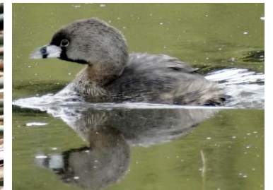
24 Podilymbus podiceps PODICIPEDIDAE