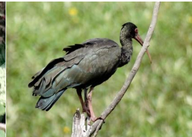
80 Phimosus infuscatus THRESKIORNITHIDAE