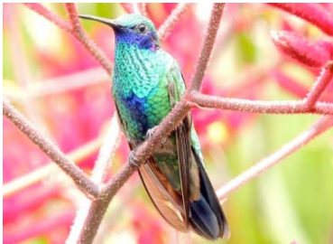
37 Colibri coruscans TROCHILIDAE