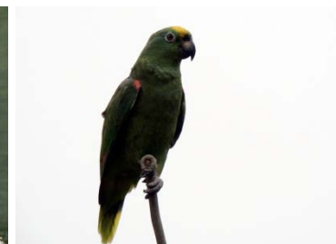
31 Amazona ochrocephala PSITTACIDAE