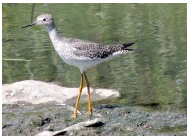
25 Tringa flavipes SCOLOPACIDAE