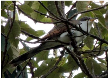
33 Coccyzus americanus CUCULIDAE

Producido por: A. Pérez, C. villamil, A. Montañez, con el apoyo de Jorge Enrique Morales UDFJC, © A. Pérez [alejandroperez@profesores.com], C. villamil, [emaushesed@yahoo.com] A. Montañez [M_jando@hotmail.com] Colectivo “Aves-tamiento en Humedales”. 623 versión 2 07/2014