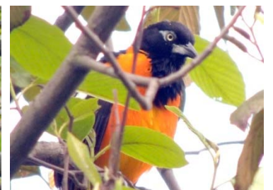
68 Icterus icterus ICTERIDAE