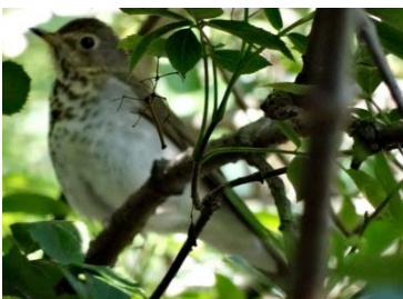
50 Catharus ustulatus TURDIDAE