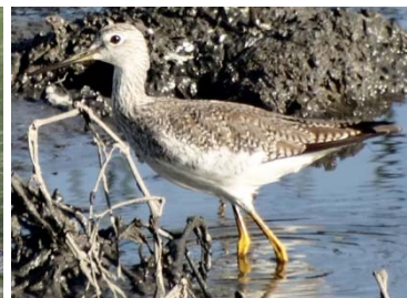
26 Tringa melanoleuca SCOLOPACIDAE