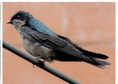
48 Notiochelidon murina HIRUNDINIDAE