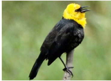
74 Chrysomus icterocephalus ♂ ICTERIDAE