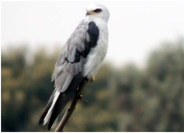
13 Elanus leucurus ACCIPITRIDAE

Fotos de: Alejandro Pérez, César villamil, Alejandro Montañez. Producido por: A. Pérez, C. villamil, A. Montañez, con el apoyo de Jorge Enrique Morales UDFJC, © A. Pérez [alejandroperez@profesores.com], C. villamil, [emaushesed@yahoo.com] A. Montañez [M_jando@hotmail.com] Colectivo “Aves-tamiento en Humedales”. 623 versión 2 07/2014