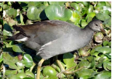
20 Porphyrio martinicus (juvenil) RALLIDAE