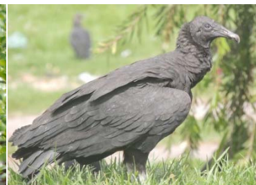
11 Coragyps atratus CATHARTIDAE