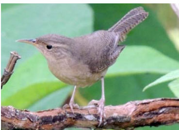
49 Troglodytes aedon TROGLODYTIDAE