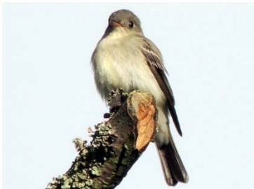
39 Empidonax virescens (frontal) TYRANNIDAE