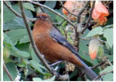
56 Conirostrum rufum THRAUPIDAE