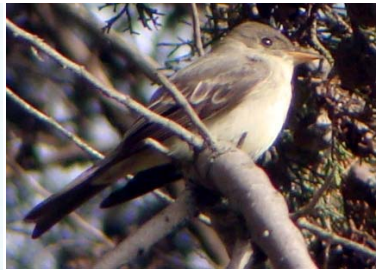
40 Empidonax virescens (lateral) TYRANNIDAE