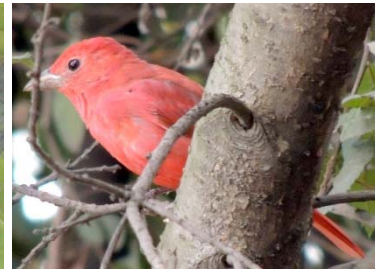
60 Piranga rubra ♂ CARDINALIDAE