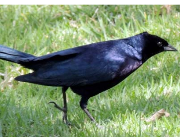
70 Molothrus bonariensis ♂ ICTERIDAE