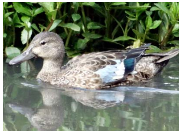
2 Anas discors ♀ ANATIDAE