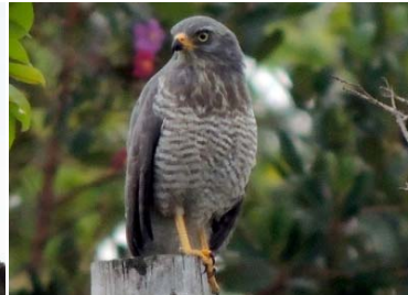
15 Rupornis magnirostris ACCIPITRIDAE