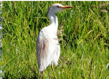
7 Bubulcus ibis ARDEIDAE