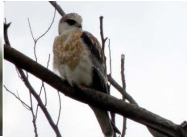
14 Elanus leucurus (juvenil) ACCIPITRIDAE