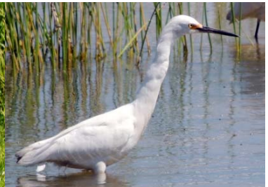
8 Ardea alba ARDEIDAE