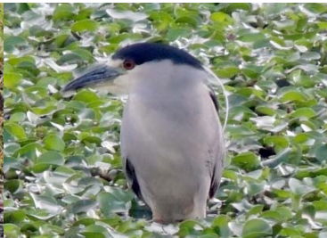
6 Nycticorax nycticorax ARDEIDAE