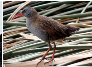
23 Rallus semiplumbeus RALLIDAE