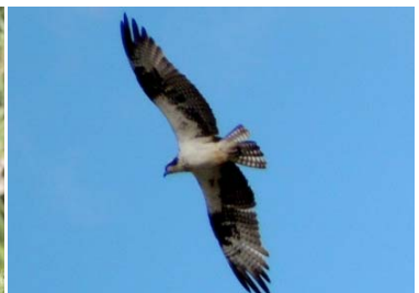
12 Pandion haliaetus PANDIONIDAE