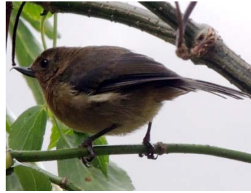
54 Diglossa albilatera THRAUPIDAE