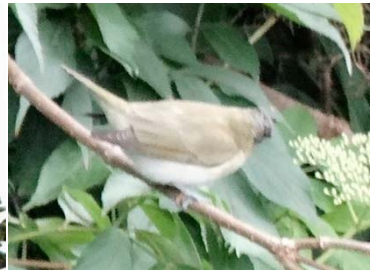
79 Vireo olivaceus VIREONIDAE