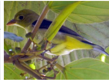
59 Piranga olivacea ♀ CARDINALIDAE