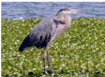
9 Ardea herodias ARDEIDAE