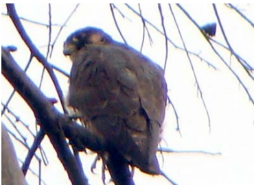
17 Falco deiroleucus FALCONIDAE