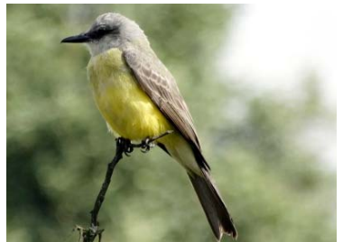
44 Tyrannus melancholicus TYRANNIDAE