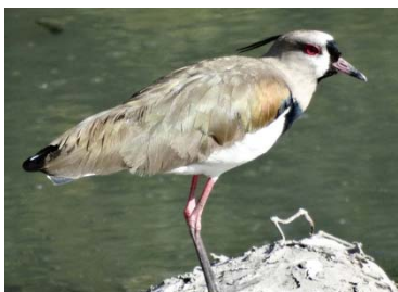
30 Vanellus chilensis CHARADRIIDAE