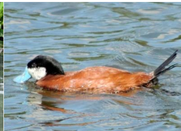
3 Oxyura jamaicensis ♂ ANATIDAE