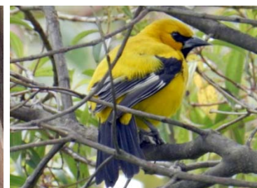
67 Icterus nigrogularis ICTERIDAE