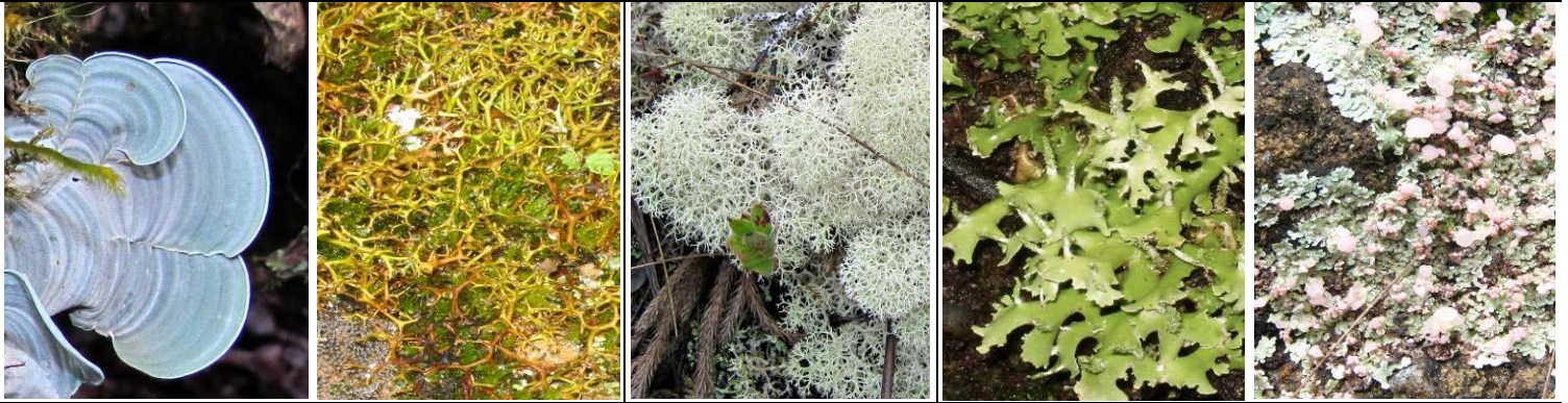
1 ATHELIACEAE Cora pavonia 2 CLADONIACEAE Cladia aggregata 3 CLADONIACEAE Cladina arbuscula 4 CLADONIACEAE Cladonia ceratophylla 5 BAEOMYCETACEAE Phyllobaeis sp.