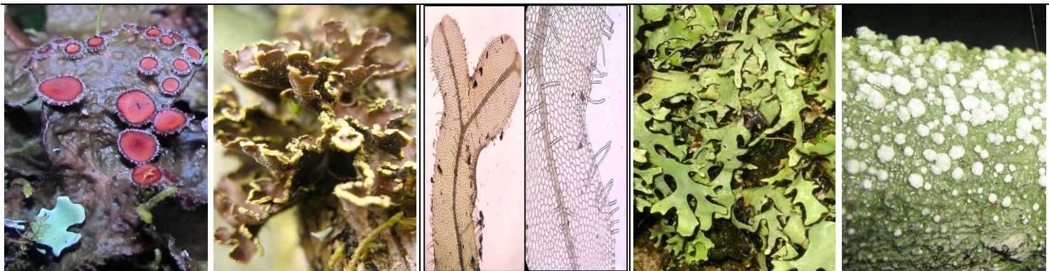
21 LOBARIACEAE Sticta hirta 22 LOBARIACEAE Pseudocyphellaria crocata 23 MEZGERIACEAE Metzgeria sp. 24 PARMELIACEAE Hypotrachyna sp. 25 PERTUSARIACEAE Pertusaria sp.