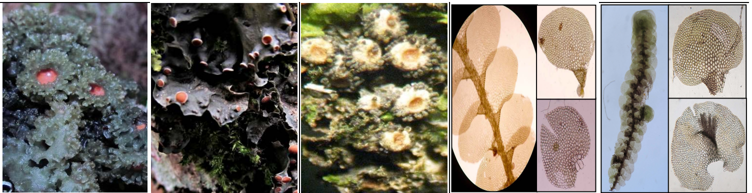
6 COLLEMATACEAE Leptogium phyllocarpum 7 COLLEMATACEAE Leptogium azureum 8 COLLEMATACEAE Leptogium submarginellum 9 JUBULACEAE Fullania sp. 10 JUBULACEAE Frullania bogotensis