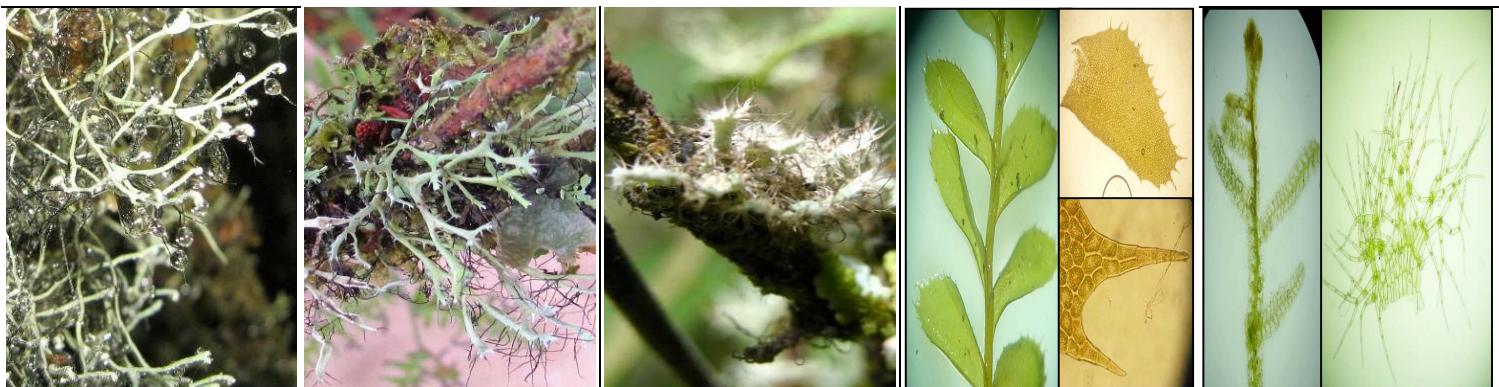
26 PHYSCIACEAE Heterodermia circinalis 27 PHYSCIACEAE Heterodermia leucomela 28 PHYSCIACEAE Heterodermia comosa 29 PLAGIOCHILACEAE Plagiochila longispina 30 TRICHOCOLEACEAE Trichocolea tomentosa