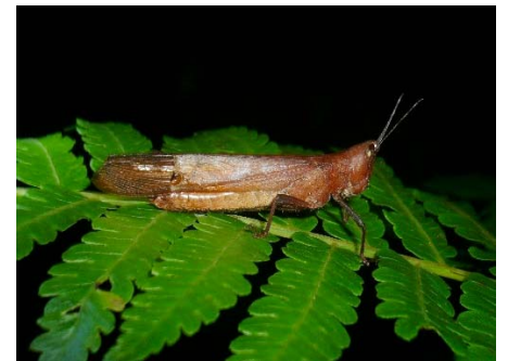
Phaeoparia tingomariae (female)