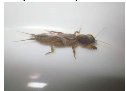
Neocurtillahexadactyla Gryllotalpidae: Gryllotalpinae