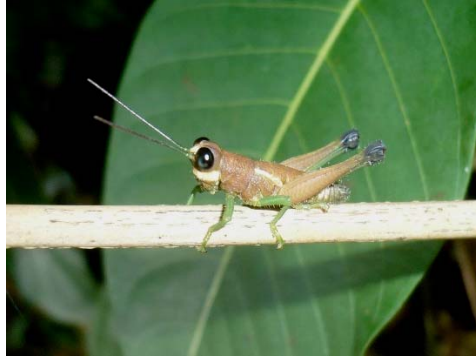
Tingomariacris luteiceps (male) Acrididae: Ommatolampidinae