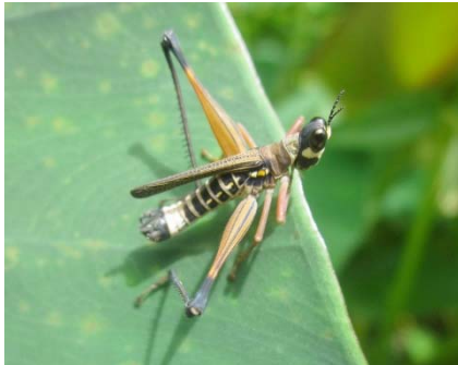
Pseudomastax cf. carlosi Eumastacidae: Pseudomastacinae