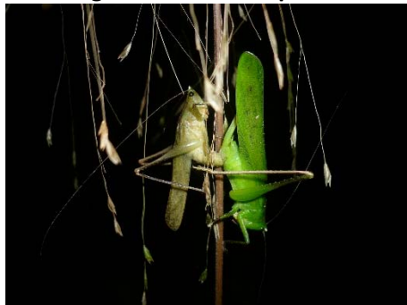
Neoconocephalus sp. 2.