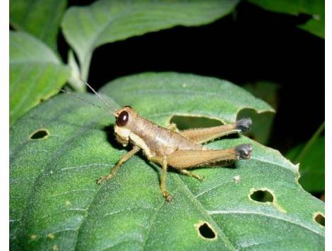
Tingomariacris luteiceps (female) Acrididae: Ommatolampidinae