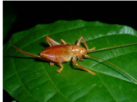
Brachybaenus bimucronatus Gryllacrididae: Gryllacridinae