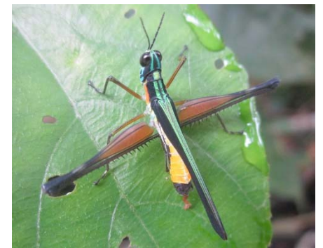
Paramastax nigra Eumastacidae: Paramastacinae