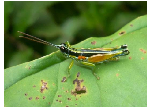
Stenopola puncticeps cf. amazonica