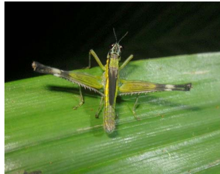
Eumastax sp. Eumastacidae: Eumastacinae