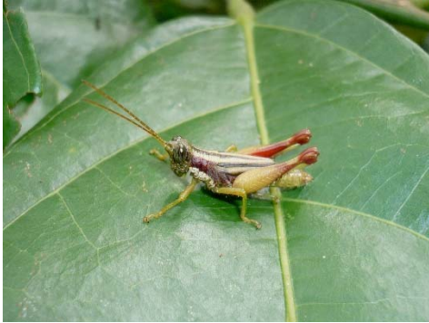
Syntomacris sp. Acrididae: Ommatolampidinae