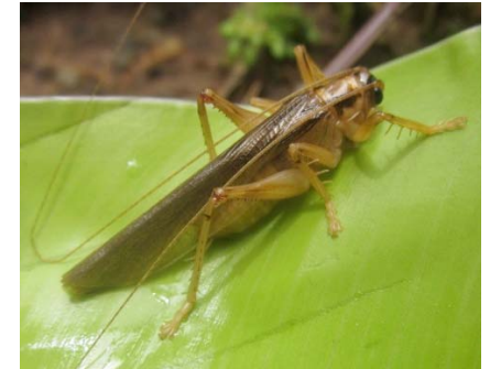
Dibelona sp. Gryllacrididae: Gryllacridinae