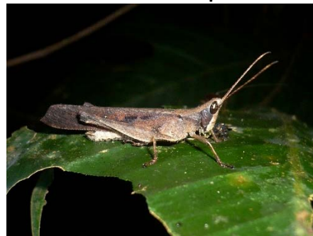
Phaeoparia tingomariae (male)