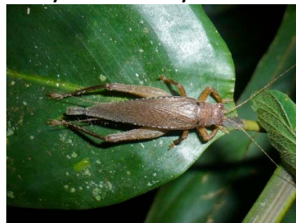
Aphonomorphus sp. Gryllidae: Podoscirtinae