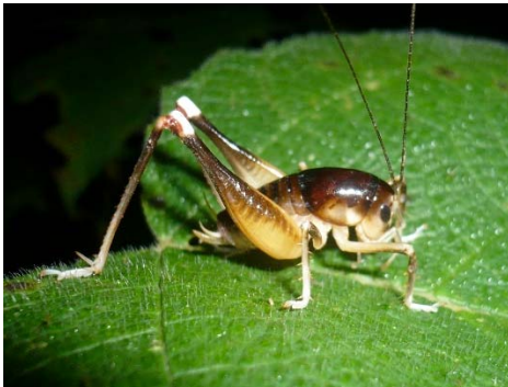
Apotetamenus amazonae Anostostomatidae: Lutosinae