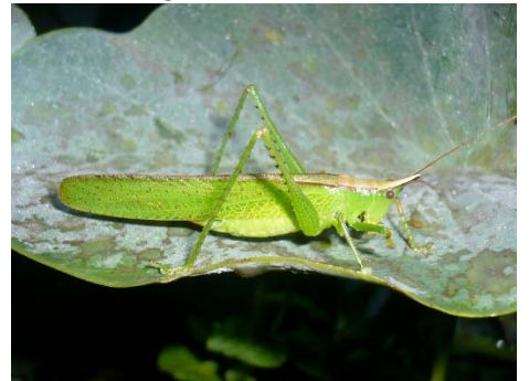
Neoconocephalus sp. 1.