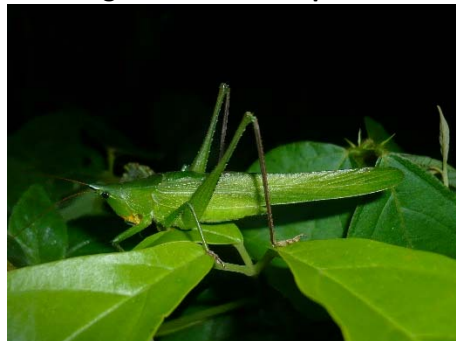
Neoconocephalus sp. 3.