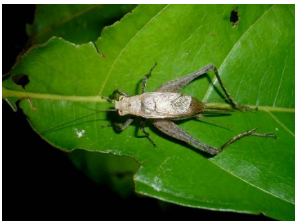
Eneoptera surinamensis Gryllidae: Eneopterinae