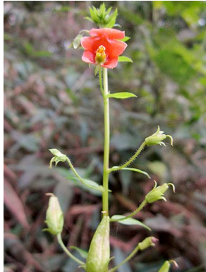
52 Alonsoa meridionalis SCROPHULARIACEAE cascabelito