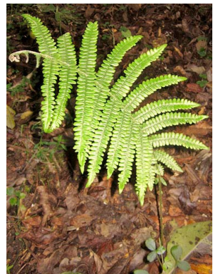
60 Thelypteris sp. THELYPTERIDACEAE helecho