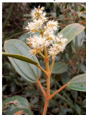
29 Miconia biappendiculata MELASTOMATACEAE sietecucos