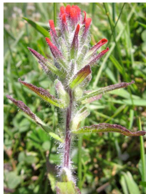
39 Castilleja arvensis OROBANCHACEAE peona, venadillo