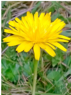
13 Taraxacum officinale ASTERACEAE diente de león