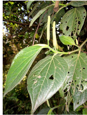
44 Piper bogotense PIPERACEAE cordoncillo