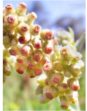
5 Achyrocline satureioides ASTERACEAE yerba de chivo, viravira