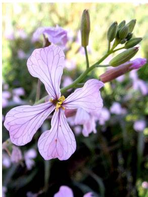
16 Moricandia arvensis BRASSICACEAE