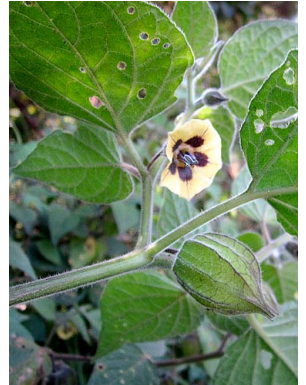
55 Physalis peruviana SOLANACEAE uchuva