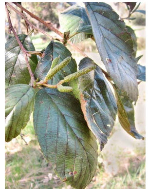
15 Alnus acuminata BETULACEAE aliso