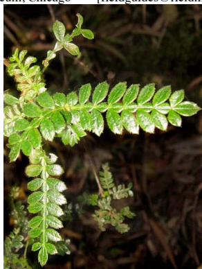
22 Weinmannia tomentosa CUNONIACEAE encenillo