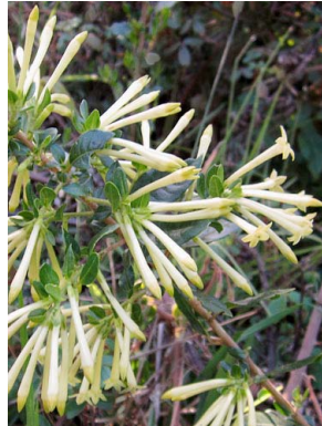
53 Cestrum buxifolium SOLANACEAE uvilla