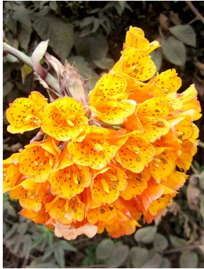
1 Bomarea multiflora ALSTROEMERIACEAE pecosa, rompeplatos