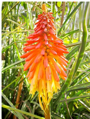
57 Kniphofia uvaria XANTHORRHOEACEAE llamitas