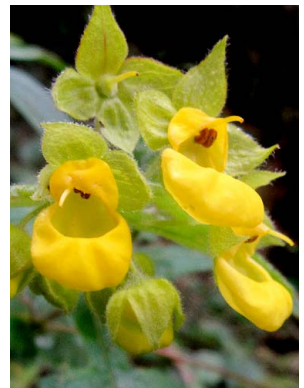
20 Calceolaria foliolata CALCEOLARIACEAE cerrielito