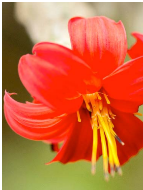
12 Mutisia orbignyana ASTERACEAE clavellino