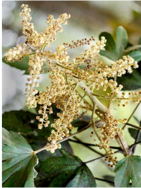
2 Oreopanax incisus ARALIACEAE mano de oso