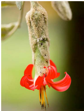
11 Mutisia orbignyana ASTERACEAE clavellino