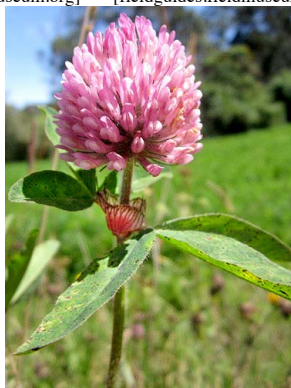
23 Trifolium pratense FABACEAE trébol rojo, carretón