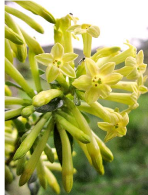
54 Cestrum buxifolium SOLANACEAE uvilla