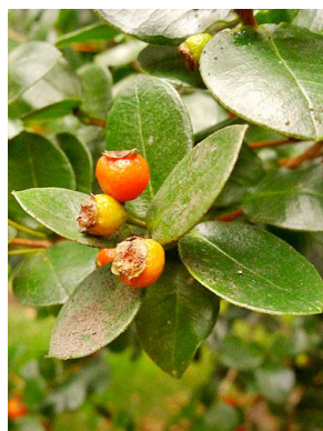
30 Myrcianthes leucoxylla MYRTACEAE arrayán