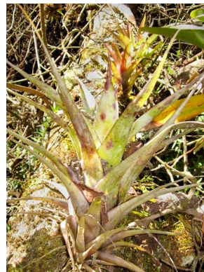
19 Tillandsia fendleri BROMELIACEAE quiche