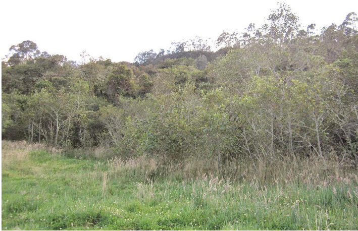
Bosque fragmentado con Vegetación secundaria