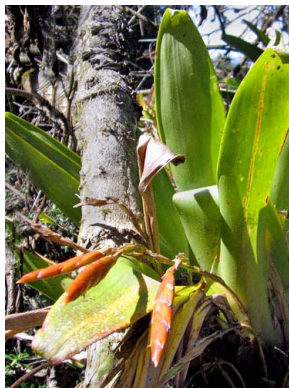
18 Tillandsia complanata BROMELIACEAE