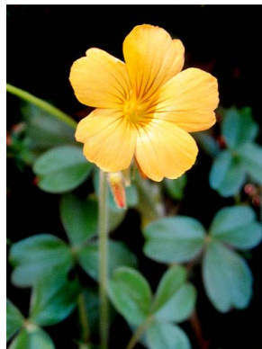
40 Oxalis medicaginea OXALIDACEAE acedera, chulco