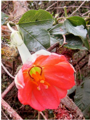
41 Passiflora mixta PASSIFLORACEAE curuba de indio

© José A. Muñoz [jamunozd@correo.udistrital.edu.co] y Claudia P. Ortiz Parra [claus127@gmail.com]. Ingeniería Ambiental, Facultad del Medio Ambiente y Recursos Naturales, UDFJC. © Science & Education, The Field Museum, Chicago [fieldguides@fieldmuseum.org] [fieldguides.fieldmuseum.org] Rapid Color Guide # 589 versión 1 05/2015