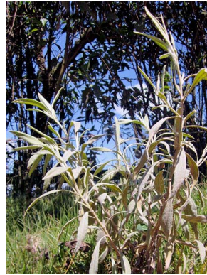
4 Achyrocline satureioides ASTERACEAE yerba de chivo, viravira