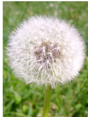
14 Taraxacum officinale ASTERACEAE diente de león