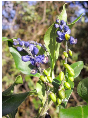
48 Monnina aestuans POLYGALACEAE tintillo