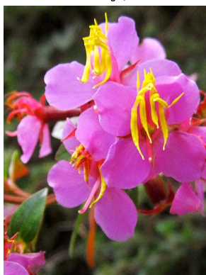
28 Bucquetia glutinosa MELASTOMATACEAE charne, saltón