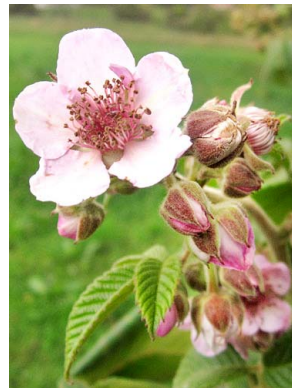
49 Rubus bogotensis ROSACEAE zarzamora