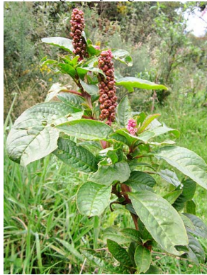
42 Phytolacca bogotensis PHYTOLACCACEAE hierba de culebra