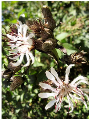
8 Barnadesia spinosa ASTERACEAE guasco, espino