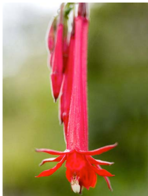
32 Fuchsia boliviana ONAGRACEAE platanito, cigarrillito