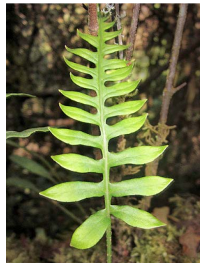
59 Serpocaulon sp. POLYPODIACEAE helecho