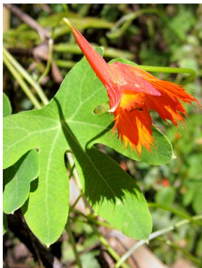
56 Tropaeolum smithii TROPAEOLACEAE papasitas