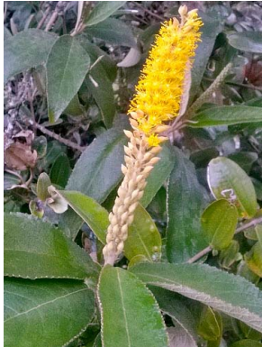
51 Abatia parviflora SALICACEAE duraznillo, velitas