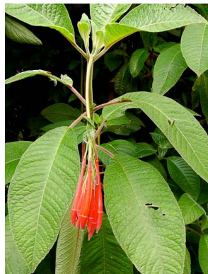
31 Fuchsia boliviana ONAGRACEAE platanito, cigarrillito