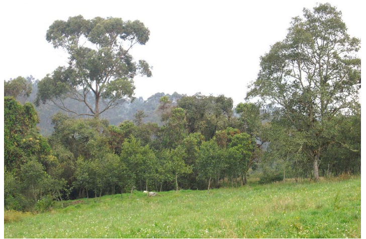
Vegetación Secundaria Baja