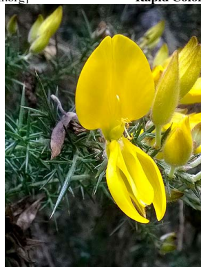
24 Ulex europaeus FABACEAE retamo espinoso