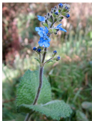
26 Salvia palifolia LAMIACEAE salvia