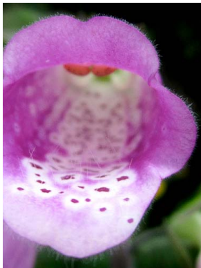
46 Digitalis purpurea PLANTAGINACEAE