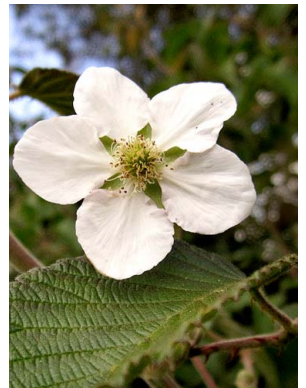
50 Rubus floribundus ROSACEAE mora