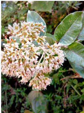
7 Ageratina tinifolia ASTERACEAE amargoso