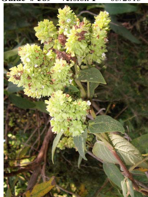
25 Lepechinia conferta LAMIACEAE