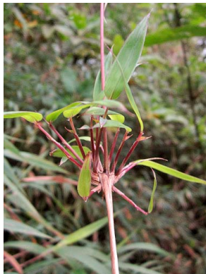
47 Chusquea tassellata cf. POACEAE chusque