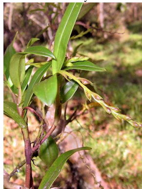
35 Epidendrum sp. ORCHIDACEAE