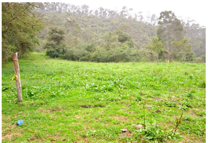
Mosaico de Cultivos, Pastos y Espacios Naturales