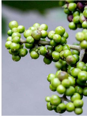
3 Oreopanax incisus ARALIACEAE mano de oso