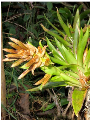
17 Tillandsia biflora BROMELIACEAE