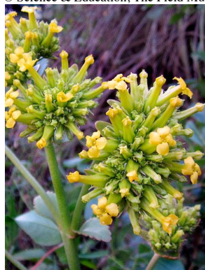
21 Kalanchoe blossfeldiana CRASSULACEAE

© José A. Muñoz [jamunozd@correo.udistrital.edu.co] y Claudia P. Ortiz Parra [claus127@gmail.com]. Ingeniería Ambiental, Facultad del Medio Ambiente y Recursos Naturales, UDFJC. © Science & Education, The Field Museum, Chicago [fieldguides@fieldmuseum.org] [fieldguides.fieldmuseum.org] Rapid Color Guide # 589 versión 1 05/2015