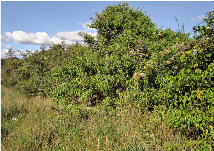
Bosque Ripario Intervenido