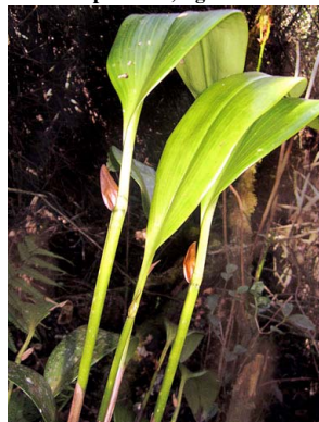
36 Pleurothallis sp. ORCHIDACEAE