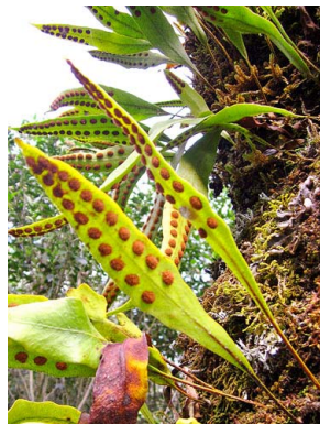
58 Pleopeltis macrocarpa POLYPODIACEAE calaguala