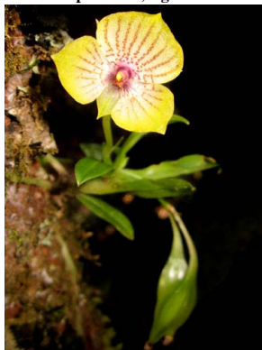
38 Telipogon antioquiensis ORCHIDACEAE