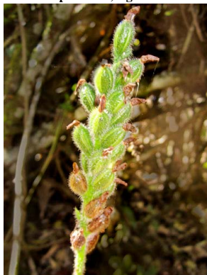
37 Ponthieva similis ORCHIDACEAE