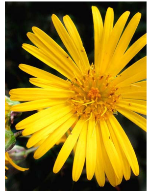
10 Munnozia senecionidis ASTERACEAE camargo