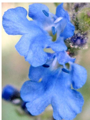
27 Salvia palifolia LAMIACEAE salvia