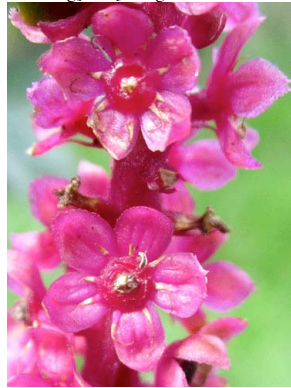
43 Phytolacca bogotensis PHYTOLACCACEAE hierba de culebra