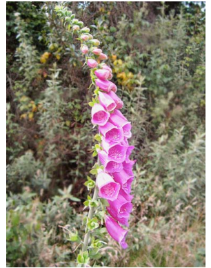
45 Digitalis purpurea PLANTAGINACEAE dedalera, guergüerón