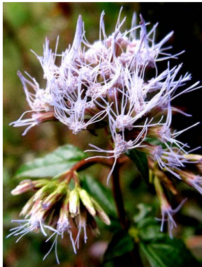
6 Ageratina gracilis ASTERACEAE amargoso