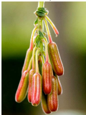
33 Fuchsia boliviana ONAGRACEAE platanito, cigarrillito