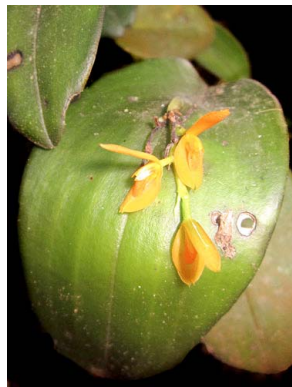
34 Acianthera casapensis ORCHIDACEAE