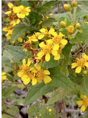
3 Calea clematidea ASTERACEAE