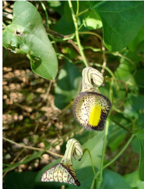
1 Aristolochia triangularis ARISTOLOCHIACEAE

© Science and Education, The Field Museum, Chicago. [fieldguides@fieldmuseum.org] [http://fieldguides.fieldmuseum.org/guides] Rapid Color Guide # 587 versión 1 03/2015