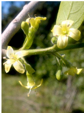
13 Aegiphila brachiata LAMIACEAE