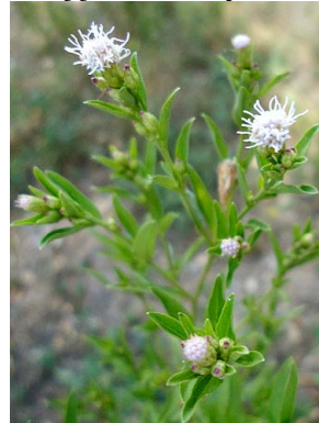
4 Eupatorium ivifolium ASTERACEAE