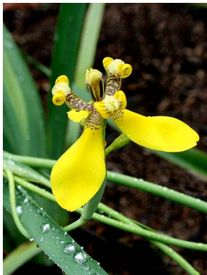
12 Trimezia spathata IRIDACEAE