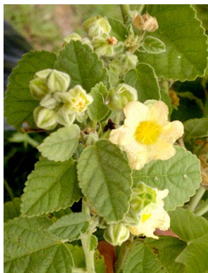
16 Sida cordifolia MALVACEAE