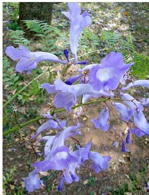
6 Jacaranda mimosifolia BIGNONIACEAE