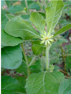
2 Acanthospermum hispidum ASTERACEAE