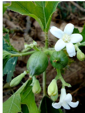
9 Cnidocolus albomaculatus EUPHORBIACEAE