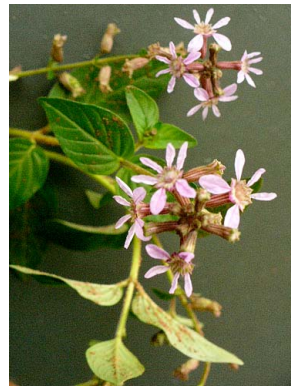
14 Cuphea racemosa LYTHRACEAE