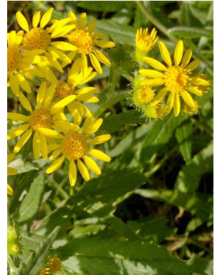
5 Senecio grisebachii ASTERACEAE