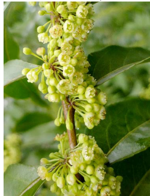
21 Casearia sylvestris SALICACEAE

© Science and Education, The Field Museum, Chicago. [fieldguides@fieldmuseum.org] [http://fieldguides.fieldmuseum.org/guides] Rapid Color Guide # 587 versión 1 03/2015