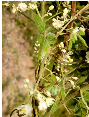
22 Serjania larutoteana SAPINDACEAE