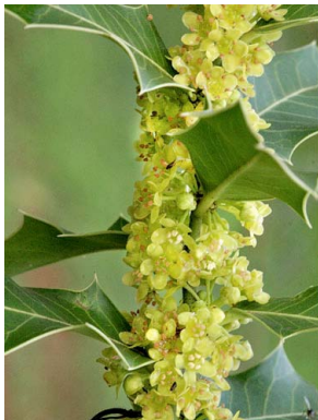
7 Maytenus ilicifolia CÉLASTRACEAE