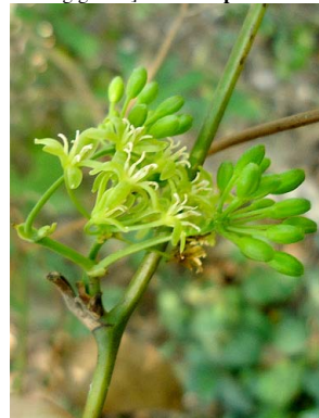
24 Smilax fluminensis SMILACACEAE