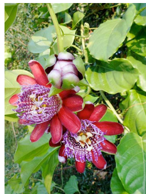
19 Passiflora alata PASSIFLORACEAE