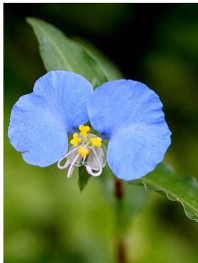
8 Commelina erecta COMMELINACEAE