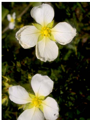
18 Ludwigia hassleriana ONAGRACEAE