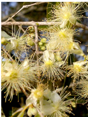
17 Hexachlamys edulis MYRTACEAE