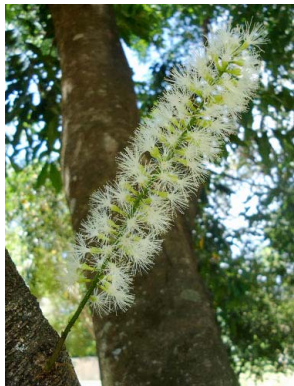
11 Inga marginata FABACEAE-MIMOS.