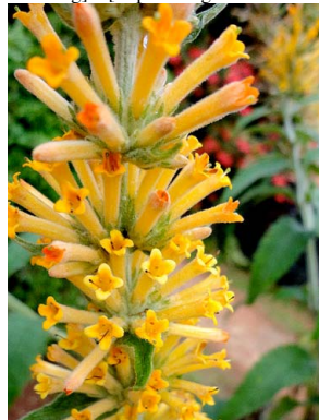
23 Buddleja tubiflora SCROPHULARIACEAE