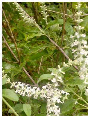
26 Aloysia gratissima VERBENACEAE