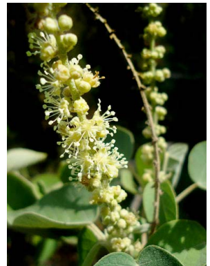
10 Croton urucurana EUPHORBIACEAE