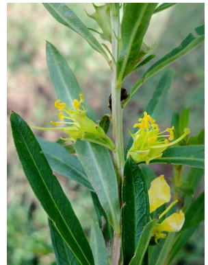
15 Heimia salicifolia LYTHRACEAE