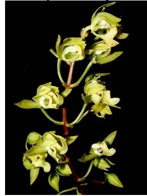
24 Mormodes revoluta