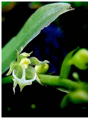
7 Cryptarrhena guatemalensis