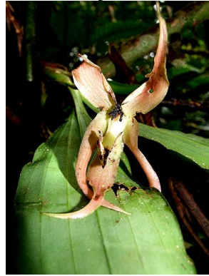
3 Andinorchis heteroclita aff.