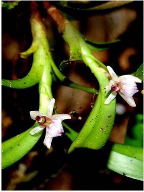
31 Scaphyglottis prolifera