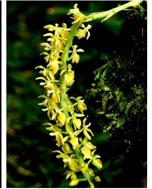
25 Notylia peruviana