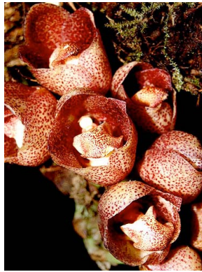
28 Peristeria lindenii