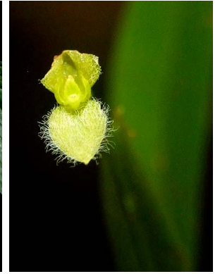
35 Stelis kefersteiniana