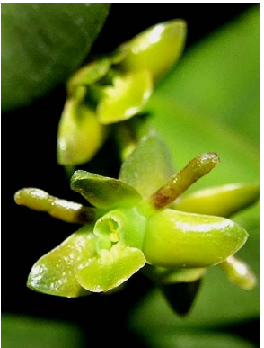
16 Epidendrum rigidum