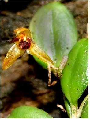
1 Anathallis polygonoides

Rapid Color Guide # 542 versión 1 12/2013