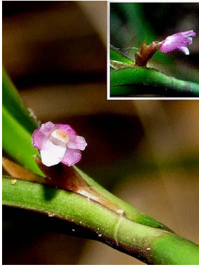
32 Scaphyglottis violacea