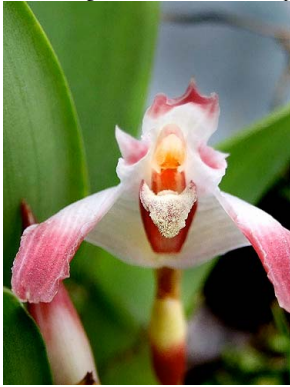
22 Maxillaria edwardsii