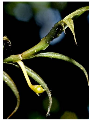
9 Dichaea tenuis aff.