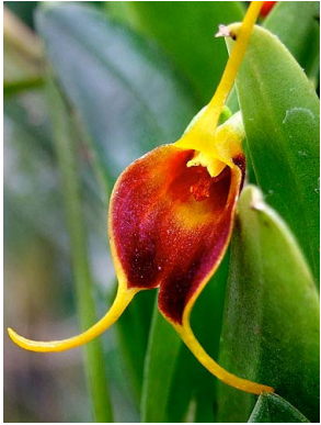
21 Masdevallia posadae aff.

Rapid Color Guide # 542 versión 1 12/2013