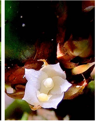
5 Camaridium vestitum