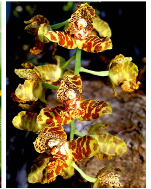
30 Rudolfiella peruviana