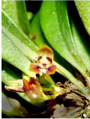
2 Anathallis rabei aff.