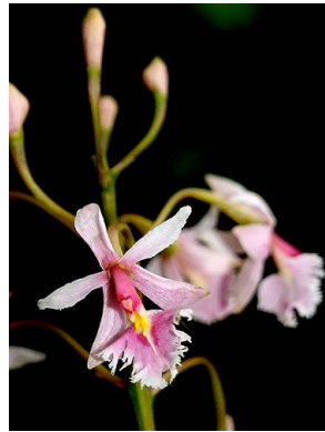
13 Epidendrum calanthum