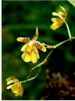
33 Stigmatostalix amazonica