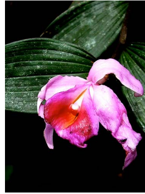
34 Sobralia sessilis