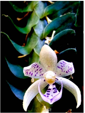
11 Dichaea sp. 2