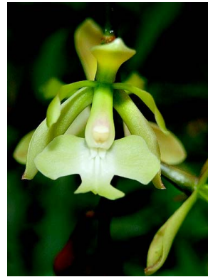
14 Epidendrum coronatum