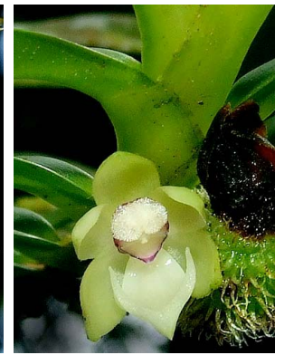
10 Dichaea sp. 1