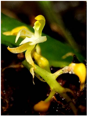
26 Notylia yauaperyensis