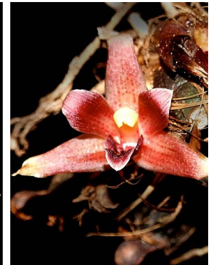
20 Mapinguari auyantepuiensis