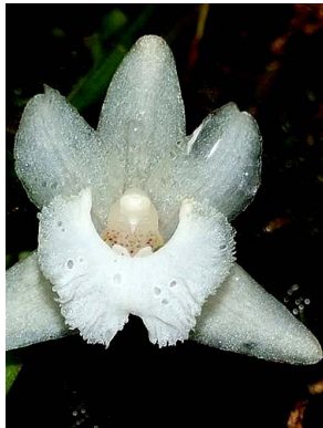
17 Kefersteinia candida