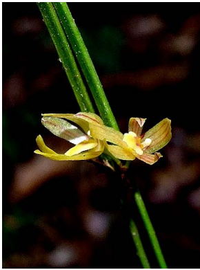
27 Octomeria brevifolia