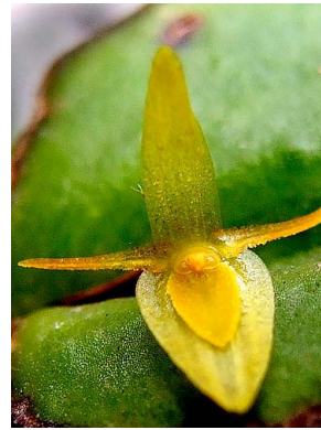
29 Pleurothallis scabrilinguis aff.