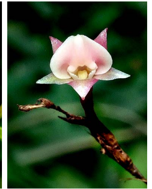
15 Epidendrum prostratum