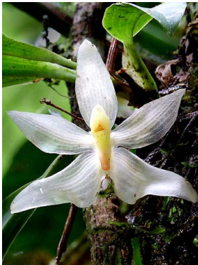
37 Stenia pallida