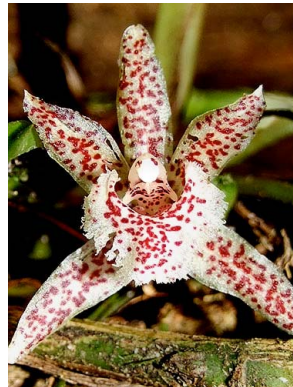
18 Kefersteinia villenae