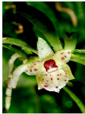
8 Dichaea ancoraelabia