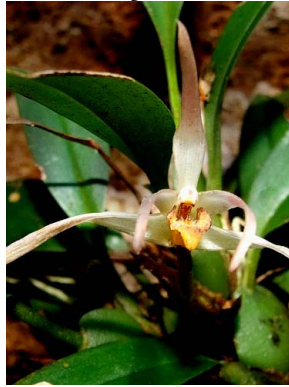
23 Maxillaria sp. 1