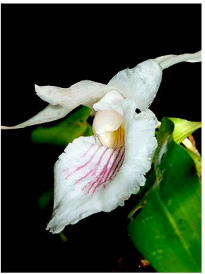
6 Cochleanthes amazonica