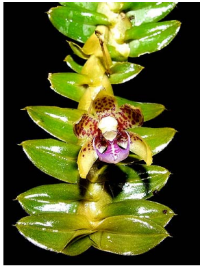
12 Dichaea sp. 3