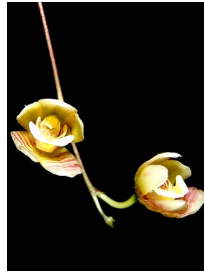
19 Koellensteinia graminea