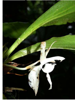
4 Andinorchis klugii