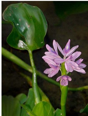
32 Eichhornia crassipes PONTEDERIACEAE