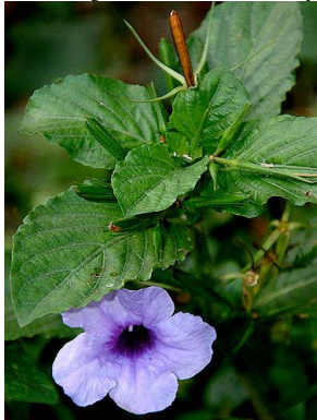
2 Ruellia tuberosa ACANTHACEAE