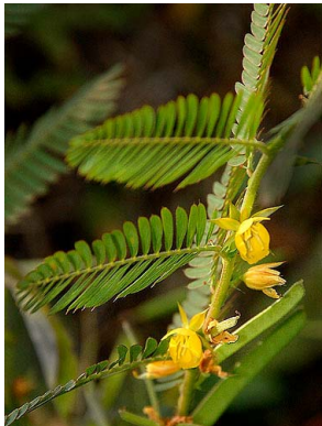
16 Chamaecrista nictitans FABACEAE-CAESALP.