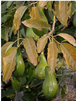
21 Persea americana LAURACEAE

Rapid Color Guide # 518 versión 1 06/2013