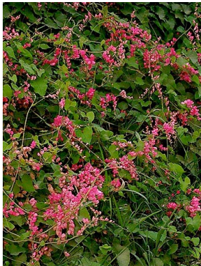
31 Antigonon leptopus POLYGALACEAE