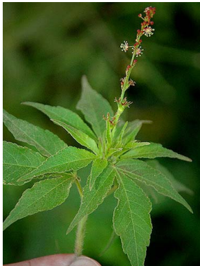
12 Astraea lobata EUPHORBIACEAE