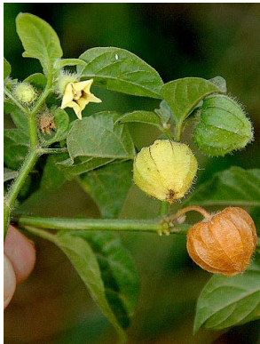
36 Physalis pubescens SOLANACEAE