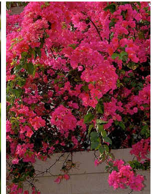
25 Bougainvillea glabra NYCTAGINACEAE