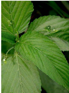
13 Caperonia palustris EUPHORBIACEAE