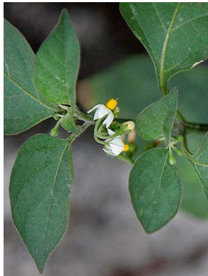
37 Solanum americanum SOLANACEAE