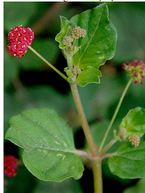
23 Boerhavia coccinea NYCTAGINACEAE