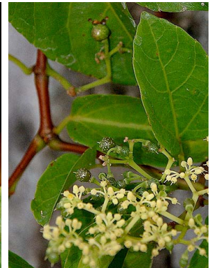
40 Cissampelos verticillata VITACEAE