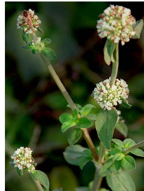
34 Spermacoce verticillata RUBIACEAE