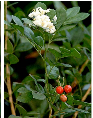
35 Murraya paniculata RUTACEAE