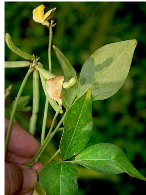
19 Vigna umbellata FABACEAE-PAPIL.