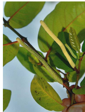
29 Piper arboreum PIPERACEAE