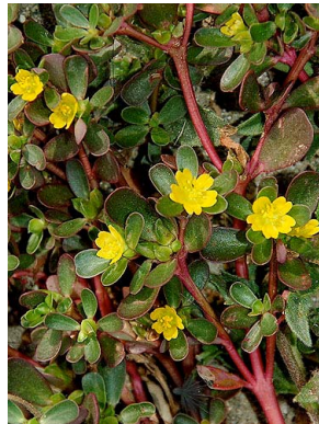
33 Portulaca oleracea PORTULACACEAE