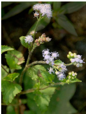
6 Ageratum conyzoides ASTERACEAE