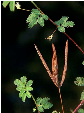
18 Mimosa quadrivalvis FABACEAE-MIMOS.