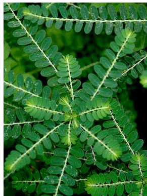
28 Phyllanthus amarus PHYLLANTHACEAE