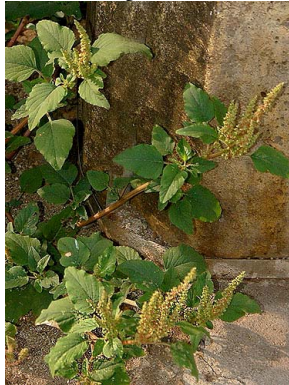
3 Amaranthus spinosus AMARANTHACEAE