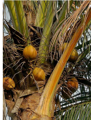
4 Cocos nucifera ARECACEAE