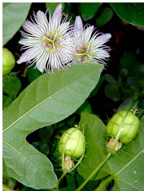
27 Passiflora foetida PASSIFLORACEAE