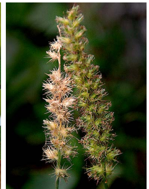
30 Cenchrus echinatus POACEAE