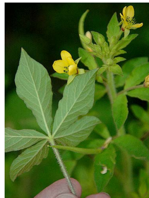
9 Cleome viscosa CLEOMACEAE