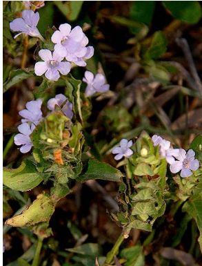
1 Ruellia blechum ACANTHACEAE

Rapid Color Guide # 518 versión 1 06/2013