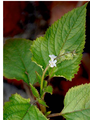
39 Priva lappulacea VERBENACEAE