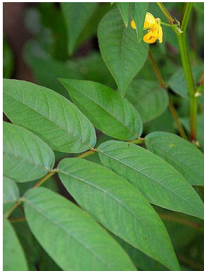
17 Senna occidentalis FABACEAE-CAESALP.