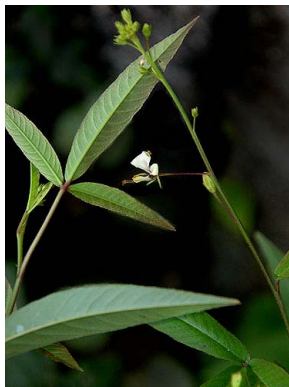
8 Cleome serrata CLEOMACEAE