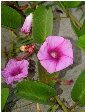
11 Ipomoea pes-caprae CONVOLVULACEAE