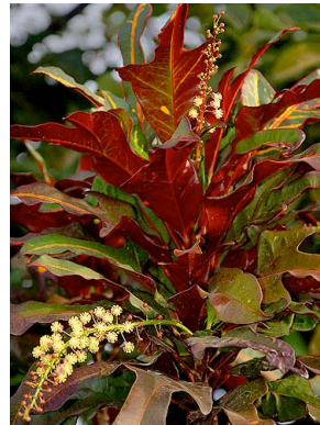
14 Codiaeum variegatum EUPHORBIACEAE