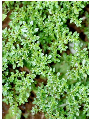
38 Pilea microphylla URTICACEAE