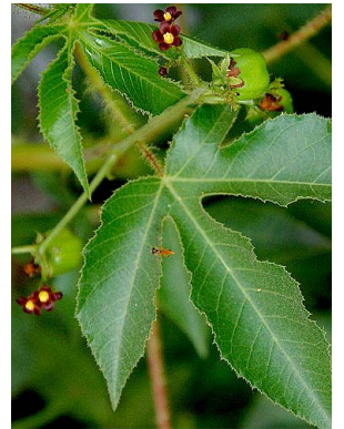
15 Jatropha gossypifolia EUPHORBIACEAE