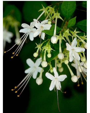
20 Clerodendrum ligustrinum LAMIACEAE