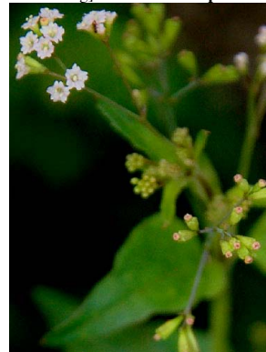
24 Boerhavia erecta NYCTAGINACEAE