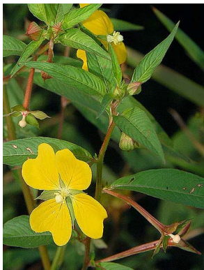
26 Ludwigia octovalvis ONAGRACEAE