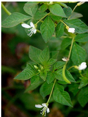
7 Cleome rutidosperma CLEOMACEAE