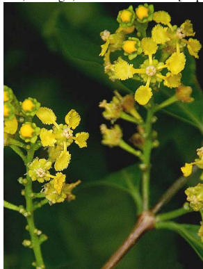
22 Bunchosia lindeniana MALPIGHIACEAE