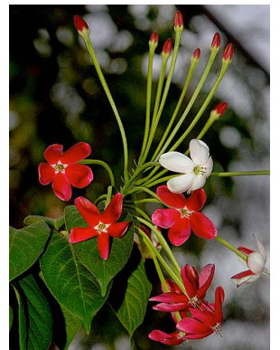
10 Quisqualis indica COMBRETACEAE