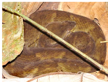
178 Bothrops atrox VIPERIDAE (GPZ)