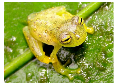
20 Nymphargus anomalus (juv.) CENTROLENIDAE (JBM)