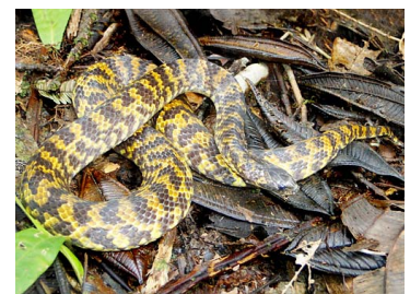
160 Atractus major COLUBRIDAE (JBM)