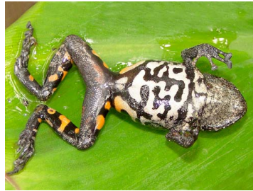
90 Pristimantis ventrimarmoratus CRAUGASTORIDAE (JBM y GPZ)