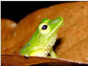
49 Pristimantis galdi ♂ CRAUGASTORIDAE (JBM y GPZ)