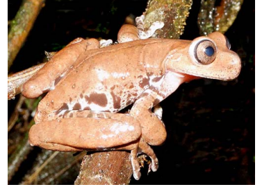
104 Hyloscirtus psarolaimus ♂ HYLIDAE (JBM)