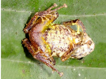
41 Pristimantis eriphus ♂ CRAUGASTORIDAE (JBM)

Rapid Color Guide # 502 versión 1 02/2013