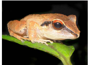
68 Pristimantis peruvianus CRAUGASTORIDAE (JBM y GPZ)