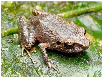
33 Pristimantis bicantus CRAUGASTORIDAE (JBM)