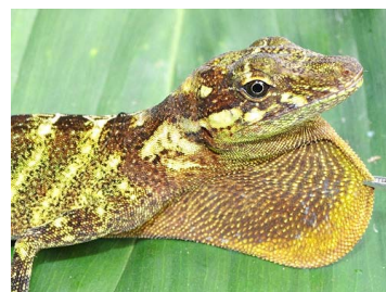
159 Anolis sp. ♀ IGUANIDAE Polychrotinae (JBM)