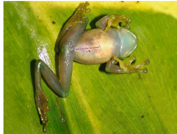
26 Rulyrana flavopunctata ♂ CENTROLENIDAE (JBM)