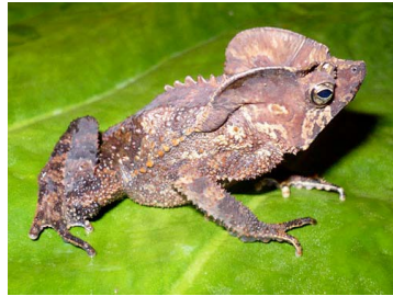
10 Rhinella roqueana BUFONIDAE (ALAC)