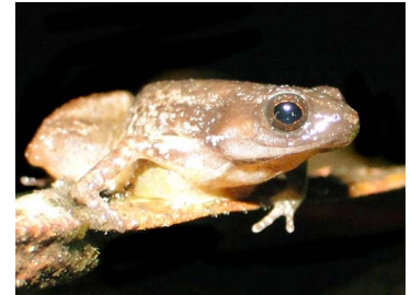
28 Noblella sp. nov ♂ CRAUGASTORIDAE (JBM)