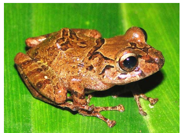
80 Pristimantis sp. 3 CRAUGASTORIDAE (JBM)