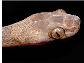
167 Leptodeira annulata COLUBRIDAE (JBM)