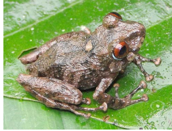
63 Pristimantis nigrogriseus CRAUGASTORIDAE (JBM)