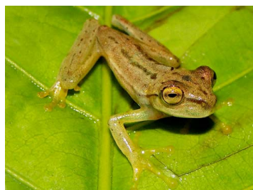
119 Hypsiboas nympa HYLIDAE (JBM)