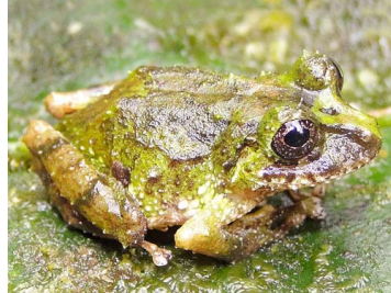
42 Pristimantis eriphus ♀ CRAUGASTORIDAE (JBM)