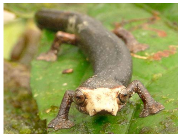
139 Bolitoglossa peruviana PLETHODONTIDAE (JBM)