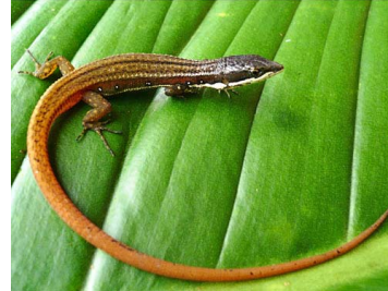
143 Cercosaura argulus GYMNOPHTHALMIDAE (ALAC)