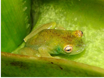
101 Hyloscirtus phyllognathus ♂ HYLIDAE (JBM)

Rapid Color Guide # 502 versión 1 02/2013