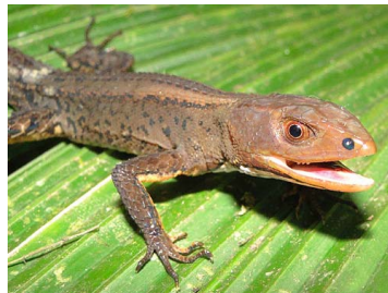
146 Potamites cochranae GYMNOPHTHALMIDAE (JBM)