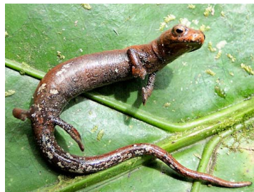
135 Bolitoglossa palmata PLETHODONTIDAE (JBM)