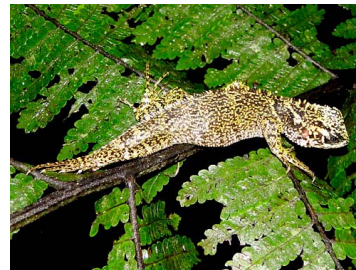
151 Enyalioides praestabilis ♀ IGUANIDAE Hoplocercinae (JBM y GPZ)