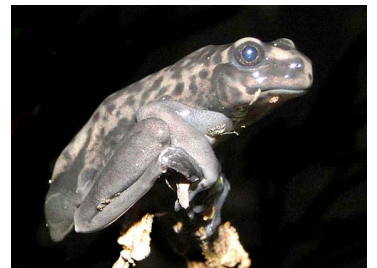
116 Hypsiboas cf. geographicus (met.) HYLIDAE (JBM)