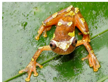
99 Dendropsophus sarayacuensis HYLIDAE (JBM)