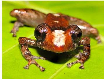
66 Pristimantis pecki CRAUGASTORIDAE (JBM)