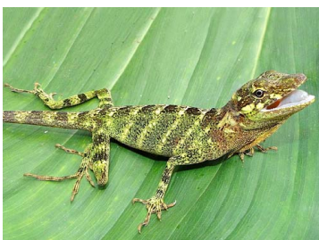
157 Anolis sp. ♀ IGUANIDAE Polychrotinae (JBM)