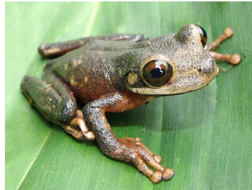
126 Osteocephalus verruciger ♀ HYLIDAE (JBM)