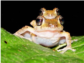
85 Pristimantis trachyblepharis CRAUGASTORIDAE (Ampl.) (JBM)