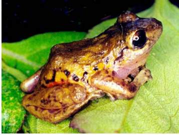
61 Pristimantis cf. modipeplus CRAUGASTORIDAE (ALAC)

Rapid Color Guide # 502 versión 1 02/2013