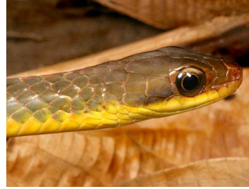
163 Chironius scurrulus COLUBRIDAE (JBM)