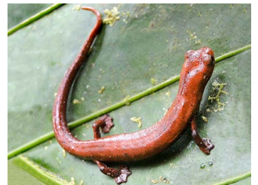
136 Bolitoglossa palmata PLETHODONTIDAE (JBM)