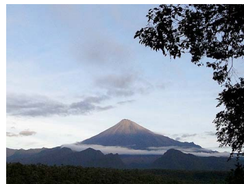
179 Volcán Sangay