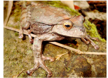
92 Gastrotheca testudinea ♂ HEMIPHRACTIDAE (JBM)