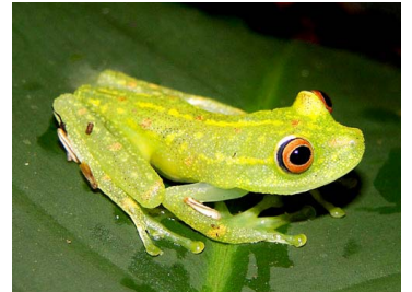
108 Hypsiboas cinerascens HYLIDAE (JBM)