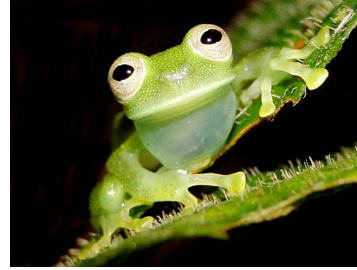
23 Nymphargus cochranae ♂ CENTROLENIDAE (JBM)