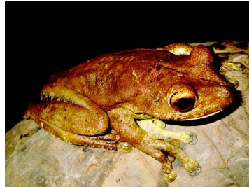
107 Hypsiboas boans HYLIDAE (JBM)