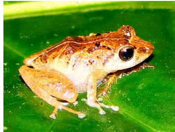
86 Pristimantis trachyblepharis CRAUGASTORIDAE (JBM)