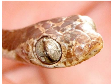
166 Imantodes cenchoa COLUBRIDAE (JBM)