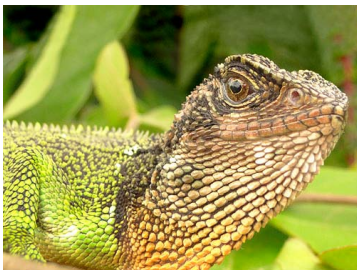
153 Enyalioides praestabilis ♂ IGUANIDAE Hoplocercinae (JBM)