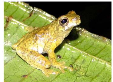
96 Dendropsophus parviceps HYLIDAE (JBM y GPZ)