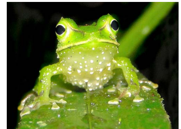
48 Pristimantis galdi ♂ CRAUGASTORIDAE (JBM y GPZ)