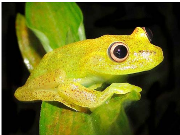
109 Hypsiboas cinerascens HYLIDAE (JBM)