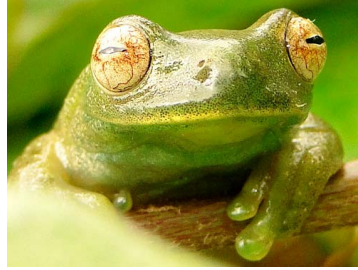
102 Hyloscirtus phyllognathus ♂ HYLIDAE (JBM)