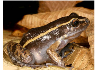
132 Leptodactylus lineatus LEPTODACTYLIDAE (JBM)