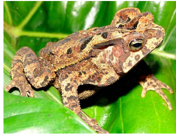
11 Rhinella cf. roqueana BUFONIDAE (ALAC)