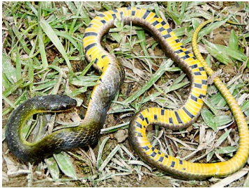
169 Liophis breviceps COLUBRIDAE (JBM)