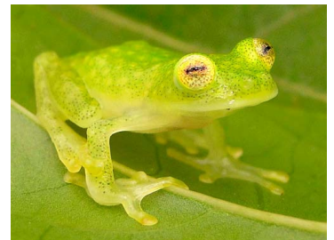
16 Hyalinobatrachium pellucidum ♂ CENTROLENIDAE (JBM)