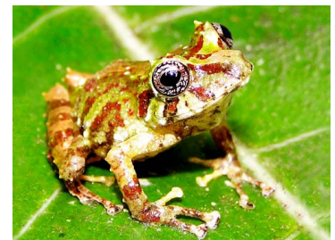
40 Pristimantis eriphus ♂ CRAUGASTORIDAE (JBM)