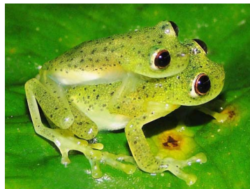
14 Chimerella mariaelenae (ampl.) CENTROLENIDAE (JBM)