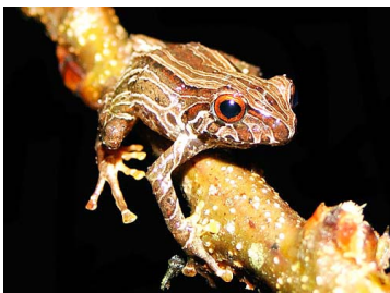
77 Pristimantis sp. nov CRAUGASTORIDAE (JBM)