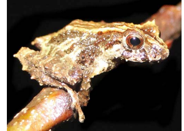
44 Pristimantis gagliardoi ♂ CRAUGASTORIDAE (JBM)