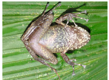
76 Pristimantis rubicundus CRAUGASTORIDAE (JBM)