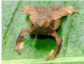
7 Rhinella festae BUFONIDAE (JBM)