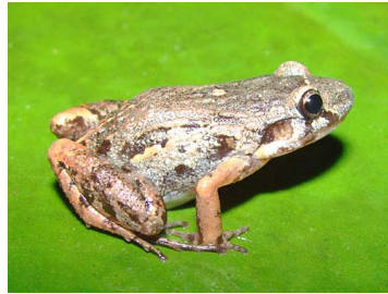
131 Leptodactylus andreae LEPTODACTYLIDAE (JBM)