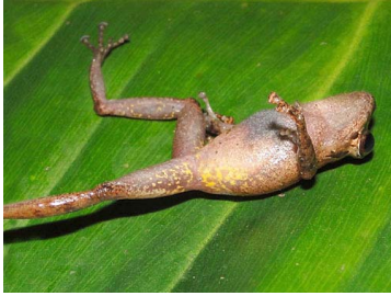
81 Pristimantis sp. 3 CRAUGASTORIDAE (JBM)

Rapid Color Guide # 502 versión 1 02/2013