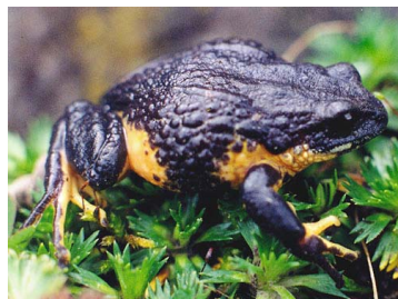
38 Pristimantis curtipes CRAUGASTORIDAE (ALAC)