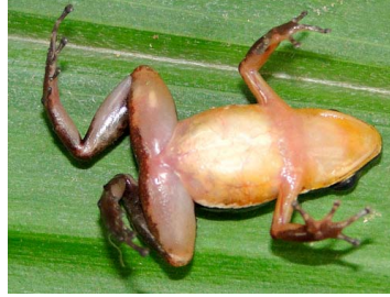
3 Allobates fratisenescus ♂ AROMOBATIDAE (JBM)