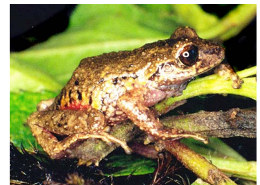
60 Pristimantis cf. modipeplus CRAUGASTORIDAE (ALAC)