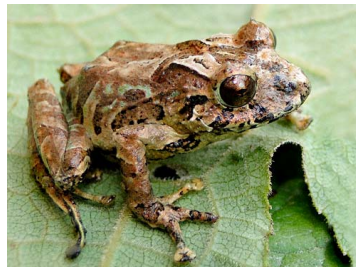
46 Pristimantis gagliardoi ♀ CRAUGASTORIDAE (JBM)