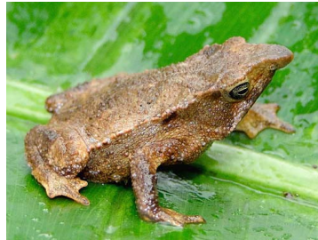
6 Rhinella festae BUFONIDAE (JBM)