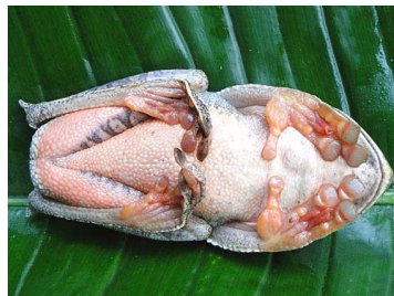
115 Hypsiboas cf. geographicus ♀ HYLIDAE (JBM)