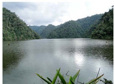
180 Laguna de Sardinayacu