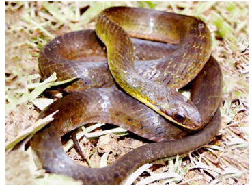
168 Liophis breviceps COLUBRIDAE (JBM)