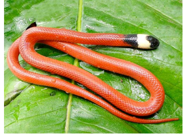
164 Clelia clelia (juv.) COLUBRIDAE (JBM)