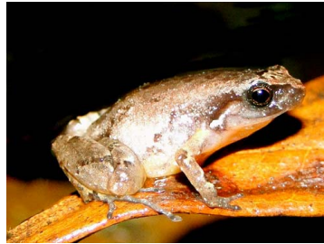
30 Noblella sp. nov ♀ CRAUGASTORIDAE (JBM)