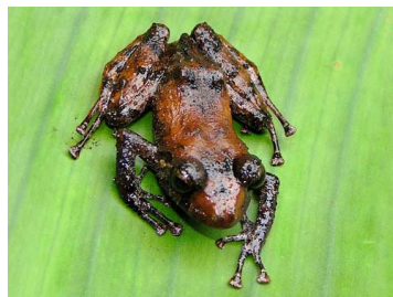
78 Pristimantis sp. 1 CRAUGASTORIDAE (JBM)