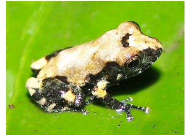
88 Pristimantis ventrimarmoratus CRAUGASTORIDAE (Juv.) (JBM)