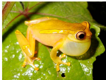
94 Dendropsophus bifurcus ♂ HYLIDAE (JBM y GPZ)