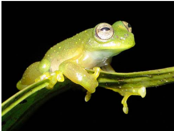
25 Rulyrana flavopunctata ♂ CENTROLENIDAE (JBM)