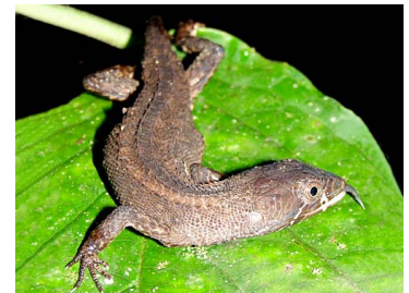
148 Potamites ecleopus GYMNOPHTHALMIDAE (JBM)