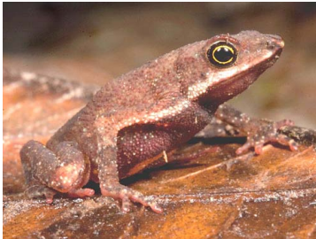
5 Amazophrynella minuta BUFONIDAE (JBM)