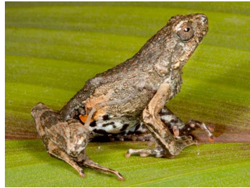
130 Engystomops petersi LEPTODACTYLIDAE (JBM)