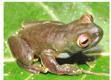
100 Hyloscirtus phyllognathus ♂ HYLIDAE (JBM)