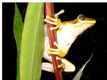
118 Hypsiboas lanciformis HYLIDAE (JBM)