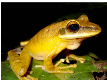
117 Hypsiboas lanciformis HYLIDAE (JBM)