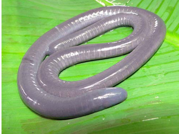
141 Caecilia sp. CAECILIIDAE (JBM)

Rapid Color Guide # 502 versión 1 02/2013