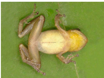
37 Pristimantis bromeliaceus ♂ CRAUGASTORIDAE (JBM)