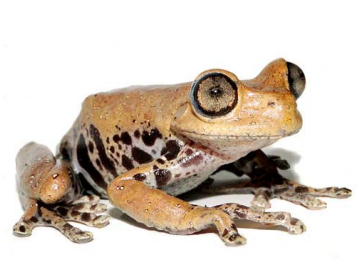
105 Hyloscirtus psarolaimus ♀ HYLIDAE (JBM)