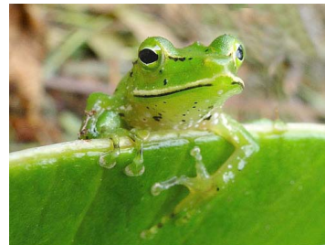
51 Pristimantis galdi CRAUGASTORIDAE (JBM)