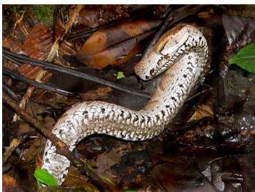
177 Bothrocophias hyoprora VIPERIDAE (JBM)