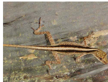
155 Anolis fuscoauratus ♀ IGUANIDAE Polychrotinae (JBM)