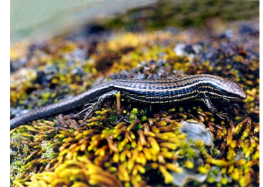
144 Pholidobolus macbrydei GYMNOPHTHALMIDAE (ALAC)