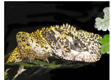
152 Enyalioides praestabilis ♀ IGUANIDAE Hoplocercinae (JBM y GPZ)