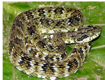
175 Bothriopsis pulchra VIPERIDAE (JBM)