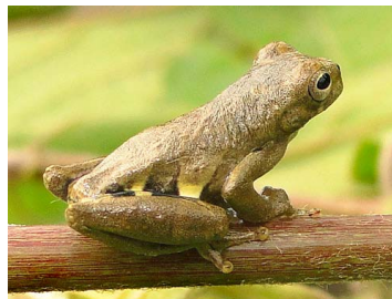
95 Dendropsophus parviceps HYLIDAE (JBM y GPZ)