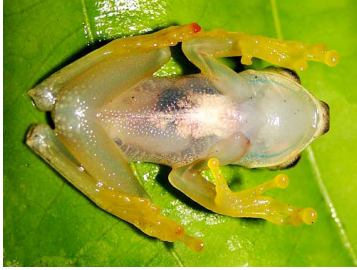
121 Hypsiboas nympha HYLIDAE (JBM)

Rapid Color Guide # 502 versión 1 02/2013