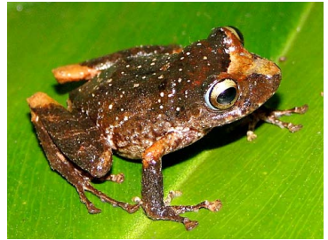
72 Pristimantis quaquaversus CRAUGASTORIDAE (JBM)