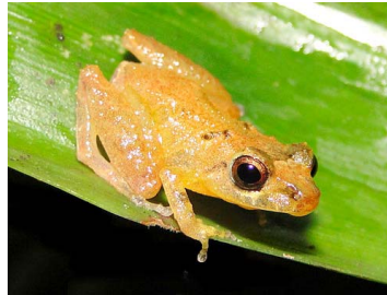
87 Pristimantis trachyblepharis CRAUGASTORIDAE (JBM)