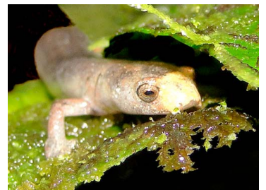
140 Bolitoglossa peruviana PLETHODONTIDAE (JBM)