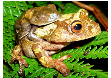
112 Hypsiboas cf. geographicus (amp) HYLIDAE (JBM)