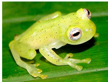
15 Chimerella mariaelenae ♂ CENTROLENIDAE (JBM)