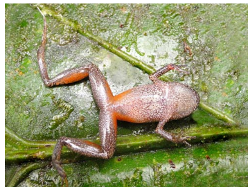
34 Pristimantis bicantus CRAUGASTORIDAE (JBM)