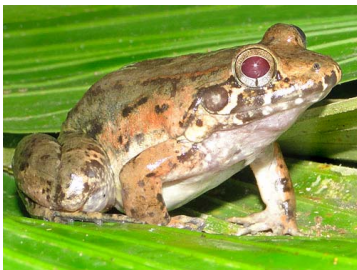
133 Leptodactylus wagneri LEPTODACTYLIDAE (JBM y GPZ)