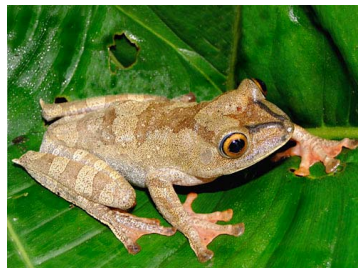
114 Hypsiboas cf. geographicus ♀ HYLIDAE (JBM)