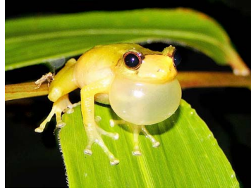
82 Pristimantis sp. 4 ♂ CRAUGASTORIDAE (JBM)