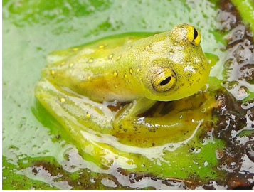
21 Nymphargus anomalus (Juv.) CENTROLENIDAE (JBM)

Rapid Color Guide # 502 versión 1 02/2013