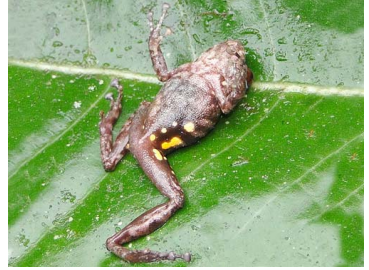
64 Pristimantis nigrogriseus CRAUGASTORIDAE (JBM)