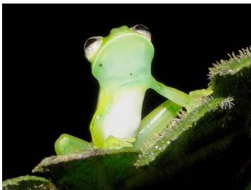
13 Centrolene audax ♂ CENTROLENIDAE (JBM)