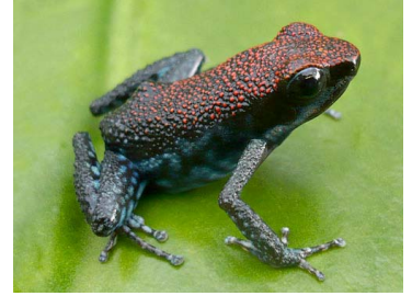
4 Allobates zaparo AROMOBATIDAE (ALAC)