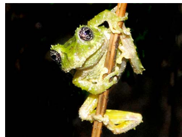
59 Pristimantis katoptroides CRAUGASTORIDAE (JBM)