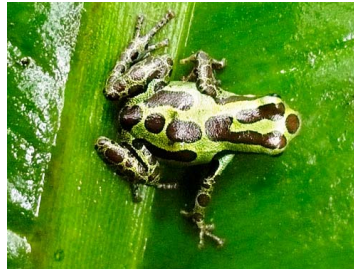
91 Ranitomeya variabilis DENDROBATIDAE (ALAC)