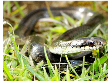
171 Liophis cobella COLUBRIDAE (JBM)