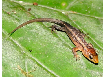
142 Alopoglossus buckleyi GYMNOPHTHALMIDAE (JBM)