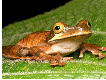
123 Osteocephalus mutabor HYLIDAE (JBM)