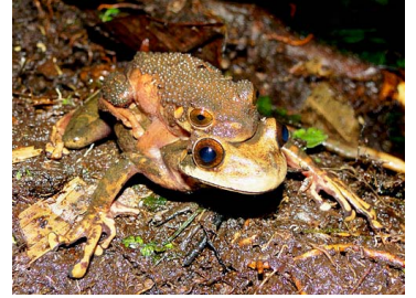
124 Osteocephalus verruciger (ampl) HYLIDAE (JBM)