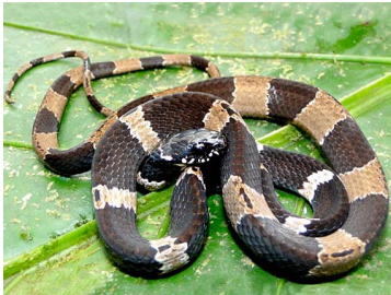
165 Dipsas peruana COLUBRIDAE (JBM)