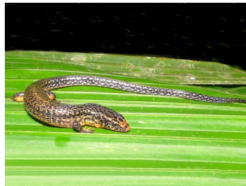
150 Riama cf. anatoloros GYMNOPHTHALMIDAE (JBM)