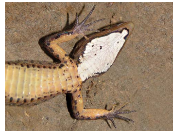
147 Potamites cochranae GYMNOPHTHALMIDAE (JBM)