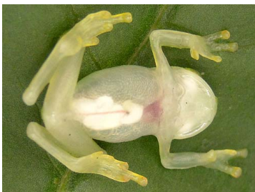
17 Hyalinobatrachium pellucidum ♂ CENTROLENIDAE (JBM)