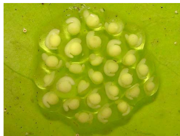
19 Hyalinobatrachium pellucidum CENTROLENIDAE (JBM)