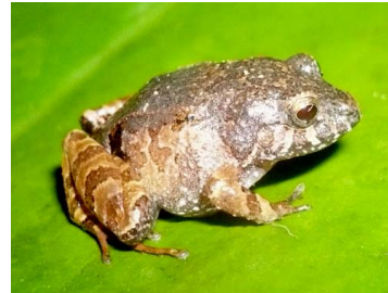
27 Hypodactylus nigrovittatus CRAUGASTORIDAE (ALAC)