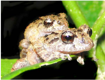
69 Pristimantis prolatus (ampl.) CRAUGASTORIDAE (JBM)