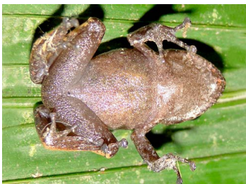
57 Pristimantis incomptus CRAUGASTORIDAE (JBM)