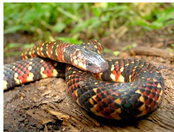
174 Micrurus peruvianus ELAPIDAE (JBM)