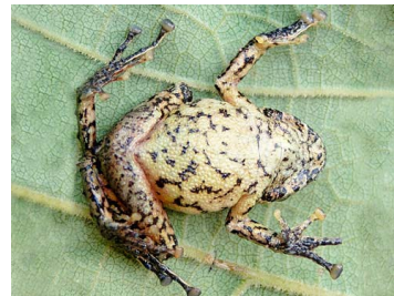
47 Pristimantis gagliardoi ♀ CRAUGASTORIDAE (JBM)