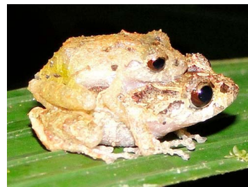
39 Pristimantis diadematus (ampl) CRAUGASTORIDAE (JBM)