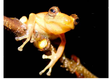
84 Pristimantis sp. 4 CRAUGASTORIDAE (JBM)