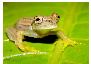
120 Hypsiboas nympa HYLIDAE (JBM)