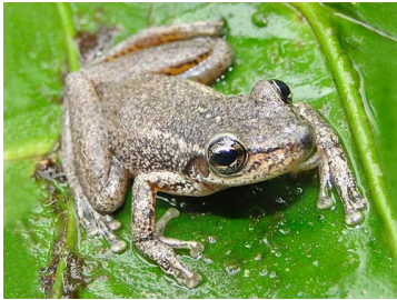
129 Scinax ruber HYLIDAE (JBM)