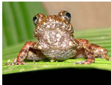
75 Pristimantis rubicundus CRAUGASTORIDAE (JBM)