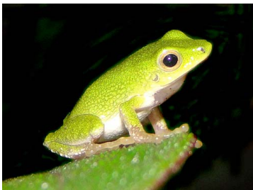
53 Pristimantis ganonotus CRAUGASTORIDAE (JBM)