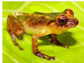
35 Pristimantis bromeliaceus ♂ CRAUGASTORIDAE (JBM)