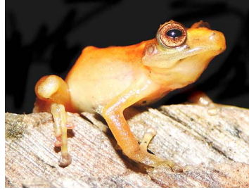
83 Pristimantis sp. 4 CRAUGASTORIDAE (JBM)