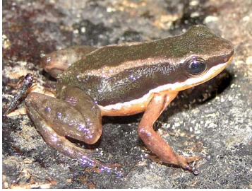
1 Allobates fratisenescus ♂ AROMOBATIDAE (JBM)

Rapid Color Guide # 502 versión 1 02/2013