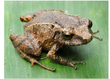
32 Pristimantis bicantus CRAUGASTORIDAE (JBM)