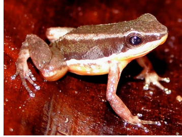
2 Allobates fratisenescus ♂ AROMOBATIDAE (JBM)