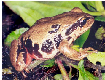
71 Pristimantis pycnodermis CRAUGASTORIDAE (ALAC)