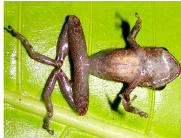
67 Pristimantis pecki CRAUGASTORIDAE (JBM)