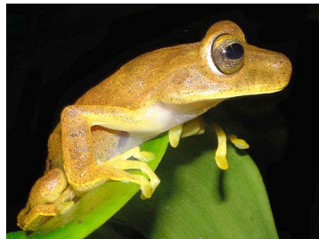
110 Hypsiboas fasciatus HYLIDAE (JBM y GPZ)