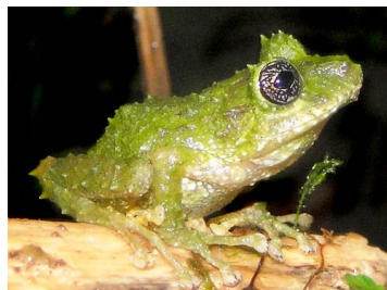
58 Pristimantis katoptroides CRAUGASTORIDAE (JBM)