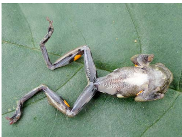
97 Dendropsophus parviceps HYLIDAE (JBM y GPZ)