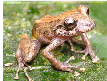
31 Pristimantis altamazonicus CRAUGASTORIDAE (JBM)