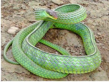
161 Chironius monticola COLUBRIDAE (ALAC)

Rapid Color Guide # 502 versión 1 02/2013