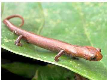
137 Bolitoglossa palmata PLETHODONTIDAE (JBM)