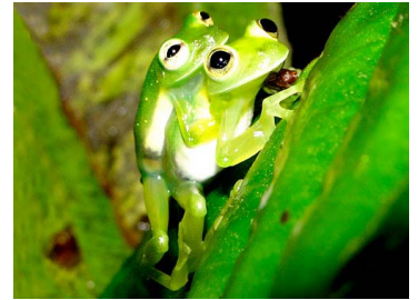
12 Centrolene audax (ampl.) CENTROLENIDAE (JBM)