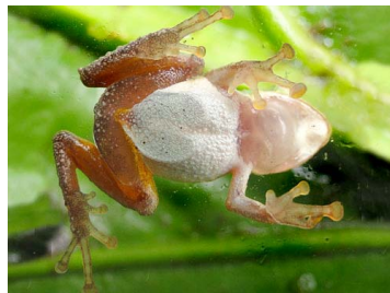
54 Pristimantis ganonotus CRAUGASTORIDAE (JBM)