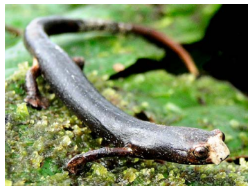
138 Bolitoglossa peruviana PLETHODONTIDAE (JBM)