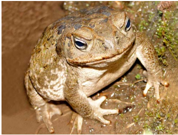
9 Rhinella marina ♀ BUFONIDAE (JBM)