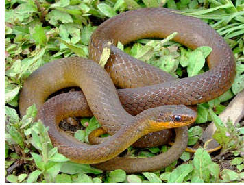
162 Chironius scurrulus COLUBRIDAE (ALAC)