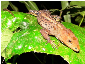
145 Potamites cochranae GYMNOPHTHALMIDAE (JBM)