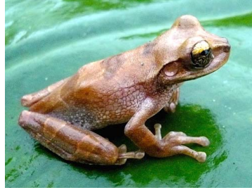
122 Osteocephalus fuscifacies HYLIDAE (ALAC)