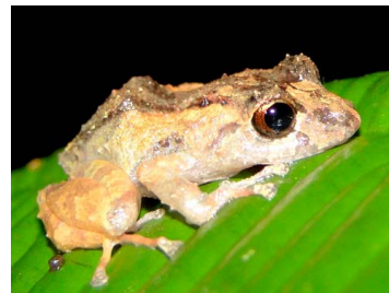
55 Pristimantis incomptus CRAUGASTORIDAE (JBM)