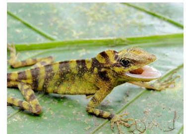
156 Anolis sp. ♂ IGUANIDAE Polychrotinae (JBM)