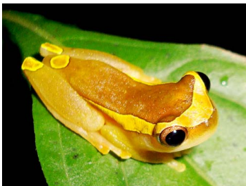
93 Dendropsophus bifurcus HYLIDAE (JBM)