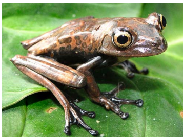
113 Hypsiboas cf. geographicus ♂ HYLIDAE (JBM)