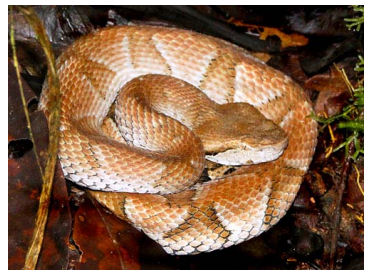
176 Bothrocophias hyoprora VIPERIDAE (JBM)