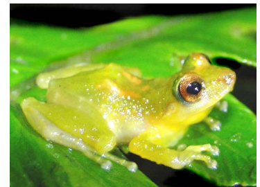
36 Pristimantis bromeliaceus ♂ CRAUGASTORIDAE (JBM)