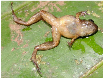
29 Noblella sp. nov ♂ CRAUGASTORIDAE (JBM)