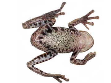
106 Hyloscirtus psarolaimus ♀ HYLIDAE (JBM)