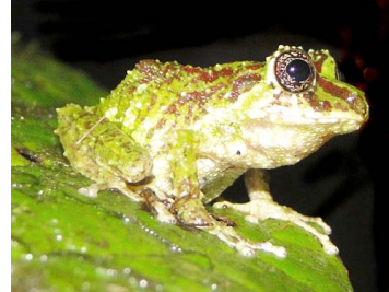
43 Pristimantis eriphus ♀ CRAUGASTORIDAE (JBM)