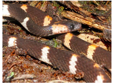
172 Oxyrhopus petola COLUBRIDAE (JBM)