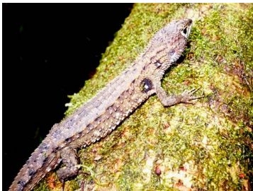
149 Potamites strangulatus GYMNOPHTHALMIDAE (ALAC)