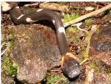
173 Oxyrhopus petola COLUBRIDAE (JBM)