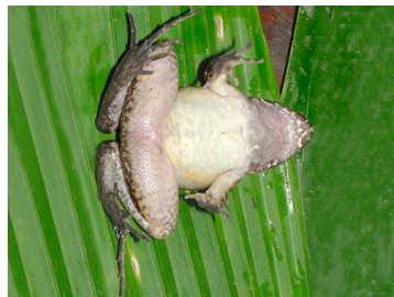
134 Leptodactylus wagneri LEPTODACTYLIDAE (JBM y GPZ)