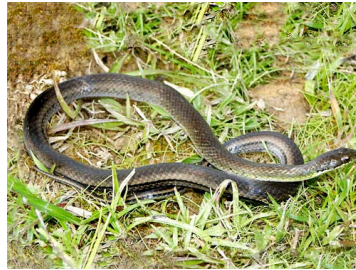
170 Liophis cobella COLUBRIDAE (JBM)