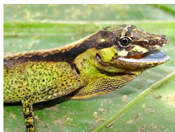
158 Anolis sp. ♀ IGUANIDAE Polychrotinae (JBM)