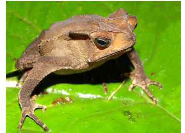
8 Rhinella margaritifera BUFONIDAE (JBM)