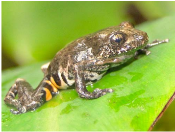
89 Pristimantis ventrimarmoratus CRAUGASTORIDAE (JBM y GPZ)