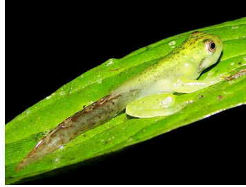
103 Hyloscirtus phyllognathus HYLIDAE (JBM)