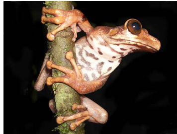
127 Osteocephalus verruciger ♀ HYLIDAE (JBM)