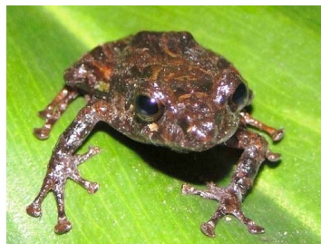
79 Pristimantis sp. 2 CRAUGASTORIDAE (JBM)