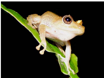
73 Pristimantis quaquaversus CRAUGASTORIDAE (JBM)