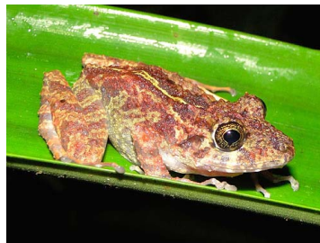
74 Pristimantis rubicundus CRAUGASTORIDAE (JBM)