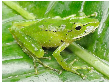
50 Pristimantis galdi CRAUGASTORIDAE (JBM)