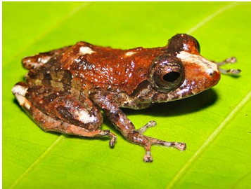
65 Pristimantis pecki CRAUGASTORIDAE (JBM)