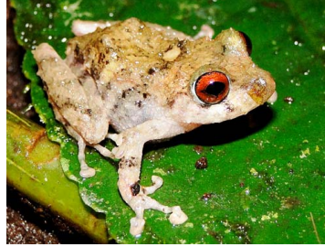
62 Pristimantis nigrogriseus CRAUGASTORIDAE (JBM)