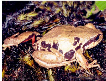
70 Pristimantis pycnodermis CRAUGASTORIDAE (ALAC)