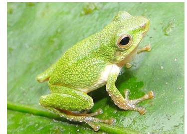
52 Pristimantis ganonotus CRAUGASTORIDAE (JBM)