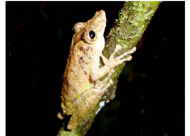
128 Scinax garbei HYLIDAE (JBM)