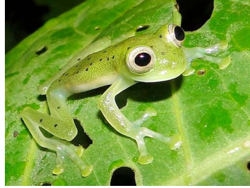
22 Nymphargus cochranae CENTROLENIDAE (JBM)