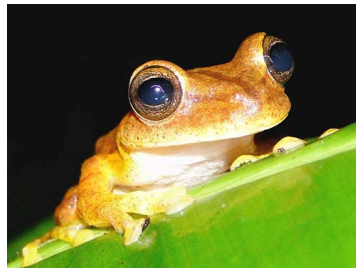
111 Hypsiboas fasciatus HYLIDAE (JBM)