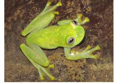
24 Rulyrana flavopunctata CENTROLENIDAE (JBM y GPZ)