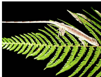
154 Anolis fuscoauratus ♂ IGUANIDAE Polychrotinae (JBM)