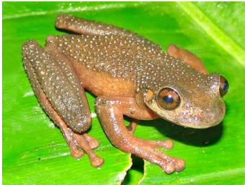
125 Osteocephalus verruciger ♂ HYLIDAE (JBM)