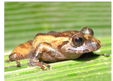
56 Pristimantis incomptus CRAUGASTORIDAE (JBM)