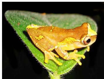
98 Dendropsophus sarayacuensis HYLIDAE (JBM)