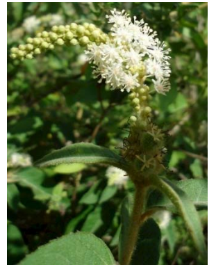
15 Croton heliotropifolius EUPHORBIACEAE H. C. S. Araújo