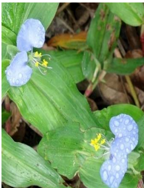
11 Commelina obliqua COMMELINACEAE M. J. P. Costa