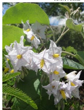
34 Solanum paniculatum SOLANACEAE M. J. P. Costa