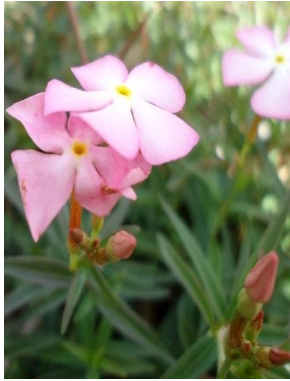
2 Mandevilla tenuifolia APOCYNACEAE M. J. P. Costa