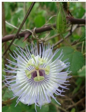
32 Passiflora foetida PASSIFLORACEAE