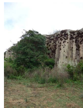
40 Afloramento III H. C. S. Araújo