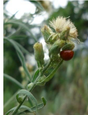
4 Emilia sonchifolia ASTERACEAE H. C. S. Araújo