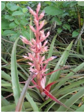
7 Bromelia laciniosa BROMELIACEAE T. S. Silva