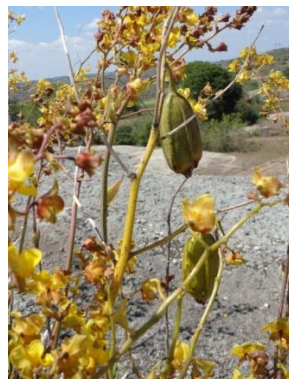
29 Cyrtopodium holstii ORCHIDACEAE M. J. P. Costa