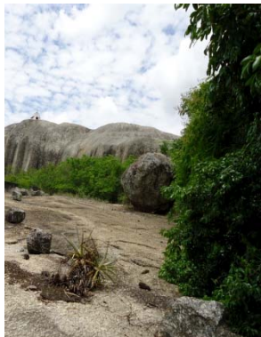
38 Afloramento II H. C. S. Araújo