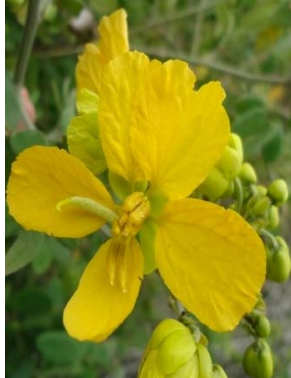
19 Senna martiana FABACEAE