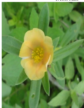
33 Portulaca mucronata PORTULACACEAE M. J. P. Costa