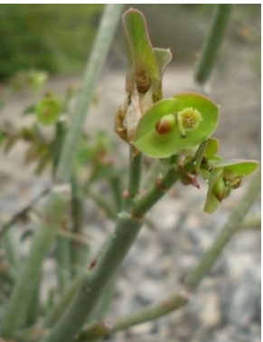
16 Euphorbia comosa EUPHORBIACEAE T. S. Silva