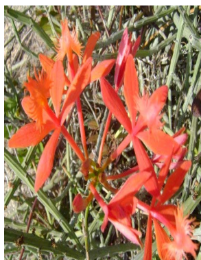
28 Epidendrum cinnabarinum ORCHIDACEAE J. I. M. Melo