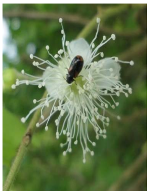
27 Campomanesia dichotoma MYRTACEAE M. J. P. Costa