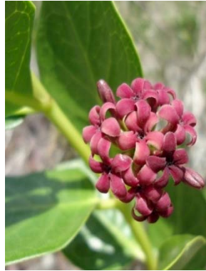
3 Marsdenia caatingae APOCYNACEAE T. S. Silva