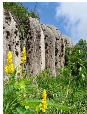
39 Afloramento III H. C. S. Araújo