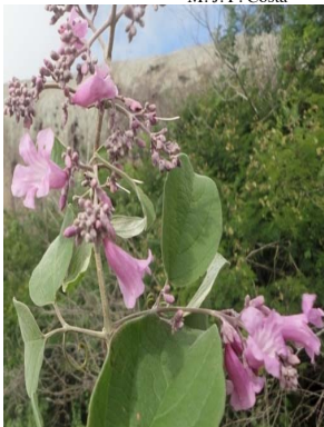
6 Tanaecium selloi BIGNONIACEAE M. J. P. Costa