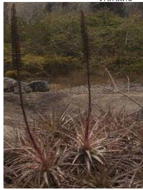
8 Encholirium spectabile BROMELIACEAE T. S. Silva