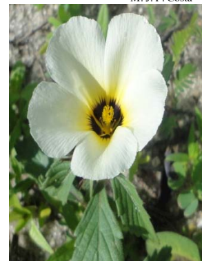
35 Turnera subulata TURNERACEAE M. J. P. Costa