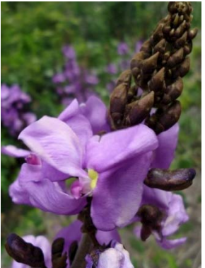
17 Dioclea grandiflora FABACEAE H. C. S. Araújo