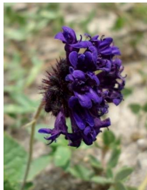
21 Raphiodon echinus LAMIACEAE M. J. P. Costa