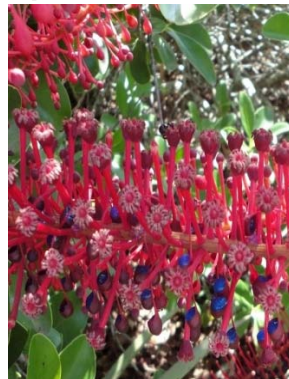
24 Schwartzia brasiliensis MARCGRAVIACEAE