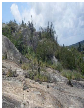
37 Afloramento I S. A. L. Silva