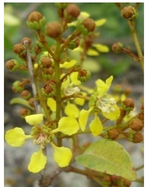
22 Byrsonima coccolobifolia MALPIGHIACEAE M. J. P. Costa