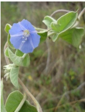
13 Jacquemontia confusa CONVOLVULACEAE W. A. Queiroz