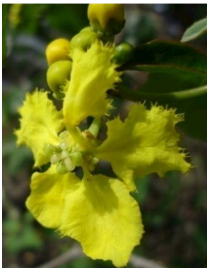
23 Stigmaphyllon paralias MALPIGHIACEAE M. J. P. Costa