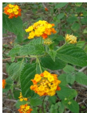
36 Lantana camara VERBENACEAE