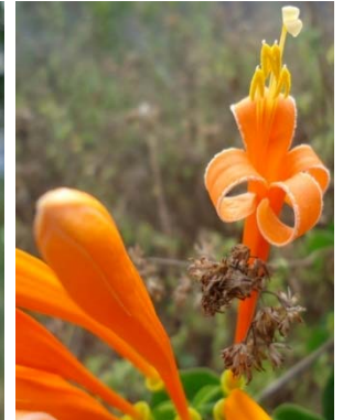
5 Pyrostegia venusta BIGNONIACEAE M. J. P. Costa