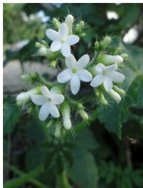
14 Cnidocolus urens EUPHORBIACEAE T. S. Silva