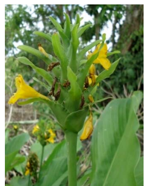
26 Calathea longibracteata MARANTACEAE W. A. Queiroz