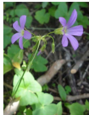
30 Oxalis debilis OXALIDACEAE M. J. P. Costa