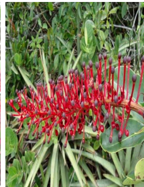
25 Schwartzia brasiliensis MARCGRAVIACEAE M. J. P. Costa