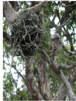
9 Tillandsia recurvata BROMELIACEAE T. S. Silva