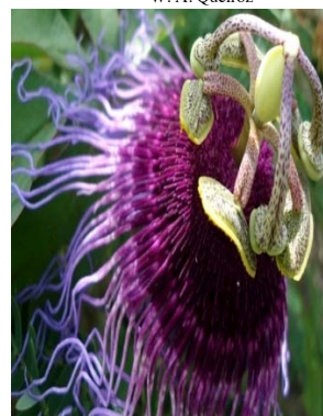
31 Passiflora cincinnata PASSIFLORACEAE H. C. S. Araújo