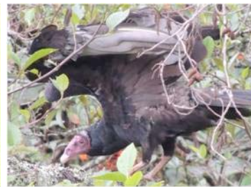
3 Cathartes aura (AOG) CATHARTIDAE