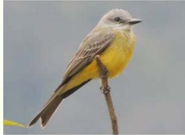
46 Tyrannus melancholicus (JSZ) TYRANNIDAE