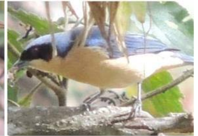
72 Pipraeidea melanonota (M) (AOG) THRAUPIDAE