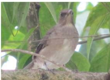
58 Turdus ignobilis (LRP) TURDIDAE