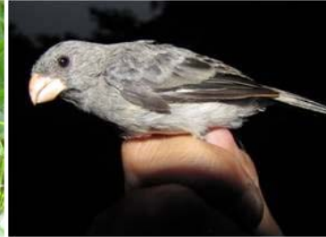
87 Sporophila intermedia (LRP) THRAUPIDAE