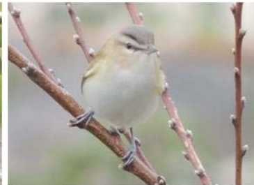
51 Vireo olivaceus (AOG) VIREONIDAE