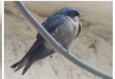
52 Orochilon murina (JSZ) HIRUNDINIDAE