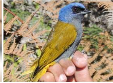
83 Thraupis cyanocephala (JSZ) THRAUPIDAE