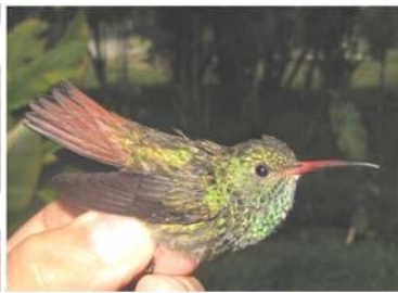
22 Amazilia tzacatl (LRP) TROCHILIDAE