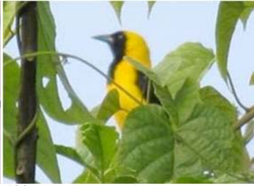
102 Icterus chrysater (AOG) ICTERIDAE