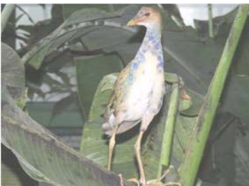
10 Porphyrio martinicus (JSZ) RALLIDAE