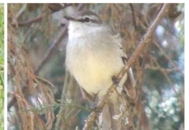
40 Mecocerculus leucophrys (AOG) TYRANNIDAE