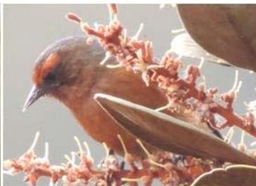
94 Conirostrum rufum (AOG) PARULIDAE