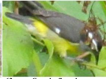
63 Coereba flaveola (AOG) THRAUPIDAE