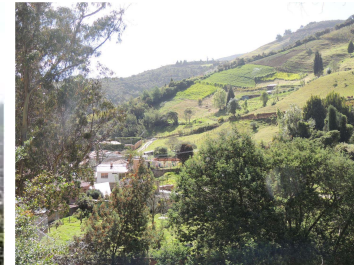
111 Sector La Legía