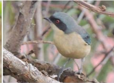
71 Pipraeidea melanonota (H) (AOG) THRAUPIDAE