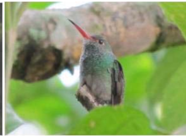
23 Amazilia tzacatl (AOG) TROCHILIDAE