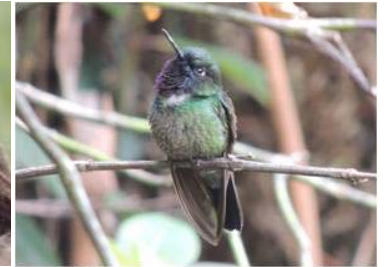
28 Haliangellus amethysticollis (AOG) TROCHILIDAE