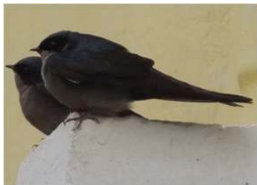
53 Orochilon murina (JSZ) HIRUNDINIDAE