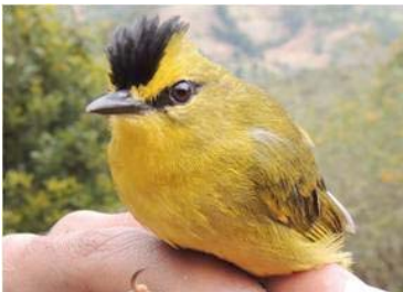
93 Basileuterus nigrocristatus (JSZ) PARULIDAE