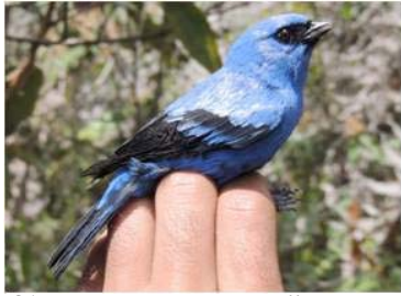
81 Tangara vassorii (JSZ) THRAUPIDAE