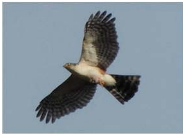
5 Accipiter bicolor (AOG) ACCIPITRIDAE