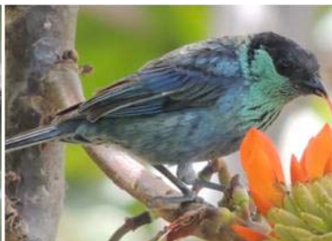
78 Tangara heinei (M) (AOG) THRAUPIDAE