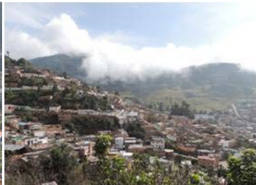
110 Barrio Santa Marta