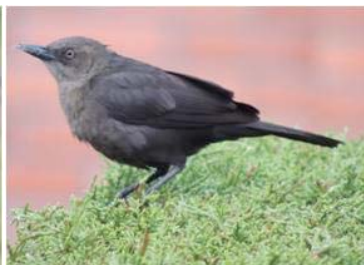
98 Quiscalus lugubris (M) (JSZ) ICTERIDAE