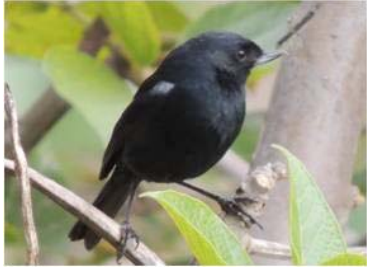
65 Diglossa humeralis (AOG) THRAUPIDAE