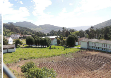
108 Barrio Los Tanques