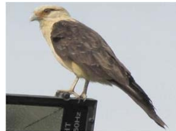
7 Milvago chimachima (AOG) FALCONIDAE