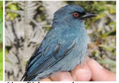
64 Diglossa caerulescens (AOG) THRAUPIDAE