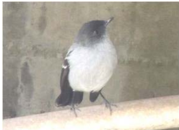
49 Serpophaga cinerea (LRP) TYRANNIDAE