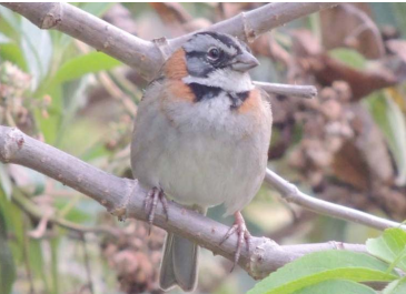
89 Zonotrichia capensis (LRP) EMBERIZIDAE