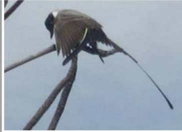
47 Tyrannus savana (AOG) TYRANNIDAE