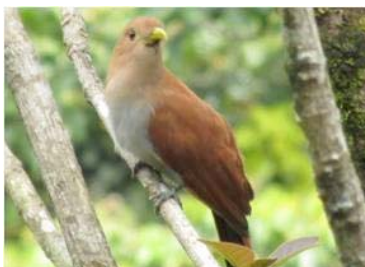
17 Piaya cayana (AOG) CUCULIDAE