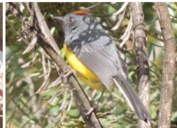
95 Myioborus miniatus (AOG) PARULIDAE