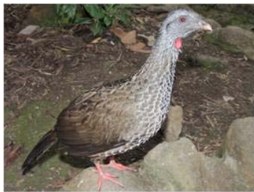
1 Ortalis ruficauda (JSZ) CRACIDAE