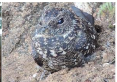
20 Systerulla longirostris (AOG) CAPRIMULGIDAE