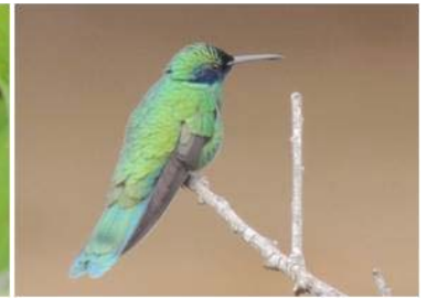
24 Colibri thalassinus (AOG) TROCHILIDAE