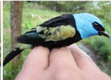
75 Tangara cyanicollis (LRP) THRAUPIDAE