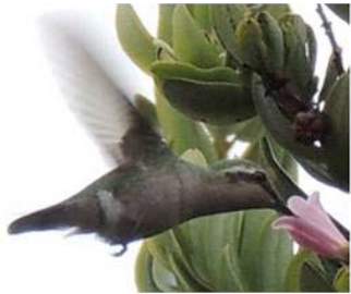
21 Chlorostilbon gibsoni (H) (LRP) TROCHILIDAE