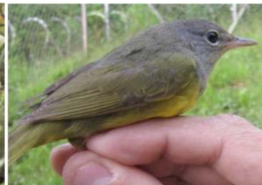
96 Oporornis philadelphia (LRP) PARULIDAE