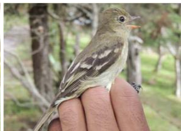
38 Elaenia frantzii (JSZ) TYRANNIDAE