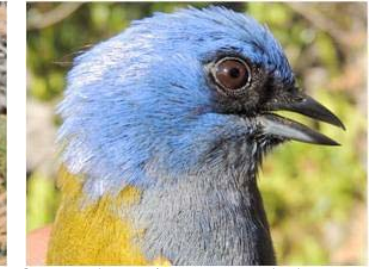
84 Thraupis cyanocephala (AOG) THRAUPIDAE