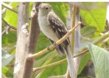
37 Elaenia frantzii (AOG) TYRANNIDAE