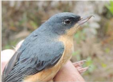
70 Diglossa sittoides (M) (AOG) THRAUPIDAE