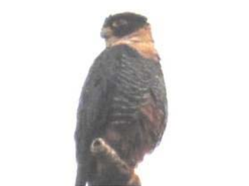
6 Falco rufigularis (AOG) FALCONIDAE