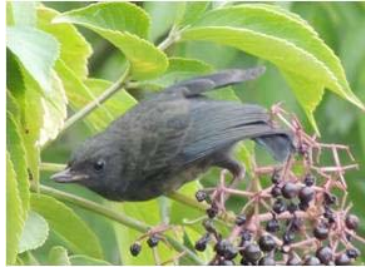
66 Diglossa humeralis (AOG) THRAUPIDAE