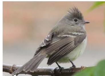
35 Camptostoma obsoletum (LRP) TYRANNIDAE