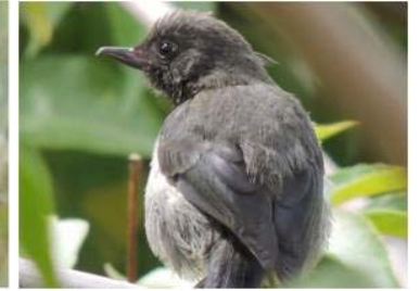
68 Diglossa lafresnayii (AOG) THRAUPIDAE