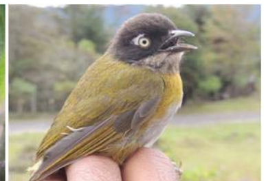
60 Chlorospingus ophthalmicus (JSZ) THRAUPIDAE