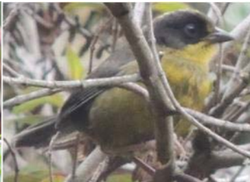
90 Atlapates pallidinucha (JSZ) EMBERIZIDAE