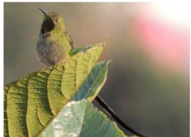
29 Lesbia victoriae (M) (AOG) TROCHILIDAE