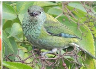
79 Tangara heinei (H) (AOG) THRAUPIDAE