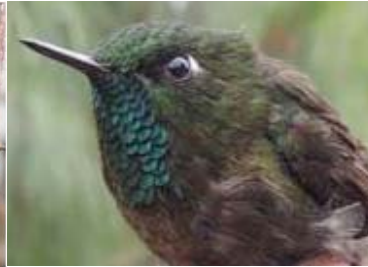
27 Metallura tyrannina (AOG) TROCHILIDAE