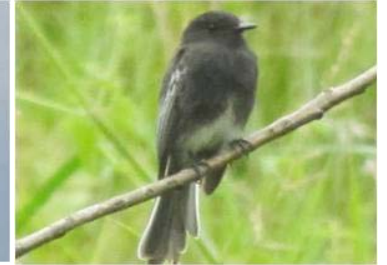
48 Sayornis nigricans (AOG) TYRANNIDAE