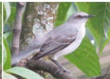
59 Mimus gilvus (LRP) MIMIDAE