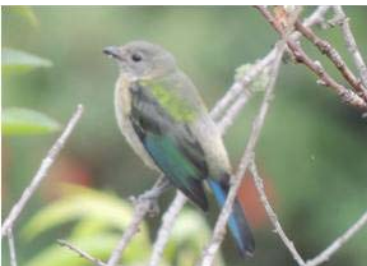
77 Tangara cyanoptera (H) (AOG) THRAUPIDAE