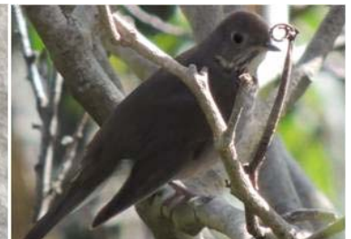
56 Catharus ustulatus (AOG) TURDIDAE