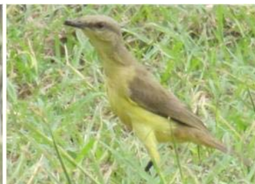
39 Machetornis rixosa (LRP) TYRANNIDAE