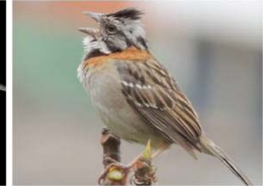
88 Zonotrichia capensis (LRP) EMBERIZIDAE