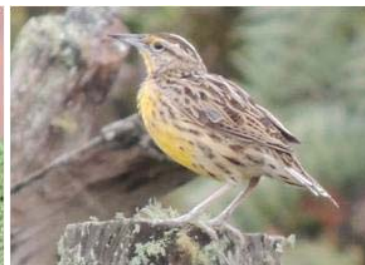
99 Sturnella magna (AOG) ICTERIDAE