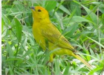
86 Sicalis flaveola (LRP) THRAUPIDAE