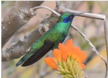
25 Colibri coruscans (AOG) TROCHILIDAE