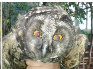
19 Asio Stygius (JSZ) STRIGIDAE