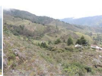
107 Barrio Simón Bolívar