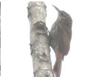
34 Lepidocolaptes lacrymiger FURNARIIDAE