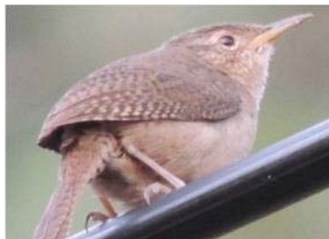
54 Troglodytes aedon (LRP) TROGLODYTIDAE