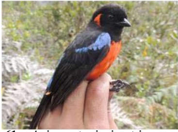
61 Anisogantus igniventris (AOG) THRAUPIDAE