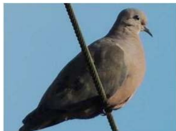
14 Zenaida auriculata (AOG) COLUMBIDAE