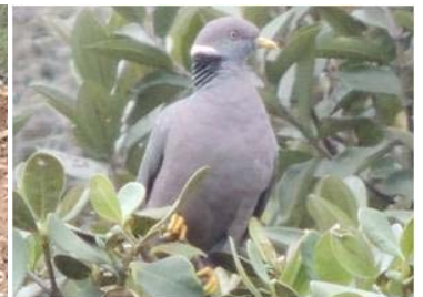
12 Patagioenas fasciata (AOG) COLUMBIDAE