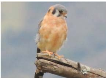
9 Falco sparverius (AOG) FALCONIDAE