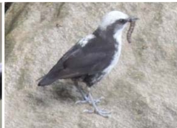
55 Cinclus leucocephalus (AOG) CINCLIDAE