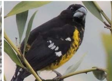
91 Pheucticus aureoventris (JSZ) CARDINALIDAE