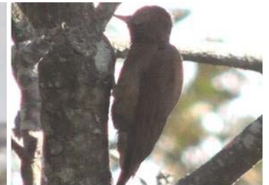
32 Picoides fumigatus (AOG) PICIDAE