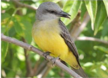
45 Tyrannus melancholicus (AOG) TYRANNIDAE