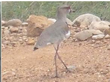
11 Vanellus chilensis (AOG) CHARADRIIDAE