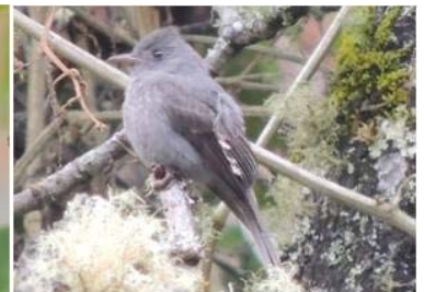
36 Contopus fumigatus (AOG) TYRANNIDAE