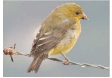
104 Astragalinus psaltria (H) (AOG) FRINGILLIDAE