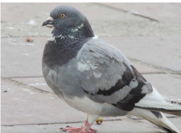
13 Columba livia (AOG) COLUMBIDAE