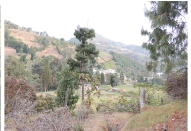
112 Barrio Monteadentro