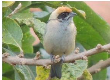
74 Tangara vitriolina (LRP) THRAUPIDAE