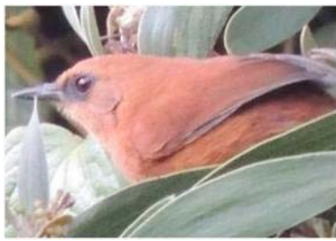
33 Synallaxis unirufa (JSZ) FURNARIIDAE