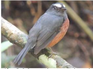
42 Ochthoeca cinnamomeiventris TYRANNIDAE