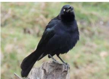
97 Quiscalus lugubris (M) (JSZ) ICTERIDAE