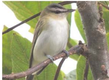
50 Vireo olivaceus (AOG) VIREONIDAE