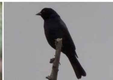
100 Molothrus bonariensis (M) (JSZ) ICTERIDAE