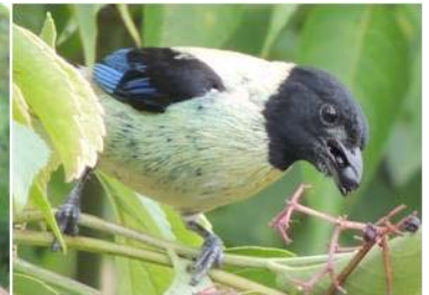
76 Tangara cyanoptera (M) (AOG) THRAUPIDAE