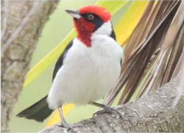
85 Paroaria nigrogularis (AOG) THRAUPIDAE