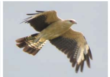
8 Milvago chimachima (AOG) FALCONIDAE