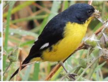
103 Astragalinus psaltria (M) (AOG) FRINGILLIDAE