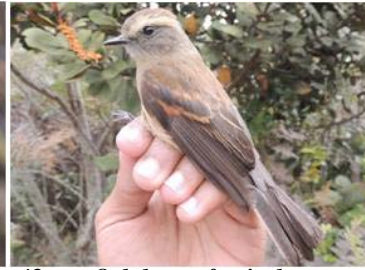
43 Ochthoeca fumicolor (JSZ) TYRANNIDAE