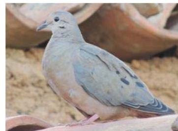
15 Zenaida auriculata (JSZ) COLUMBIDAE