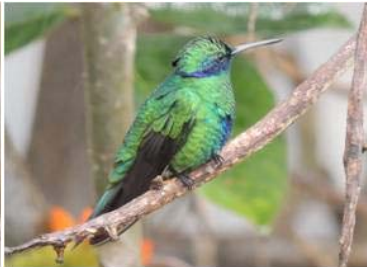
26 Colibri coruscans (AOG) TROCHILIDAE