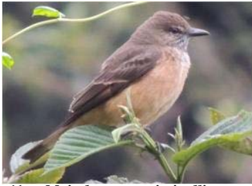
41 Myiotheretes striaticollis (AOG) TYRANNIDAE