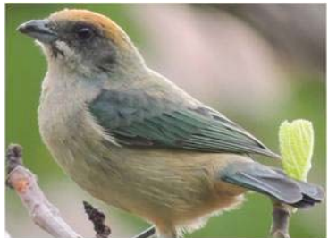
73 Tangara vitriolina (LRP) THRAUPIDAE