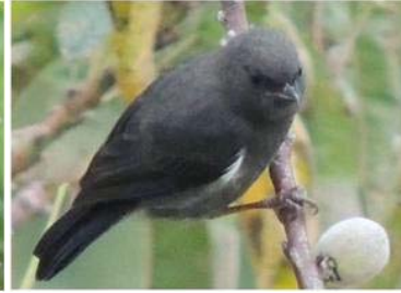
67 Diglossa albilatera (M) (AOG) THRAUPIDAE