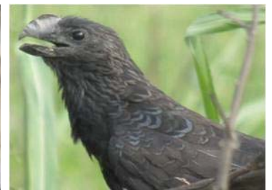
16 Crotophaga ani (AOG) CRACIDAE