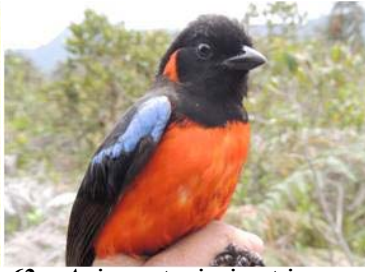
62 Anisogantus igniventris (AOG) THRAUPIDAE