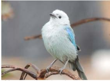
82 Thraupis episcopus (LRP) THRAUPIDAE