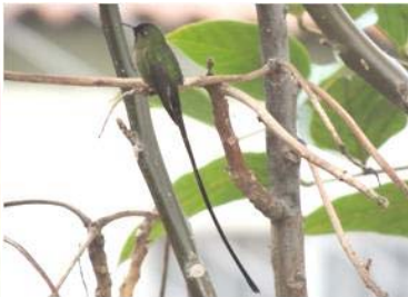
30 Lesbia victoriae (M) (JSZ) TROCHILIDAE