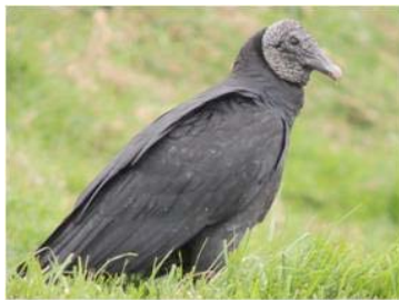
2 Coragyps atratus (AOG) CATHARTIDAE