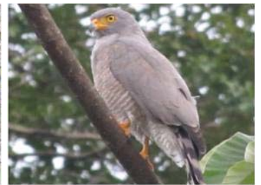
4 Rupornis magnirostris (AOG) ACCIPITRIDAE