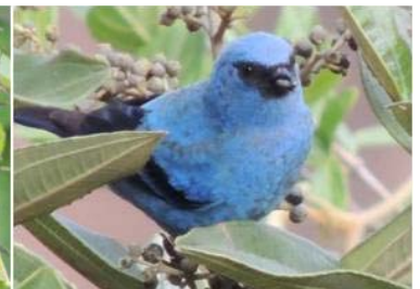
80 Tangara vassorii (AOG) THRAUPIDAE