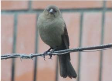
101 Molothrus bonariensis (H) (AOG) ICTERIDAE