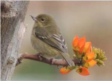
69 Diglossa sittoides (H) (AOG) THRAUPIDAE