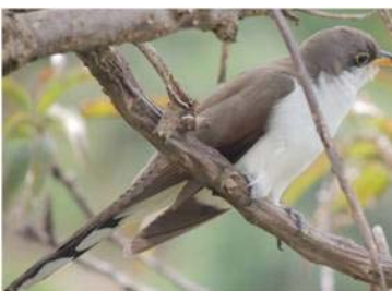
18 Coccyzus americanus (AOG) CUCULIDAE