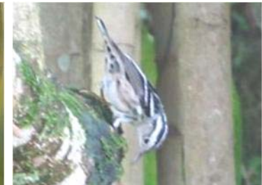
92 Mniotilta varia (LRP) PARULIDAE