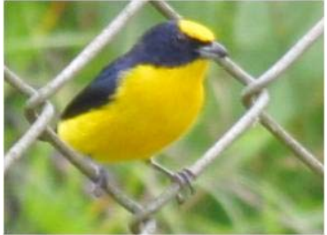
105 Euphonia laniirostris (M) (LRP) FRINGILLIDAE