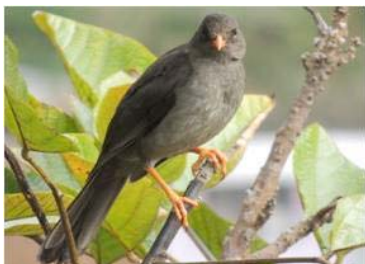
57 Turdus fuscater (AOG) TURDIDAE