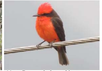
44 Pyrocephalus rubinus (AOG) TYRANNIDAE