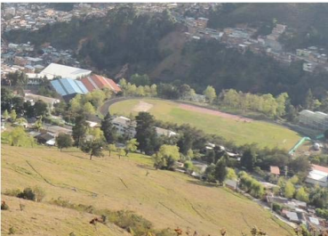
109 Campus Universidad de Pamplona