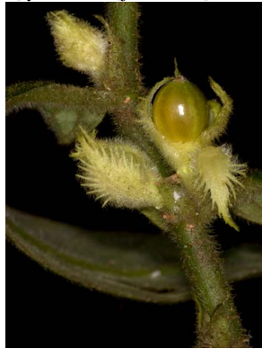
22 Columnnea fuscihirta