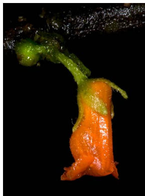
18 Besleria sp.4