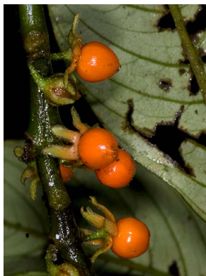
17 Besleria sp.4