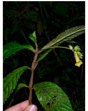
55 Gasteranthus wendlandianus