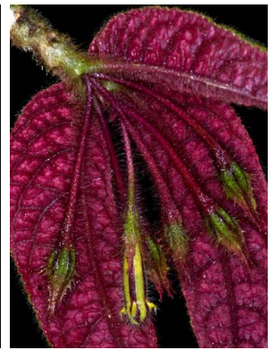
30 Columnnea purpureovittata