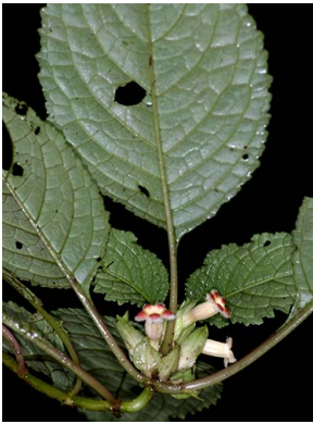
46 Drymonia foliacea