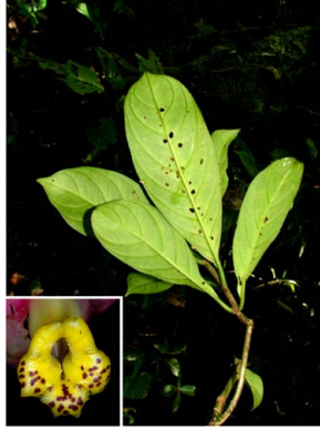
43 Drymonia coccinea