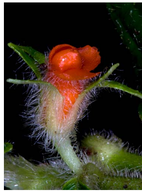
9 Besleria comosa