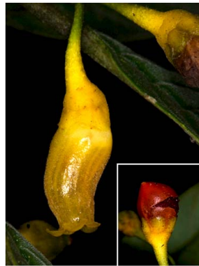
14 Besleria sp.2