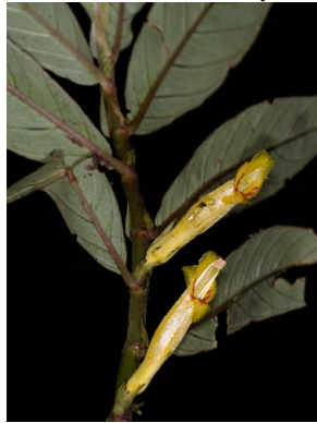
23 Columnnea guttata