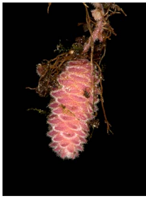
7 Amalophyllon divaricatum