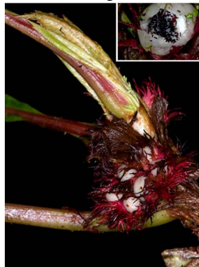
69 Paradyrmonia metamorphophylla