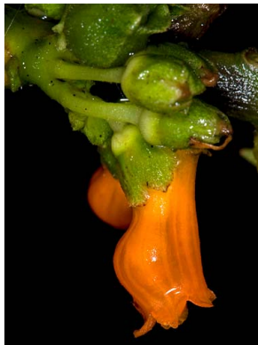
12 Besleria sp.1