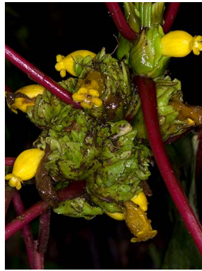
49 Drymonia urceolata