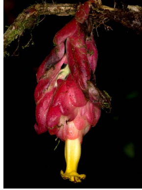
44 Drymonia coccinea