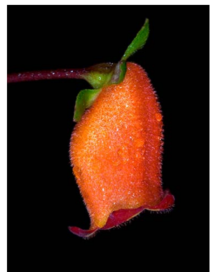
80 Seemannia sylvatica