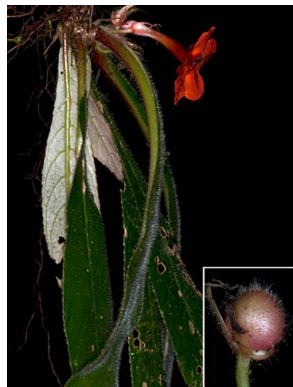
73 Paradyrmonia ulei