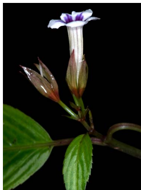
38 Diastema sp.