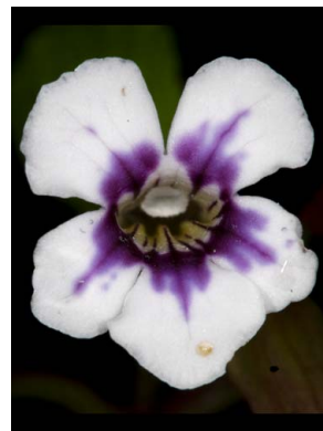
39 Diastema sp.