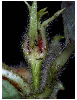
10 Besleria comosa Fruto