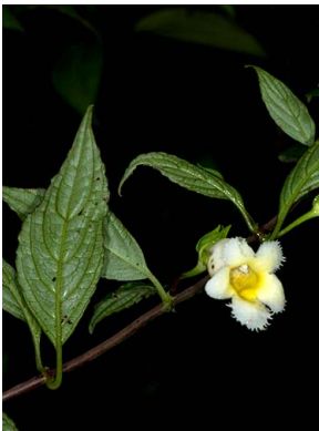
51 Drymonia aff. warszewicziana