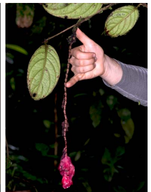
40 Drymonia coccinea