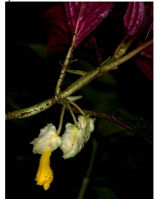
65 Glossoloma tetragonoides