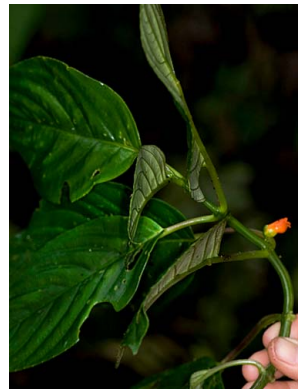
15 Besleria sp.3