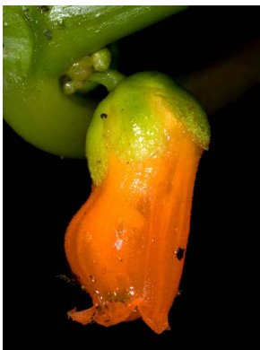
16 Besleria sp.3