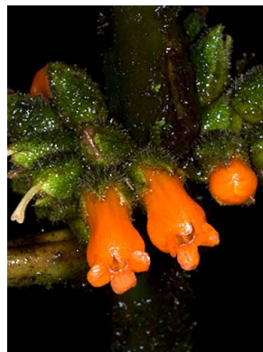
19 Besleria sp.5