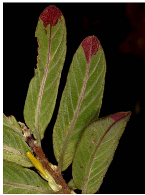
27 Columnnea orientandina