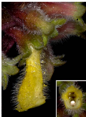
58 Glossoloma martinianum