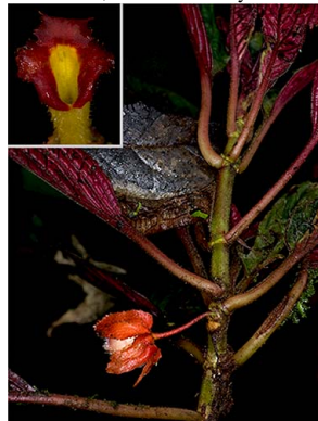
63 Glossoloma tetragonoides