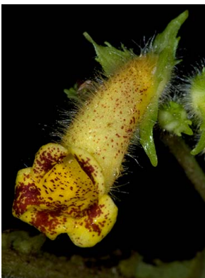
56 Gasteranthus wendlandianus