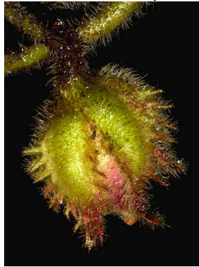
3 Alloplectus weirii Fruto