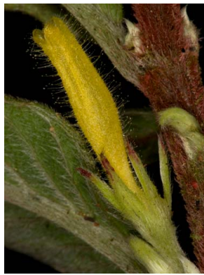
28 Columnnea orientandina