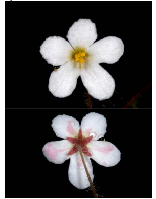
5 Amalophyllon divaricatum