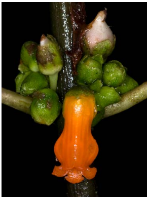
11 Besleria sp.1