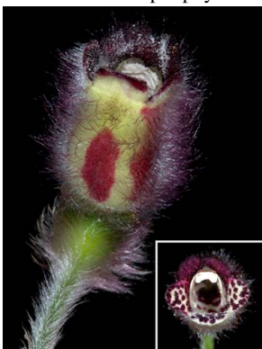
76 Pearcea purpurea