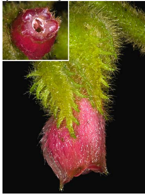
2 Alloplectus weirii