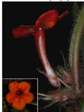
74 Paradyrmonia ulei