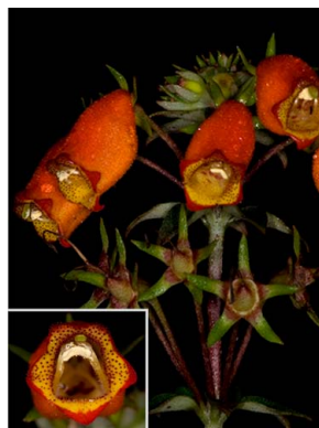
79 Seemannia sylvatica