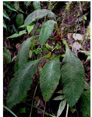
70 P. metamorphophylla L. Clavijo