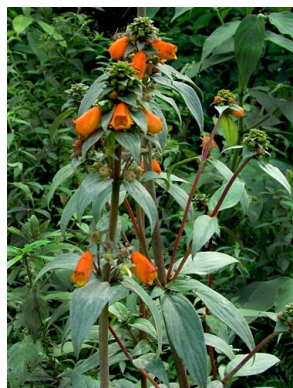
78 Seemannia sylvatica