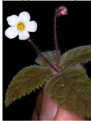
4 Amalophyllon divaricatum