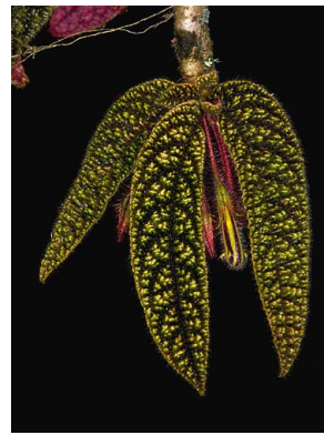
29 Columnnea purpureovittata