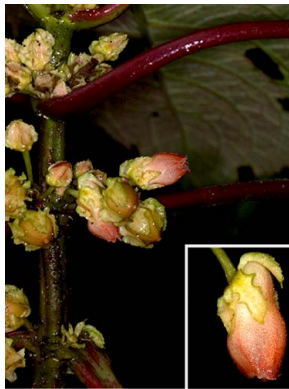
53 Drymonia sp.