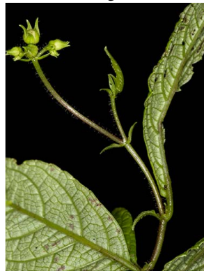
68 Monopyle sp.