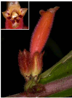
26 Columnnea inaequilatera