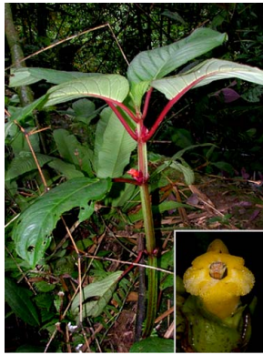
48 Drymonia urceolata