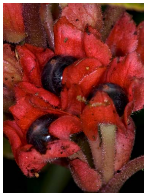
37 Corytoplectus speciosus