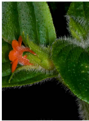
8 Besleria comosa