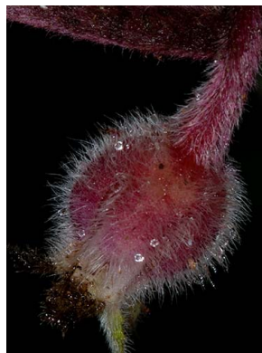
59 Glossoloma martinianum Fruto