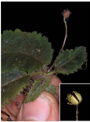
6 Amalophyllon divaricatum