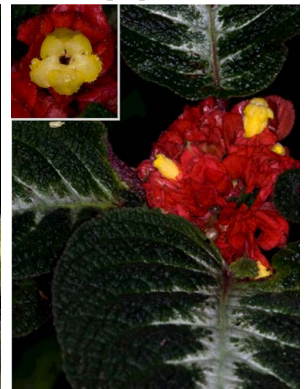
35 Corytoplectus speciosus