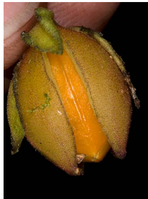
54 Drymonia sp. Fruto