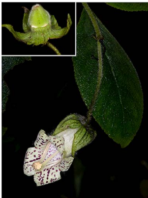
66 Kohleria tigridia