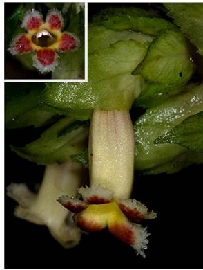
47 Drymonia foliacea