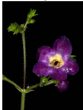
67 Monopyle sp.