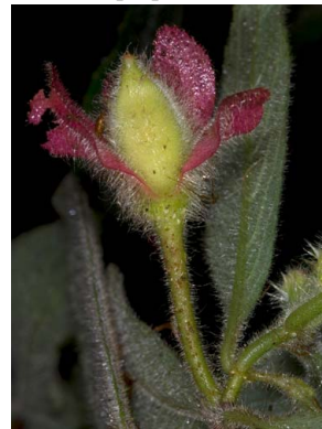
34 Columnnea sp.