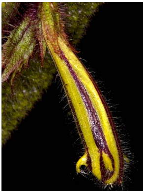
31 Columnnea purpureovittata