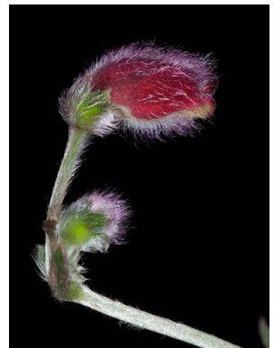
75 Pearcea purpurea