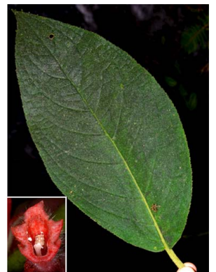
60 Glossoloma schultzei