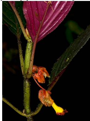
64 Glossoloma tetragonoides