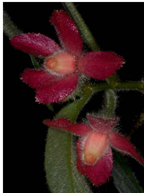
33 Columnnea sp.