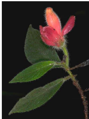
32 Columnnea sp.