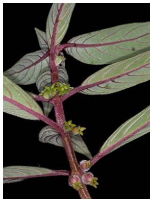
57 Glossoloma martinianum