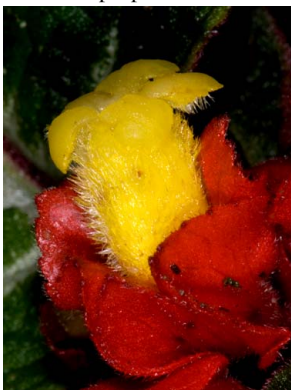
36 Corytoplectus speciosus