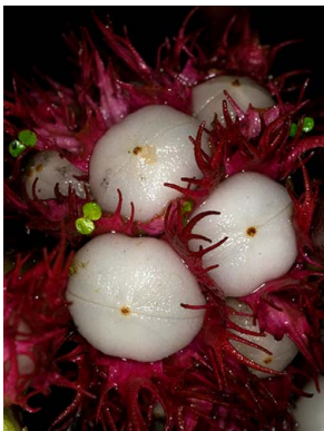
71 Paradyrmonia metamorphophylla