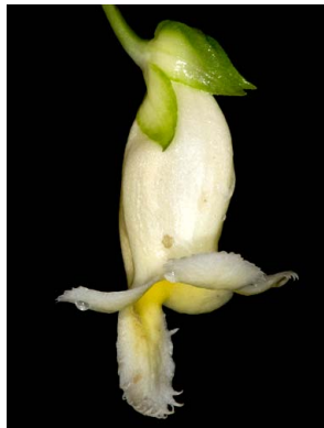
52 Drymonia aff. warszewicziana