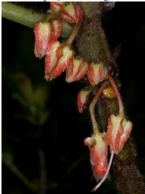
61 Glossoloma schultzei

© L. Clavijo [lauriclav@gmail.com] y J.L. Clark [jlc@ua.edu]; Gracias a M. Chocce, M. Overstreet y J. Pérez por su apoyo durante el trabajo de campo. 468 versión 1 04/2013