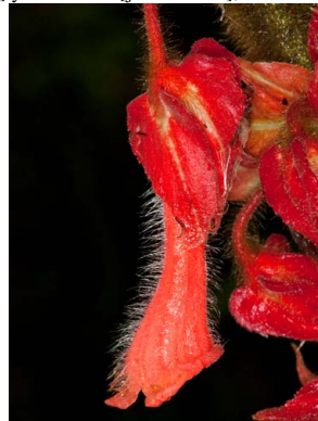
62 Glossoloma tetragonoides