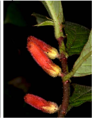
25 Columnnea inaequilatera