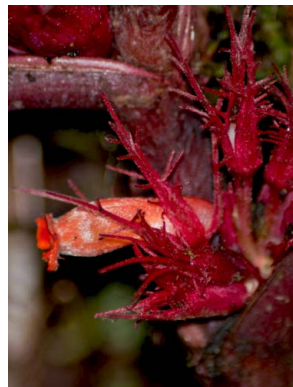
72 P. metamorphophylla O. Marín