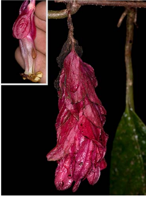
41 Drymonia coccinea

© L. Clavijo [lauriclav@gmail.com] y J.L. Clark [jlc@ua.edu]; Gracias a M. Choce, M. Overstreet y J. Pérez por su apoyo durante el trabajo de campo. 468 versión 1 04/2013