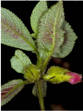
1 Alloplectus weirii

Gracias a M. Chocce, M. Overstreet y J. Pérez por su apoyo durante el trabajo de campo. 468 versión 1 04/2013