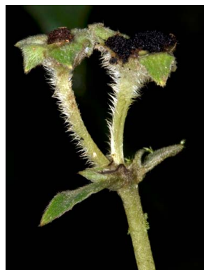
77 Pearcea purpurea