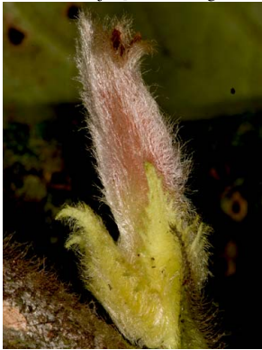
21 Columnnea fuscihirta

© L. Clavijo [lauriclav@gmail.com] y J.L. Clark [jlc@ua.edu]; Gracias a M. Chocce, M. Overstreet y J. Pérez por su apoyo durante el trabajo de campo. 468 versión 1 04/2013