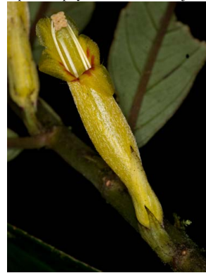
24 Columnnea guttata