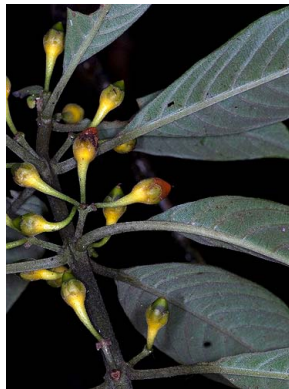
13 Besleria sp.2