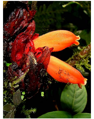
50 Drymonia urceolata