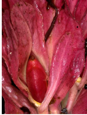
42 Drymonia coccinea Fruto