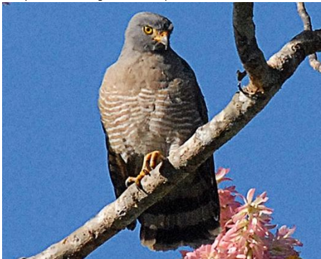
2. Buteo magnirostris (AHAF) Gavilán caminero ACCIPITRIDAE