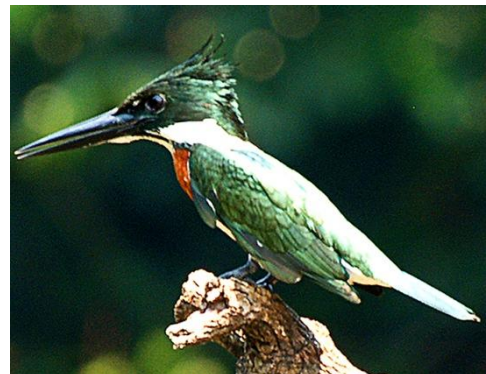
9. Chloroceryle amazona (AHAF) Martín-pescador matraquero ALCEDINIDAE