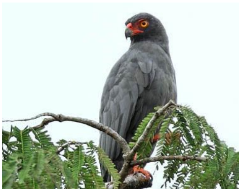
7. Leucopternis schistaceus (EE) Gavilán patirrojo ACCIPITRIDAE