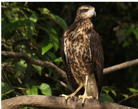
4. Buteogallus urubitinga (Juv) (AHAF) Cangrejero grande ACCIPITRIDAE