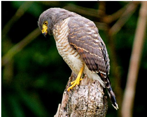
1. Buteo magnirostris (AHAF) Gavilán caminero ACCIPITRIDAE

© Diana M. Pinto O, Camilo Rodríguez L, Axel Henry Antoine-Feill y Álvaro E. Rodríguez T. Guía rápida a color de las aves de la Reserva Natural Palmarí, Amazonas-Brasil #1 versión 1, 01/2013.