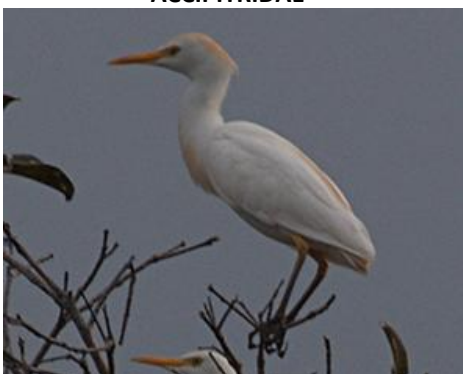
11. Ardea alba (AHAF) Garza real ARDEIDAE