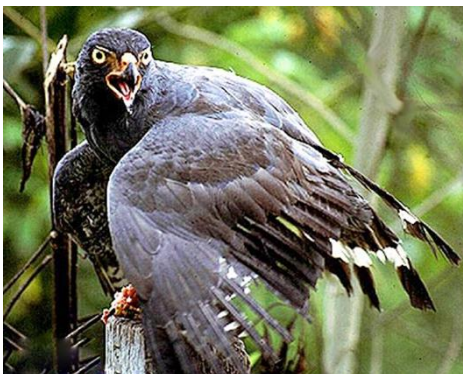
8. Leucopternis schistaceus (AHAF) Gavilán patirrojo ACCIPITRIDAE