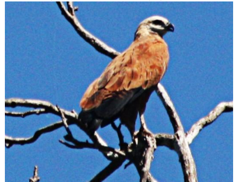
3. Busarellus nigricollis (CRL) Gavilán cienaguero ACCIPITRIDAE