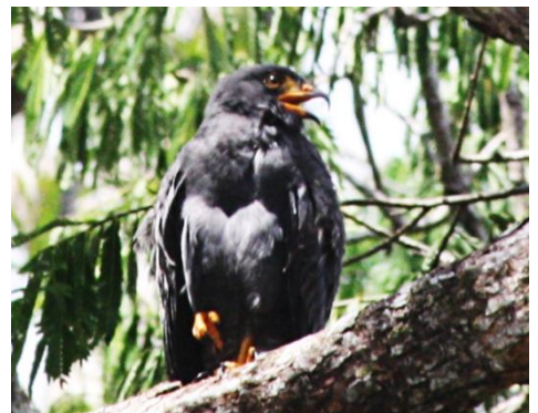
6. Helicolestes hamatus (DMPO) Caracolero negro ACCIPITRIDAE