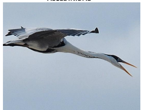
12. Ardea cocoi (AHAF) Garzón azul ARDEIDAE