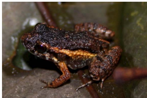
63 Leptodactylus cf andreae LEPTODACTYLIDAE