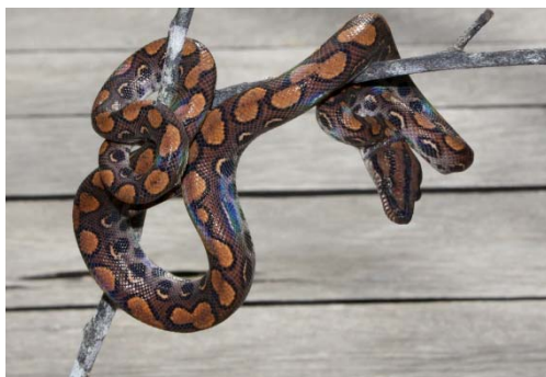
122 Epicrates cenchría BOIDAE