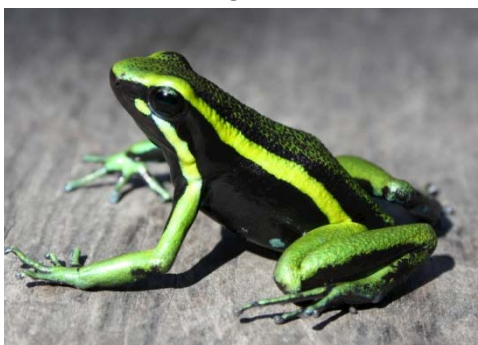
20 Ameerega trivittata DENDROBATIDAE