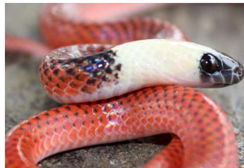
127 Drepanoides anomalus COLUBRIDAE