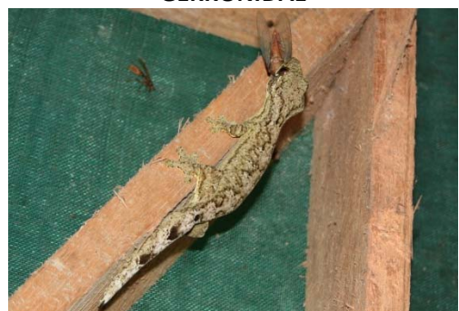
94 Thecadactylus rapicauda PHYLLODACTYLIDAE