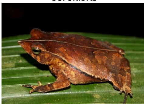
11 Rhinella margaritifera BUFONIDAE