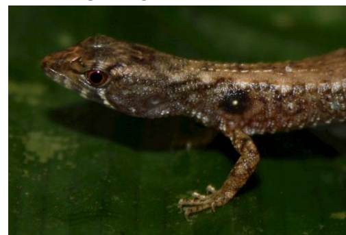
90 Potamites ecpleopus GYMNOPHTHALMIDAE