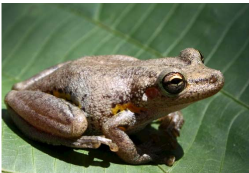
52 Scinax cf. Iquitorum HYLIDAE