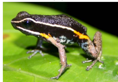
18 Ameerega hahneli DENDROBATIDAE