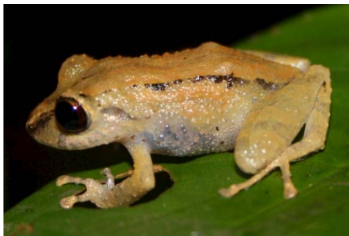
73 Pristimantis cf delius STRABOMANTIDAE

Guía Rápida a Color de los Anfibios y Reptiles de la Reserva Natural Palmari #1 versión 1, 02/2012