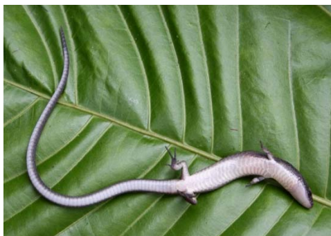
86 Iphisa elegans GYMNOPHTHALMIDAE