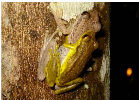
50 Scinax ruber HYLIDAE