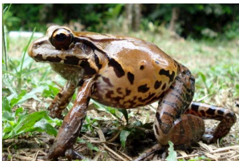
64 Leptodactylus pentadactylus LEPTODACTYLIDAE