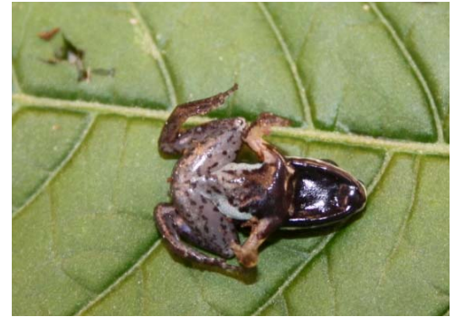
3 Allobates femoralis AROMOBATIDAE