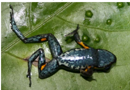
19 Ameerega hahneli DENDROBATIDAE