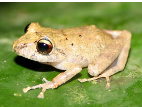
71 Pristimantis achuar STRABOMANTIDAE