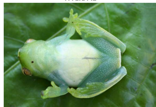
57 Sphaenorhynchus lacteus HYLIDAE