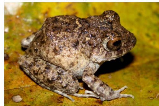
69 Oreobates quixensis STRABOMANTIDAE