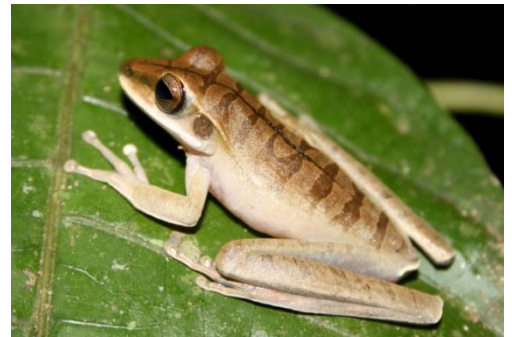
30 Hypsiboas lanciformis HYLIDAE