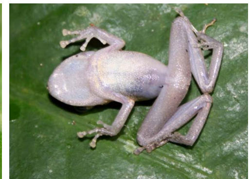
72 Pristimantis achuar STRABOMANTIDAE