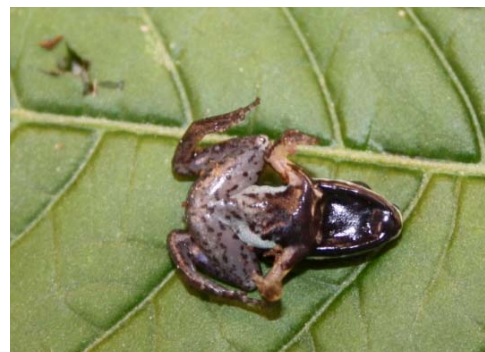
3 Allobates femoralis AROMOBATIDAE