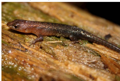
88 Leposoma sp. GYMNOPHTHALMIDAE