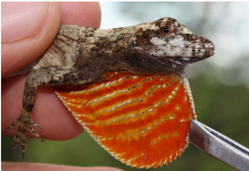
97 Anolis ortonii POLYCHROTIDAE

Guía Rápida a Color de los Anfibios y Reptiles de la Reserva Natural Palmari #1 versión 1, 02/2012