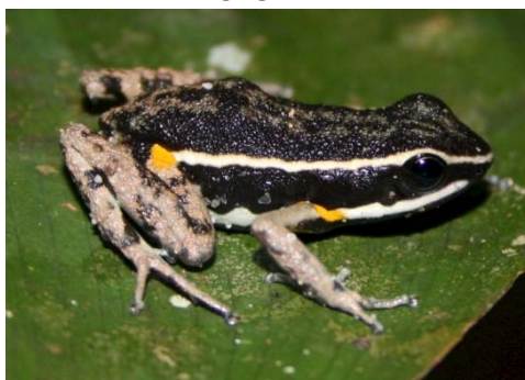
17 Ameerega hahneli DENDROBATIDAE