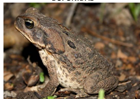
12 Rhinella marina BUFONIDAE