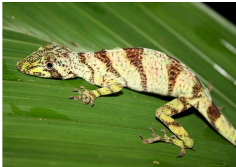
104 Anolis transversalis POLYCHROTIDAE