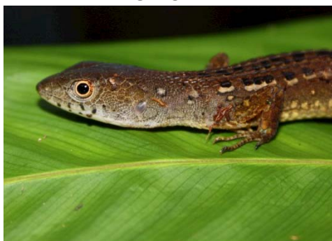
83 Cercosaura sp. GYMNOPHTHALMIDAE