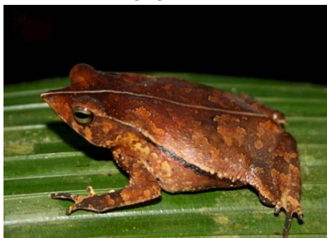
11 Rhinella margaritifera BUFONIDAE