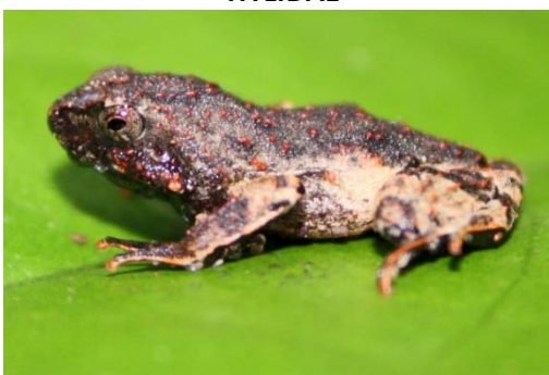
60 Engystomops petersi LEIUPERIDAE