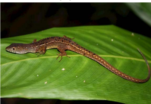
82 Cercosaura sp. GYMNOPHTHALMIDAE