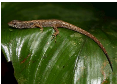
89 Potamites ecpleopus GYMNOPHTHALMIDAE