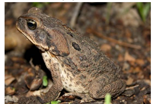
12 Rhinella marina BUFONIDAE