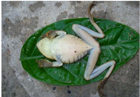
28 Hypsiboas boans HYLIDAE