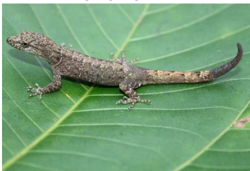
106 Gonatodes albogularis SPHAERODACTYLIDAE