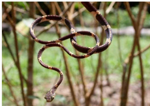
132 Imantodes cenchoa COLUBRIDAE