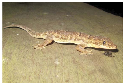
91 Hemidactylus palaichthus GEKKONIDAE