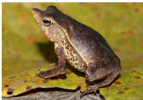
16 Rhinella proboscidea BUFONIDAE