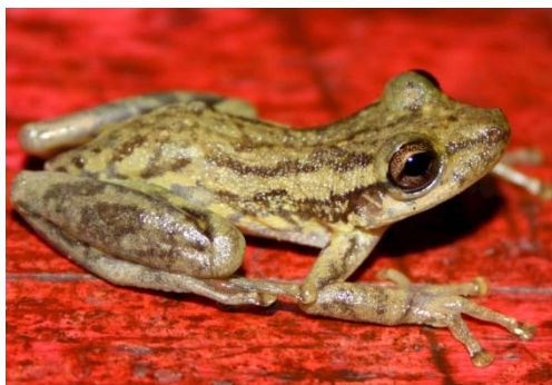
49 Scinax ruber HYLIDAE

Guía Rápida a Color de los Anfibios y Reptiles de la Reserva Natural Palmari #1 versión 1, 02/2012