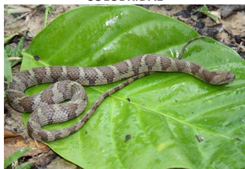
128 Helicops angulatus COLUBRIDAE