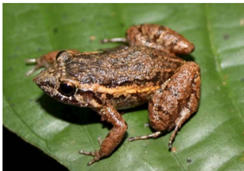
62 Leptodactylus cf andreae LEPTODACTYLIDAE