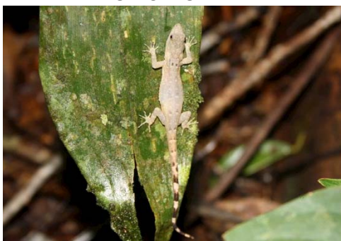
107 Gonatodes albogularis (Foto DMPO) SPHAERODACTYLIDAE