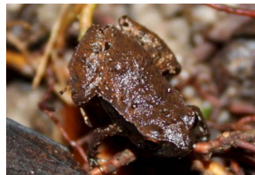
78 Noblella myrmecoides STRABOMANTIDAE