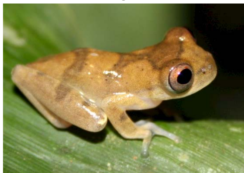
23 Dendropsophus sp. HYLIDAE