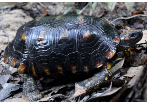
137 Chelonoidis denticulata TESTUDINIDAE