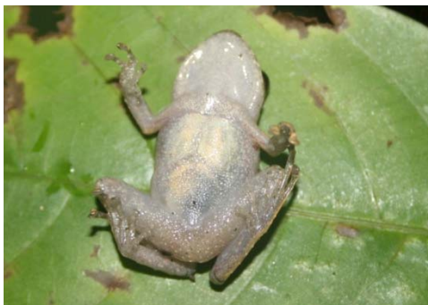
74 Pristimantis cf delius STRABOMANTIDAE