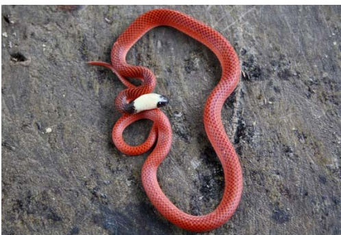
125 Drepanoides anomalus COLUBRIDAE