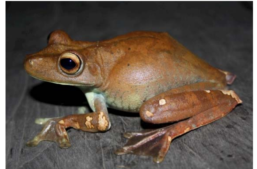
27 Hypsiboas boans HYLIDAE