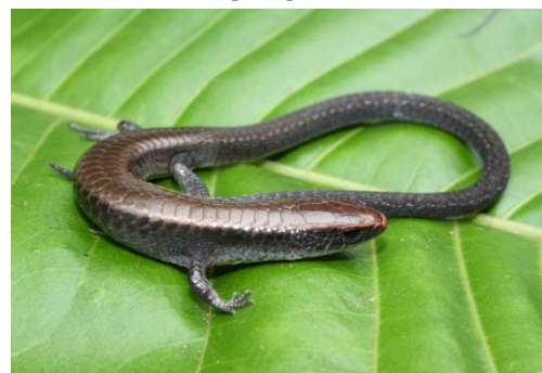
84 Iphisa elegans GYMNOPHTHALMIDAE