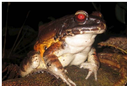
65 Leptodactylus stenodema LEPTODACTYLIDAE