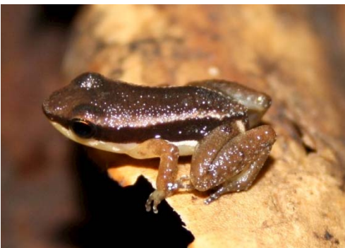
4 Allobates trilineatus (Foto AERT) AROMOBATIDAE