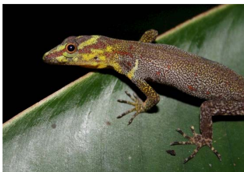
120 Gonatodes humeralis SPHAERODACTYLIDAE