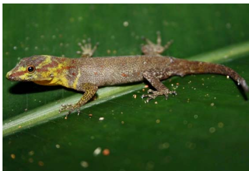
109 Gonatodes humeralis SPHAERODACTYLIDAE

Guía Rápida a Color de los Anfibios y Reptiles de la Reserva Natural Palmari #1 versión 1, 02/2012