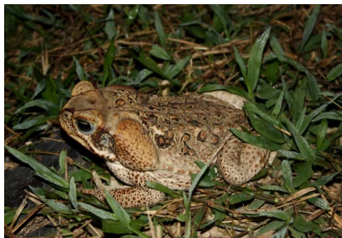
13 Rhinella marina BUFONIDAE

Guía Rápida a Color de los Anfibios y Reptiles de la Reserva Natural Palmari #1 versión 1, 02/2012