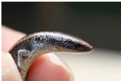
85 Iphisa elegans GYMNOPHTHALMIDAE

Guía Rápida a Color de los Anfibios y Reptiles de la Reserva Natural Palmari #1 versión 1, 02/2012