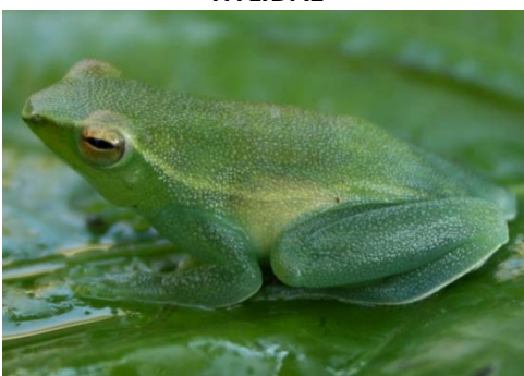
56 Sphaenorhynchus lacteus (Foto AERT) HYLIDAE