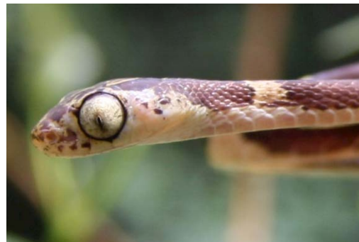
133 Imantodes cenchoa COLUBRIDAE