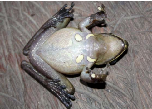
31 Hypsiboas lanciformis HYLIDAE