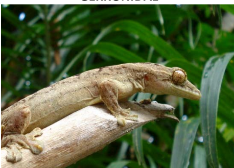
95 Thecadactylus rapicauda PHYLLODACTYLIDAE