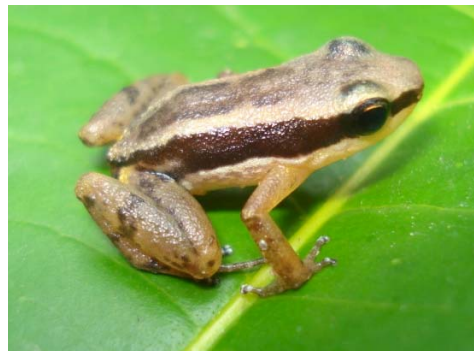
5 Allobates trilineatus AROMOBATIDAE