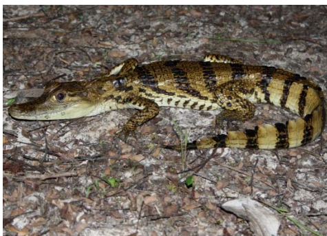
80 Caiman crocodylus (Foto AERT) ALIGATORIDAE