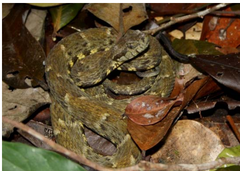
135 Botrox atrox VIPERIDAE