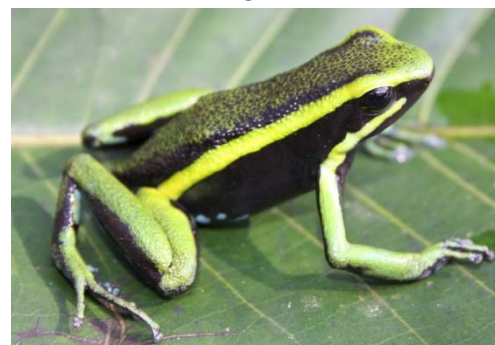
21 Ameerega trivittata DENDROBATIDAE