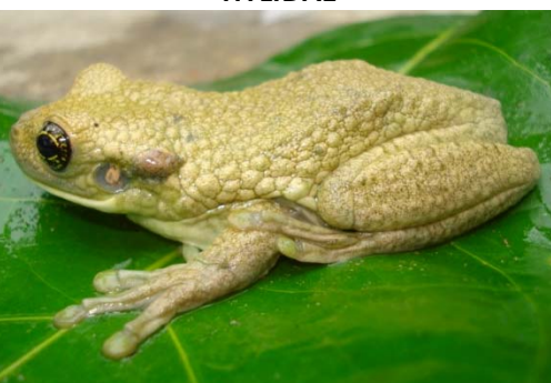
58 Trachycephalus venulosus HYLIDAE