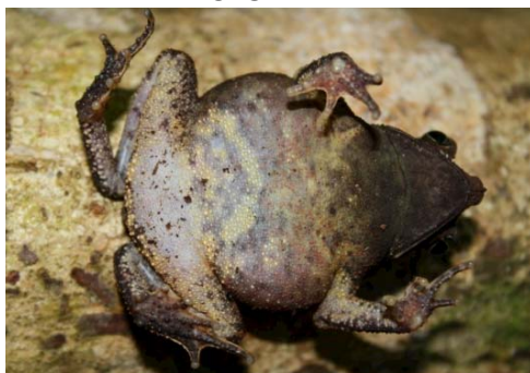
10 Rhinella margaritifera BUFONIDAE