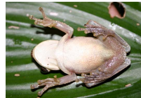
35 Osteocephalus planiceps HYLIDAE