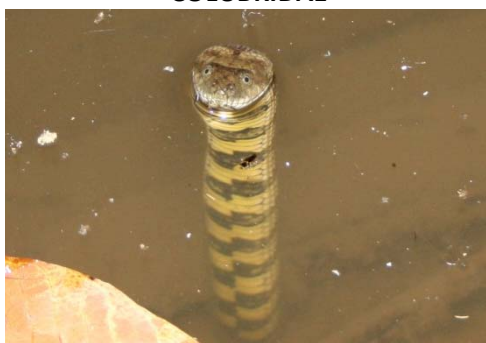
129 Helicops angulatus COLUBRIDAE