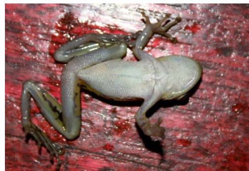
51 Scinax ruber HYLIDAE