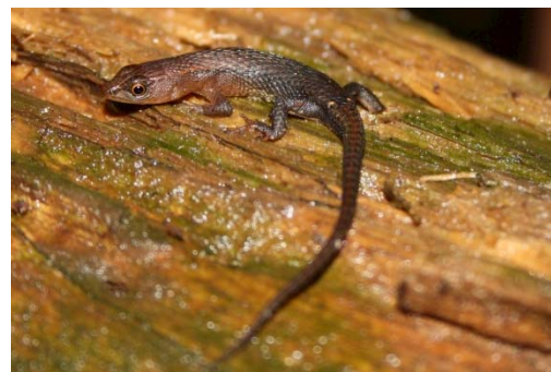
87 Leposoma sp. GYMNOPHTHALMIDAE