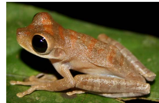
36 Osteocephalus subtilis HYLIDAE