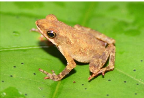
7 Dendrophryniscus minutus BUFONIDAE