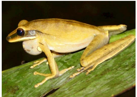
29 Hypsiboas lanciformis HYLIDAE