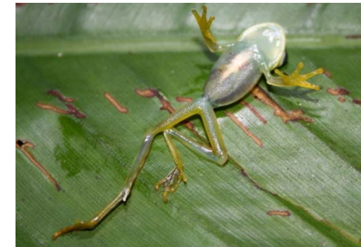
33 Hypsiboas microderma HYLIDAE