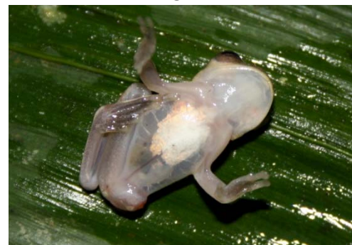
24 Dendropsophus sp. (Foto AERT) HYLIDAE