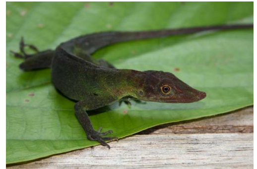
99 Anolis punctata POLYCHROTIDAE