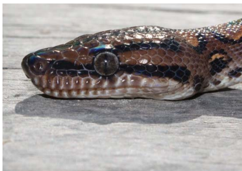
123 Epicrates cenchría BOIDAE