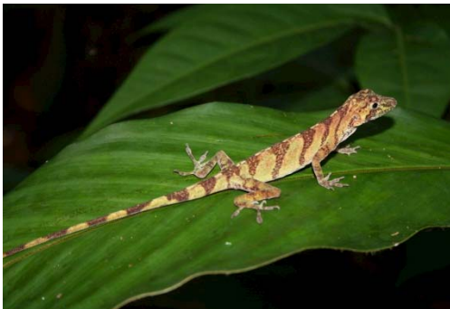
103 Anolis transversalis POLYCHROTIDAE