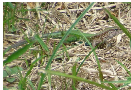
121 Ameiva ameiva TEIIDAE