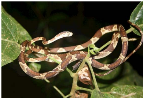
131 Imantodes cenchoa COLUBRIDAE

Guía Rápida a Color de los Anfibios y Reptiles de la Reserva Natural Palmari #1 versión 1, 02/2012