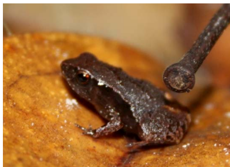
77 Noblella myrmecoides STRABOMANTIDAE