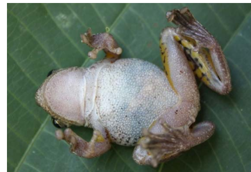
54 Scinax cf. Iquitorum HYLIDAE