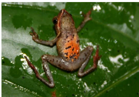
8 Dendrophryniscus minutus BUFONIDAE