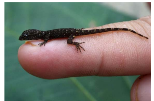
108 Gonatodes albogularis SPHAERODACTYLIDAE