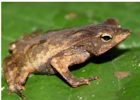
14 Rhinella proboscidea BUFONIDAE