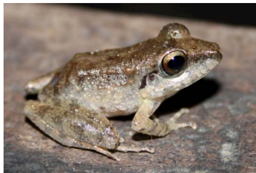
75 Pristimantis malkini STRABOMANTIDAE