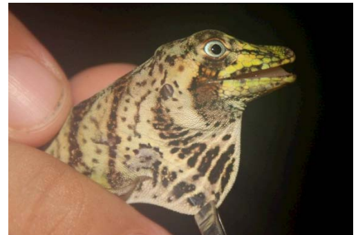
105 Anolis transversalis POLYCHROTIDAE