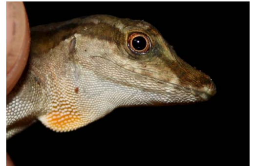
102 Anolis trachyderma POLYCHROTIDAE