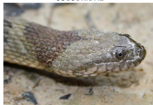
130 Helicops angulatus COLUBRIDAE