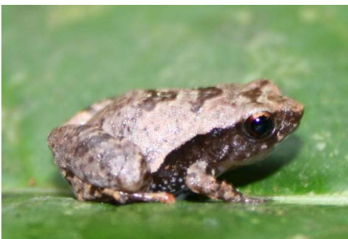
79 Hamptophryne cf boliviana MICROHYLIDAE