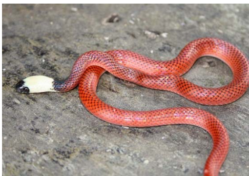
126 Drepanoides anomalus COLUBRIDAE