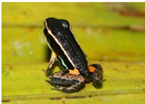
1 Allobates femoralis AROMOBATIDAE

Guía Rápida a Color de los Anfibios y Reptiles de la Reserva Natural Palmari #1 versión 1, 02/2012