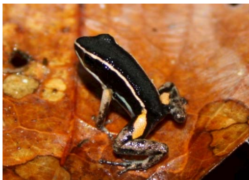
2 Allobates femoralis AROMOBATIDAE