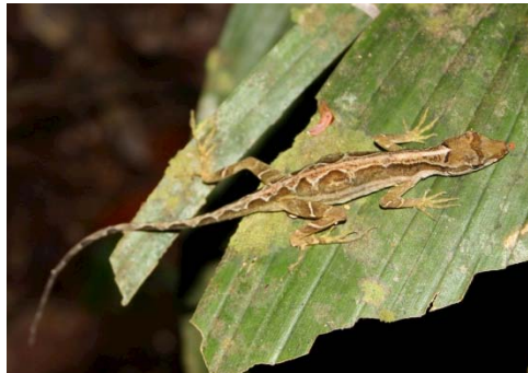
101 Anolis trachyderma POLYCHROTIDAE