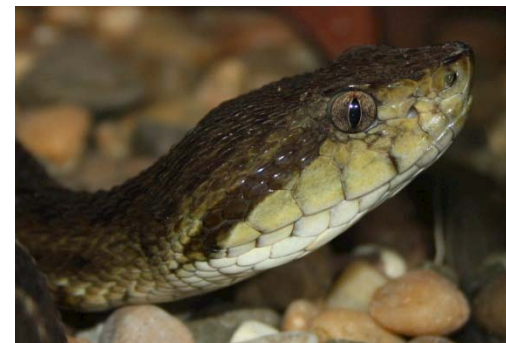
136 Botrox atrox VIPERIDAE