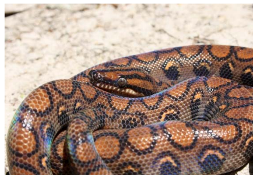
124 Epicrates cenchría BOIDAE