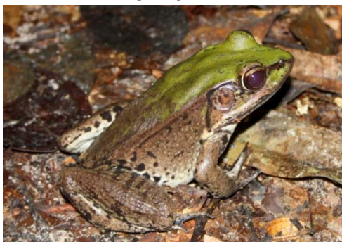
68 Lithobates palmipes RANIDAE