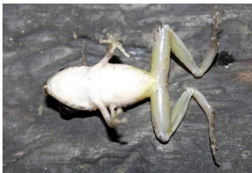
76 Pristimantis malkini STRABOMANTIDAE