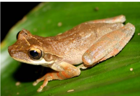
34 Osteocephalus planiceps HYLIDAE