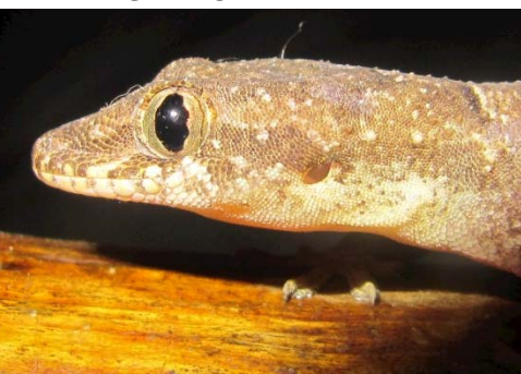
92 Hemidactylus palaichthus GEKKONIDAE