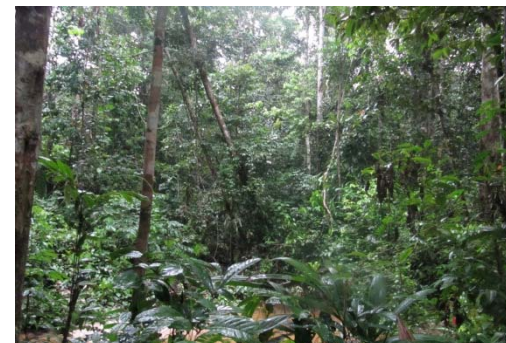
139 Bosque Húmedo Tropical en RNP