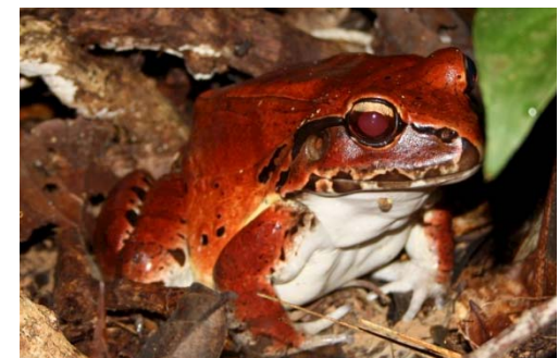
66 Leptodactylus stenodema LEPTODACTYLIDAE