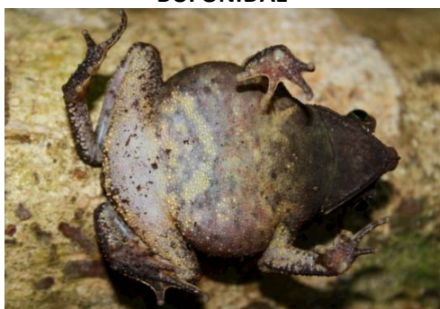
10 Rhinella margaritifera BUFONIDAE