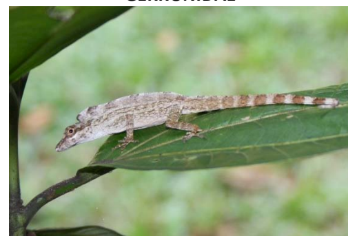
96 Anolis ortonii POLYCHROTIDAE