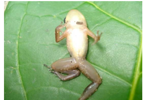
6 Allobates trilineatus AROMOBATIDAE