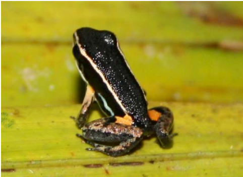
1 Allobates femoralis AROMOBATIDAE

Guía Rápida a Color de los Anfibios y Reptiles de la Reserva Natural Palmari #1 versión 1, 02/2012