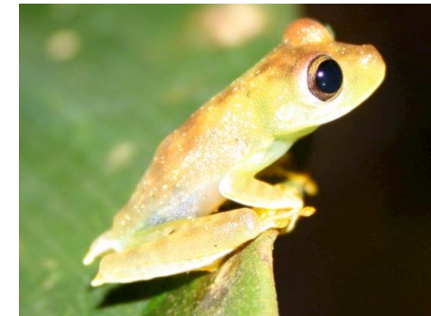
32 Hypsiboas microderma HYLIDAE