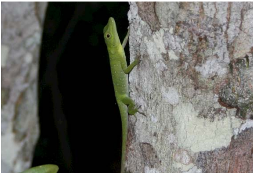
100 Anolis punctata POLYCHROTIDAE