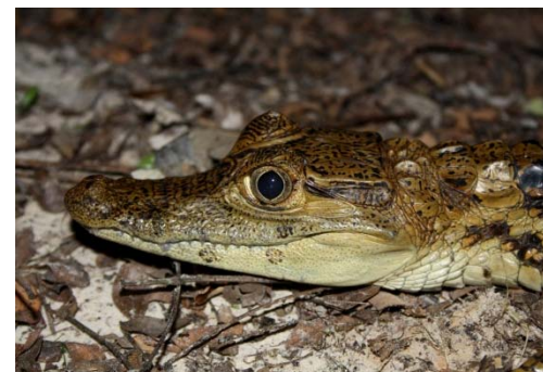
81 Caiman crocodylus ALIGATORIDAE