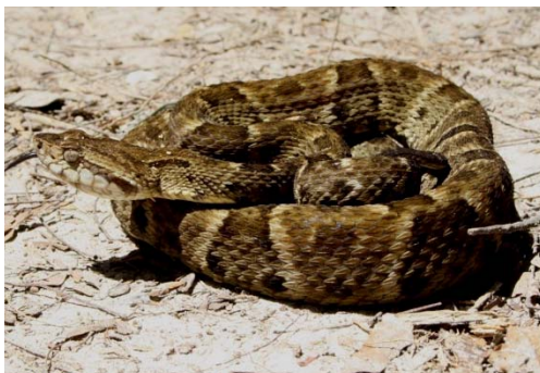
134 Botrox atrox VIPERIDAE