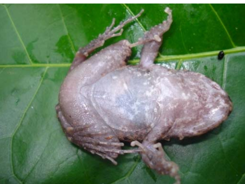
70 Oreobates quixensis STRABOMANTIDAE