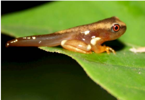
25 Dendropsophus sp. HYLIDAE

Guía Rápida a Color de los Anfibios y Reptiles de la Reserva Natural Palmari #1 versión 1, 02/2012