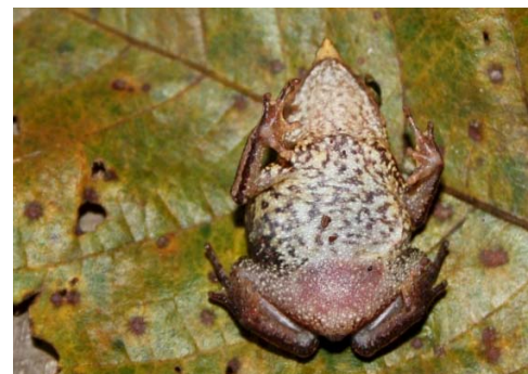
15 Rhinella proboscidea BUFONIDAE