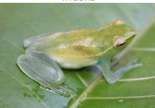
55 Sphaenorhynchus lacteus HYLIDAE