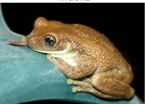
59 Trachycephalus venulosus HYLIDAE