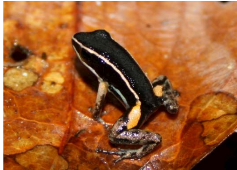
2 Allobates femoralis AROMOBATIDAE