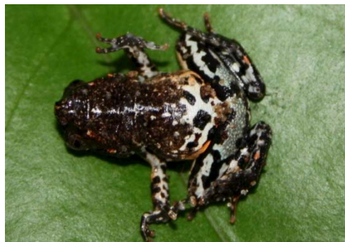
61 Engystomops petersi LEIUPERIDAE

Guía Rápida a Color de los Anfibios y Reptiles de la Reserva Natural Palmari #1 versión 1, 02/2012