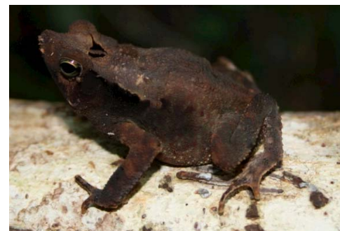
9 Rhinella margaritifera BUFONIDAE