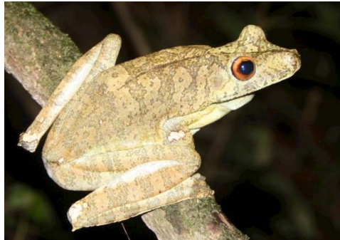
26 Hypsiboas boans HYLIDAE