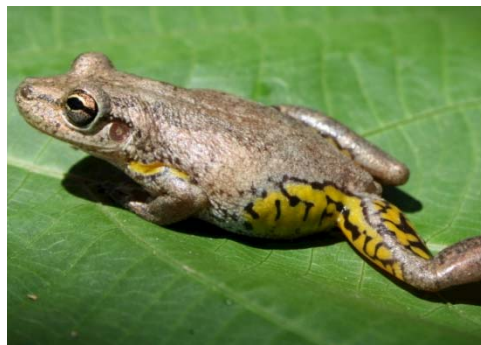
53 Scinax cf. Iquitorum HYLIDAE