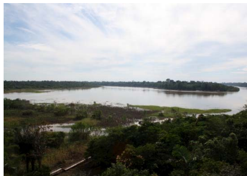
138 Vista del Rio Javari desde RNP