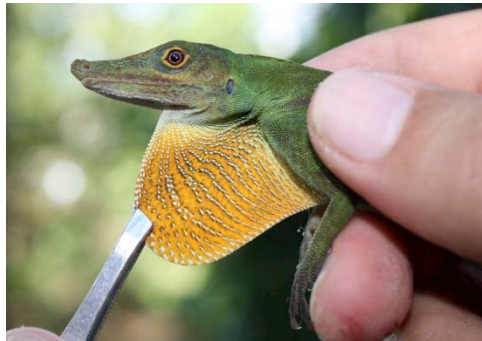
98 Anolis punctata POLYCHROTIDAE