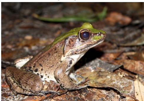
67 Lithobates palmipes RANIDAE