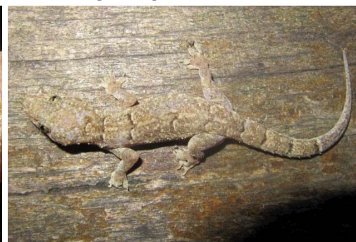
93 Hemidactylus palaichthus GEKKONIDAE