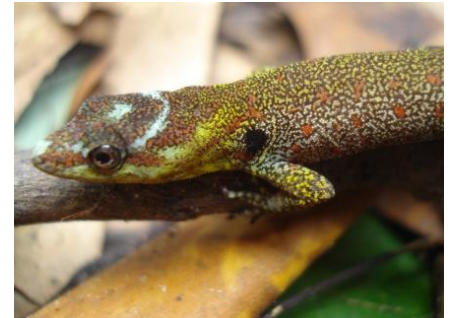
6 Gonatodes humeralis GEKKONIDAE