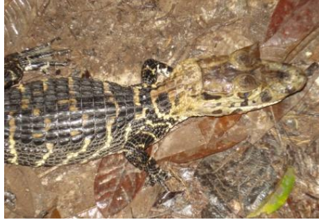
2 Melanosuchus niger (juv) ALIGATORIDAE