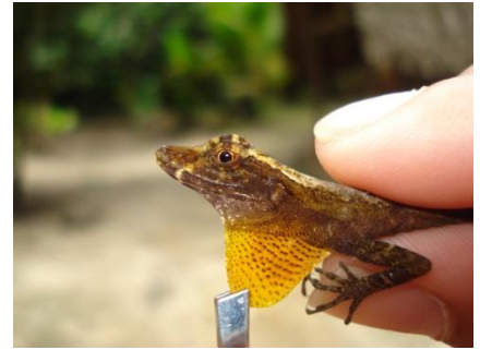
15 Anolis trachyderma POLYCHROTIDAE