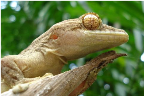
4 Thecadactylus rapicauda GEKKONIDAE