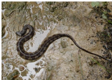
44 Helicops angulatus COLUBRIDAE