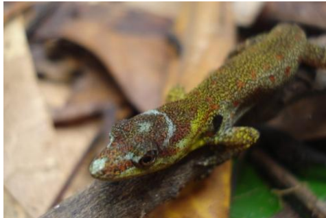
5 Gonatodes humeralis (macho) GEKKONIDAE