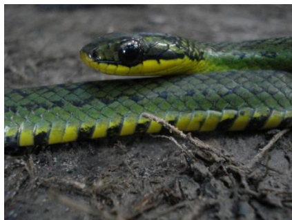
47 Liophis reginae COLUBRIDAE