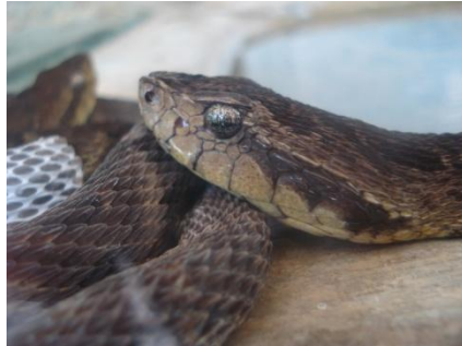
74 Bothrops atrox VIPERIDAE