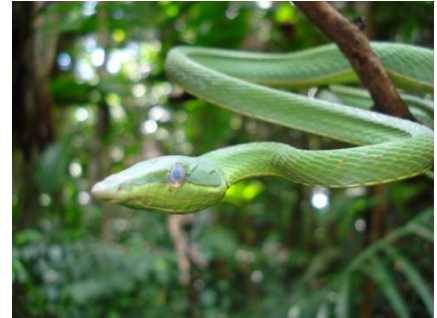
51 Oxybelis fulgidus COLUBRIDAE