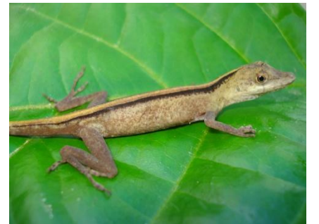
12 Anolis fuscoauratus (hembra) POLYCHROTIDAE