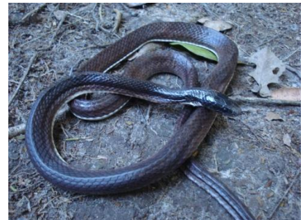
54 Clelia clelia COLUBRIDAE