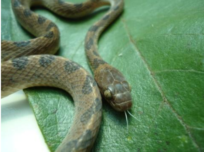
61 Leptoderia annulata COLUBRIDAE