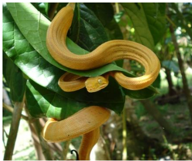
65 Corallus hortulanus BOIDAE