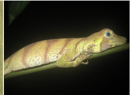
9 Anolis transversalis POLYCHROTIDAE