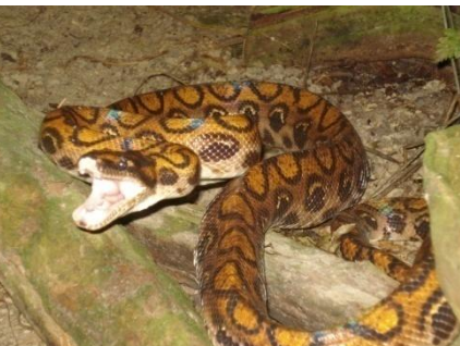
70 Epicrates cenchria BOIDAE