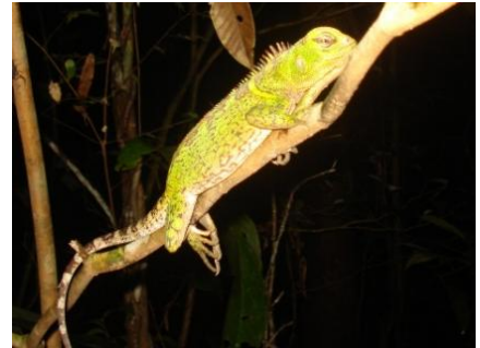
18 Enialyoides laticeps POLYCHROTIDAE