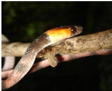
53 Siphlophis compressus COLUBRIDAE