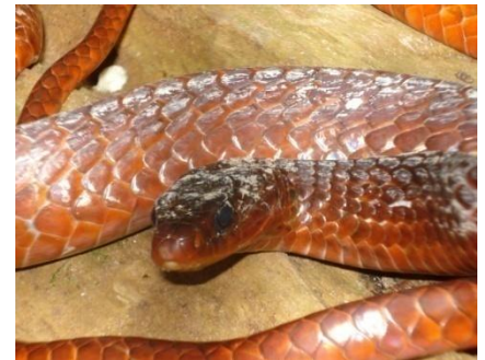
42 Chirronius scurrulus COLUBRIDAE