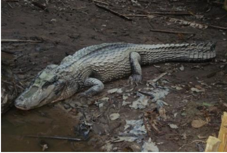
1 Melanosuchus niger ALIGATORIDAE