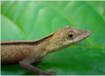
13 Anolis fuscoauratus (hembra) POLYCHROTIDAE