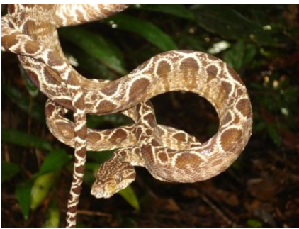
64 Corallus hortulanus BOIDAE