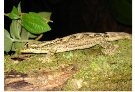
3 Thecadactylus rapicauda GEKKONIDAE