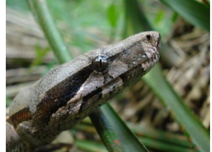
63 Boa constrictor BOIDAE