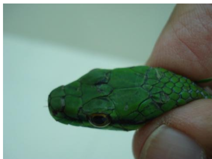
59 Liophis reginae COLUBRIDAE