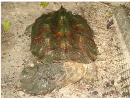
76 Chelus fimbriatus CHELIDAE