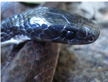
55 Clelia clelia COLUBRIDAE