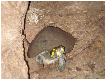
80 Podocnemis unifilis PELOMEDUSIDAE