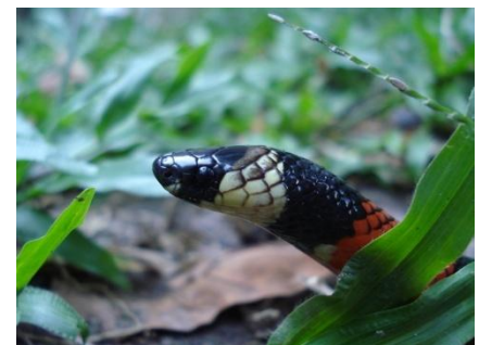
36 Atractus latifrons COLUBRIDAE