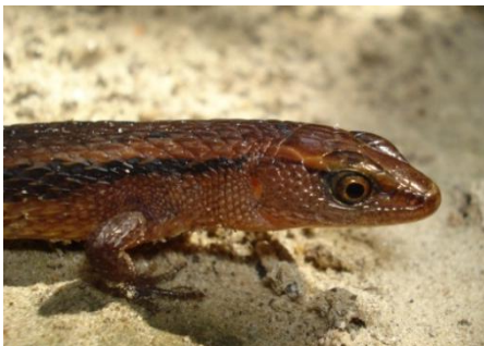
22 Alopoglossus atriventris (Foto CRL) GYMNOPHTHALMIDAE