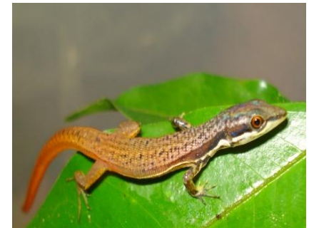
21 Cercosaura argulus GYMNOPHTHALMIDAE