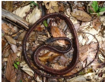
41 Chirronius scurrulus COLUBRIDAE