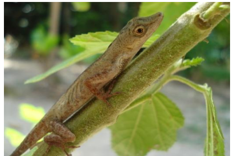
11 Anolis fuscoauratus (macho) POLYCHROTIDAE