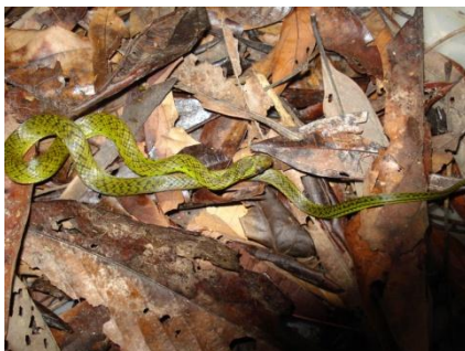
46 Liophis reginae COLUBRIDAE