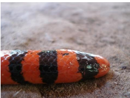
34 Anilius scytale ANILIIDAE