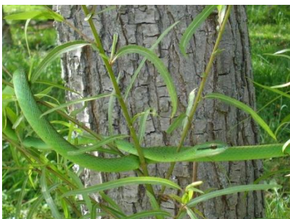
58 Liophis reginae COLUBRIDAE