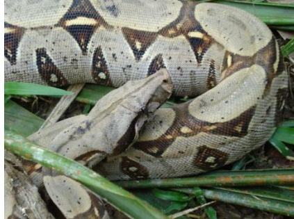
62 Boa constrictor BOIDAE