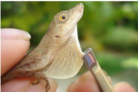
10 Anolis fuscoauratus (macho) POLYCHROTIDAE