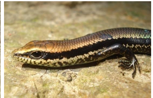
27 Micrablepharus cf. maximiliani GYMNOPHTALMIDAE