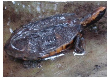
78 Platemys platycephala CHELIDAE