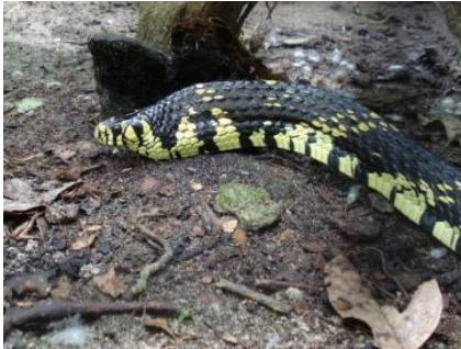
49 Spilotes pullatus COLUBRIDAE