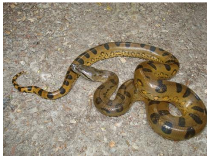
71 Eunectes murinus BOIDAE