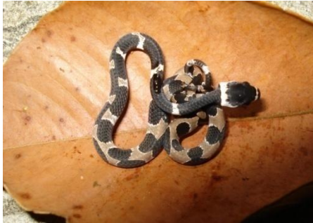
37 Dipsas catesbyi COLUBRIDAE