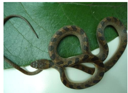
60 Leptoderia annulata COLUBRIDAE