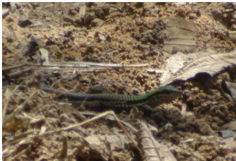
31 Ameiva ameiva (HEMBRA) TEIIDAE