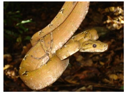
66 Corallus hortulanus BOIDAE