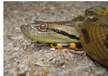
72 Eunectes murinus BOIDAE