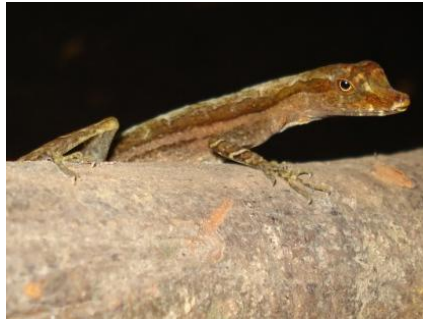
14 Anolis trachyderma POLYCHROTIDAE