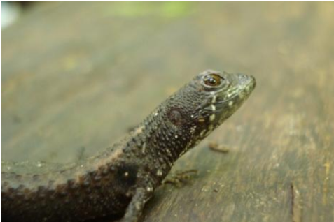
7 Gonatodes sp GEKKONIDAE