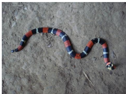
35 Atractus latifrons COLUBRIDAE