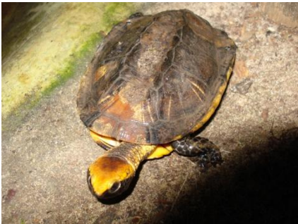
79 Platemys platycephala CHELIDAE