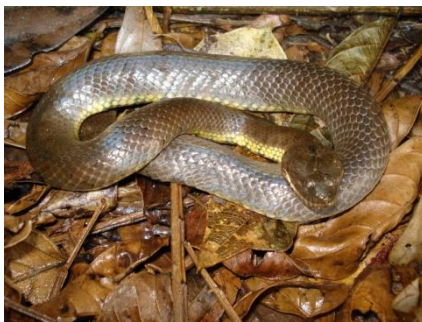
43 Helicops angulatus COLUBRIDAE