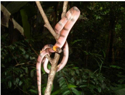
52 Siphlophis compressus COLUBRIDAE