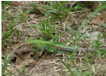
32 Ameiva ameiva (MACHO) TEIIDAE