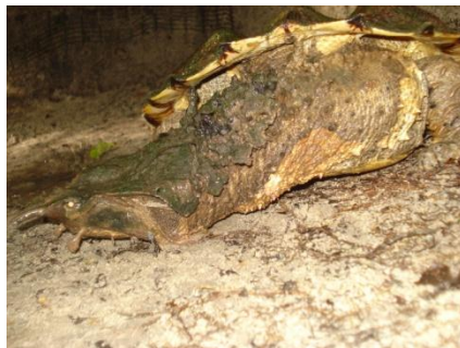
77 Chelus fimbriatus CHELIDAE