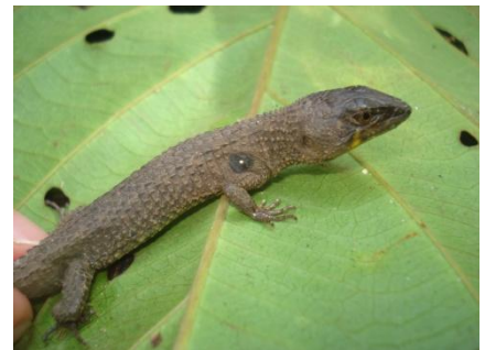
24 Potamites ecleopus GYMNOPHTHALMIDAE