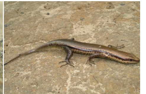
30 Mabuya bistrriata SCINCIDAE