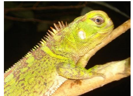
19 Enialyoides laticeps POLYCHROTIDAE