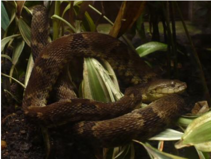
73 Bothrops atrox VIPERIDAE