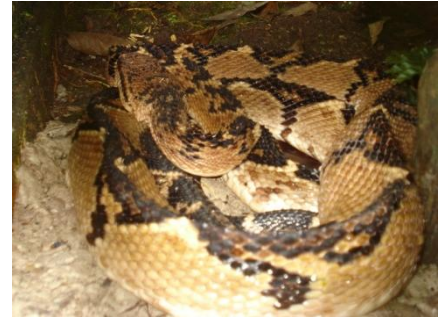
75 Lachesis muta VIPERIDAE