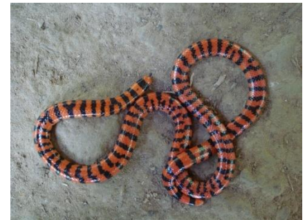
33 Anilius scytale ANILIIDAE