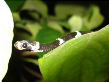
38 Dipsas catesbyi COLUBRIDAE