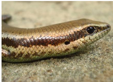
29 Mabuya bistrriata SCINCIDAE