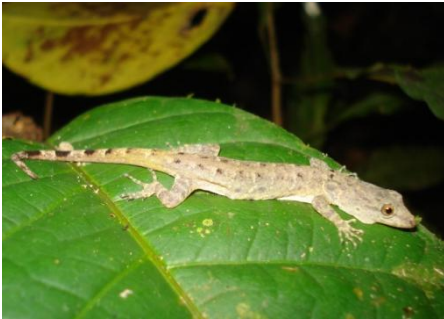
16 Anolis sp. POLYCHROTIDAE