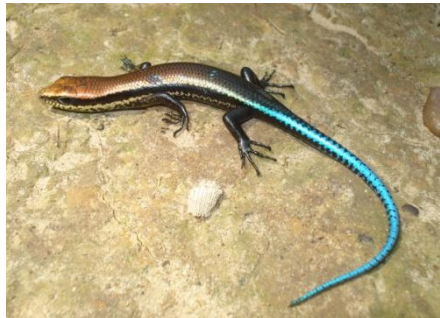
26 Micrablepharus cf. maximiliani GYMNOPHTALMIDAE