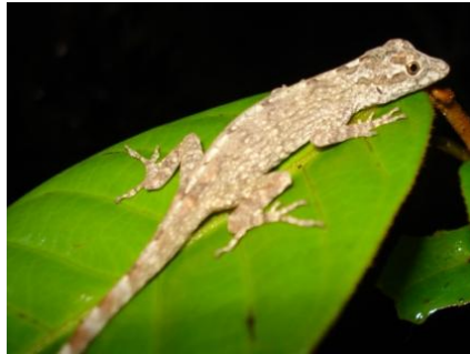
17 Anolis sp. POLYCHROTIDAE