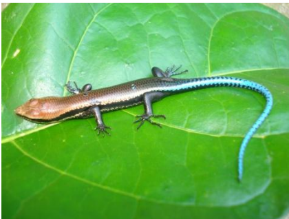
28 Micrablepharus cf. maximiliani GYMNOPHTALMIDAE