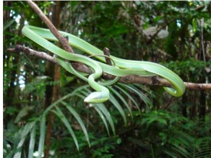
50 Oxybelis fulgidus COLUBRIDAE