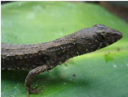
25 Potamites ecleopus GYMNOPHTALMIDAE