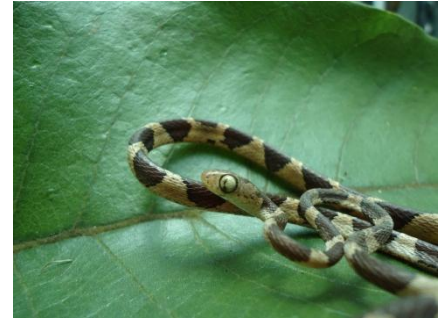
39 Imantodes cenchoa COLUBRIDAE