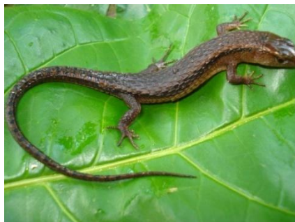
23 Alopoglossus atriventris GYMNOPHTHALMIDAE