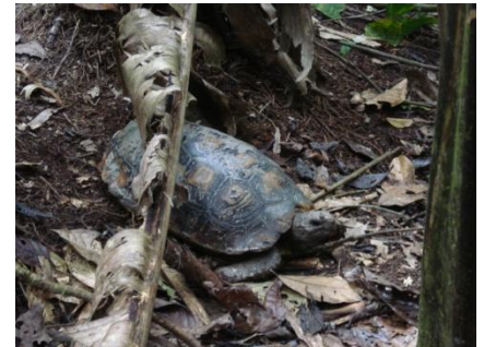
81 Geochelone denticulata TESTUDINIDAE