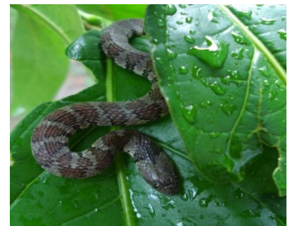
45 Helicops angulatus COLUBRIDAE