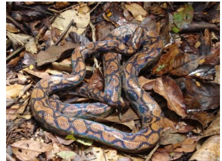
69 Epicrates cenchria BOIDAE