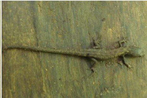
8 Gonatodes sp GEKKONIDAE