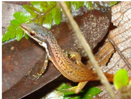
20 Cercosaura argulus GYMNOPHTHALMIDAE