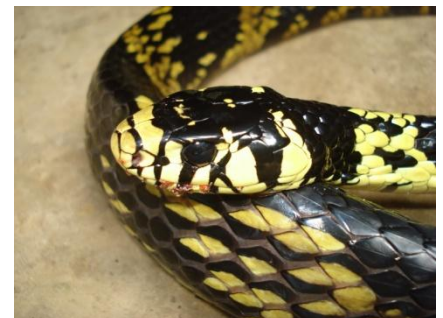
48 Spilotes pullatus COLUBRIDAE