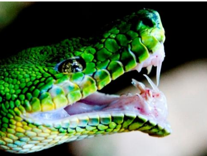
67 Corallus caninus BOIDAE