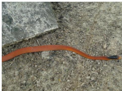
56 Oxyrhopus formosus COLUBRIDAE