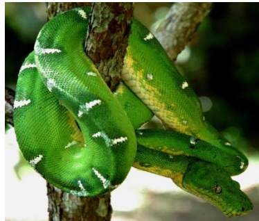
68 Corallus caninus BOIDAE