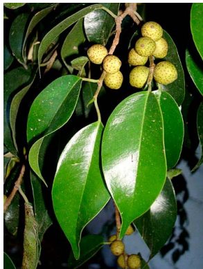
11 Ficus benjamina (cultivado)