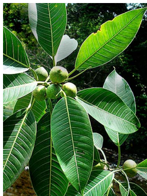
38 Ficus insipida