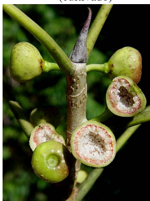
17 Ficus citrifolia