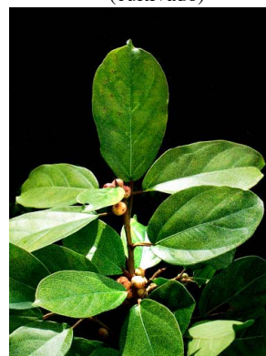
19 Ficus colubrinae