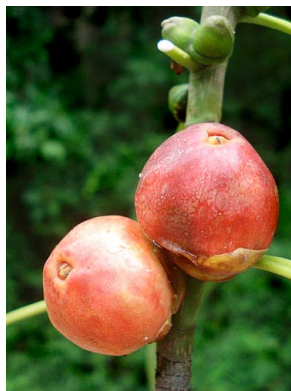
8 Ficus aurea