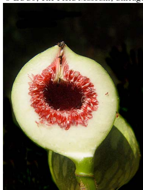
41 Ficus inspida

© G. Cornejo-Tenorio [gcornejo@cieco.unam.mx] y G. Ibarra-Manríquez [gibarra@cieco.unam.mx] Laboratorio de Biogeografía y Conservación, Centro de Investigaciones en Ecosistemas, UNAM. © ECCo, The Field Museum, Chicago, IL 60605 USA. [http://fieldmuseum.org/IDtools] [irrc@fieldmuseum.org] Rapid Color Guide # 394 versión 1 05/2013