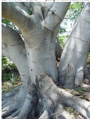
42 Ficus inspida