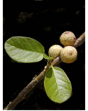
25 Ficus cotinifolia