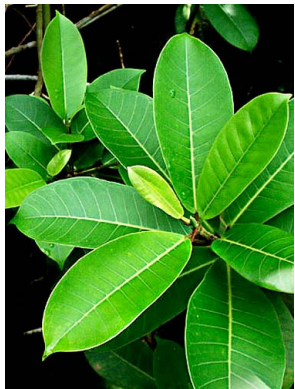
66 Ficus paraensis