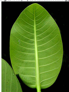
43 Ficus lapathifolia