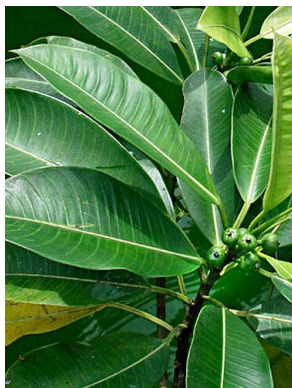
97 Ficus yoponensis