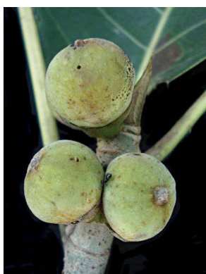
57 Ficus membranacea