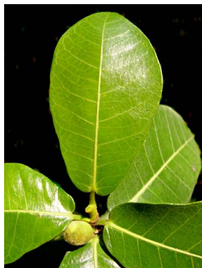
77 Ficus popenoei