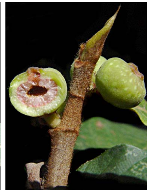
95 Ficus velutina