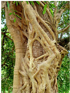
71 Ficus pertusa