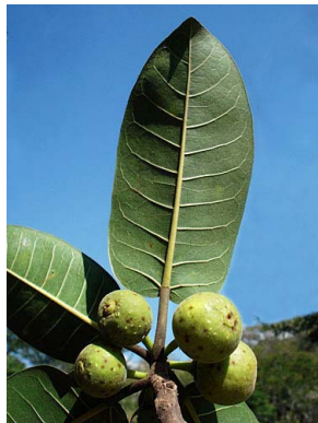
33 Ficus crocata