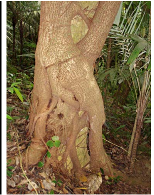
65 Ficus obtusifolia