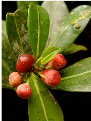
2 Ficus americana