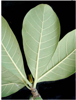
61 Ficus obtusifolia

Fotos de los autores. Producido por: Tyana Wachter, R.Foster, J. Philipp, con apoyo de Connie Keller, Ellen Hyndman Fund y Andrew Mellon Foundation. © G. Cornejo-Tenorio [gcornejo@cieco.unam.mx] y G. Ibarra-Manríquez (gibarra@cieco.unam.mx) Laboratorio de Biogeografía y Conservación, Centro de Investigaciones en Ecosistemas, UNAM. © ECCo, The Field Museum, Chicago, IL 60605 USA. [http://fieldmuseum.org/IDtools] [rrr@fieldmuseum.org] Rapid Color Guide # 394 versión 1 05/2013