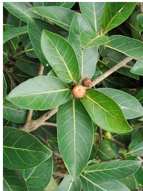
28 Ficus crassinervia