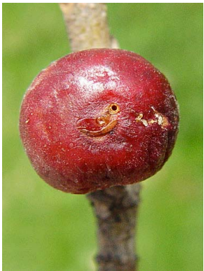
26 Ficus cotinifolia