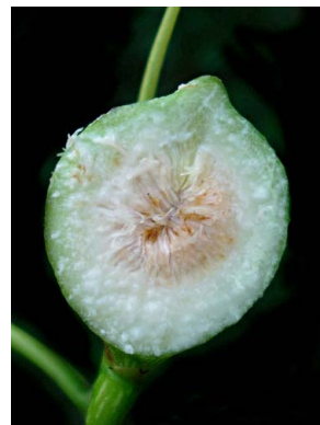
99 Ficus yoponensis