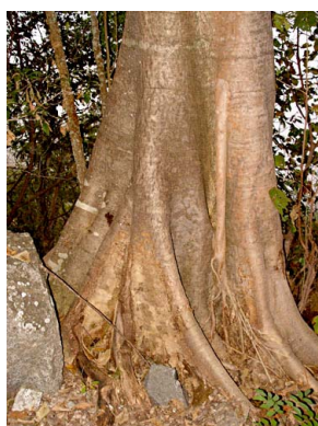
58 Ficus membranacea