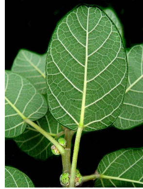
24 Ficus cotinifolia