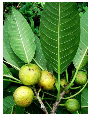
40 Ficus insipida