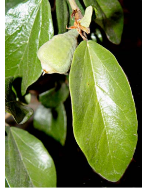
84 Ficus pumila (cultivado)