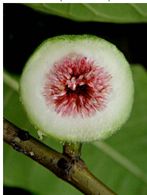
53 Ficus maxima