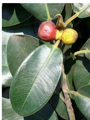
48 Ficus macrophylla (cultivado)