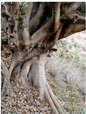
96 Ficus velutina