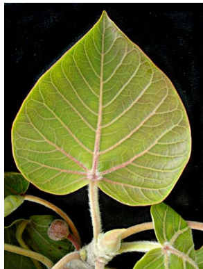
72 Ficus petiolaris