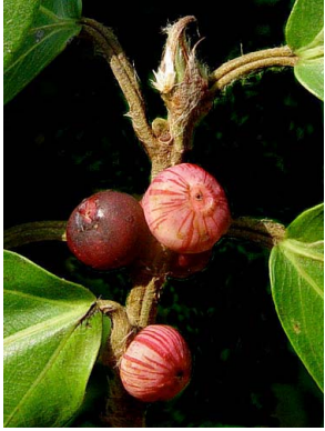
21 Ficus colubrinae

Producido por: Tyana Wachter, R.Foster, J. Philipp, con apoyo de Connie Keller, Ellen Hyndman Fund y Andrew Mellon Foundation. © G. Cornejo-Tenorio [gcornejo@cieco.unam.mx] y G. Ibarra-Manríquez (gibarra@cieco.unam.mx) Laboratorio de Biogeografía y Conservación, Centro de Investigaciones en Ecosistemas, UNAM. © ECCo, The Field Museum, Chicago, IL 60605 USA. [http://fieldmuseum.org/IDtools] lrre@fieldmuseum.org Rapid Color Guide # 394 versión 1 05/2013