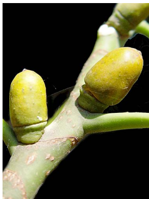
37 Ficus elastica (cultivado)