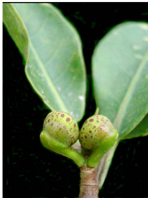
87 Ficus rzedowskiana