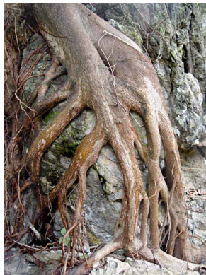
88 Ficus rzedowskiana