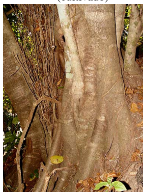
18 Ficus citrifolia