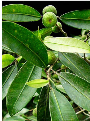
3 Ficus apollinaris