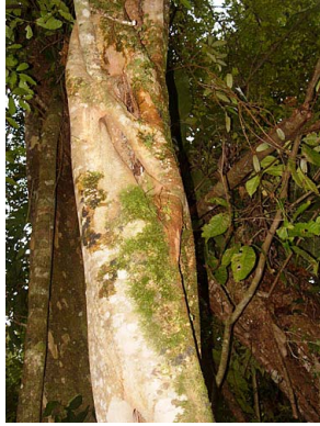
22 Ficus colubrinae