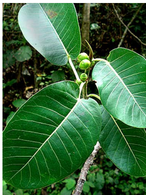
6 Ficus aurea