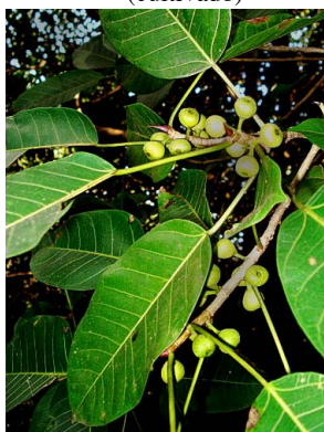
16 Ficus citrifolia