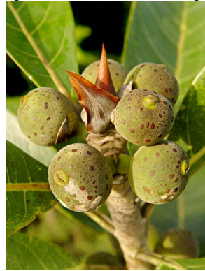
63 Ficus obtusifolia