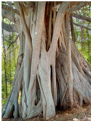
27 Ficus cotinifolia