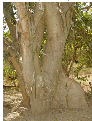
54 Ficus maxima