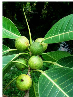
39 Ficus insipida