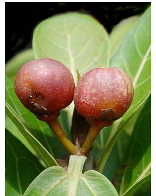
30 Ficus crassinervia