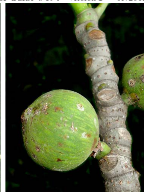
45 Ficus lapathifolia