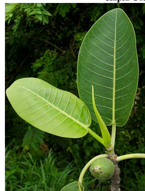
44 Ficus lapathifolia