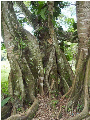
31 Ficus crassinervia