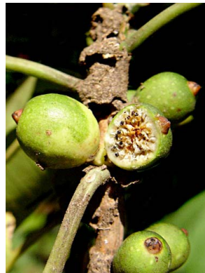
68 Ficus paraensis