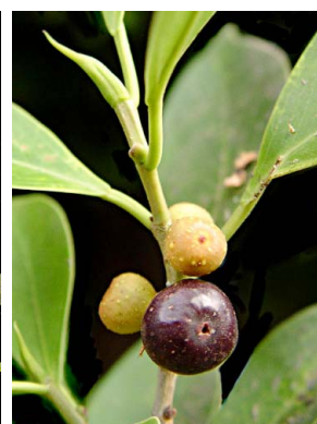
60 Ficus microcarpa (cultivado)