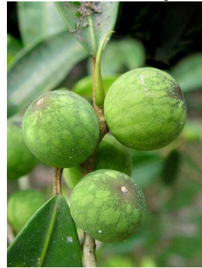
4 Ficus apollinaris