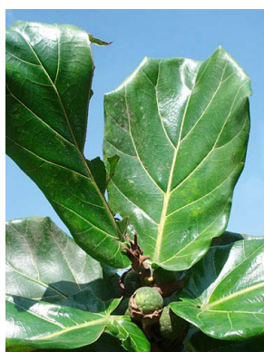
46 Ficus lyrata (cultivado)