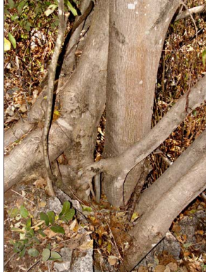
82 Ficus pringlei