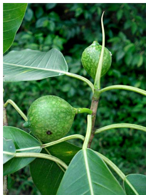
98 Ficus yoponensis