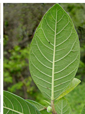
50 Ficus maxima