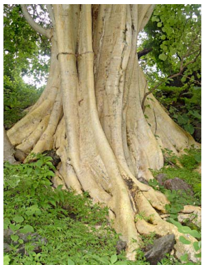
76 Ficus petiolaris