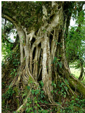
92 Ficus turrialbana