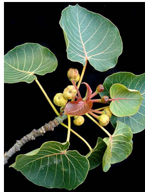
73 Ficus petiolaris