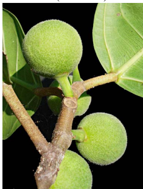
52 Ficus maxima