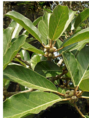
89 Ficus turrialbana