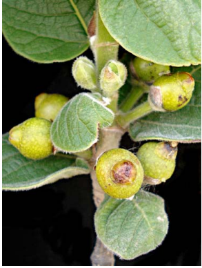
81 Ficus pringlei

Fotos de los autores. Producido por: Tyana Wachter, R.Foster, J. Philipp, con apoyo de Connie Keller, Ellen Hyndman Fund y Andrew Mellon Foundation. © G. Cornejo-Tenorio [gcornejo@cieco.unam.mx] y G. Ibarra-Manríquez (gibarra@cieco.unam.mx) Laboratorio de Biogeografía y Conservación, Centro de Investigaciones en Ecosistemas, UNAM. © ECCo, The Field Museum, Chicago, IL 60605 USA. [http://fieldmuseum.org/IDtools] Irrc@fieldmuseum.org Rapid Color Guide # 394 versión 1 05/2013