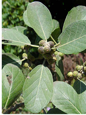
23 Ficus cotinifolia