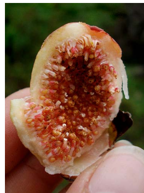
9 Ficus aurea