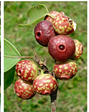
70 Ficus pertusa