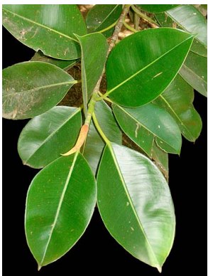
36 Ficus elastica (cultivado)