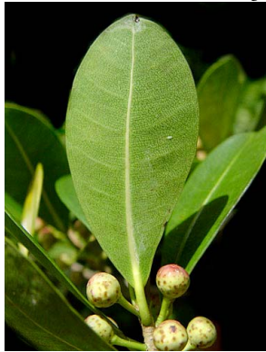
1 Ficus americana

Fotos de los autores. Producido por: Tyana Wachter, R.Foster, J. Philipp, con apoyo de Connie Keller, Ellen Hyndman Fund y Andrew Mellon Foundation. © G. Cornejo-Tenorio [gcornejo@cieco.unam.mx] y G. Ibarra-Manríquez (gibarra@cieco.unam.mx) Laboratorio de Biogeografía y Conservación, Centro de Investigaciones en Ecosistemas, UNAM. © ECCo, The Field Museum, Chicago, IL 60605 USA. [http://fieldmuseum.org/IDtools] [irre@fieldmuseum.org] Rapid Color Guide # 394 versión 1 05/2013