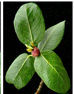
80 Ficus pringlei