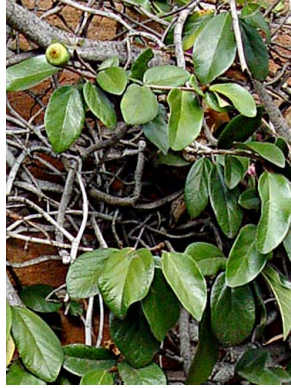
83 Ficus pumila (cultivado)