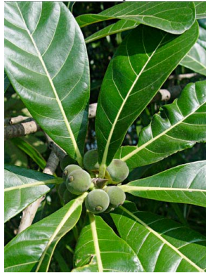
62 Ficus obtusifolia