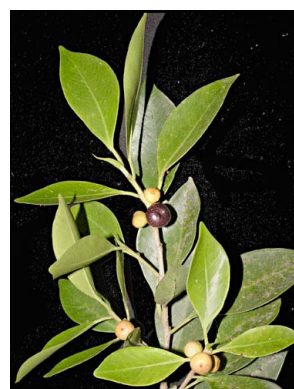
59 Ficus microcarpa (cultivado)