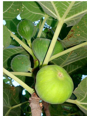
14 Ficus carica (cultivado)