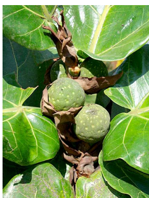
47 Ficus lyrata (cultivado)