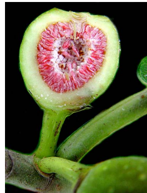
34 Ficus crocata