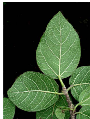
79 Ficus pringlei