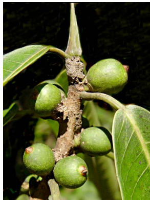
67 Ficus paraensis