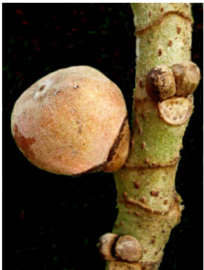
91 Ficus turrialbana