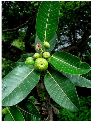
32 Ficus crocata