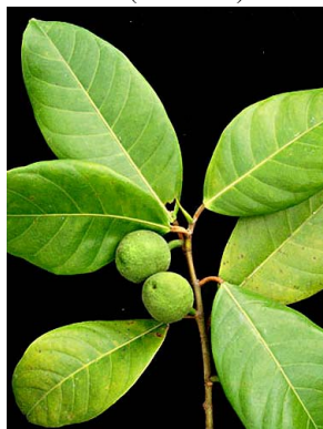
51 Ficus maxima