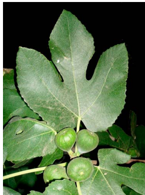
13 Ficus carica (cultivado)