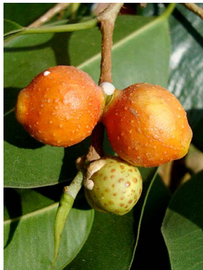
12 Ficus benjamina (cultivado)