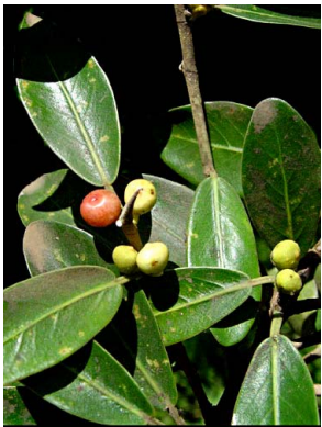
86 Ficus rzedowskiana