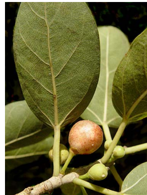
29 Ficus crassinervia