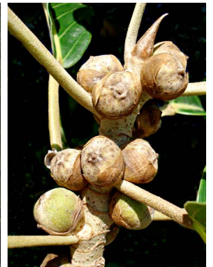
90 Ficus turrialbana