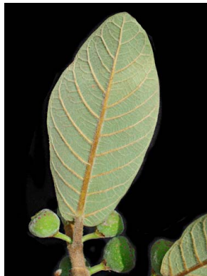
93 Ficus velutina