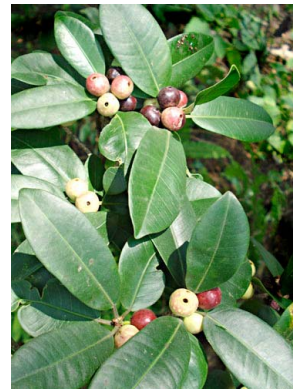
69 Ficus pertusa