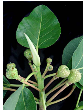
74 Ficus petiolaris