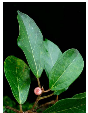
20 Ficus colubrinae