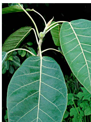
56 Ficus membranacea