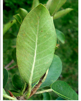
85 Ficus rzedowskiana