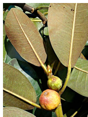
49 Ficus macrophylla (cultivado)