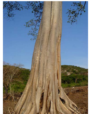
35 Ficus crocata