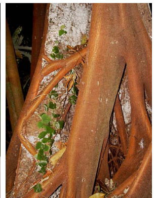
10 Ficus aurea