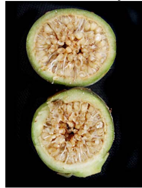
64 Ficus obtusifolia