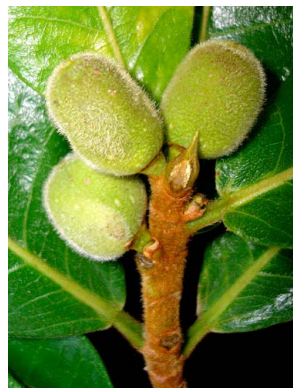
78 Ficus popenoei