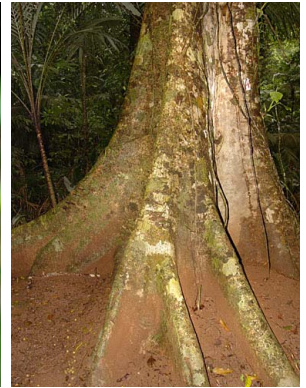
5 Ficus apollinaris