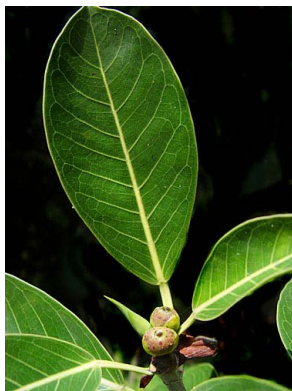
7 Ficus aurea