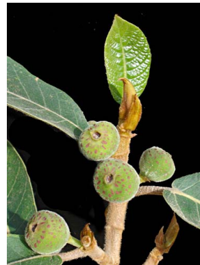
94 Ficus velutina