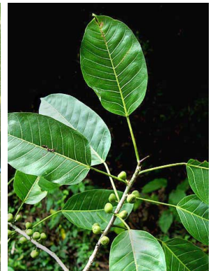
15 Ficus citrifolia