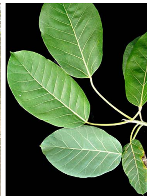
55 Ficus membranacea