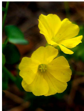
57 Oxalis OXALIDACEAE