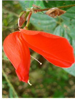
33 Periandra coccinea FABACEAE-PAPIL.