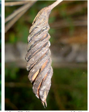
40 Helicteres guazumifolia MALVACEAE