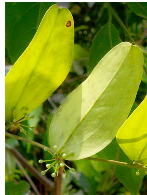
74 Smilax SMILACACEAE