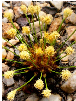
18 Bulbostylis paradoxa CYPERACEAE