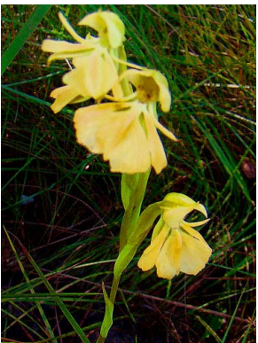
56 Habenaria glazioviana ORCHIDACEAE