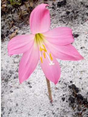
2 Habranthus araguaiensis AMARYLLIDACEAE