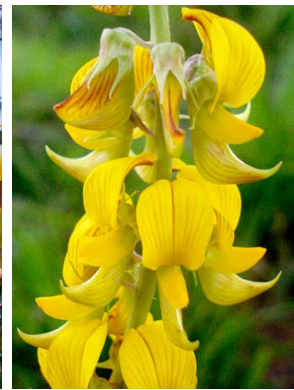
29 Crotalaria lanceolata FABACEAE-PAPIL.