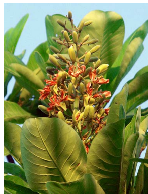
77 Salvertia convallariodora VOCHYSIACEAE