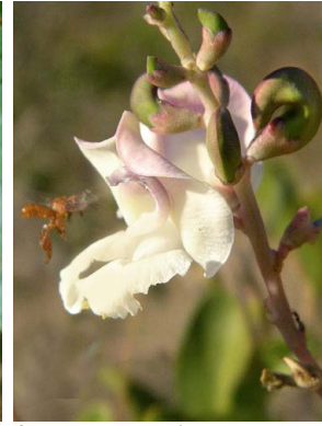
34 Vigna FABACEAE-PAPIL.