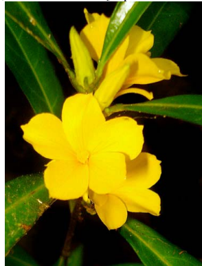
62 Turnera glaziovii PASSIFLORACEAE