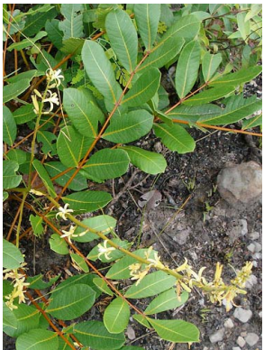
71 Simaba cedron SIMAROUBACEAE