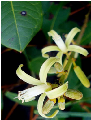
72 Simaba cedron SIMAROUBACEAE