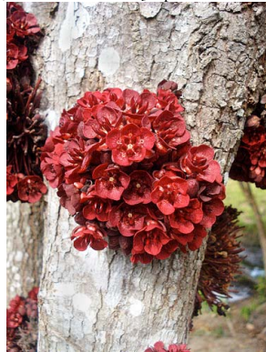
42 Theobroma speciosum MALVACEAE