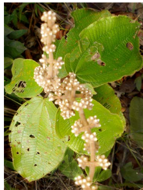
48 Miconia macrothyrsa MELASTOMATACEAE