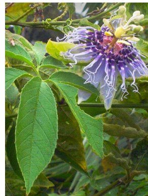
59 Passiflora pedata PASSIFLORACEAE