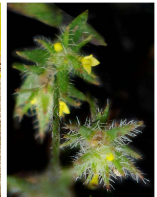
10 Perama hirsuta ASTERACEAE