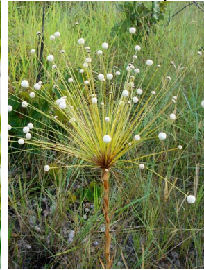
24 Paepalanthus chiquitensis ERIOCAULACEAE