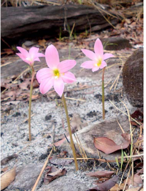
1 Habranthus araguaiensis AMARYLLIDACEAE

Rapid Color Guide # 342 versión 1 01/2014