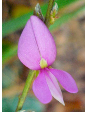
32 Galactea FABACEAE-PAPIL.