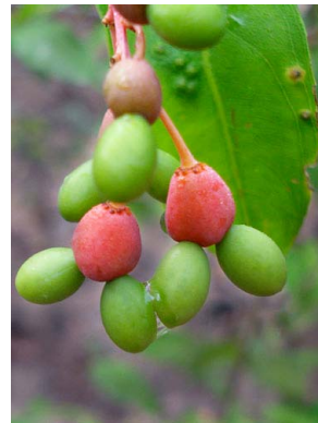
54 Ouratea OCHNACEAE