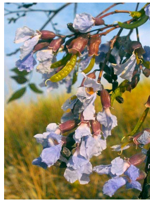
28 Bowdichia virgilioides FABACEAE-PAPIL.