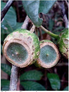
36 Gustavia augusta LECYTHIDACEAE