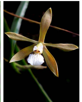
55 Encyclia flava ORCHIDACEAE