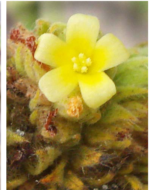
45 Waltheria americana MALVACEAE