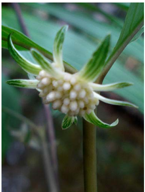
66 Psychotria hoffmanneggiana RUBIACEAE