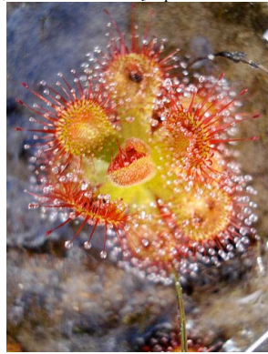
22 Drosera sp. 2 DROSERACEAE