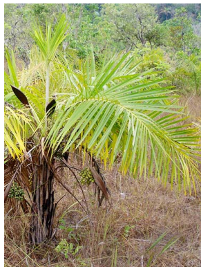
8 Syagrus comosa ARECACEAE