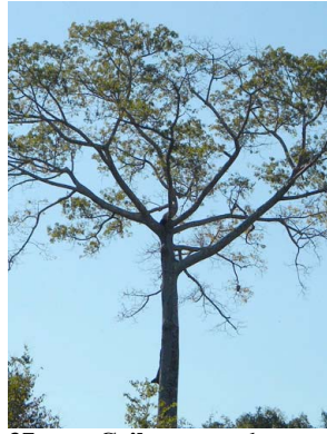
37 Ceiba pentandra MALVACEAE