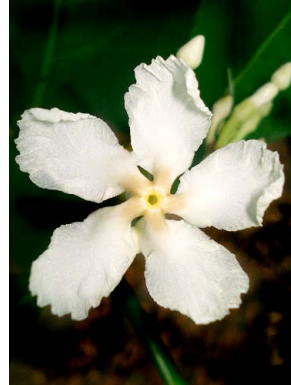
4 Tabernaemontana flavicans APOCYNACEAE