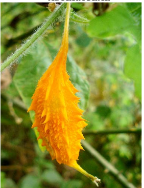
16 Momordica charantia CUCURBITACEAE