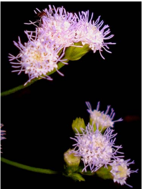
11 Peraxelis clematidea ASTERACEAE