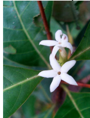
64 Alibertia edulis RUBIACEAE