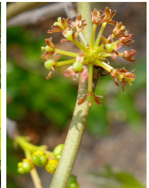
75 Smilax SMILACACEAE