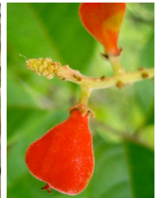
70 Cupania SAPINDACEAE