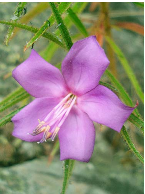
51 Tibouchina sp. 2 MELASTOMATACEAE