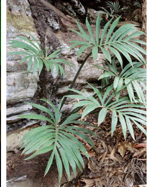
5 Philodendron cardosoi ARACEAE