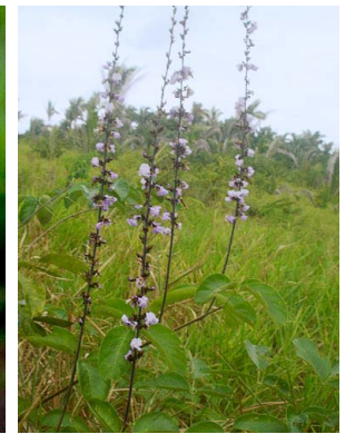
30 Dioclea grandiflora FABACEAE-PAPIL.