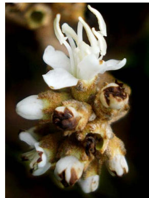
49 Miconia macrothyrsa MELASTOMATACEAE