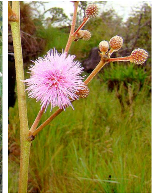
25 Mimosa FABACEAE-MIMOS.