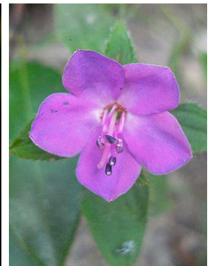
50 Tibouchina sp. 1 MELASTOMATACEAE