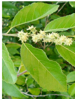
68 Homalium SALICACEAE