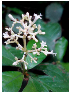
67 Psychotria RUBIACEAE