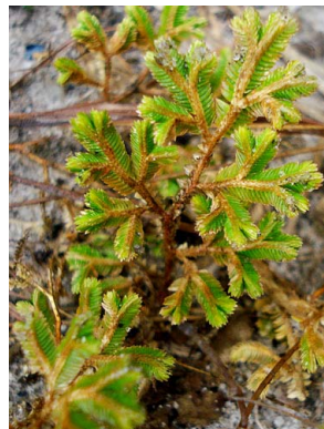
78 Selaginella SELAGINELLACEAE