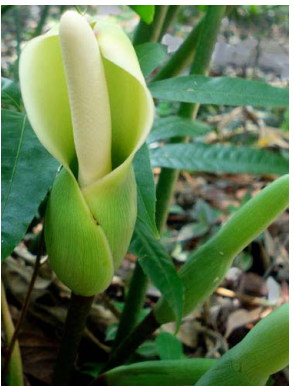
6 Philodendron cardosoi ARACEAE