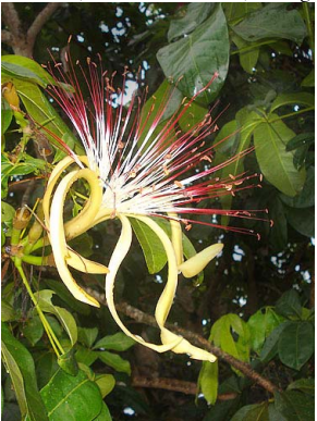
41 Pachira tocanina MALVACEAE

Rapid Color Guide # 342 versión 1 01/2014