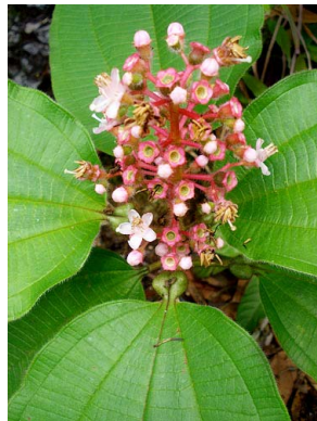
52 Tococa MELASTOMATACEAE