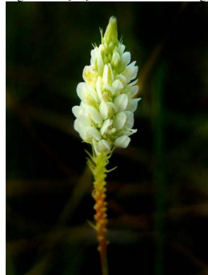
63 Polygala celosioides POLYGALACEAE