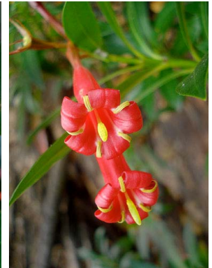
65 Augusta longifolia RUBIACEAE