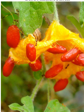
17 Momordica charantia CUCURBITACEAE