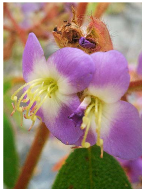
47 Macairea MELASTOMATACEAE