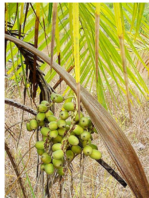
9 Syagrus comosa ARECACEAE