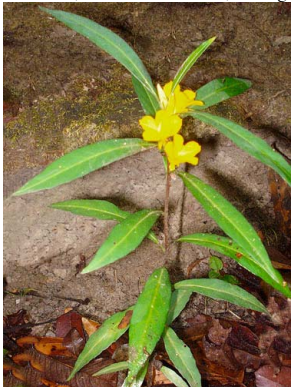
61 Turnera glaziovii PASSIFLORACEAE

Rapid Color Guide # 342 versão 1 01/2014