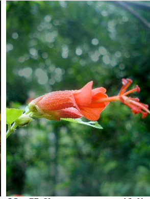
39 Helicteres guazumifolia MALVACEAE