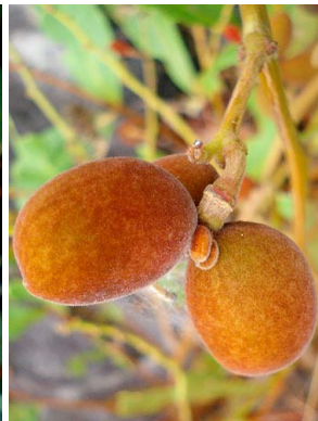
73 Simaba cedron SIMAROUBACEAE