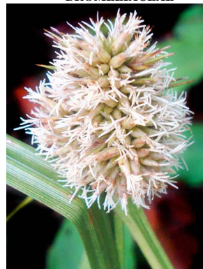
19 Kyllinga sp. CYPERACEAE