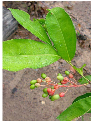
53 Ouratea OCHNACEAE