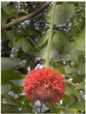
26 Parkia platycephala FABACEAE-MIMOS.