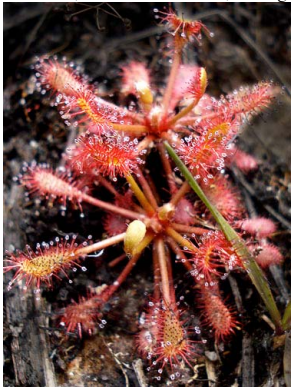
21 Drosera sp. 1 DROSERACEAE

Rapid Color Guide # 342 versión 1 01/2014