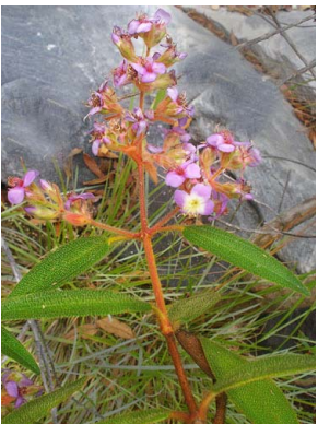
46 Macairea MELASTOMATACEAE