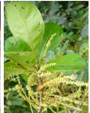
15 Terminalia sp. COMBRETACEAE