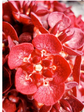
43 Theobroma speciosum MALVACEAE