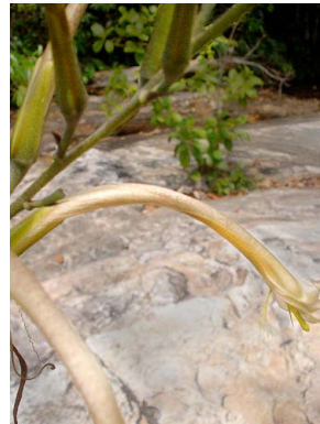
14 Pitcairnia burchellii BROMELIACEAE