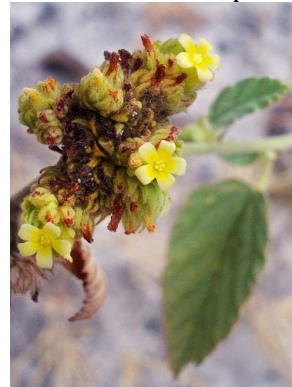
44 Waltheria americana MALVACEAE