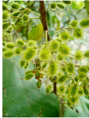
23 Sloanea ELAEOCARPACEAE