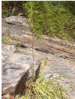
13 Pitcairnia burchellii BROMELIACEAE