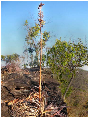
12 Encholirium sp. BROMELIACEAE