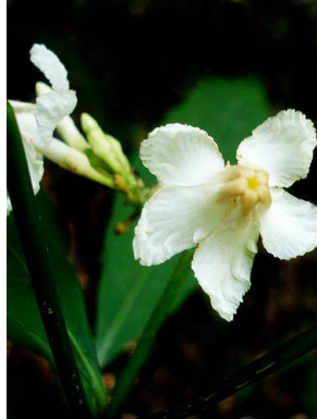
3 Tabernaemontana flavicans APOCYNACEAE