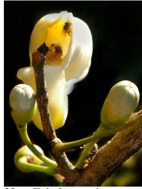
38 Eriotheca pubescens MALVACEAE