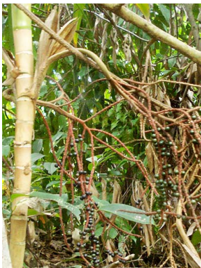
7 Geonoma sp. ARECACEAE