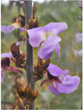
31 Dioclea grandiflora FABACEAE-PAPIL.