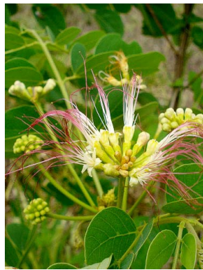
27 Samanea saman FABACEAE-MIMOS.