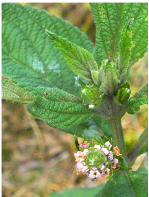
76 Lantana trifolia VERBENACEAE