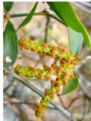
69 Phoradendron strongyloclados SANTALACEAE