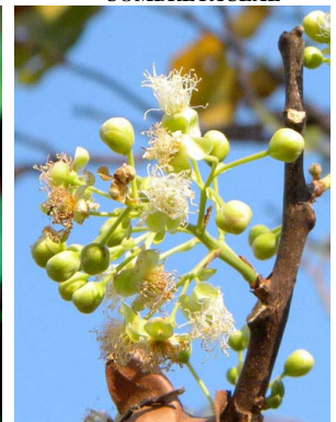
20 Curatella americana DILENIACEAE