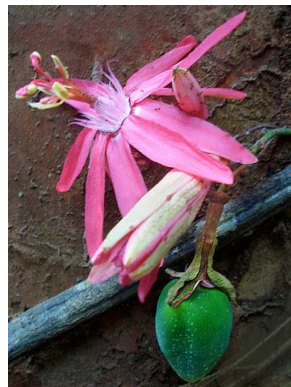
58 Passiflora glandulosa PASSIFLORACEAE