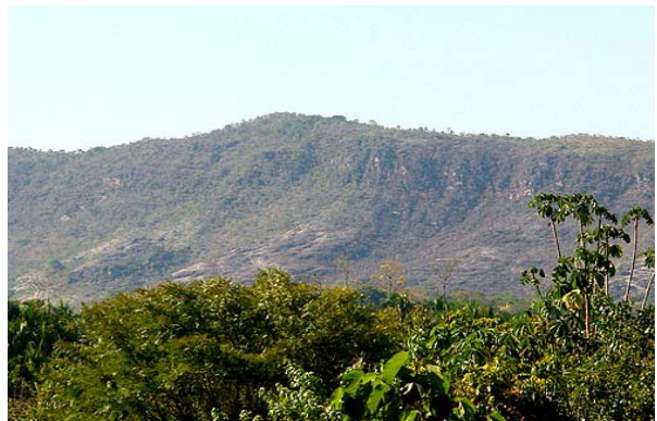
79 Serra da Andorinhas