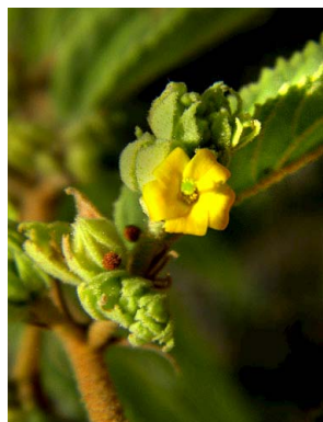
31 Waltheria brachypetala