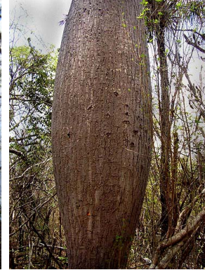
4 Ceiba glaziovii