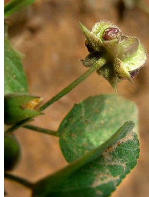
8 Herrisantia crispa