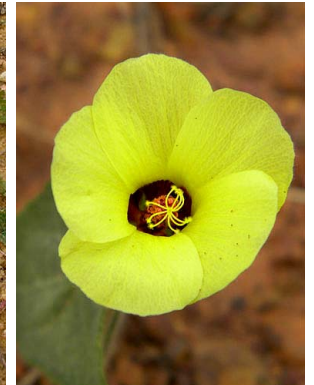
15 Pavonia cancellata