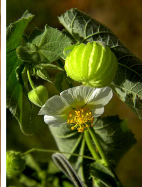
9 Herrisantia tiubae