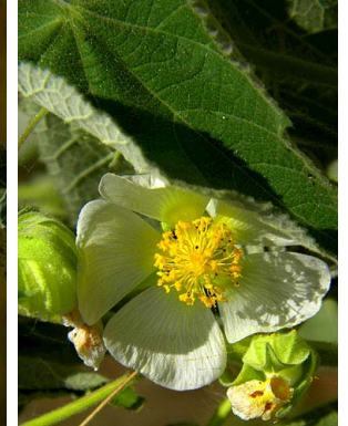
10 Herrisantia tiubae