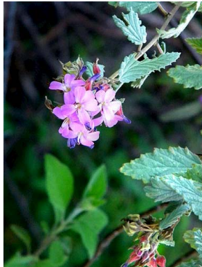
12 Melochia tomentosa