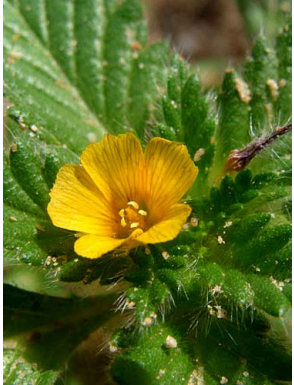
6 Corchorus argutus