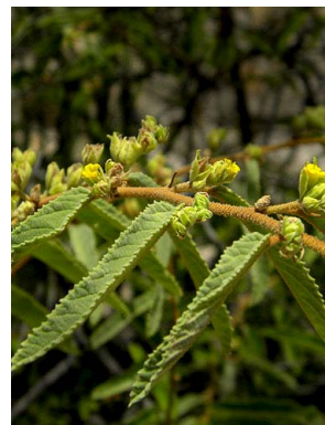
30 Waltheria brachypetala