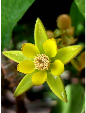
1 Apeiba tibourbou

Rapid Color Guide # 324 version 1 03/2012