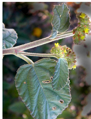
28 Waltheria albicans