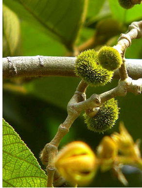
2 Apeiba tibourbou