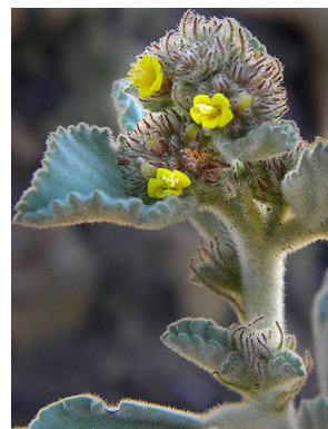
35 Waltheria rotundifolia