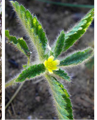
5 Corchorus hirtus