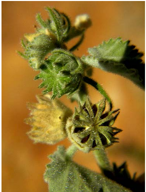
11 Malvastrum tomentosum subsp. tomentosum