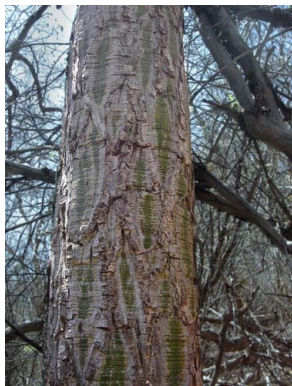
17 Pseudobombax marginatum