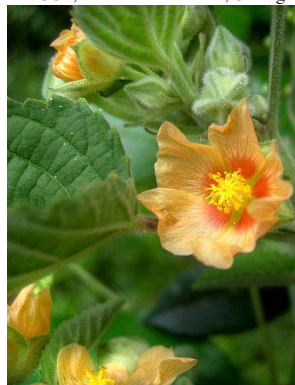
21 Sida cordifolia

Rapid Color Guide # 324 version 1 03/2012