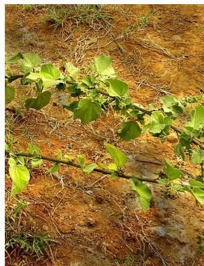
26 Sidastrum micranthum