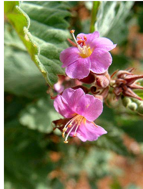
13 Melochia tomentosa