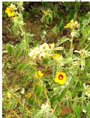
22 Sida galheirensis