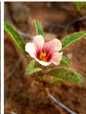
19 Sida ciliaris