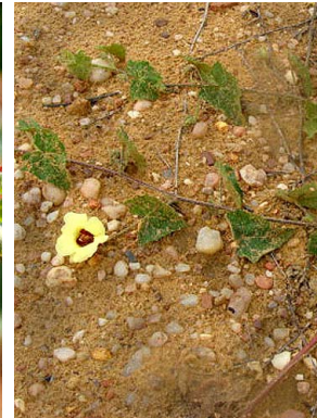
14 Pavonia cancellata