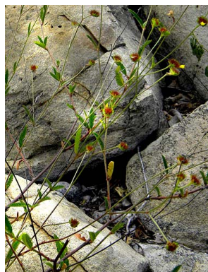
32 Waltheria operculata