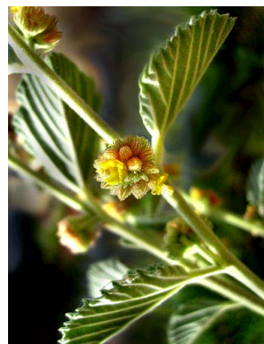
34 Waltheria rotundifolia