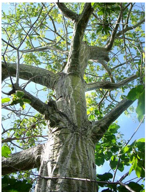
16 Pseudobombax marginatum