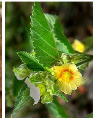
20 Sida cordifolia