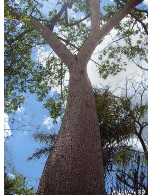
3 Ceiba glaziovii