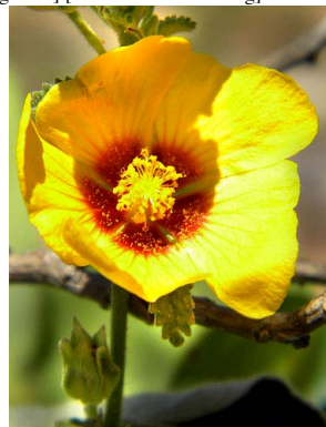
23 Sida galheirensis