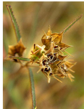
25 Sida linifolia