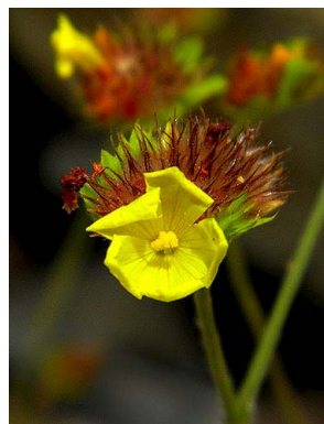
33 Waltheria operculata