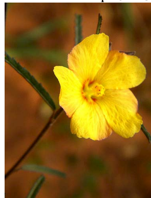
24 Sida linifolia