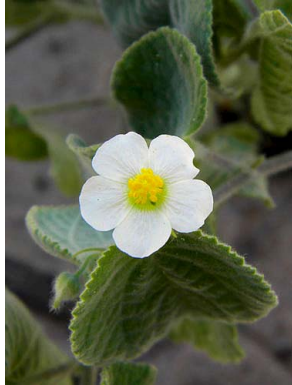
7 Herrisantia crispa