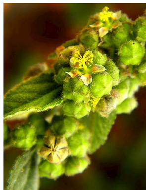
27 Sidastrum micranthum