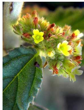
29 Waltheria albicans