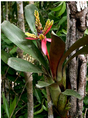
11 A. chantinii