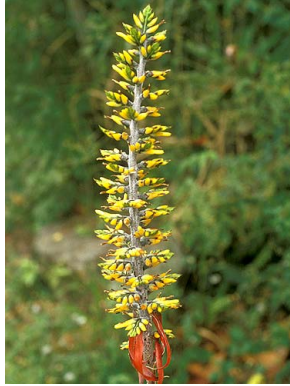
2 A. angustifolia