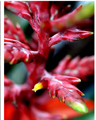
80 A. zebrina R. B. Foster