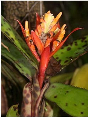
6 A. brevicollis