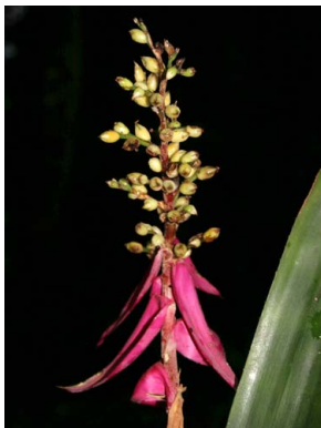
36 A. nivea