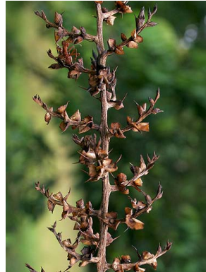
27 A. sp. 2