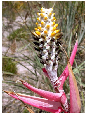
8 A. bromeliifolia F. Morales