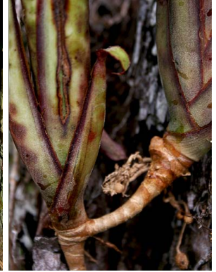
5 A. brevicollis