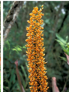
34 A. mexicana