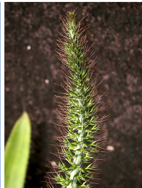
59 A. setigera