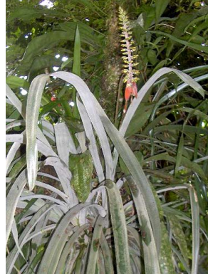
22 A. huebneri L.F. Jaramillo