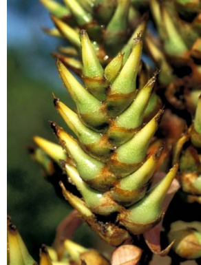
64 A. stenosepala