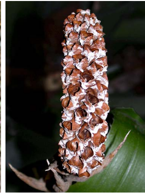
9 A. bromeliifolia F. Morales