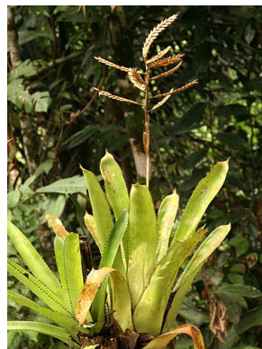
18 A. dactylina