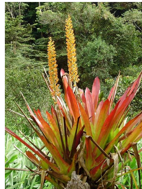
33 A. mexicana