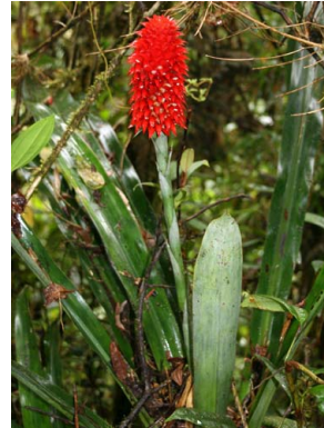
74 A. veitchii