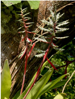
46 A. pubescens