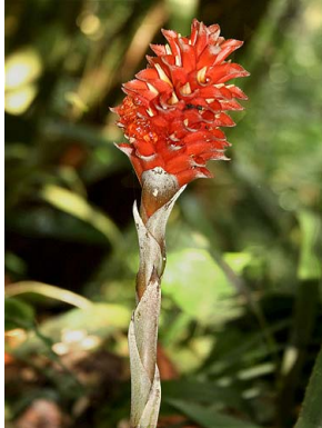
21 A. germinyana

© Environmental & Conservation Programs, The Field Museum, Chicago, IL 60605 USA [rcc@fieldmuseum.org] [www.fmn.org/plantguides/] Rapid Color Guide #319 versión 1 04/2011