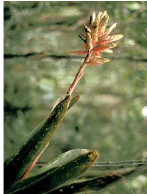
53 A. romeroi