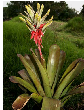
49 A. retusa