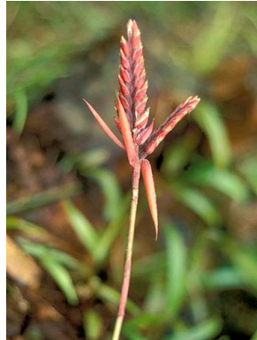
68 A. tillandsioides