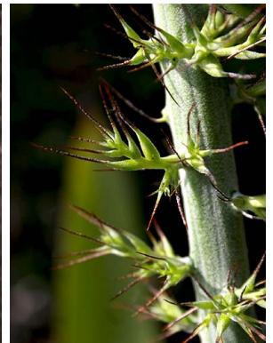
60 A. setigera