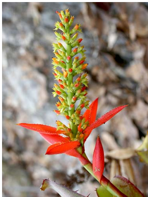
31 A. mertensii N.R. Salinas