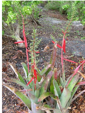
48 A. pyramidalis