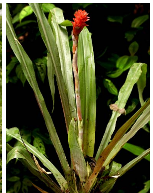
20 A. germinyana