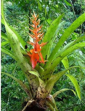
41 A. penduliflora

Rapid Color Guide #319 versión 1 04/2011