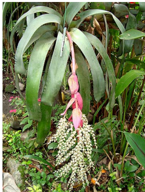
57 A. servitensis