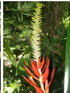
39 A. nudicaulis J. Aguirre-Santoro