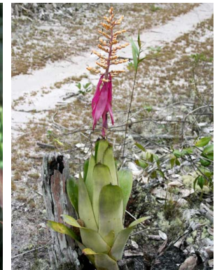
35 A. nivea