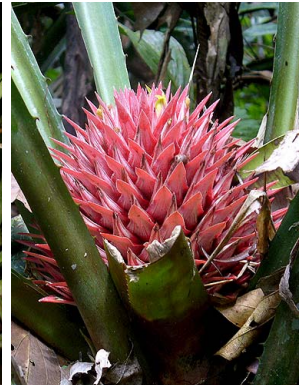
55 A. rubiginosa