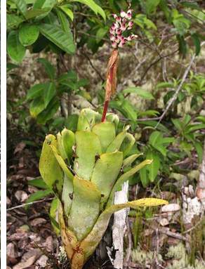
44 A. politii