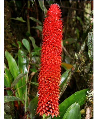
75 A. veitchii