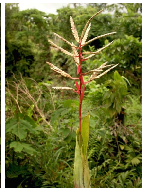
19 A. dactylina