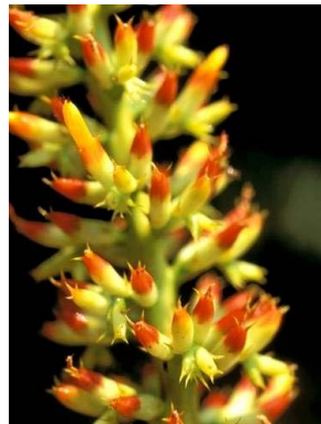
32 A. mertensii