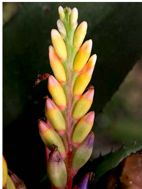
12 A. chantinii