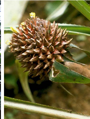
29 A. magdalenae