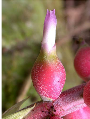
76 A. tonduzii F. Morales