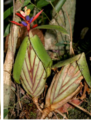
4 A. brevicollis