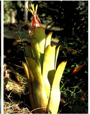
10 A. chantinii