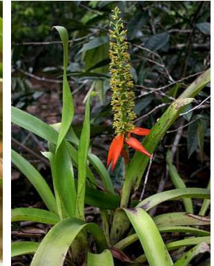
30 A. mertensii A. Zuluaga