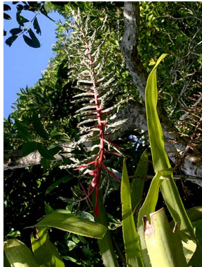
47 A. pubescens