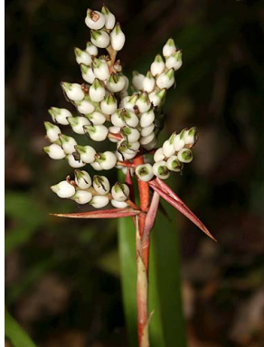
42 A. penduliflora