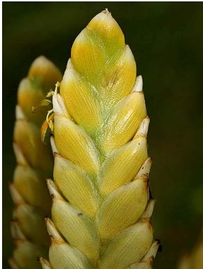
55 A. retusa