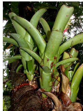
38 A. nudicaulis E. Moreno