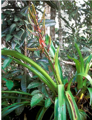
66 A. tillandsioides