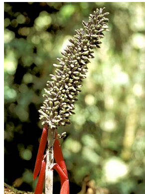
13 A. sp. 1