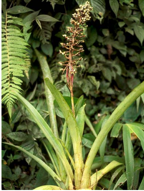
1 A. angustifolia

© Environmental & Conservation Programs, The Field Museum, Chicago, IL 60605 USA [rrc@fieldmuseum.org] [www.fmn.org/plantguides/] Rapid Color Guide #319 versión 1 04/2011