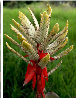
50 A. retusa