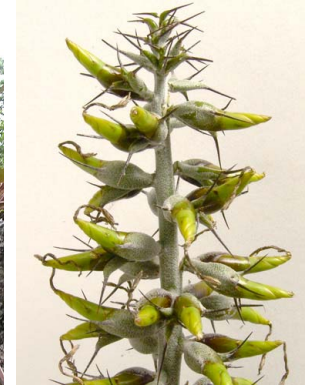
25 A. longicuspis J. Contreras