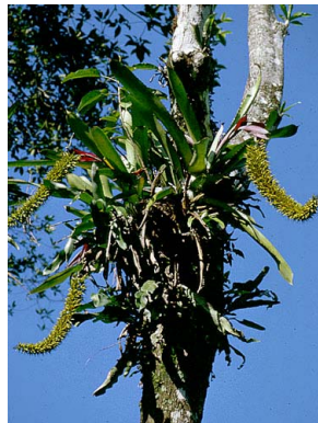
58 A. setigera