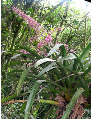
61 A. spectabilis

© Environmental & Conservation Programs, The Field Museum, Chicago, IL 60605 USA [rcc@fieldmuseum.org] [www.fnmh.org/plantguides/] Rapid Color Guide #319 versión 1 04/2011