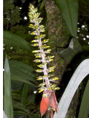
23 A. huebneri L.F. Jaramillo