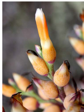
37 A. nivea