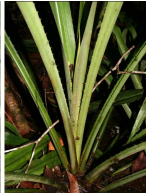
54 A. rubiginosa