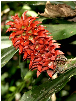
76 A. veitchii