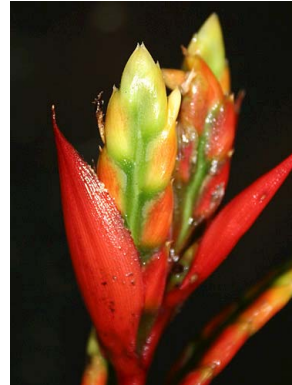
69 A. tillandsioides