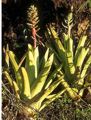
62 A. stenosepala