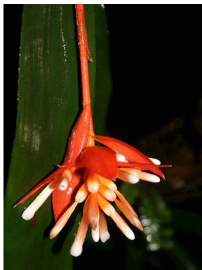
17 A. corymbosa