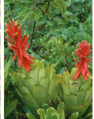
65 A. tessmannii R. B. Foster