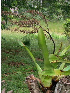
26 A. sp. 2