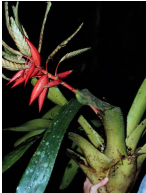
52 A. romeroi