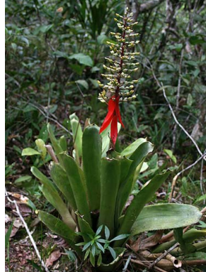
43 A. politii