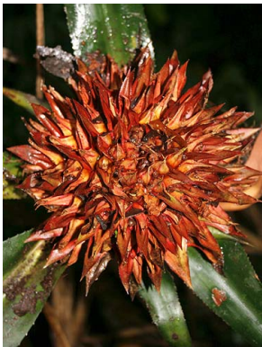
56 A. rubiginosa