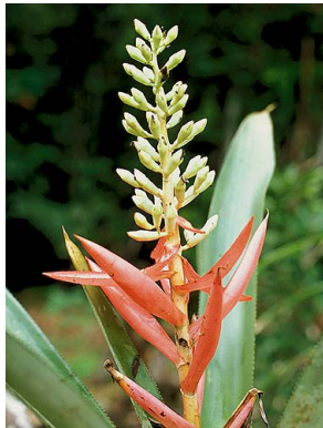
77 A. woronowii R. Arévalo