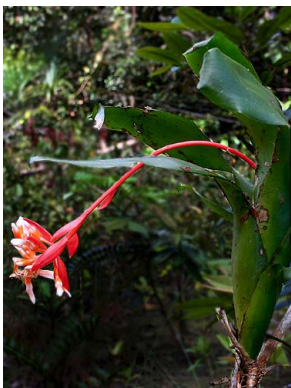
16 A. corymbosa