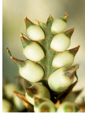
3 A. angustifolia