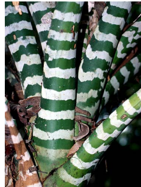
79 A. zebrina R. B. Foster