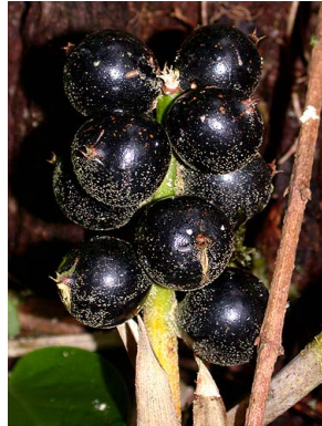
77 A. tonduzii F. Morales