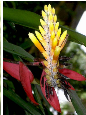
14 A. contracta L.F. Jaramillo