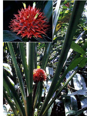
28 A. magdalenae R. B. Foster