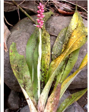
70 A. tonduzii F. Morales