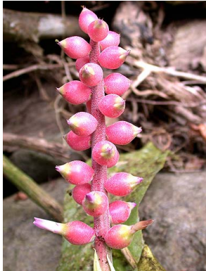
71 A. tonduzii F. Morales