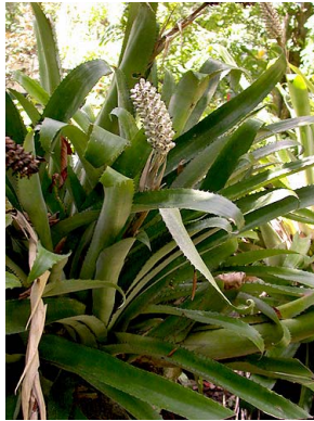
7 A. bromeliifolia F. Morales