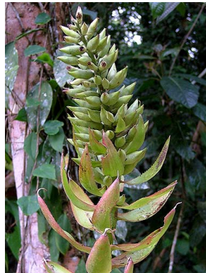
78 A. woronowii L. Clavijo