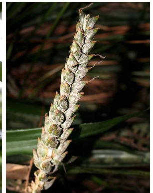
15 A. contracta