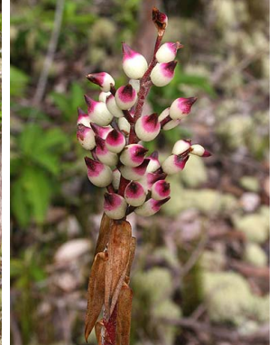
45 A. politii