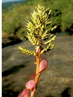
63 A. stenosepala