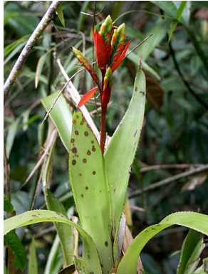
67 A. tillandsioides