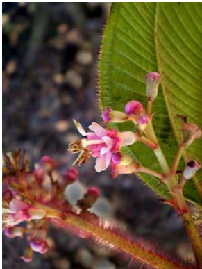
31 Tococa guianensis