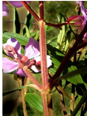
28 Tibouchina stenocarpa