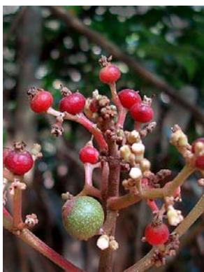
12 Miconia elegans