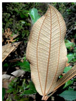
6 Miconia albicans