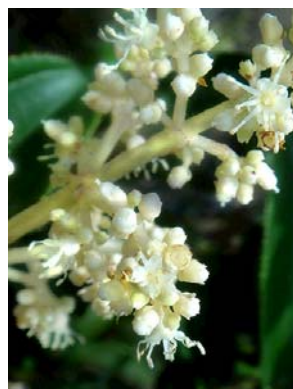
16 Miconia theaezans