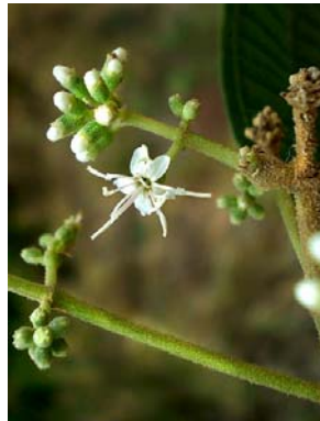
5 Miconia affinis