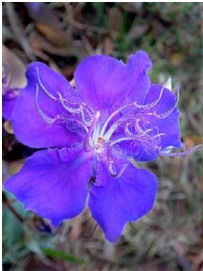
26 Tibouchina granulosa