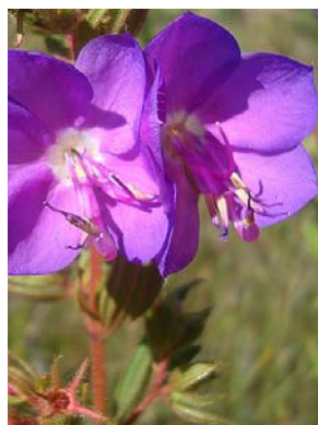
20 Rhynchanthera grandiflora