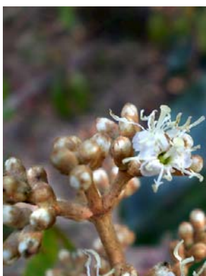
7 Miconia albicans