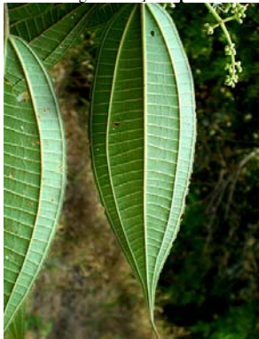
4 Miconia affinis