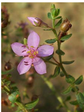
17 Microlicia fulva