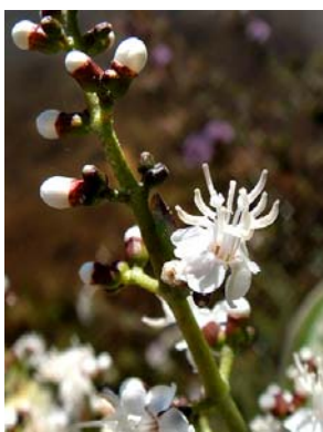
9 Miconia chamissois