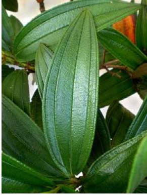
21 Tibouchina candolleana

Rapid Color Guide #312 versão 1 07/2011