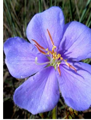
24 Tibouchina gracilis