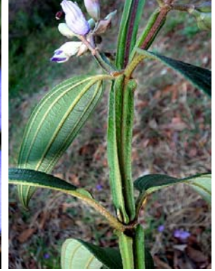
25 Tibouchina granulosa