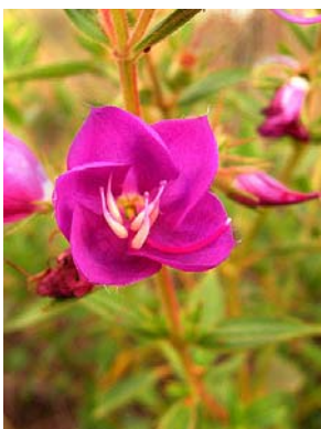
18 Rhynchanthera dichotoma