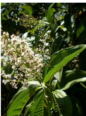
8 Miconia chamissois