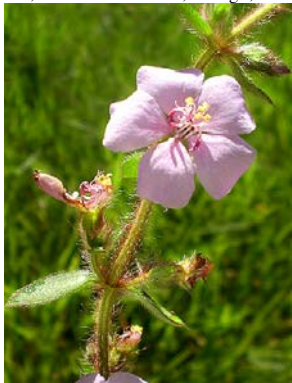
2 Desmoscelis villosa