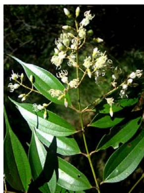
10 Miconia cuspidata