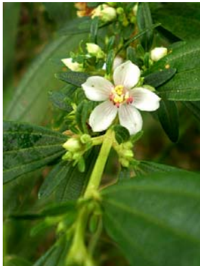
32 Trembleya parviflora