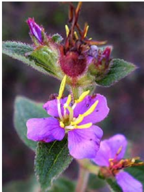
27 Tibouchina herbacea