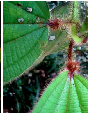
30 Tococa guianensis