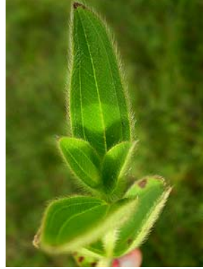
23 Tibouchina gracilis