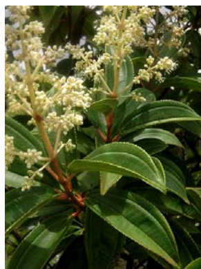
15 Miconia theaezans