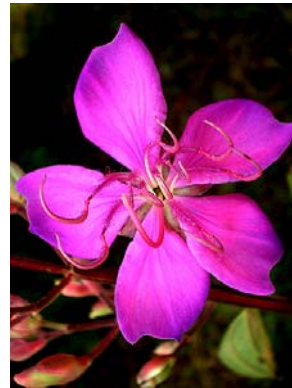
29 Tibouchina stenocarpa