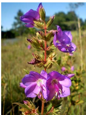
19 Rhynchanthera grandiflora