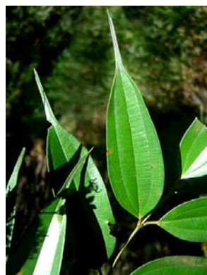
11 Miconia cuspidata