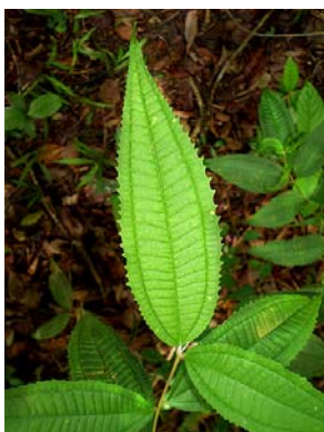
14 Miconia sellowiana