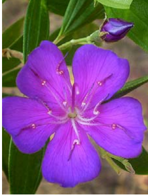
22 Tibouchina candolleana