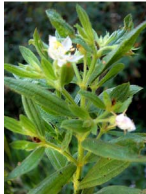
33 Trembleya phlogiformis