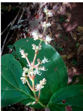
13 Miconia pseudonervosa