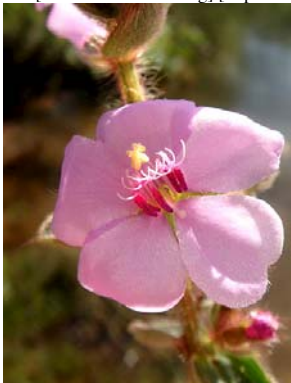
3 Desmoscelis villosa