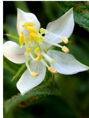
34 Trembleya phlogiformis