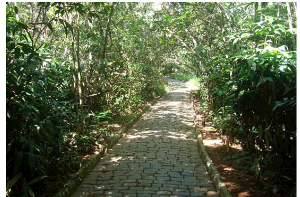
Interior da mata