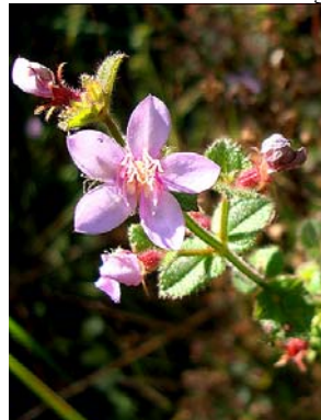
1 Acisanthera variabilis

Rapid Color Guide #312 versão 1 07/2011