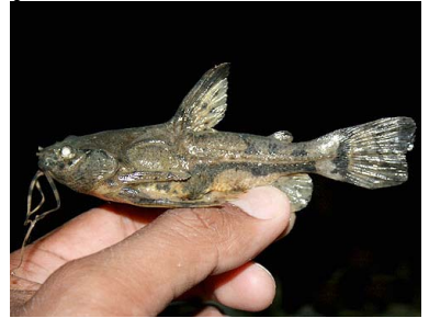
4 Bagre Amblydoras hancockii T: Kora DORADIDAE