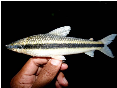
34 Lisa Laemolyta taeniata T: Etachane ANOSTOMIDAE