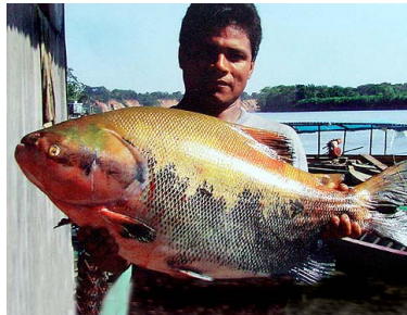
31 Gamitana Colossoma macropomum T: Tomacachi CHARACIDAE