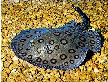
62 Raya Potamotrygon motoro T: Na-a POTOMOTRYGONIDAE