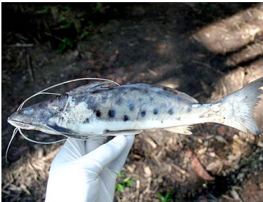
49 Mota Calophysus macropterus T: Kurui PIMELODIDAE