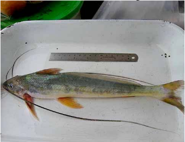
21 Cunchi Pimelodina flavipinnis T: Poma PIMELODIDAE

Rapid Color Guide #299 versión 1 01/2013