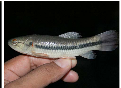
76 Shuyo Hoplerythrinus unitaeniatus T: De ERYTHRINIDAE