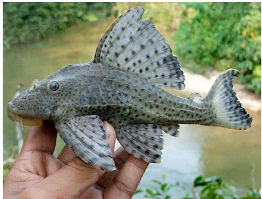
14 Carachama Hypostomus ericius LORICARIIDAE