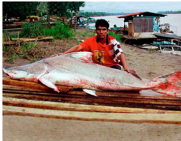
67 Bocón Brachyplatystoma filamentosum T: Doma PIMELODIDAE