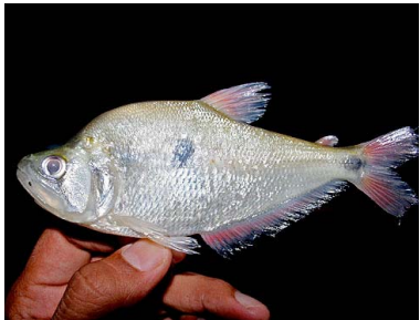
26 Dentón Charax tectifer T: Tuu CHARACIDAE