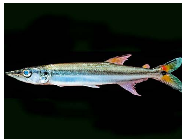
59 Pejezorro Acestrorhynchus nasutus T: Yorewa ACESTRORHYNCHIDAE