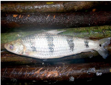
41 Lisa de río Schizodon fasciatus T: Uaraku ANOSTOMIDAE

Rapid Color Guide #299 versión 1 01/2013