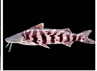
84 Zebra Brachyplatystoma juruense T: Nachiru PIMELODIDAE