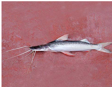
79 Bocón Brachyplatystoma platynemum T: Maparapa PIMELODIDAE