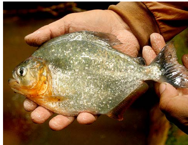
50 Piraña Serrasalmus spilopleura T: Uchuma CHARACIDAE