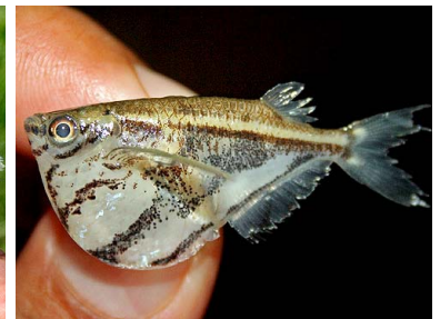
56 Mañana me voy Carnegiella strigata T: Peru GASTEROPELECIDAE