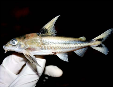
61 Chirui Nemadoras trimaculatus T: Aru DORADIDAE

Rapid Color Guide #299 versión 1 01/2013