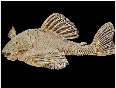
13 Carachama gigante Panaque sp nov T: Owaru LORICARIIDAE