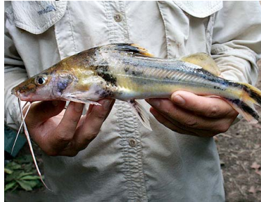
23 Cunchi Pimelodus ornatus T: Daun PIMELODIDAE