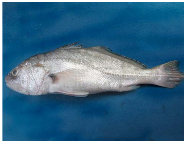
19 Corvina Plagiosion squamosissimus T: Kukena SCIAENIDAE