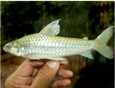
33 Sábalo Caenotropus labyrinthicus T: Nechi CHILODONTIDAE