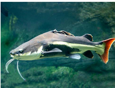
57 Torre Phractocephalus hemiliopterus T: Chiu PIMELODIDAE