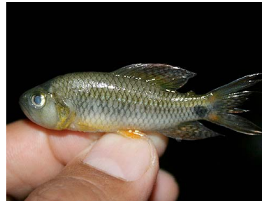
47 Mojarrita Crenuchus spilurus T: Aruchipa CRENUCHIDAE