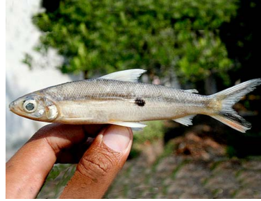
83 Paichipeje Hemiodus unimaculatus HEMIODONTIDAE