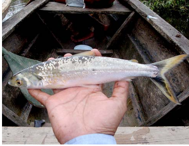
82 Paichipeje Anodus elongatus T: Chota HEMIODONTIDAE