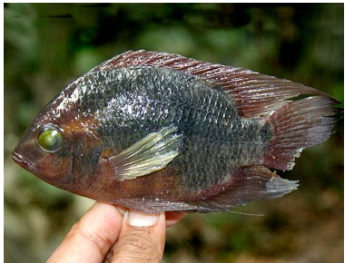
10 Bujurqui de quebrada Heroina isonycterina CICHLIDAE