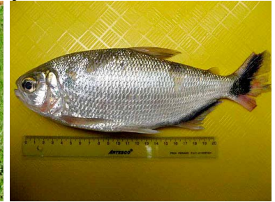
64 Cingo o sábalo Brycon melanopterus T: Echi CHARACIDAE