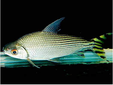
81 Dentón Semaprochilodus insignis T: Yaraki-chirmata PROCHILODONTIDAE

Rapid Color Guide #299 versión 1 01/2013