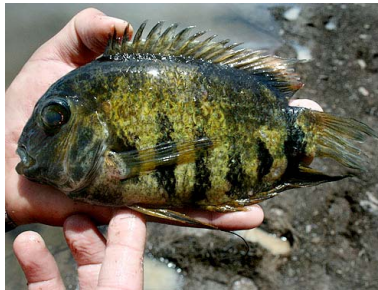
11 Akarawazú Heros efasciatus T: Aukara CICHLIDAE