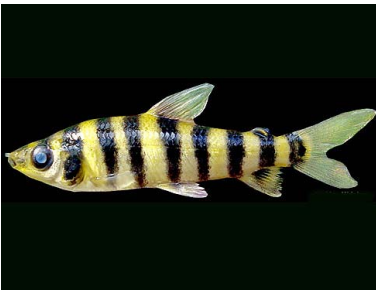
37 Lisa de quebrada Leporinus fasciatus T: Uaraku ANOSTOMIDAE