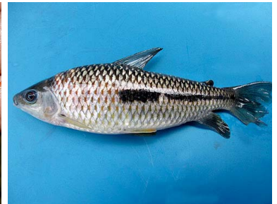
36 Lisa Leporinus cf. morales T: Ota ANOSTOMIDAE