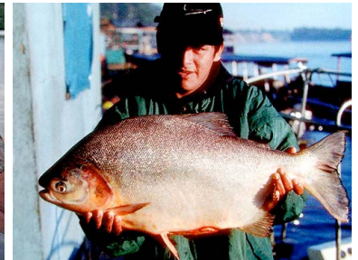
52 Paco Piaractus brachipomus T: pocu CHARACIDAE