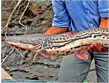
2 Mango de hacha Sorubimichthys planiceps PIMELODIDAE