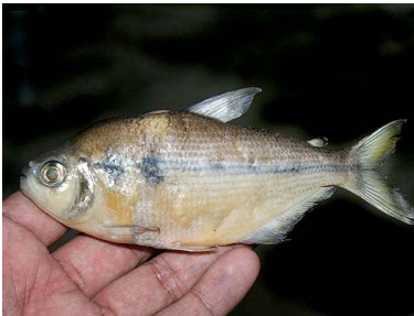
45 Mojara de caño Jupiaba anteroides T: Daukaruku CHARACIDAE