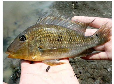
12 Tucunaré Satanoperca jurupari CICHLIDAE