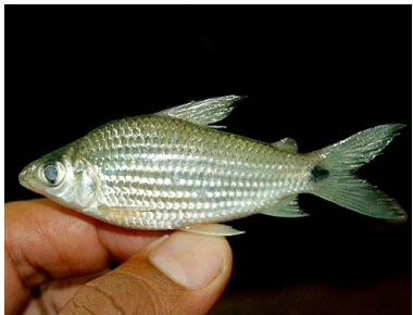
18 Mojarra Cyphocharax spiluropsis T: Owe CURIMATIDAE