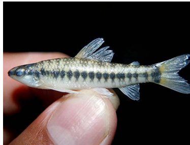
46 Lisa Characidium etheostoma CRENUCHIDAE