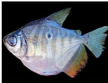
54 Kuruguara Mylossoma duriventre T: Topaca CHARACIDAE