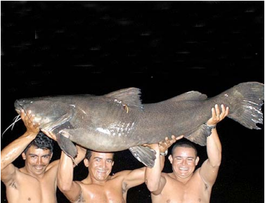
85 Barbudo Zungaro zungaro PIMELODIDAE