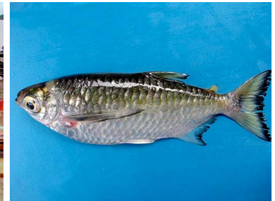
68 Sardina Triplotheus pictus T: Uirí CHARACIDAE