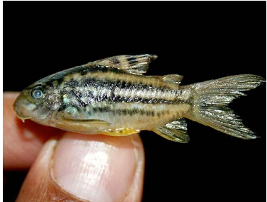
70 Shirui Corydoras elegans T: Paikachi CALLICHTHYIDAE