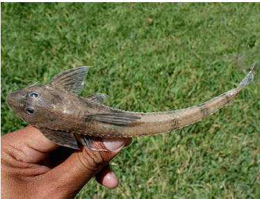
73 Shitari Loricaria cataphracta T: Koayale LORICARIDAE