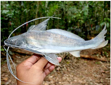
5 Bagre Pinirampus pinirampu T: Taunu PIMELODIDAE