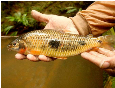
38 Lisa de quebrada Leporinus friderici T: Uaraku ANOSTOMIDAE