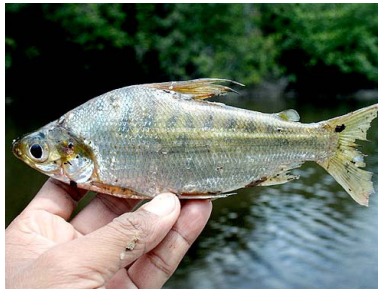
15 Chiochio Curimata vittata T: Owe CURIMATIDAE