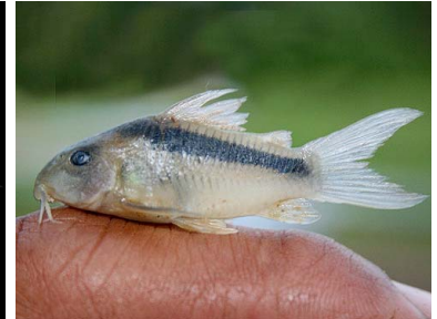
72 Shirui Corydoras rabauti T: Paikachi CALLICHTHYIDAE