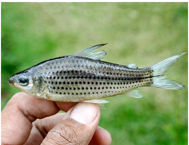
17 Lisa de quebrada Cyphocharax pantostictus T: Uaraku CURIMATIDAE