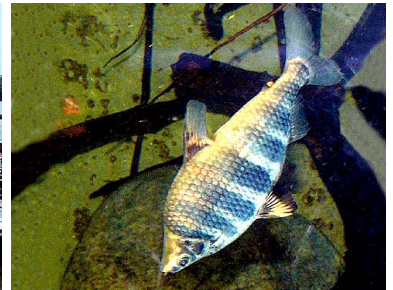
32 Lisa Abramites hypselonotus T: Uaraku ANOSTOMIDAE