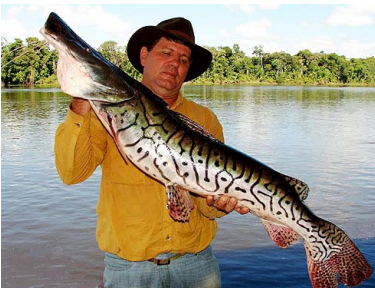
77 Tigrezúngaro Pseudoplatystoma tigrinum T: Ay PIMELODIDAE