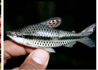
44 Mojara Chilodus punctatus T: Etachane CHILODONTIDAE