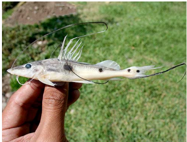
6 Bagre Platysilurus mucosus T: Yauchiku PIMELODIDAE