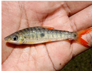
35 Lisa Leporinus aripuanaensis T: Tururi ANOSTOMIDAE