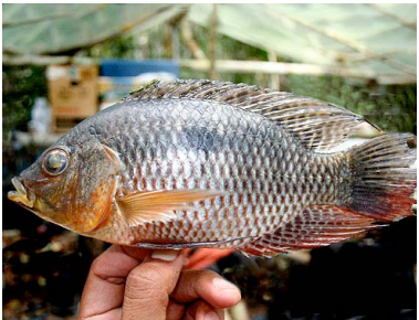
9 Bujurqui Chaetobranchius flavescens T: Maijua CICHLIDAE