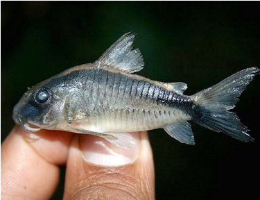
69 Shirui Corydoras arcuatus T: Paikachi CALLICHTHYIDAE