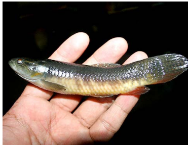
75 Shuyo Erythrinus erythrinus T: Oe ERYTHRINIDAE