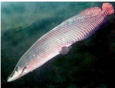
53 Paiche Arapaima gigas T: Dechi ARAPAIMATIDAE