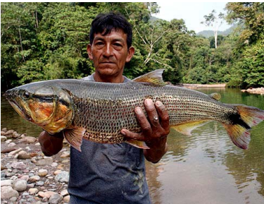
65 Sábalo Salminus iquitensis T: Echi CHARACIDAE