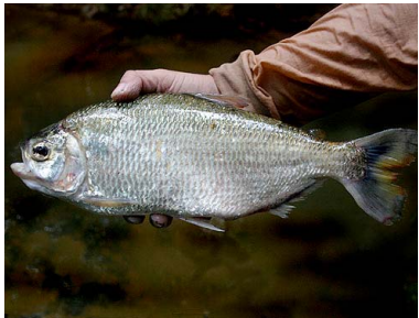
66 Sabalo Brycon cephalus T: Doma CHARACIDAE