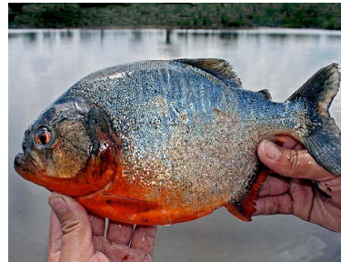
51 Paña roja Pygocentrus nattereri T: Uchuma CHARACIDAE