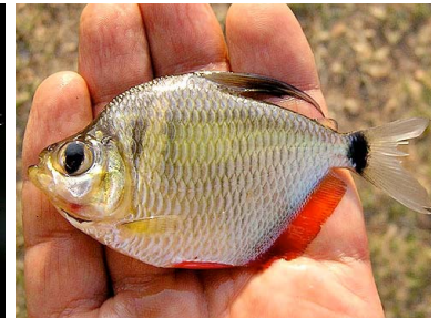
48 Carpeta Tetranogopterus argenteus T: Aruchipa CHARACIDAE