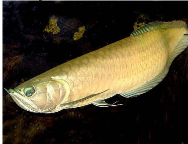
3 Arahuana Osteoglossum bicirrhosum OSTEOGLOSSIDAE