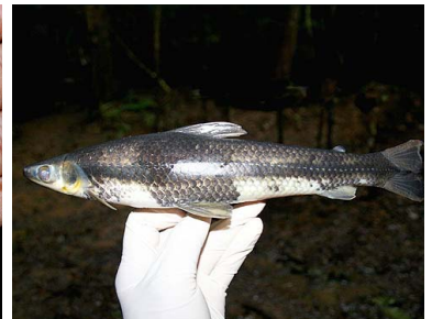
40 Lisa de cocha Rhytioidus argenteofuscus T: Etachane ANOSTOMIDAE