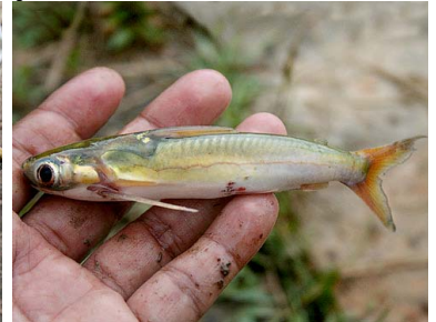
24 Cunchinovia Centromochlus heckeli T: Konero AUCHENIPTERIDAE