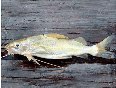
22 Cunchi Pimelodus blochii T: Moni PIMELODIDAE