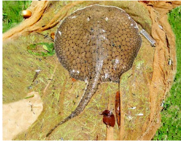
63 Raya Potamotrygon orbygni T: Na-a POTOMOTRYGONIDAE