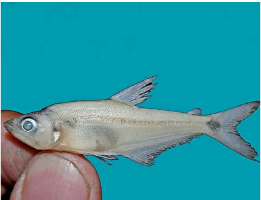
25 Guapeta Acestrocephalus boehlkei T: Tuu CHARACIDAE