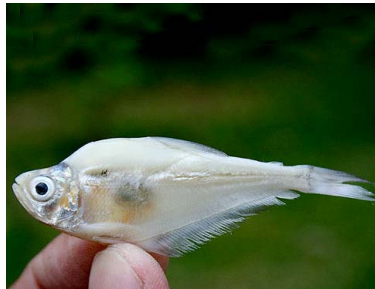
27 Dentón Roeboides myersii T: Tuu CHARACIDAE