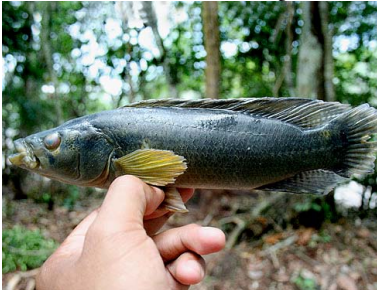
1 Botella Crenicichla proteus CICHLIDAE

Rapid Color Guide #299 versión 1 01/2013