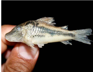
71 Shirui Corydoras fowleri T: Paikachi CALLICHTHYIDAE