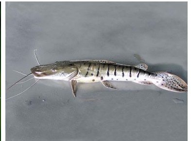
28 Pintadillo Pseudoplatystoma fasciatum T: Yuta PIMELODIDAE