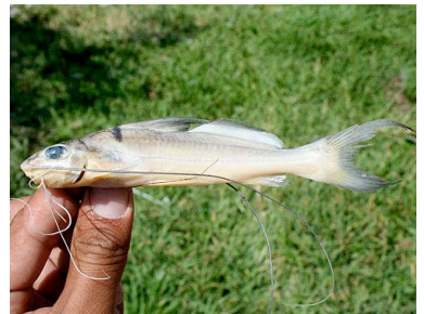
20 Mota Cheirocerus eques T: Kurui PIMELODIDAE