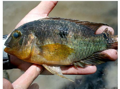
8 Bujurqui Aequidens tetramerus T: Owa CICHLIDAE