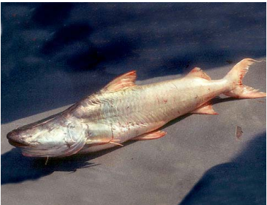
29 Bocón Brachyplatystoma rousseauxii T: Doma PIMELODIDAE