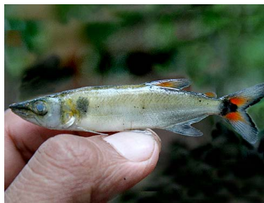
58 Perro Acestrorhynchus lacustris T: Yorewa ACESTRORHYNCHIDAE