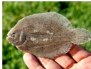
55 Pangaraya Achirus achirus T: Na-a ACHIRIDAE