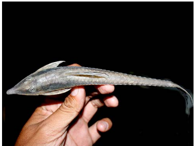
74 Carachama Sturisoma nigrirostrum T: Koayale LORICARIDAE