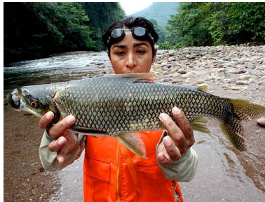
7 Boquichico Prochilodus nigricans T: Chirimata PROCHILODONTIDAE