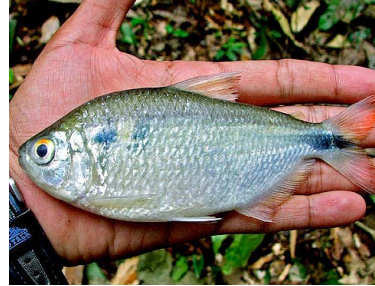
43 Sábalo de caño Astyanax bimaculatus T: Neechi CHARACIDAE