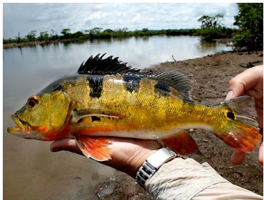
78 Tucunaré Cichla monoculus T: Tucunare CICHLIDAE