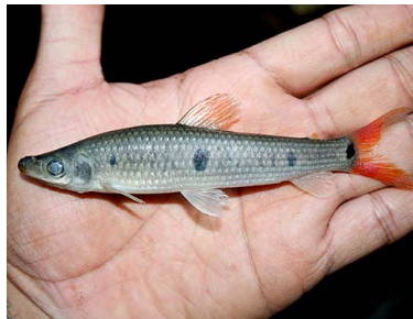
39 Lisa Pseudanos trimaculatus T: Tururi ANOSTOMIDAE