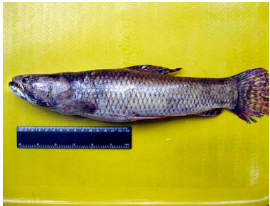
30 Fasaco Hoplias malabaricus T: De ERYTHRINIDAE