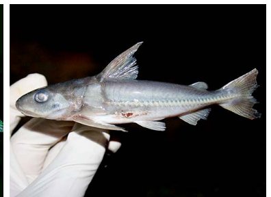
60 Pirillo Nemadoras cf. humeralis T: Tauni DORADIDAE