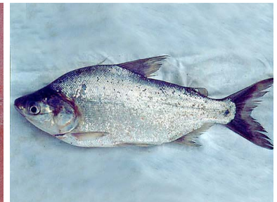
80 Dentón Potamorhina altamazonica T: Maparapa CURIMATIDAE