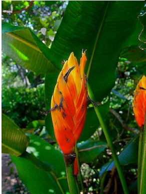
40 Heliconia episcopalis HELICONIACEAE

Fotos de: C.A. Zaldini (zaldini74@gmail.com), M. Bocayuva, & P. Leitman. Produzido por: R. Foster, T. Wachter, com apoio de: A. Mellon Foundation, G. & B. Moore Foundation. © M. Bocayuva (melissabocayuva@hotmail.com) Jardim Botânico do Rio de Janeiro, R. Pacheco Leão nº915, 22460-030, RdJ, Brasil. Agradecimentos a Luiz Menini Neto e João Ramalho de Castro. © Environmental & Conservation Programs, The Field Museum, Chicago, IL 60605 USA. [www.fmnh.org/plantguides] [RRC@fmnh.org] Rapid Color Guide # 192 versão 2 07/2006