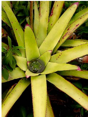
26 Neoregelia cruenta BROMELIACEAE