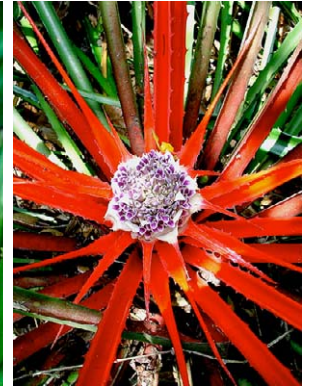
24 Bromelia antiacantha BROMELIACEAE