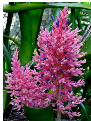
18 Aechmea purpureo-rosea BROMELIACEAE