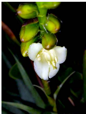
36 Vriesia goniorhachis BROMELIACEAE