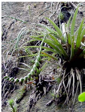
35 Vriesia goniorhachis BROMELIACEAE