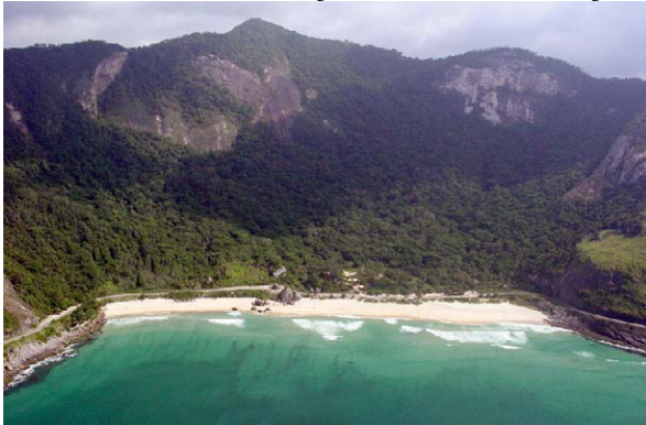
1 Vista de Parque Natural Municipal da Prainha View of Prainha Municipal Natural Park

Produzido por: R. Foster, T. Wachter, com apoio de: A. Mellon Foundation, G. & B. Moore Foundation. Jardim Botânico do Rio de Janeiro, R. Pacheco Leão nº915, 22460-030, RdJ, Brasil. Agradecimentos a Luiz Menini Neto e João Ramalho de Castro. © Environmental & Conservation Programs, The Field Museum, Chicago, IL 60605 USA. [www.fmnh.org/plantguides] [RRC@fmnh.org] Rapid Color Guide # 192 versão 1 07/2006