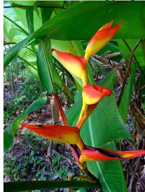
42 Heliconia spathocircinata HELICONIACEAE