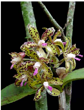
50 Cattleya guttata ORCHIDACEAE