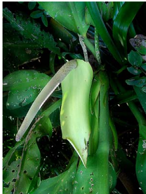
6 Anthurium coriaceum ARACEAE