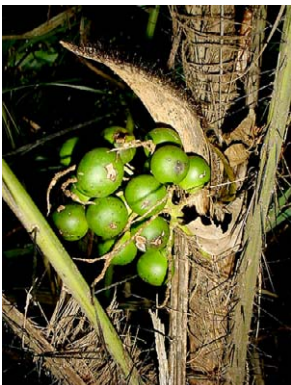
10 Bactris vulgaris ARECACEAE