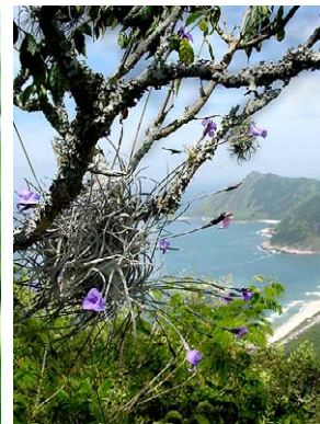
33 Tillandsia malemontii BROMELIACEAE