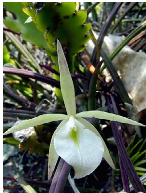
47 Brassavola tuberculata ORCHIDACEAE