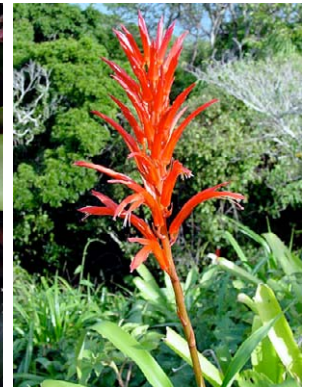
29 Pitcairnia flammaea BROMELIACEAE