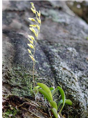
66 Pleurothallis grobyi ORCHIDACEAE