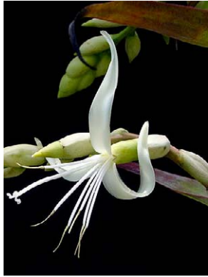
21 Alcantarea glaziouana BROMELIACEAE