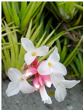
31 Tillandsia araujei BROMELIACEAE