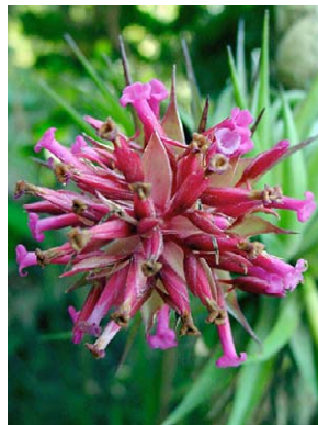
32 Tillandsia geminiflora BROMELIACEAE