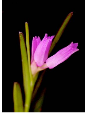
61 Isochilus linearis ORCHIDACEAE