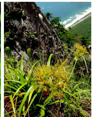
39 Cyperus coriifolius CYPERACEAE