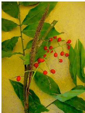
11 Desmoncus polyacanthos ARECACEAE