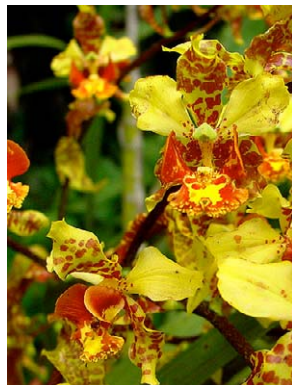
52 Cyrtopodium gigas ORCHIDACEAE