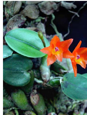
72 Sophronitis cernua ORCHIDACEAE