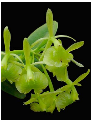
55 Epidendrum difforme ORCHIDACEAE