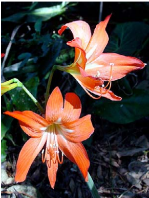
5 Hippeastrum aulicum AMARYLLIDACEAE