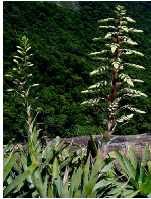
20 Alcantarea glaziouana BROMELIACEAE

Photos: C.A. Zaldini (zaldini74@gmail.com), M. Bocayuva, & P. Leitman. Produced by: R. B. Foster & T. Wachter, with assistance from the A. Mellon Foundation, G. & B. Moore Foundation. © M. Bocayuva (melissabocayuva@hotmail.com) Jardim Botânico do Rio de Janeiro, R. Pacheco Leão nº915, 22460-030, RdJ, Brasil. Thanks to Luiz Menini Neto and João Ramalho de Castro. © Environmental & Conservation Programs, The Field Museum, Chicago, IL 60605 USA. [www.fmmh.org/plantguides] [RRC@fmmh.org] Rapid Color Guide # 192 version 2 07/2006