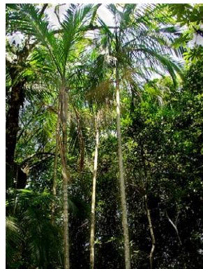
12 Euterpe edulis ARECACEAE