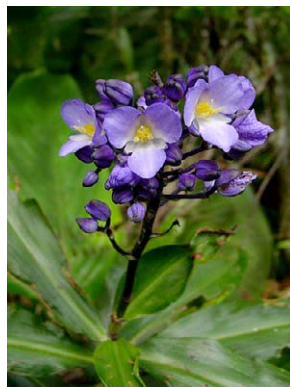
37 Dichorisandra thyrsoiflora COMMELINACEAE