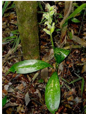
71 Sarcoglottis grandiflora ORCHIDACEAE