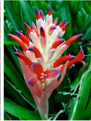
23 Billbergia pyramidalis BROMELIACEAE