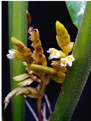
46 Saranthe eichleri MARANTACEAE