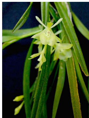
57 Epidendrum filicaule ORCHIDACEAE