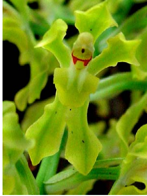
60 Gomesa crispa ORCHIDACEAE