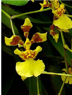
65 Oncidium longipes ORCHIDACEAE