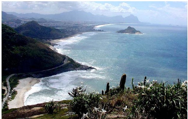
77 Vista da vertente norte da área de estudo View of the northern slope of the study area