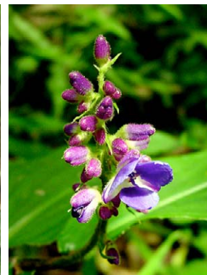
38 Dichorisandra villosula COMMELINACEAE