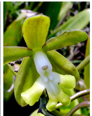
54 Epidendrum ammophilum ORCHIDACEAE