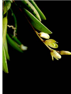
67 Pleurothallis muscosa ORCHIDACEAE