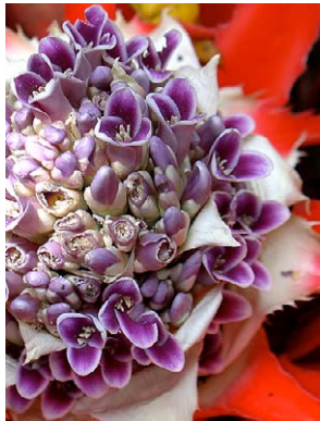
25 Bromelia antiacantha BROMELIACEAE