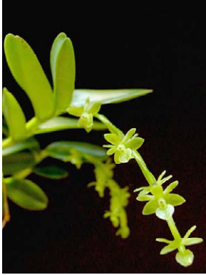
59 Epidendrum rigidum ORCHIDACEAE

Photos: C.A. Zaldini (zaldini74@gmail.com), M. Bocayuva, & P. Leitman. Produced by: R. B. Foster & T. Wachter, with assistance from the A. Mellon Foundation, G. & B. Moore Foundation. © M. Bocayuva (melissabocayuva@hotmail.com) Jardim Botânico do Rio de Janeiro, R. Pacheco Leão nº915, 22460-030, RdJ, Brasil.. Thanks to Luiz Menini Neto and João Ramalho de Castro. © Environmental & Conservation Programs, The Field Museum, Chicago, IL 60605 USA. [www.fmnh.org/plantguides] [RRC@fmnh.org] Rapid Color Guide # 192 version 2 07/2006