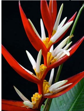
41 Heliconia laneana HELICONIACEAE