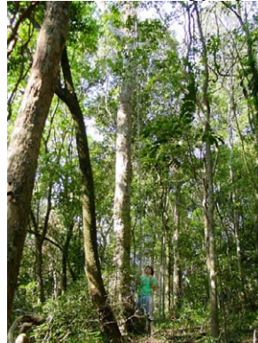
2 Interior de Mata Atlântica Interior of Atlantic Forest