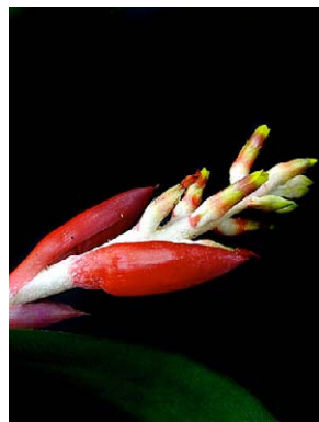
17 Aechmea nudicaulis BROMELIACEAE