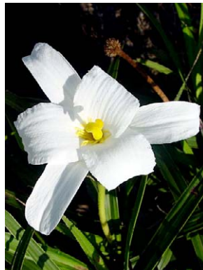
76 Vellozia candida VELLOZIACEAE