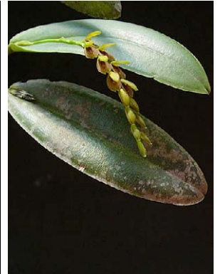
68 Pleurothallis pardipes ORCHIDACEAE