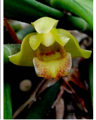
63 Maxillaria pachyphylla ORCHIDACEAE