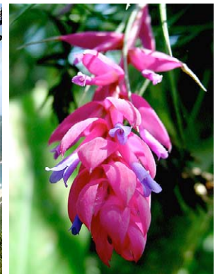
34 Tillandsia stricta BROMELIACEAE