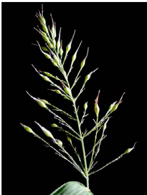
74 Olyra latifolia POACEAE