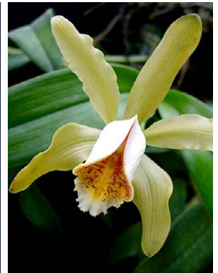
49 Cattleya forbesii ORCHIDACEAE