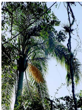
16 Syagrus romanzoffiana ARECACEAE