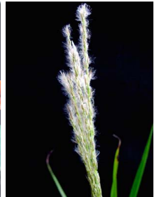
73 Digitaria insularis POACEAE