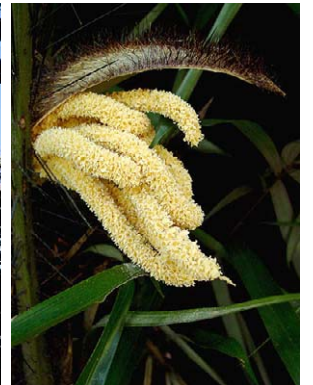
9 Bactris vulgaris ARECACEAE