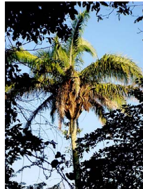
8 Attalea dubia ARECACEAE