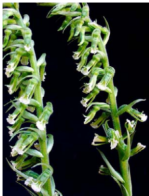
51 Cyclopogon longibracteatus ORCHIDACEAE