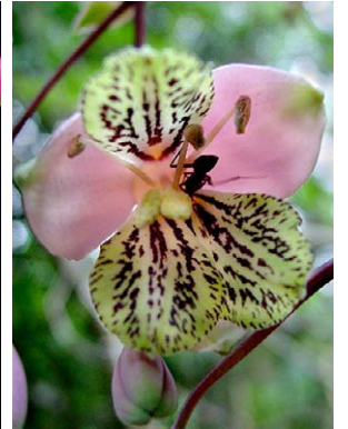
4 Bomarea edulis ALSTROEMERiaceae