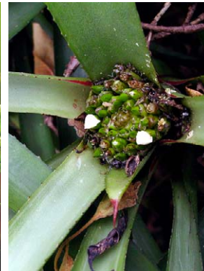
28 Neoregelia sarmentosa BROMELIACEAE