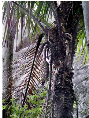
7 Astrocaryum aculeatissimum ARECACEAE