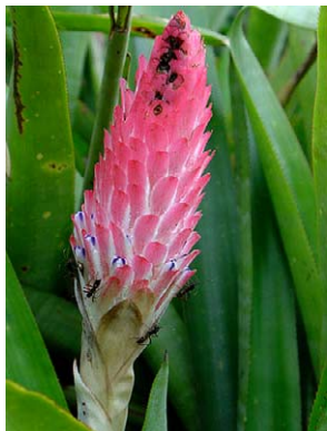
30 Quesnelia quesneliana BROMELIACEAE