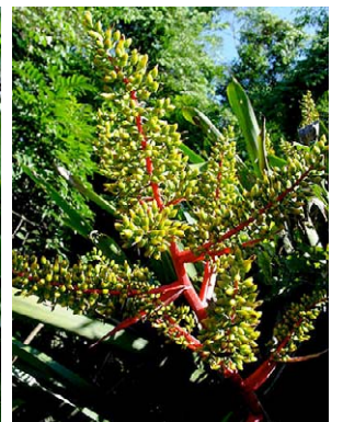
19 Aechmea ramosa BROMELIACEAE