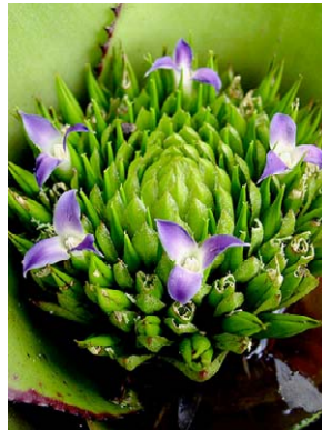
27 Neoregelia cruenta BROMELIACEAE