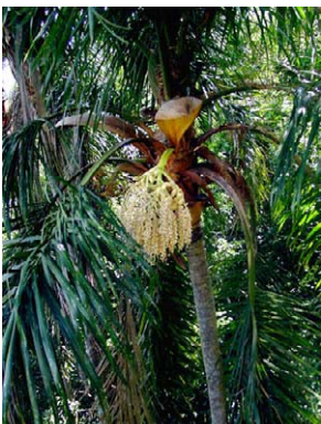
15 Syagrus pseudococos ARECACEAE