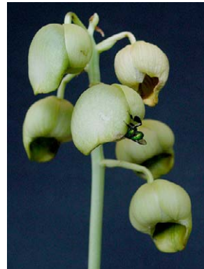
48 Catasetum luridum ORCHIDACEAE