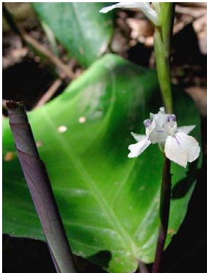
45 Maranta bicolor MARANTACEAE