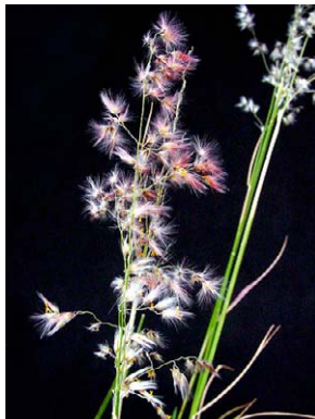
75 Rhynchelytrum repens POACEAE