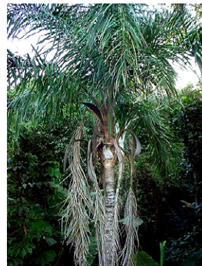
13 Syagrus picrophylla ARECACEAE