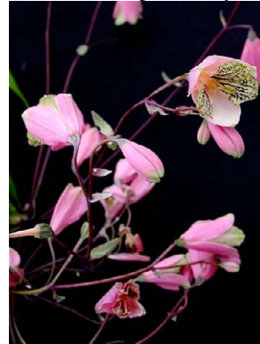
3 Bomarea edulis ALSTROEMERiaceae