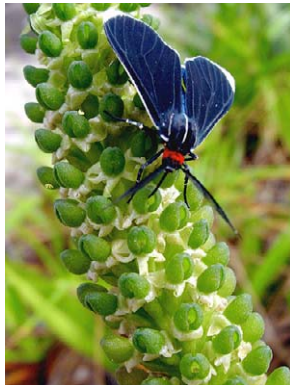
70 Prescottia plantaginea ORCHIDACEAE