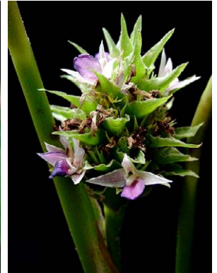
44 Calathea longibracteata MARANTACEAE