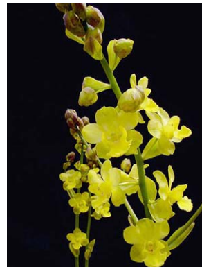
53 Cyrtopodium glutiniferum ORCHIDACEAE