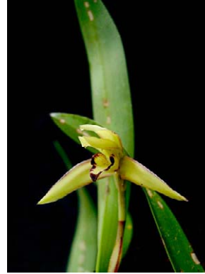
62 Maxillaria marginata ORCHIDACEAE