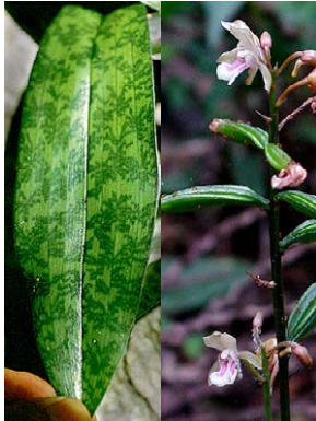
64 Oeceoclades maculata ORCHIDACEAE