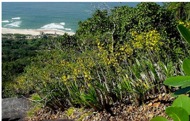
58 Vegetação de afloramento rochoso Rock outcrop vegetation with Cyrtopodium glutiniferum