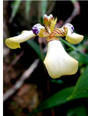
43 Trimezia juncifolia IRIDACEAE