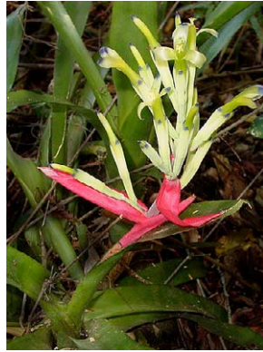
22 Billbergia amoena BROMELIACEAE