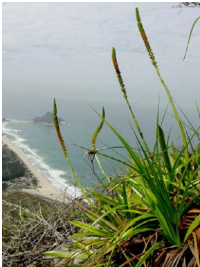
69 Prescottia plantaginea ORCHIDACEAE