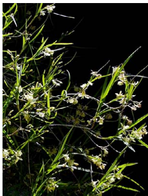
56 Epidendrum filicaule ORCHIDACEAE