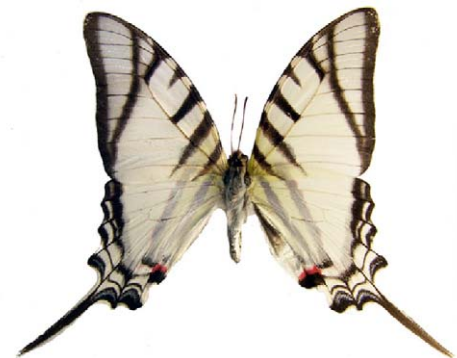
Protesilaus molops hetaerius