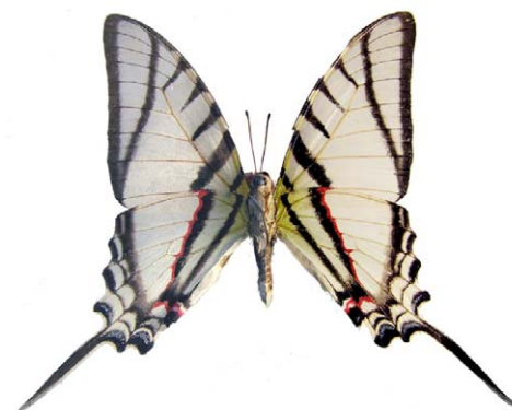
Protesilaus glaucolaus leucas