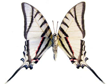
Protesilaus protesilaus protesilaus