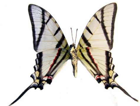
Protesilaus telesilaus telesilaus