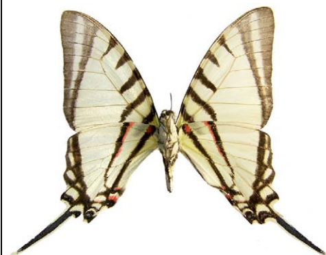
Protographium agesilaus autosilaus