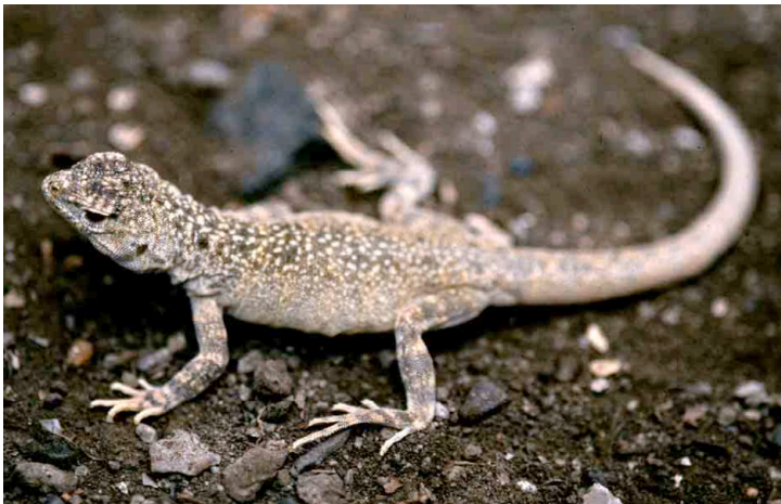
Ctenoblepharys adpersa TROPIDURIDAE