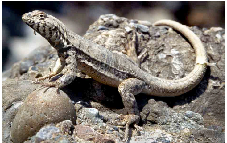
Microlophus peruvianus TROPIDURIDAE