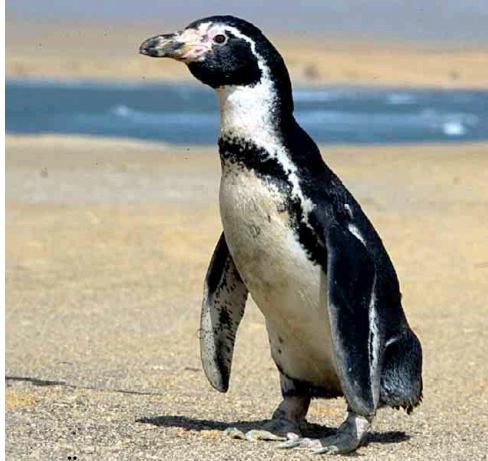
Pinguino de Humboldt–Humboldt Penguin Spheniscus humboldti