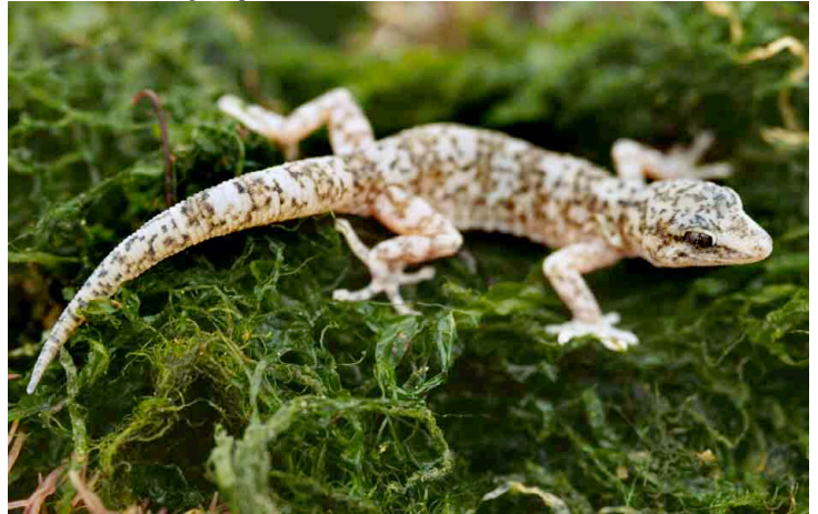
Phyllodactylus gerrhopygus GEKKONIDAE