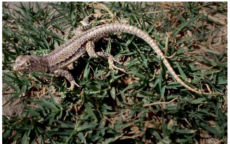
Microlophus thoracicus TROPIDURIDAE