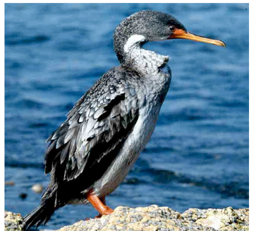
Chuita – Red-legged Cormorant Phalacrocorax gaimardi