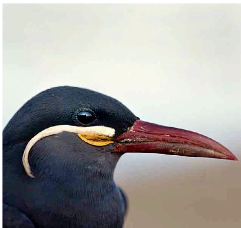
Zarcillo – Inca Tern Larosterna inca