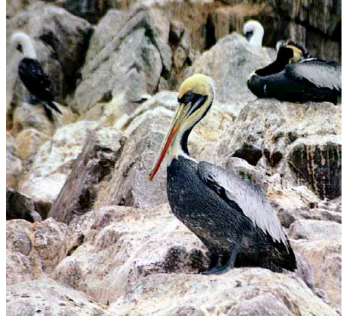
Pelícano, Alcatraz – Peruvian Pelican Pelecanus thagus