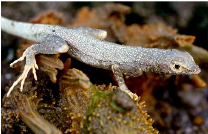
Microlophus theresiae TROPIDURIDAE