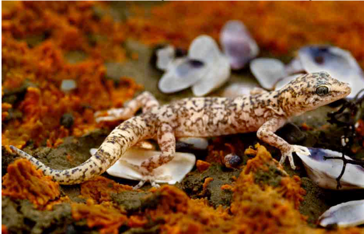
Phyllodactylus angustidigitus GEKKONIDAE

Fotos de Alessandro Catenazzi. Producido por: S. Kaplan, R. Foster y A. Catenazzi, con el apoyo de Gordon & Betty Moore Foundation. [ http://www.fmnh.org/animalguides/ ] © Alessandro Catenazzi [acaten01@fiu.edu]; apoyo de PADI Foundation, Amer. Museum of Natural History (The Lerner-Gray Fund), Organizacion para Estudios Tropicales © Environmental & Conservation Programs, The Field Museum, Chicago, IL 60605 USA. [RRC@fmnh.org] Rapid Color Guide #175 version 1