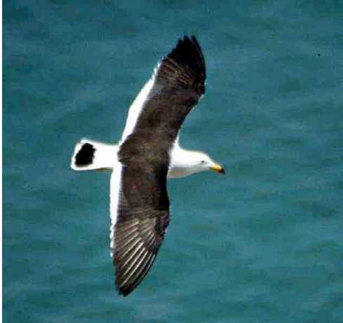
Gaviota Peruana – Belcher’s Gull Larus belcheri

Fotos de Alessandro Catenazzi. Producido por: S. Kaplan, R. Foster y A. Catenazzi, con el apoyo de Gordon & Betty Moore Foundation. [ http://www.fmh.org/animalguides/ ] © Alessandro Catenazzi [acaten01@fiu.edu]; apoyo de PADI Foundation, Amer. Museum of Natural History (The Lerner-Gray Fund), Organizacion para Estudios Tropicales © Environmental & Conservation Programs, The Field Museum, Chicago, IL 60605 USA. [RRC@fmnh.org] Rapid Color Guide #175 version 1