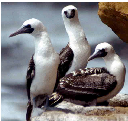
Piquero Peruano – Peruvian Booby Sula variegata