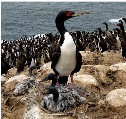
Guanay – Guanay Cormorant Phalacrocorax bougainvillii