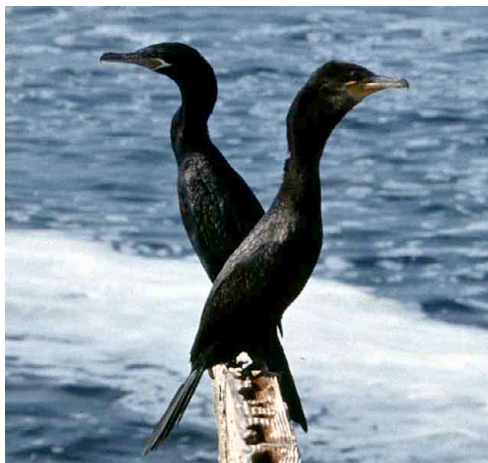
Cormorán Negro – Neotropic Cormorant Phalacrocorax brasilianus