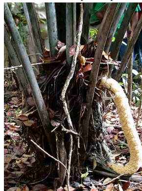
59 sagu Phytelphas seemannii