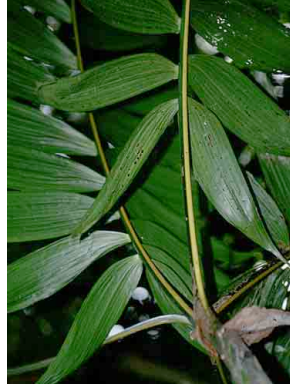
23 Chamaedorea tepejilote