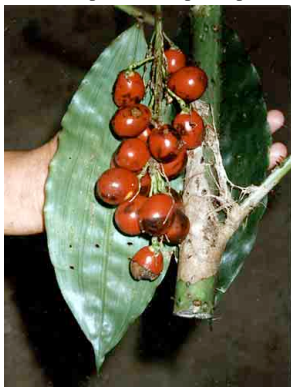
32 masguia Desmoncus cirriferus