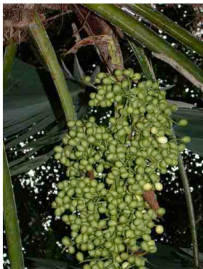
31 nubauala Cryosophila warscewiczii