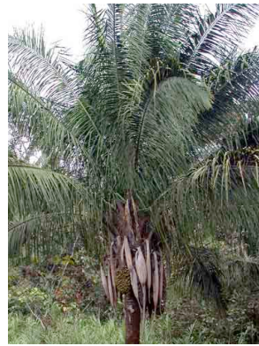
8 waa Attalea butyracea