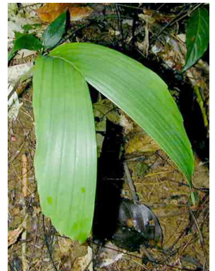
70 ila Socratea exorrhiza