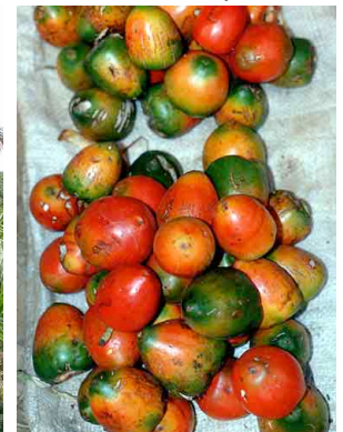
15 nalup Bactris gasipaes