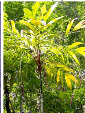
19 Calyptrogyne costatifrons