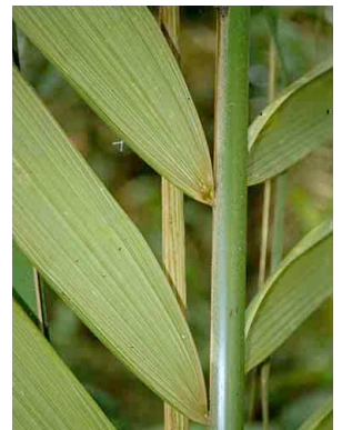
75 uagnug Welfia regia