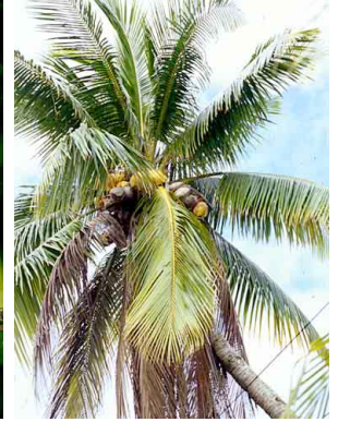
25 ocob Cocos nucifera