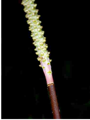
22 Calyptrogyne ghiesbreghtiana