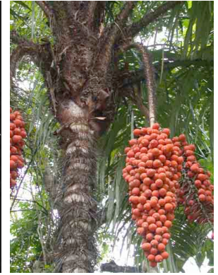
5 nabauala Astrocaryum standleyanum