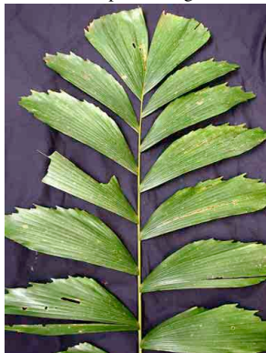
67 ila Socratea exorrhiza