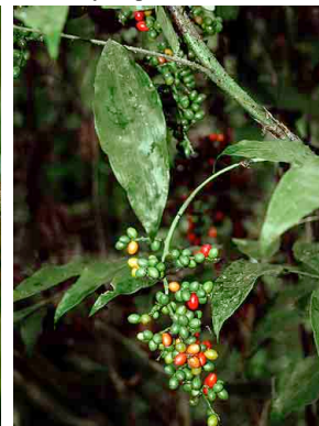
34 masguia dubaled Desmoncus orthacanthos