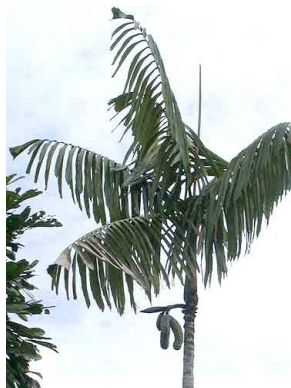
78 uku Wettinia panamensis