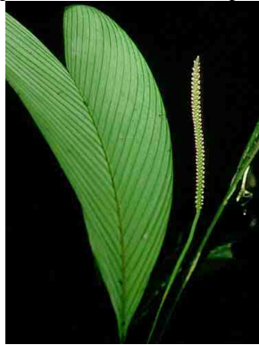
43 Geonoma cuneata