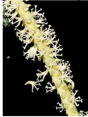
3 Asterogyne martiana