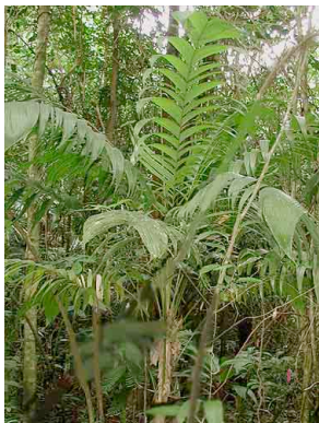
71 uagnug Synecanthus warscewiczianus