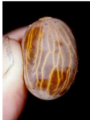
69 ila Socratea exorrhiza