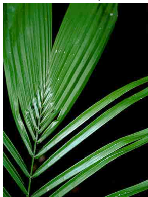
12 waa Attalea butyracea