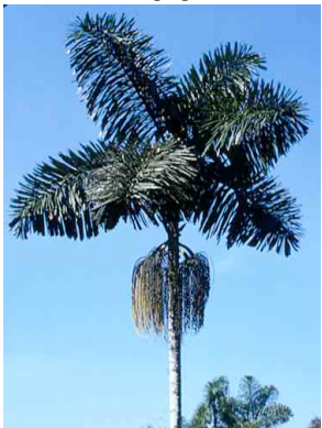
46 irsu Iriartea deltoidea