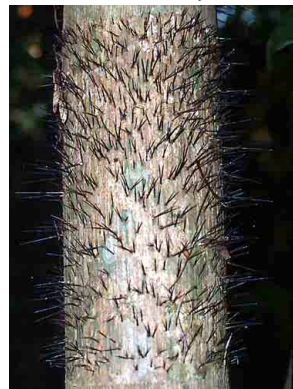
13 nalup Bactris gasipaes