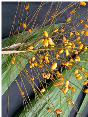
72 uagnug Synecanthus warscewiczianus