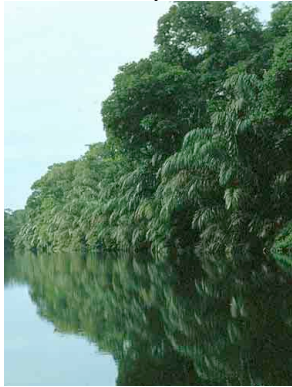
61 nadi Raphia taedigera

Producido por: R. Foster, R. Paredes, y S. Kaplan; con el apoyo del Andrew Mellon Foundation, Gordon & Betty Moore Foundation, Instituto Smithsonian de Investigaciones Tropicales, Greg de Nevers, Panamá Environmental Service, y Abia Yala de Kuna Yala. Disponible en [www.fmnh.org/plantguides]. © Abia Yala [fundabiayala@hotmail.com] y Environmental & Conservation Programs, The Field Museum, Chicago, IL 60605 USA. [RRC@fmnh.org] Rapid Color Guide # 168 version 1.0