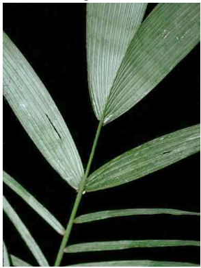
6 nabauala Astrocaryum standleyanum