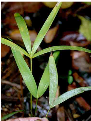
56 siler Oenocarpus mapora