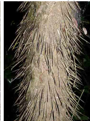
29 nubauala Cryosophila warscewiczii