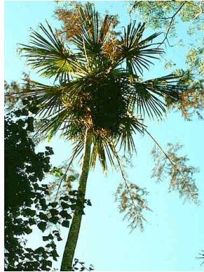
63 soso Sabal mauritiiformis