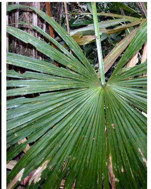
30 nubauala Cryosophila warscewiczii