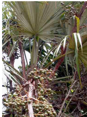
28 udirbi Colpothrinax aphanopetala