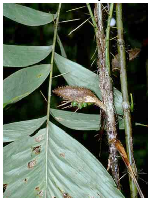
17 maski Bactris hondurensis