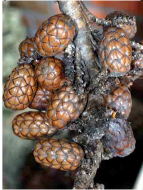
62 nadi Raphia taedigera