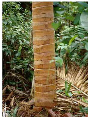
74 uagnug Welfia regia