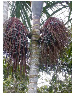
55 siler Oenocarpus mapora