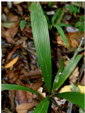
11 waa Attalea butyracea