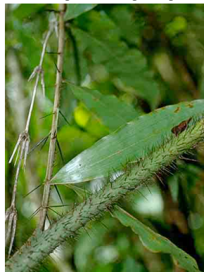
33 masguia dubaled Desmoncus orthacanthos