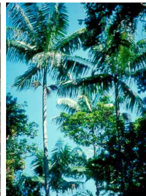
39 Euterpe precatória