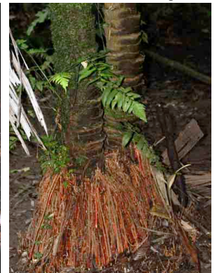
50 uerug Manicaria saccifera