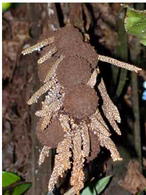
52 uerug Manicaria saccifera