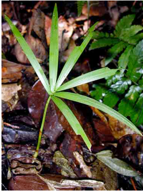
42 Euterpe precatoria