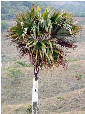
27 udirbi Colpothrinax aphanopetala