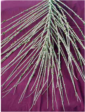
41 Euterpe precatoria