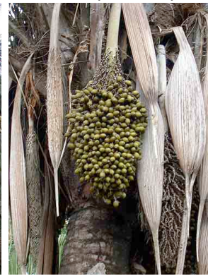
9 waa Attalea butyracea