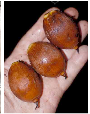
10 waa Attalea butyracea