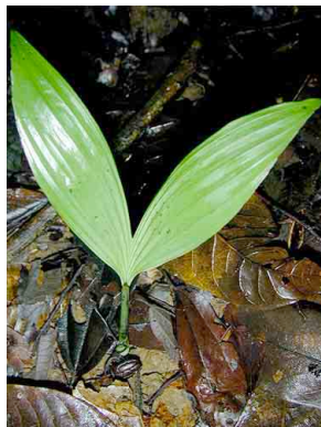
73 uagnug Synecanthus warscewiczianus