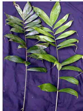
18 Bactris panamensis