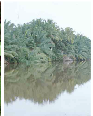
35 samagaa Elaeis oleifera