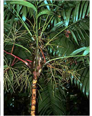
45 Geonoma interrupta