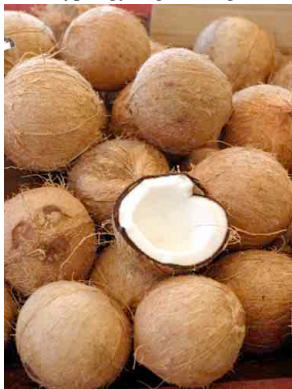
26 ocob Cocos nucifera