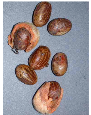
80 uku Wettinia panamensis