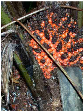
37 samagaa Elaeis oleifera