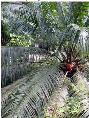
36 samagaa Elaeis oleifera