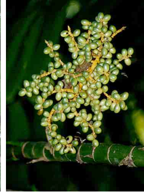
24 Chamaedorea tepejilote