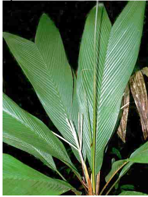
2 Asterogyne martiana