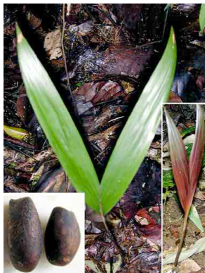
77 uku Wettinia panamensis