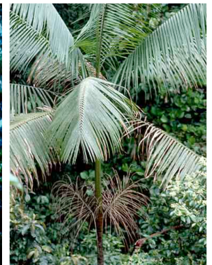
40 Euterpe precatória