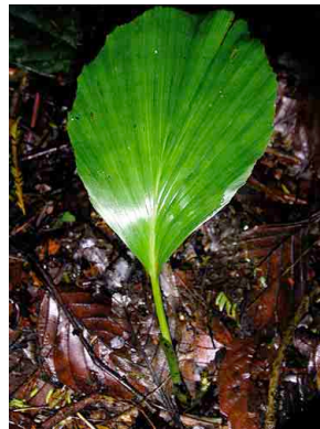
49 irsu Iriartea deltoidea