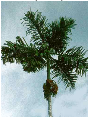
66 ila Socratea exorrhiza