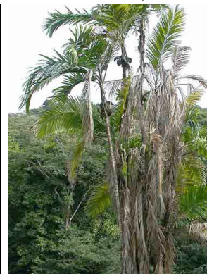
14 nalup Bactris gasipaes