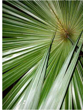
64 soso Sabal mauritiiformis