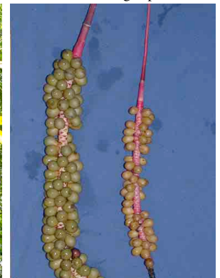
20 Calyptrogyne costatifrons