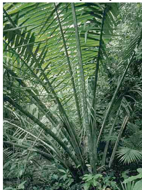
58 sagu Phytelphas seemannii