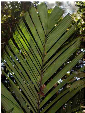
51 uerug Manicaria saccifera