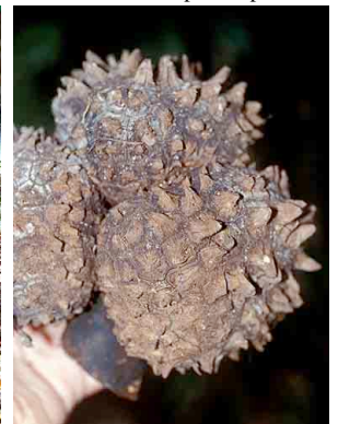
60 sagu Phytelphas seemannii