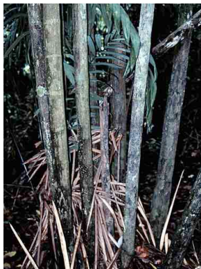
53 siler Oenocarpus mapora