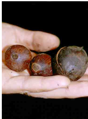
48 irsu Iriartea deltoidea