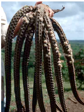
76 uku Wettinia panamensis