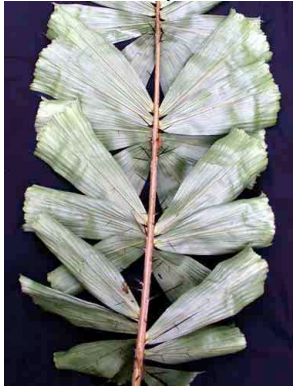
1 Aiphanes hirsuta

Producido por: R. Foster, R. Paredes, y S. Kaplan; con el apoyo del Andrew Mellon Foundation, Gordon & Betty Moore Foundation, Instituto Smithsonian de Investigaciones Tropicales, Greg de Nevers, Panamá Environmental Service, y Abia Yala de Kuna Yala. Disponible en [www.fmnh.org/plantguides]. © Abia Yala [fundabiyala@hotmail.com] y Environmental & Conservation Programs, The Field Museum, Chicago, IL 60605 USA. [RRC@fmnh.org] Rapid Color Guide # 168 version 1.0