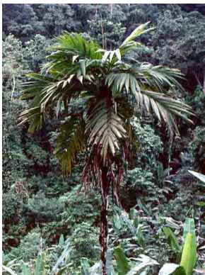
57 Pholidostachys synanthera