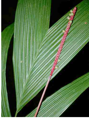
21 Calyptrogyne ghiesbreghtiana