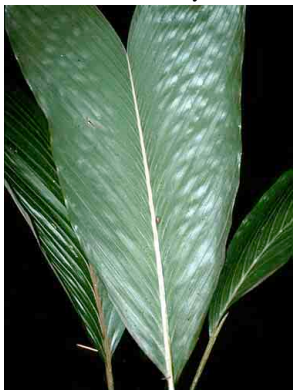
16 maski Bactris hondurensis