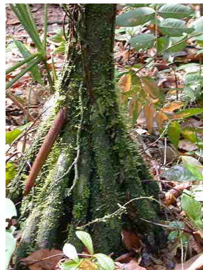
79 uku Wettinia panamensis