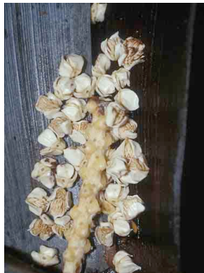
68 ila Socratea exorrhiza