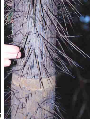
4 nabauala Astrocaryum standleyanum