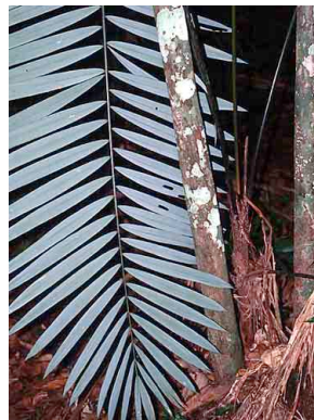
54 siler Oenocarpus mapora