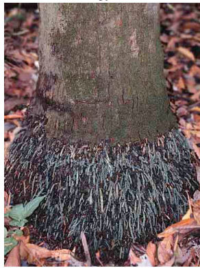
7 waa Attalea butyracea