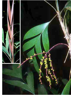
44 ugarpurui Geonoma deversa