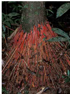
38 Euterpe precatória