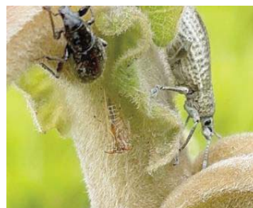
51 Scyphophorus acupunctatus CURCULIONIDAE