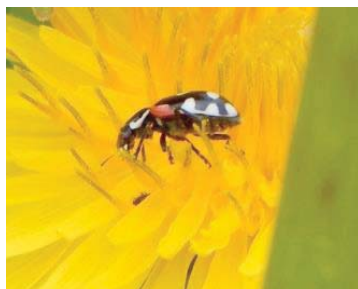
46 Eriopis connexa COCCINELLIDAE