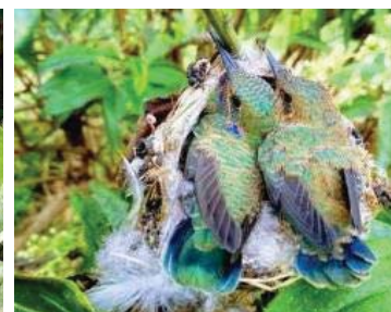
20 Colibri coruscans (Juv.) TROCHILIDAE