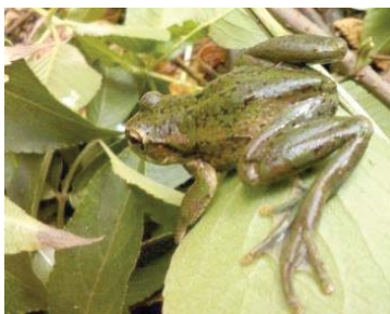
29 Dendropsophus molitor HYLIDAE