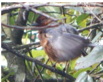
17 Conirostrum rufum THRAUPIDAE