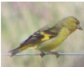
13 Sporagra spinescens FRINGILLIDAE