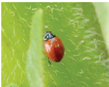
45 Cycloneda sanguinea COCCINELLIDAE