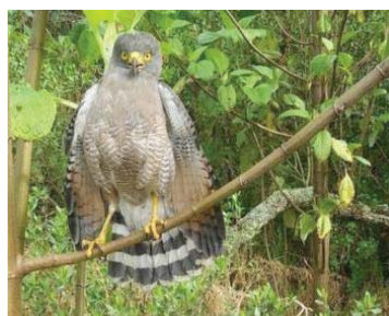
2 Rupornis magnirostris ACCIPITRIDAE