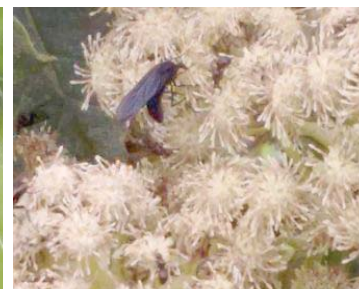
44 Plecia sp. BIBIONIDAE