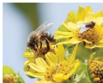
39 Apis mellifera APIDAE