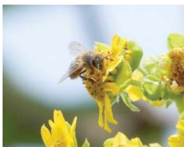
37 Apis mellifera APIDAE