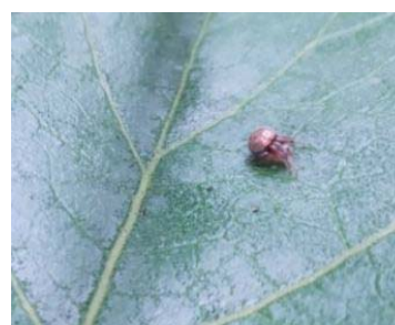
70 Theridion sp. THERIDIIDAE