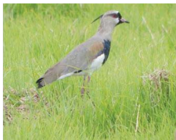
10 Vanellus chilensis CHARADRIIDAE