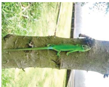
33 Anolis heterodermus DACTYLOIDAE