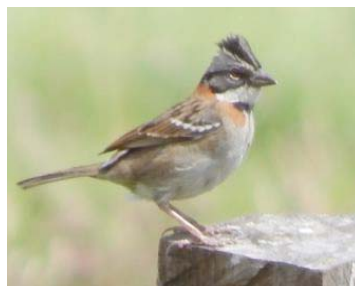
11 Zonotrichia capensis EMBERIZIDAE