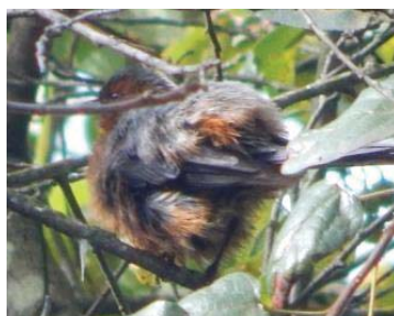
18 Conirostrum rufum THRAUPIDAE