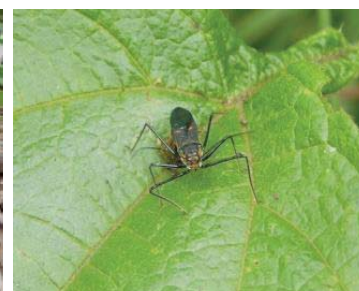
64 Leptocoris trivittatus RHOPALIDAE