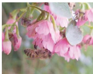
38 Apis mellifera APIDAE