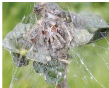
43 Cyclosa berlandi ARANEIDAE