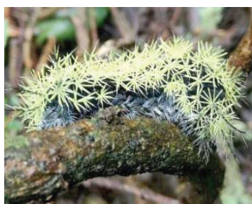
65 Leucanella viridescens SATURNIIDAE