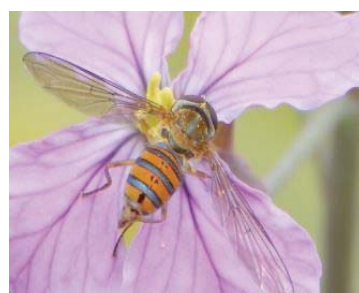
69 Toxomerus duplicatus SYRPHIDAE