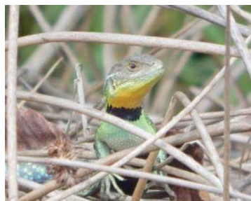
34 Stenocercus trachycephalus TROPIDURIDAE