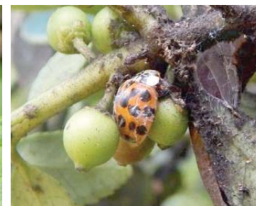
48 Harmonia axyridis COCCINELLIDAE