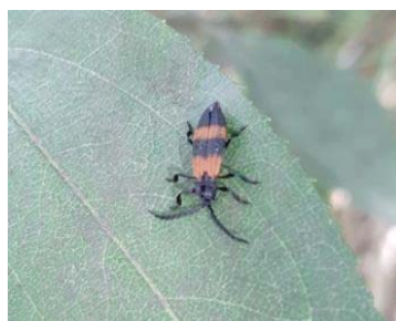
54 Oncopeltus fasciatus LYGAEIDAE