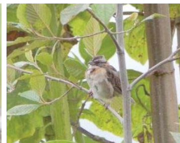
12 Zonotrichia capensis EMBERIZIDAE