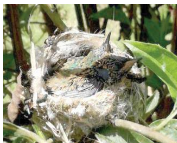
19 Colibri coruscans (Juv.) TROCHILIDAE