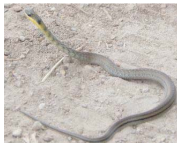
31 Atractus crassicaudatus COLUBRIDAE