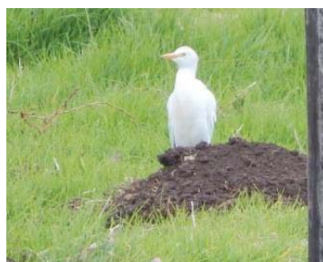
6 Bubulcus ibis ARDEIDAE