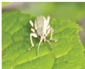
50 Compsus auricephalus CURCULIONIDAE