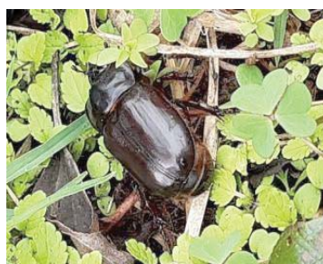
67 Ancognatha scarabaeoides SCARABAEIDAE