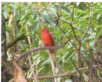
9 Piranga rubra CARDINALIDAE