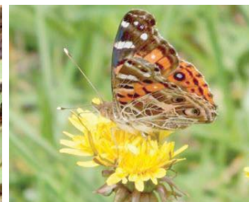
60 Vanessa virginiensis NYMPHALIDAE