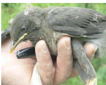
21 Turdus fuscater TURDIDAE