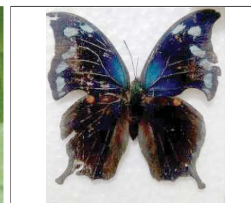
56 Cymmatogramma austrina NYMPHALIDAE