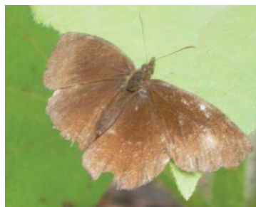
58 Panyapedaliodes drymaea NYMPHALIDAE