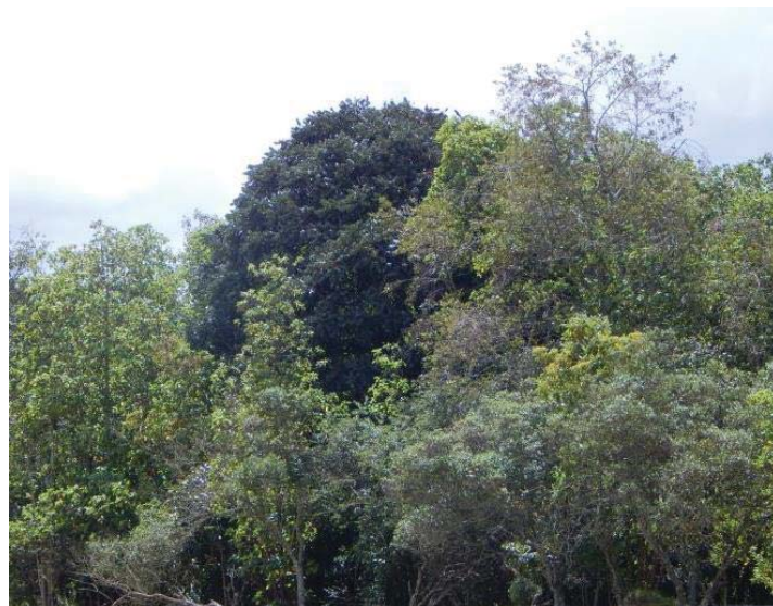
Bosque Las Mercedes, Bogotá D. C

El Bosque Las Mercedes se encuentra en la ciudad de Bogotá D. C. (Colombia) a los 4° 46'21" N y 74° 05'56" W a 2554 m.s.n.m. Por su singularidad ecológica y por ser el último relicto de bosque andino bajo de planicie no inundable e inundable de la Sabana de Bogotá, fue considerado en el Plan de Ordenamiento Territorial (POT 2000 y Decreto 190 de 2004) como parte del Sistema de Áreas Protegidas de Bogotá en la categoría de Santuario Distrital de Fauna y Flora (SFF) y se encuentra inmerso en la Reserva Forestal Regional Productora del Norte de Bogotá D.C., "Thomas Van der Hammen". Adicionalmente, la conservación de este ecosistema es fundamental al ser un conector ecológico con otros ecosistemas cercanos, como son Cerro de Majuy en Chía, el valle aluvial del Río Bogotá, la ronda hidráulica del Humedal La Conejera, el Cerro de la Conejera, los Humedales de Torca - Guaymaral y los Cerros Orientales. El objetivo de este trabajo fue contribuir con el conocimiento de la diversidad de fauna local para lo cual, se elabora este listado a partir del levantamiento de información de 16 parcelas permanentes y de las observaciones de fauna durante el proceso de restauración ecológica adelantado por la Subdirección Científica del Jardín Botánico de Bogotá desde el año 2011.