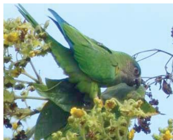
15 Forpus conspicillatus PSITTACIDAE