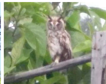
16 Pseudoscops clamator STRIGIDAE