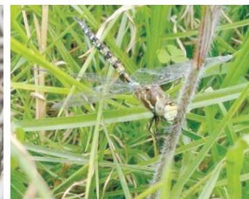
36 Rhionaeschna marchali AESHNIDAE