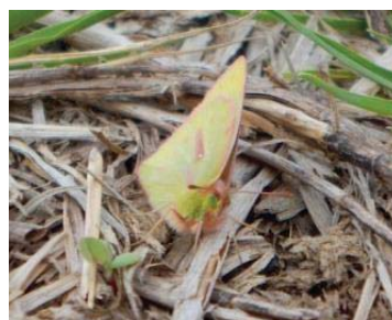
63 Colias dimera PIERIDAE