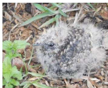
7 Systellura longirostris (Juv.) CAPRIMULGIDAE