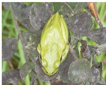
26 Dendropsophus molitor HYLIDAE