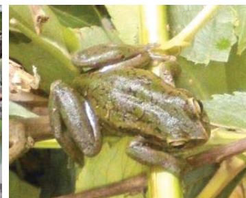
28 Dendropsophus molitor HYLIDAE