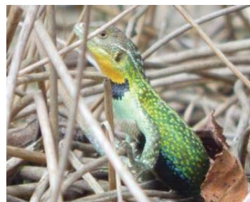
35 Stenocercus trachycephalus TROPIDURIDAE