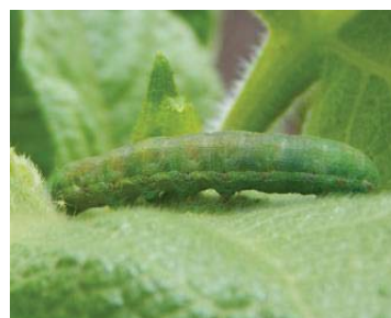
55 Autographa gamma NOCTUIDAE