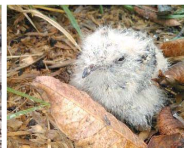
8 Systellura longirostris (Juv.) CAPRIMULGIDAE