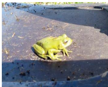
30 Dendropsophus molitor HYLIDAE