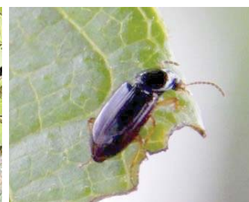
68 Aphodius rufipes SCARABAEIDAE