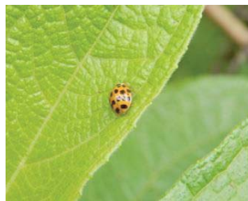
47 Harmonia axyridis COCCINELLIDAE