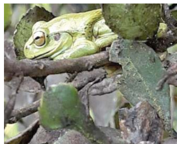
27 Dendropsophus molitor HYLIDAE