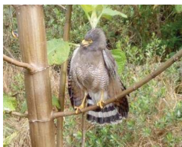
1 Rupornis magnirostris ACCIPITRIDAE