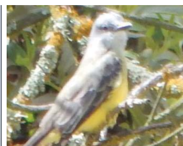
24 Tyrannus melancholicus TYRANNIDAE