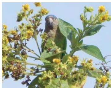
14 Forpus conspicillatus PSITTACIDAE