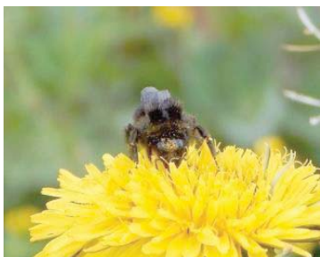
41 Bombus pauloensis APIDAE