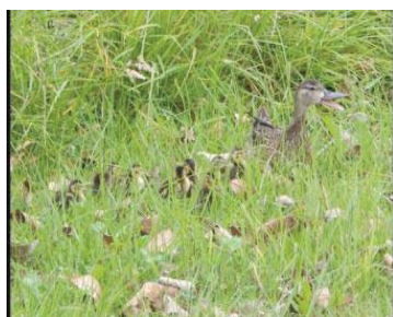
5 Anas discors ANATIDAE