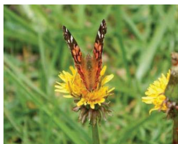
62 Vanessa virginiensis NYMPHALIDAE