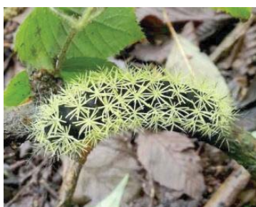
66 Leucanella viridescens SATURNIIDAE