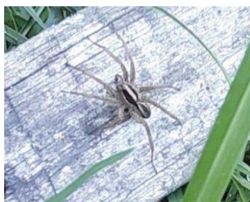
53 Lycosa thorelli LYCOSIDAE