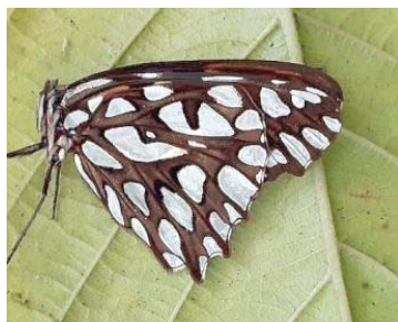
57 Dione glycera NYMPHALIDAE