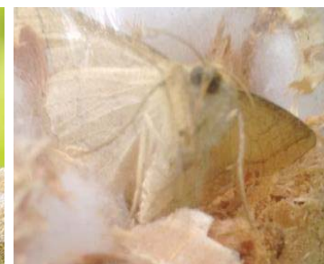
52 Achlyodes aff. pallida HESPERIIDAE