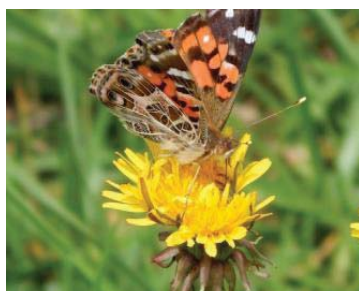
61 Vanessa virginiensis NYMPHALIDAE