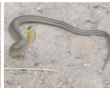
32 Atractus crassicaudatus COLUBRIDAE