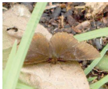
59 Panyapedaliodes drymaea NYMPHALIDAE