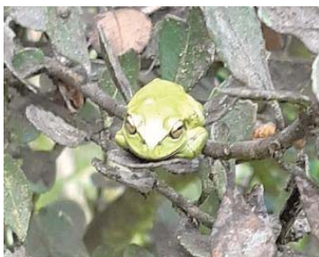
25 Dendropsophus molitor HYLIDAE