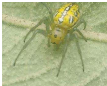
42 Alpaida variabilis ARANEIDAE