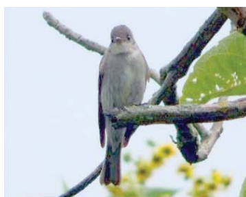
22 Contopus cooperi TYRANNIDAE