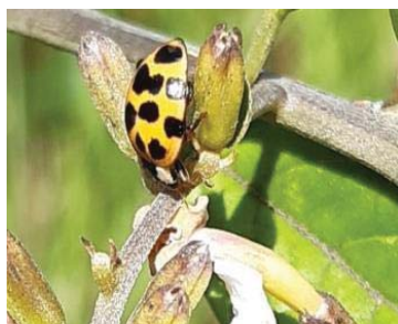
49 Harmonia axyridis COCCINELLIDAE