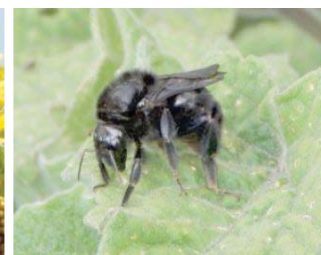
40 Bombus pauloensis APIDAE