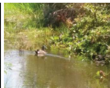
4 Anas discors ANATIDAE