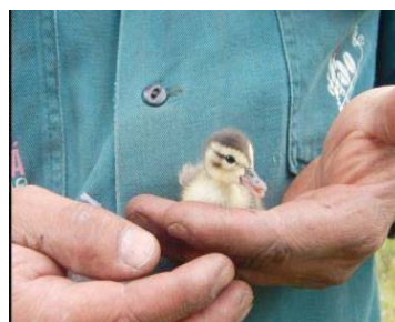
3 Anas discors (Juv.) ANATIDAE