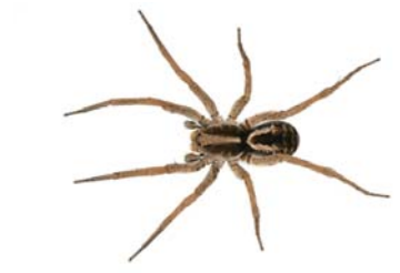
7 Lycosa sp. (H)