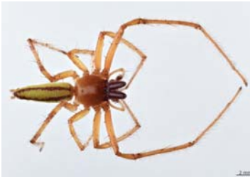
1 Hibana similaris (M)