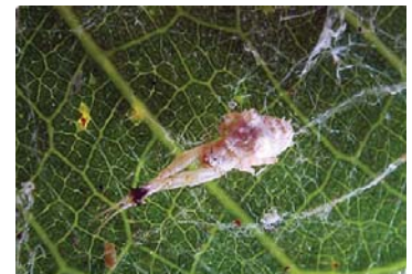
33 Uloborus sp. (H)