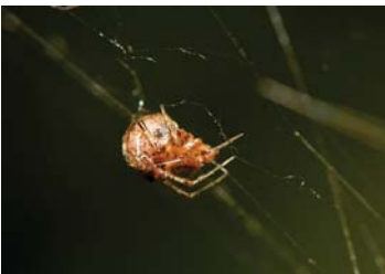
29 Tidarren sp. (H)