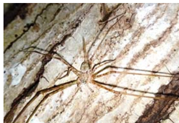
6 Neotama mexicana (M)