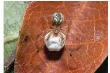
28 Anelosimus sp. (H)