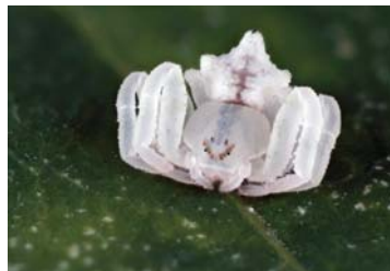
31 Epicadus sp. (JUV)