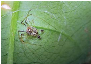
9 Gelanor zonatus (M)