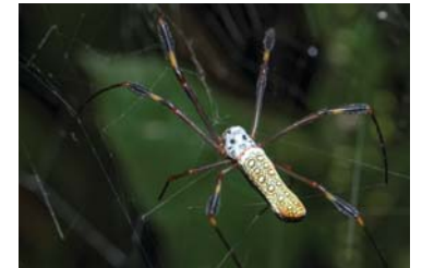
8 Trichonephila clavipes (H)