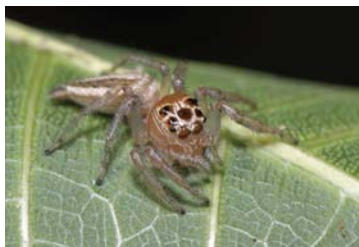
14 Colonus sp. (JUV)