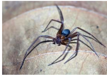
22 Loxosceles yucatana (M)