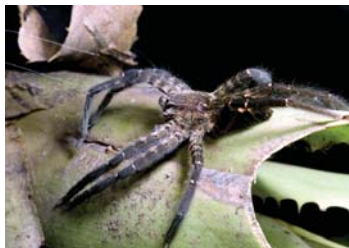
32 Cupiennius salei (H)