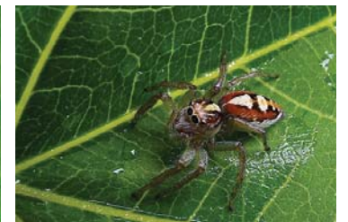
16 Frigga pratensis (H)