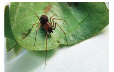
20 Scytodes fusca (H)