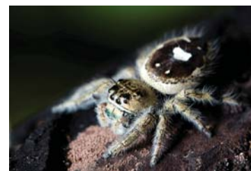
19 Phidippus bidentatus (H)