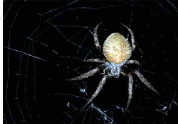
2 Eriophora sp. (JUV)