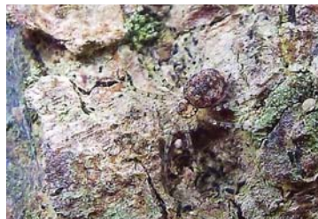
10 Oecobius concinnus (H)