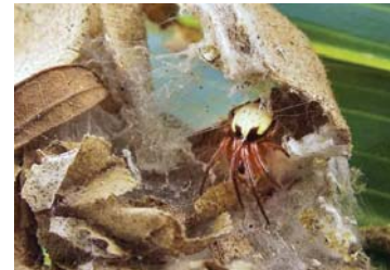
3 Metazygia chicanna (H)