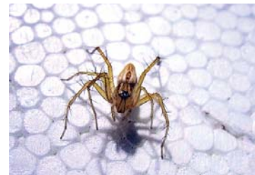
11 Oxyopes salticus (H)