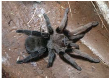
27 Crassicus sp. (H)