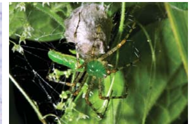
12 Peucetia viridans (H)