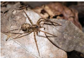
5 Acanthoctenus spinigerus (H)