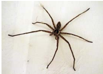
23 Heteropoda venatoria (M)