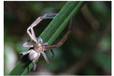
24 Curicaberis sp. (M)