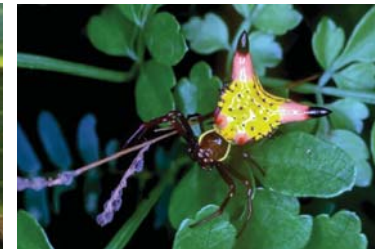
4 Micrathena sexpinosa (H)