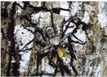
21 Selenops sp. (H)