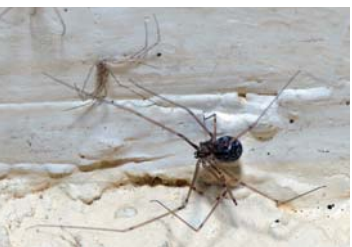
13 Physocyclus globosus (H)