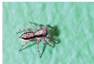
18 Menemerus bivittatus (JUV)