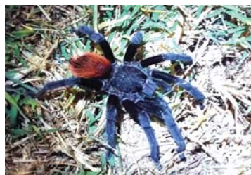
26 Tliltocatl vagans (M)