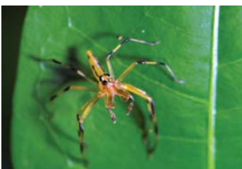
17 Lyssomanes sp. (JUV)