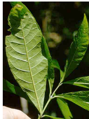
158 Petrea VERBENACEAE