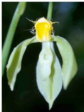
128 Catasetum sp. nov. ORCHIDACEAE