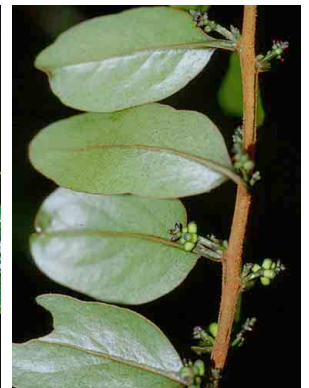
100 Oryctanthus spicatus LORANTHACEAE