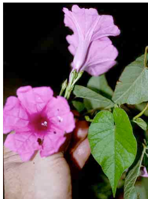
58 Ipomoea CONVOLVULACEAE