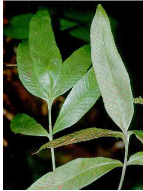
163 Asplenium PTERIDOPHYTA