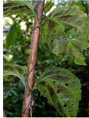
24 Mikania ASTERACEAE