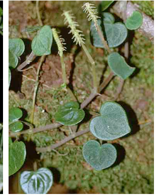
145 Peperomia serpens PIPERACEAE