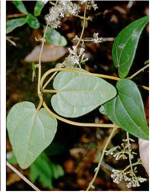
25 Mikania ASTERACEAE