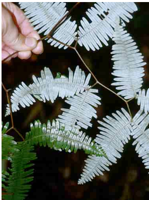
166 Dicranopteris flexuosa PTERIDOPHYTA