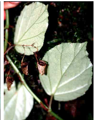
30 Begonia glabra BEGONIACEAE