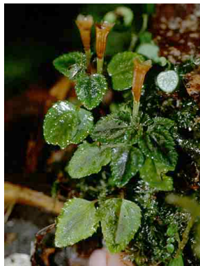
118 Anomospermum grandifolium MENISPERMACEAE