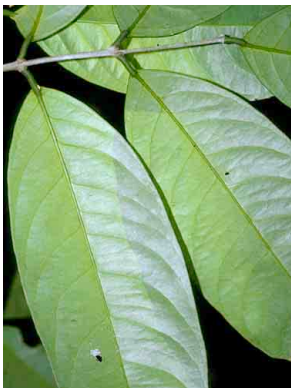
96 Salacia HIPPOCRATEACEAE