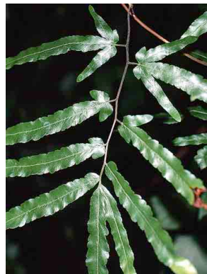
174 Lygodium volubile PTERIDOPHYTA