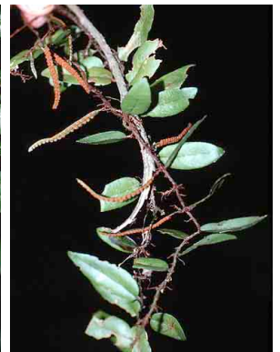
175 Microgramma reptans PTERIDOPHYTA