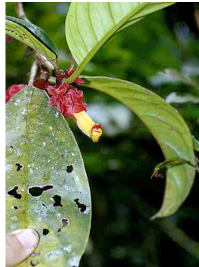
93 Drymonia semicordata GESNERIACEAE