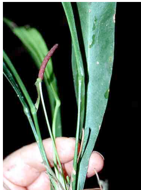
8 Anthurium gracile ARACEAE