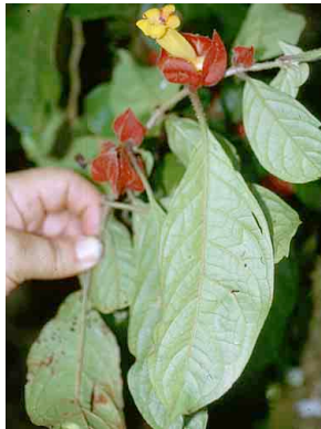
92 Drymonia affinis GESNERIACEAE