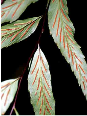
161 Asplenium serra PTERIDOPHYTA

© Environmental & Conservation Programs, The Field Museum, Chicago, IL 60605 USA. [RRC@fmnh.org] Rapid Color Guide # 106 version 1.2