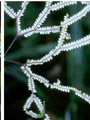
189 Sticherus PTERIDOPHYTA