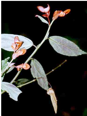
31 Begonia rossmanniae BEGONIACEAE