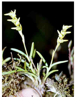
130 Jacquiniella ORCHIDACEAE