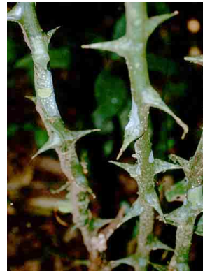
74 Dioscorea DIOSCOREACEAE