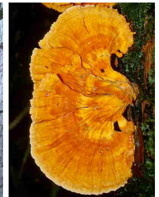
200 Laetiporus sulfureus FUNGI