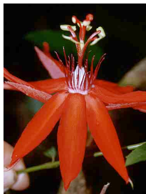
139 Passiflora coccinea PASSIFLORACEAE