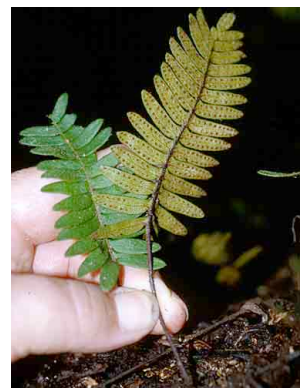
180 Polypodium PTERIDOPHYTA