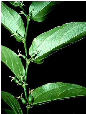
157 Celtis iguanea Ulmaceae