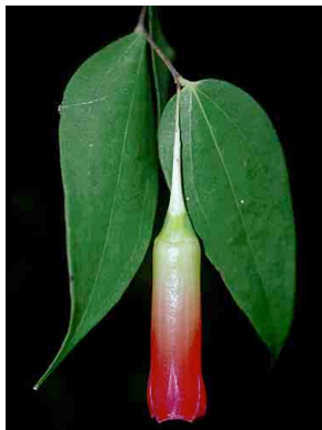
77 Semiramisia speciosa ERICACEAE