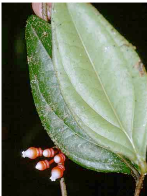
76 Psammisia ERICACEAE