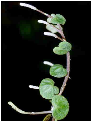
146 Peperomia PIPERACEAE