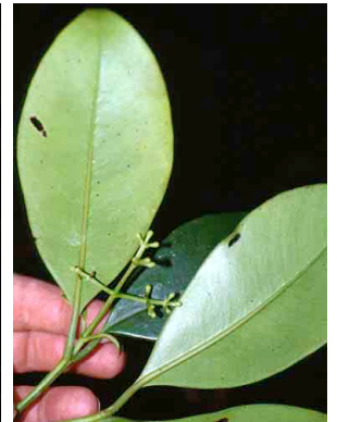
55 Clusia CLUSIACEAE