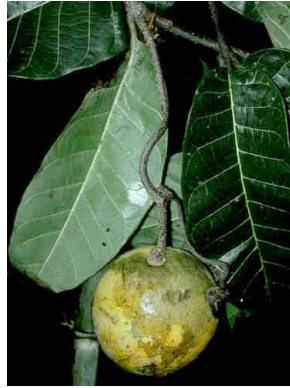
3 Pacouria boliviana APOCYNACEAE