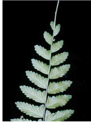
164 Asplenium PTERIDOPHYTA