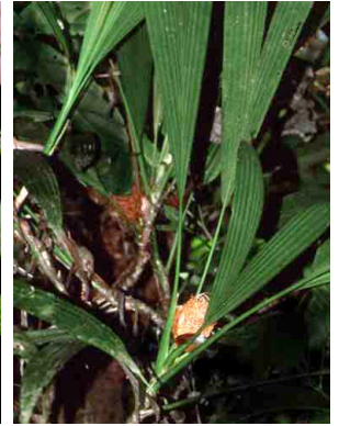
65 Evodianthus funifer CYCLANTHACEAE