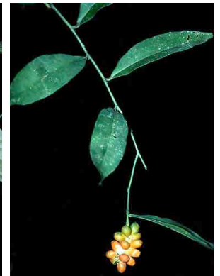
10 Heteropsis ARACEAE