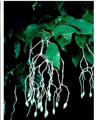
95 Sparattanthelium tarapotanum HERNANDIACEAE