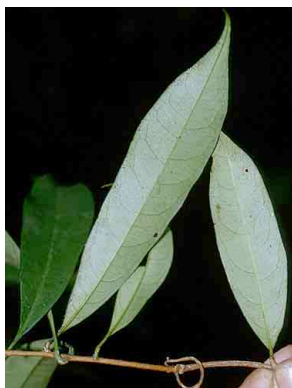
137 Dilkea PASSIFLORACEAE