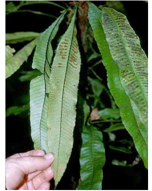
165 Campyloneurum PTERIDOPHYTA