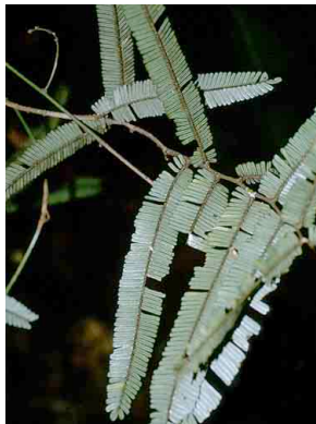
87 Machaerium FABACEAE