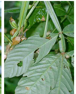
150 Paullinia bracteosa SAPINDACEAE