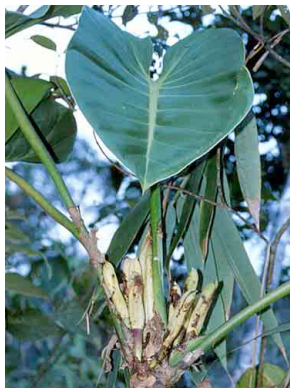
17 Philodendron ARACEAE