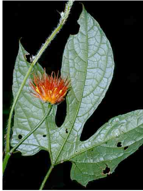
62 Gurania CUCURBITACEAE