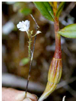
129 Epidendrum ORCHIDACEAE