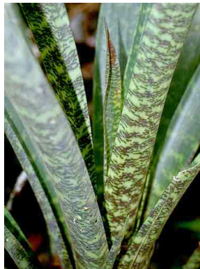
48 Vriesia BROMELIACEAE