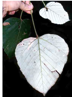
54 Coussapoa CECROPIACEAE