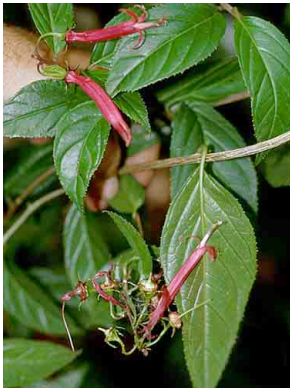
52 Siphocampylus CAMPANULACEAE