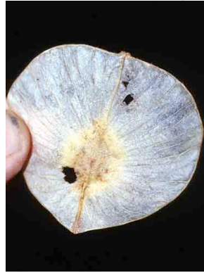
63 Pseudosicydium acariaeanthum CUCURBITACEAE