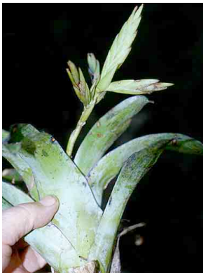
47 Tillandsia BROMELIACEAE