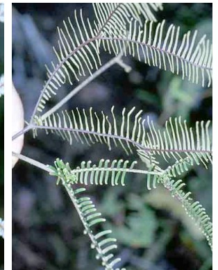
190 Sticherus PTERIDOPHYTA