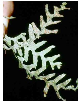
170 Lellingeria PTERIDOPHYTA