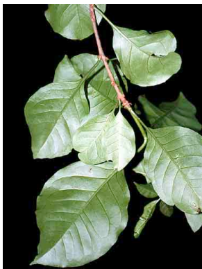
126 Pisonea aculeata NYCTAGINACEAE