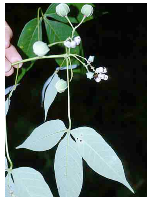
79 Manihot EUPHORBIACEAE