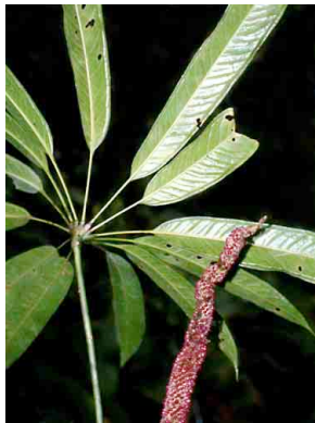
7 Anthurium eminens ARACEAE