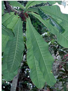
124 Ficus caballina MORACEAE