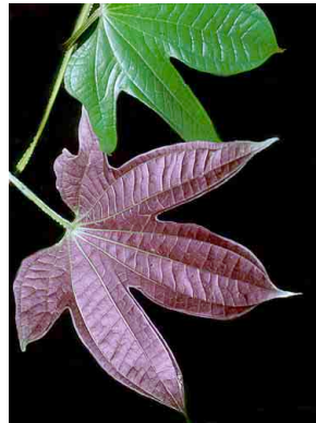
73 Dioscorea DIOSCOREACEAE