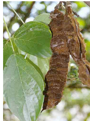
89 Mucuna FABACEAE