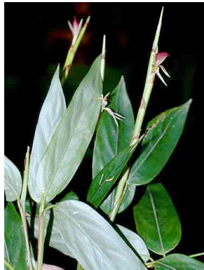
113 Ischnosiphon MARANTACEAE