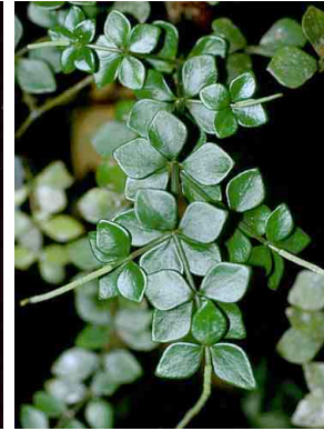
144 Peperomia quaesita PIPERACEAE