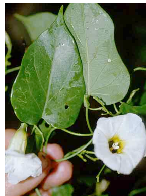
59 Ipomoea CONVOLVULACEAE