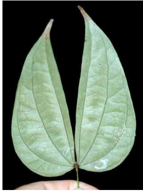
82 Bauhinia guianensis FABACEAE