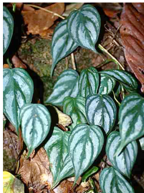
18 Philodendron ARACEAE