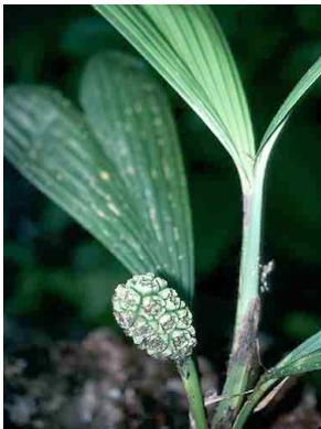
66 Thoracocarpus bissectus CYCLANTHACEAE