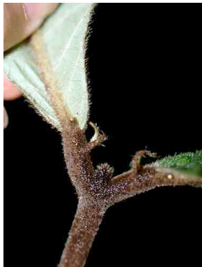
107 Hiraea grandifolia MALPIGHIACEAE