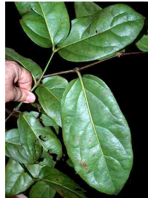
94 Gnetum GNETACEAE