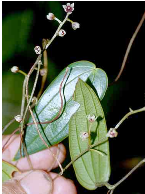
72 Dioscorea DIOSCOREACEAE