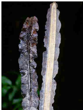
37 Cuspidaria BIGNONIACEAE