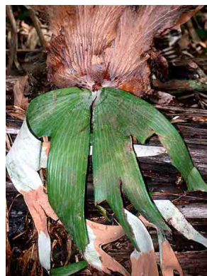
179 Platycerium andinum PTERIDOPHYTA