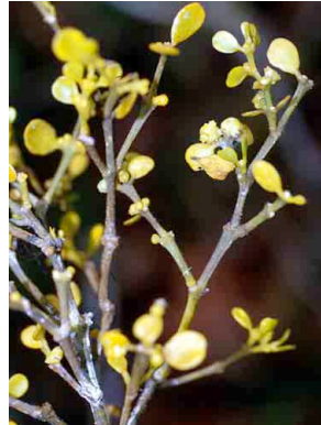
104 Dendrophthora elliptica LORANTHACEAE