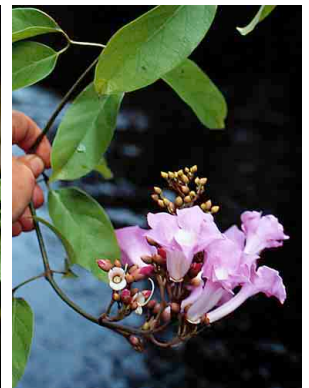
40 Paragonia pyramidata BIGNONIACEAE