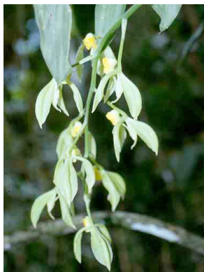
127 Catasetum sp. nov. ORCHIDACEAE