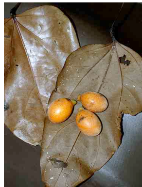
119 Anomospermum grandifolium MENISPERMACEAE