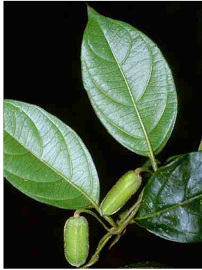
2 Mendoncia ACANTHACEAE