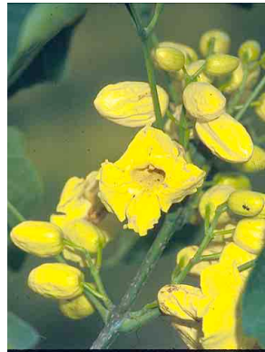
34 Callichlamys latifolia BIGNONIACEAE