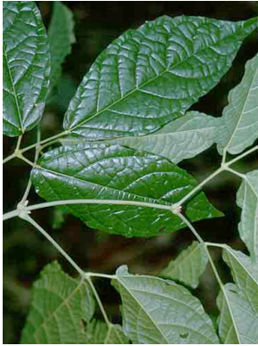
42 Stizophyllum riparium BIGNONIACEAE