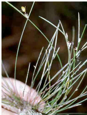
132 Octomeria brevifolia cf. ORCHIDACEAE