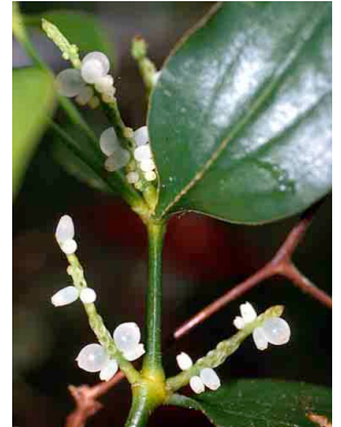
105 Phoradendron LORANTHACEAE