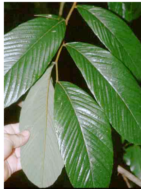
88 Machaerium FABACEAE