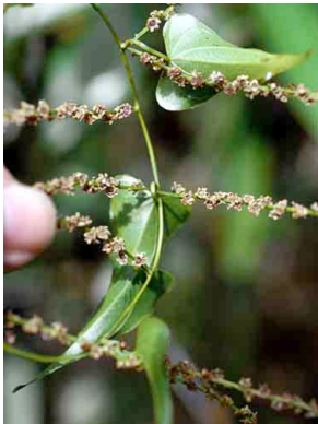
71 Dioscorea DIOSCOREACEAE