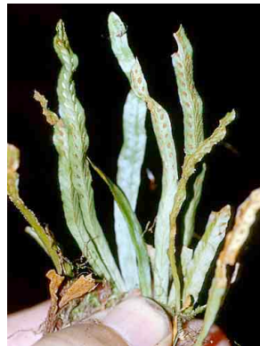
169 Enterosora PTERIDOPHYTA