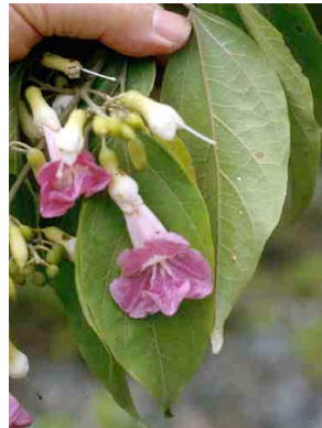
33 Arrabidaea verrucosa BIGNONIACEAE