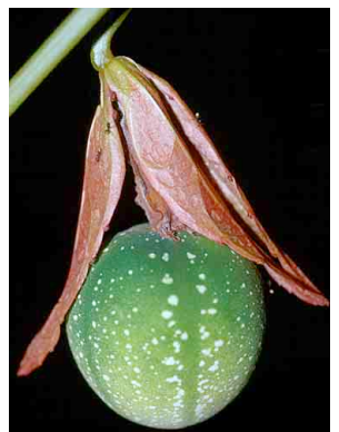
140 Passiflora coccinea PASSIFLORACEAE