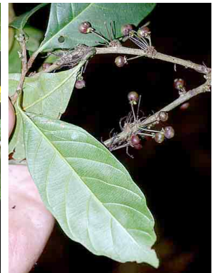
70 Doliocarpus DILLENACEAE