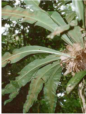
162 Asplenium serratum PTERIDOPHYTA