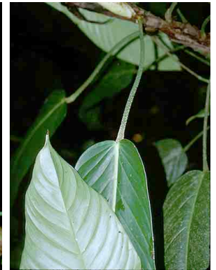
15 Philodendron ARACEAE