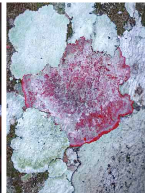
199 Cryptothecia rubrocincta LICHEN