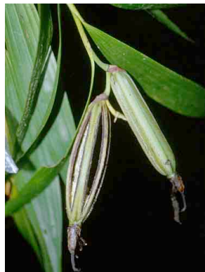
134 Sobralia ORCHIDACEAE