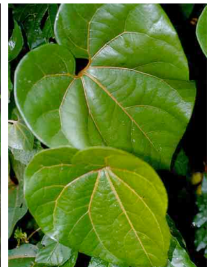
60 Fevillea cordifolia CUCURBITACEAE