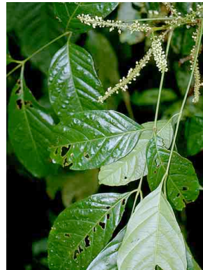
153 Paullinia SAPINDACEAE