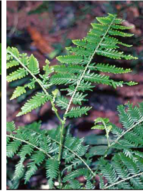
184 Selaginella exaltata PTERIDOPHYTA