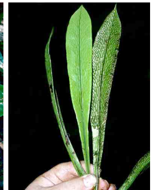
160 Antrophyum guyanense PTERIDOPHYTA