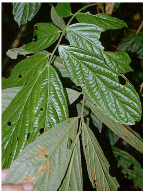
57 Connarus CONNARACEAE