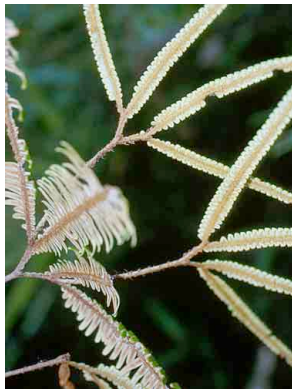
187 Sticherus PTERIDOPHYTA