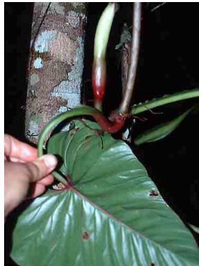
13 Philodendron ernestii ARACEAE