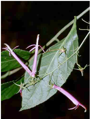
51 Siphocampylus CAMPANULACEAE