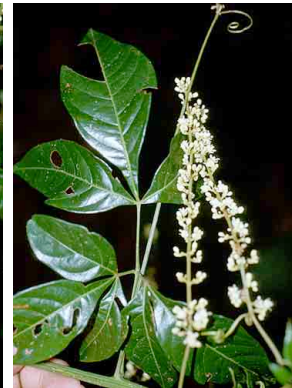
154 Serjania SAPINDACEAE