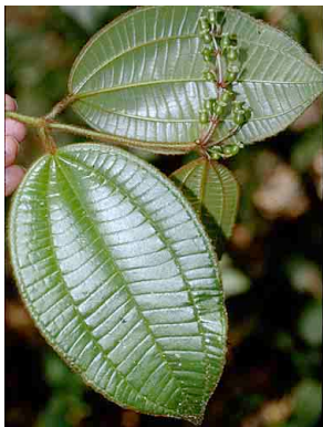
116 Adelobotrys MELASTOMATACEAE