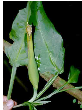
14 Philodendron ARACEAE