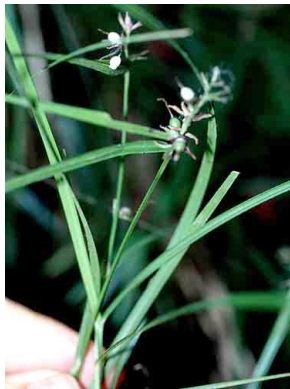
67 Scleria secans CYPERACEAE