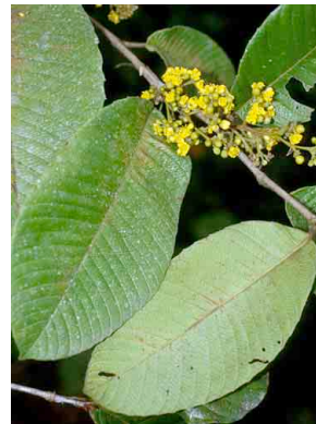
69 Davilla DILLENACEAE