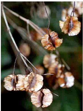
56 Combretum COMBRETACEAE