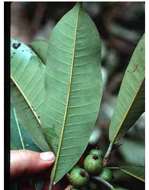
125 Ficus paraensis MORACEAE