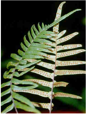
181 Polypodium PTERIDOPHYTA

© Environmental & Conservation Programs, The Field Museum, Chicago, IL 60605 USA. [RRC@fmnh.org] Rapid Color Guide # 106 version 1.1