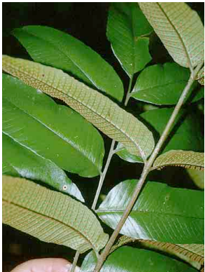
191 Thelypteris PTERIDOPHYTA