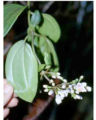
115 Adelobotrys MELASTOMATACEAE