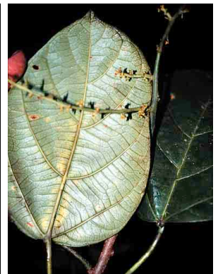
80 Omphalea diandra EUPHORBIACEAE