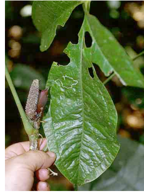
4 Anthurium brevipedunculatum ARACEAE