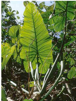
12 Philodendron deflexum ARACEAE