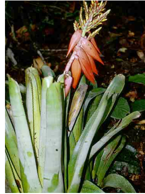
44 Aechmea BROMELIACEAE