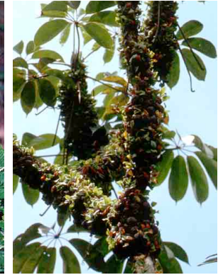
185 Solanopteris on Schefflera PTERIDOPHYTA