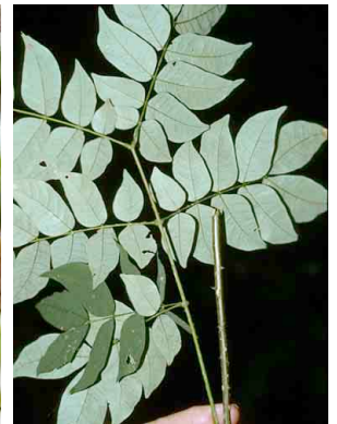
90 Piptadenia FABACEAE