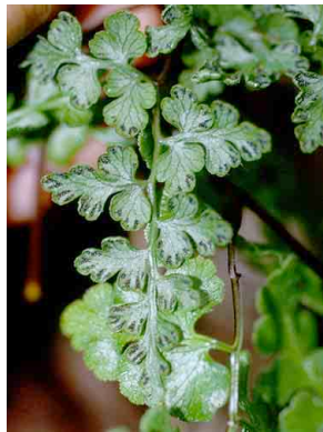
168 Eriosorus PTERIDOPHYTA