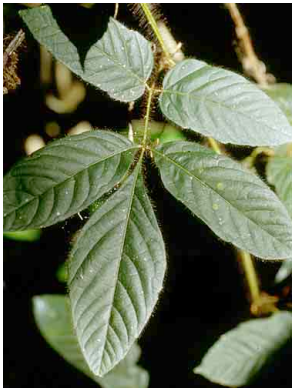
151 Paullinia SAPINDACEAE