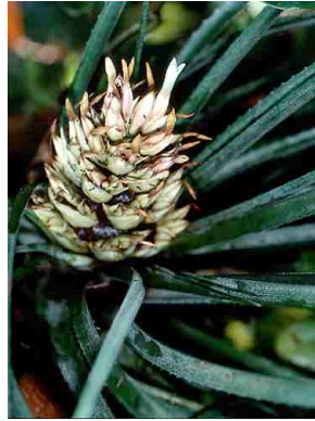
43 Aechmea longifolia BROMELIACEAE