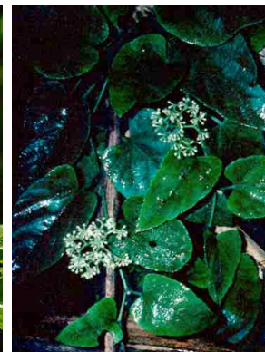
159 Cissus VITACEAE