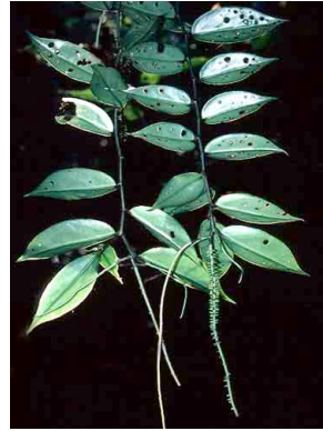
143 Peperomia macrostachya PIPERACEAE