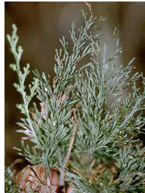
193 Trichomanes o Hymenophyllum PTERIDOPHYTA