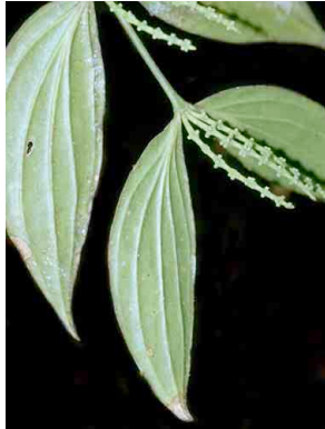
102 Phoradendron LORANTHACEAE