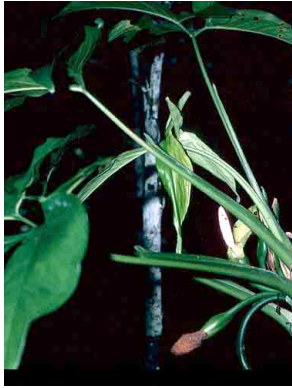
21 Syngonium ARACEAE

© Environmental &amp; Conservation Programs, The Field Museum, Chicago, IL 60605 USA. [RRC@fmnh.org] Rapid Color Guide # 106 version 1.1