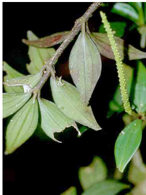
147 Peperomia PIPERACEAE