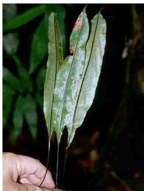
177 Oleandra PTERIDOPHYTA