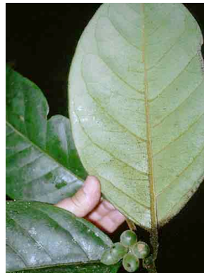
68 Dichapetalum DICHAPETALACEAE