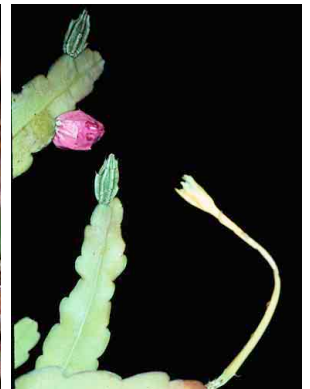
50 Epiphyllum phyllanthus CACTACEAE