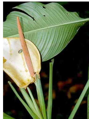
19 Rhodospatha latifolia ARACEAE