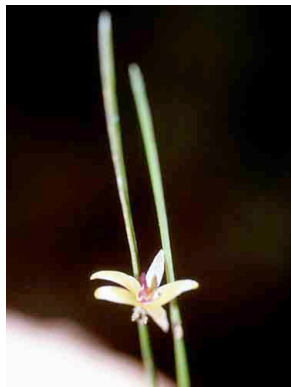
133 Octomeria brevifolia cf. ORCHIDACEAE