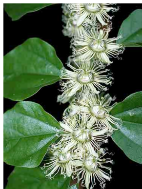
138 Passiflora auriculata PASSIFLORACEAE