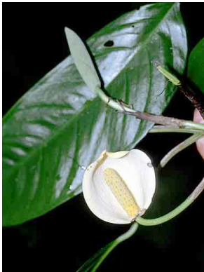
11 Monstera obliqua ARACEAE