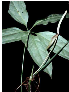
9 Anthurium pentaphyllum ARACEAE