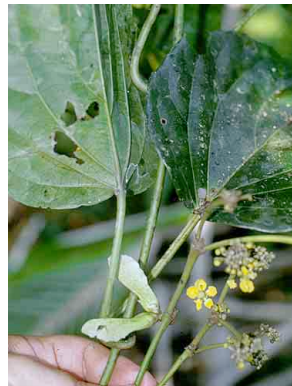
109 Stigmaphyllon MALPIGHIACEAE