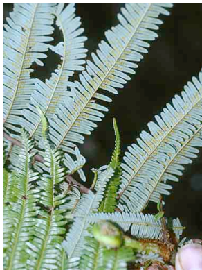
167 Diplazium PTERIDOPHYTA