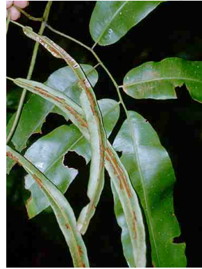
183 Salpichlaena volubilis PTERIDOPHYTA