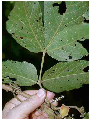
152 Paullinia SAPINDACEAE