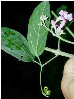
32 Arrabidaea platyphylla BIGNONIACEAE