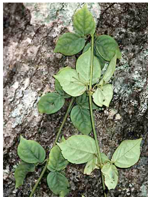
38 Macfadyena unguiscati BIGNONIACEAE