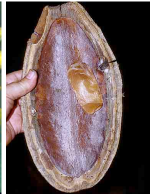
35 Callichlamys latifolia BIGNONIACEAE