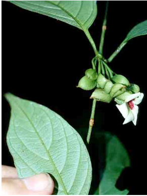
1 Mendoncia glabra ACANTHACEAE

© Environmental & Conservation Programs, The Field Museum, Chicago, IL 60605 USA. [RRC@fmnh.org] Rapid Color Guide # 106 version 1.1