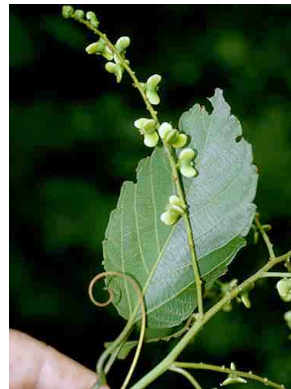
148 Gouania lupuloides RHAMNACEAE