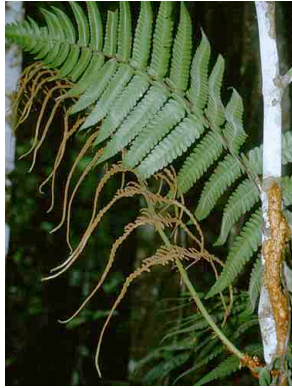
182 Polybotrya PTERIDOPHYTA