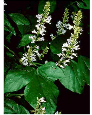
85 Calopogonium caeruleum FABACEAE