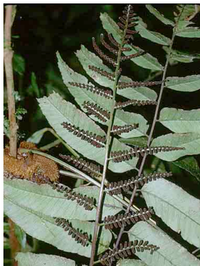
172 Lomariopsis PTERIDOPHYTA