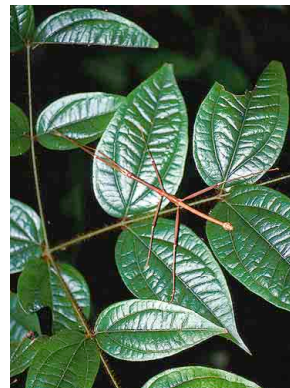
99 Strychnos toxifera LOGANIACEAE