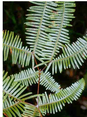
188 Sticherus PTERIDOPHYTA