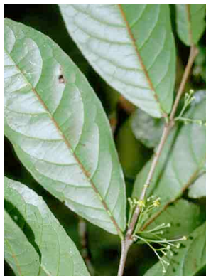
97 Hippocratea HIPPOCRATEACEAE