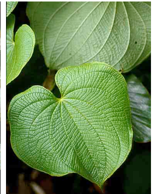
75 Dioscorea DIOSCOREACEAE