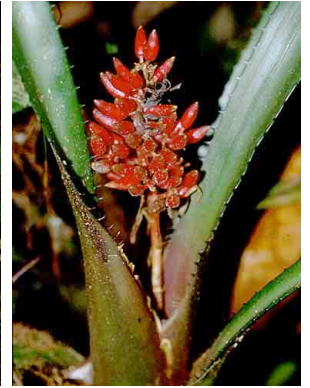
45 Aechmea BROMELIACEAE