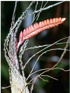
46 Racinaea BROMELIACEAE