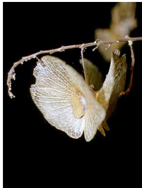
108 Mascagnia MALPIGHIACEAE