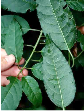
141 Trichostigma octandrum PHYTOLACCACEAE

© Environmental &amp; Conservation Programs, The Field Museum, Chicago, IL 60605 USA. [RRC@fmnh.org] Rapid Color Guide # 106 version 1.1