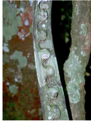
83 Bauhinia FABACEAE