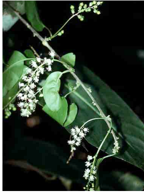
142 Trichostigma octandrum PHYTOLACCACEAE