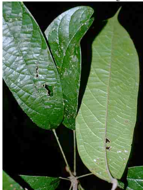
122 Telitoxicum MENISPERMACEAE