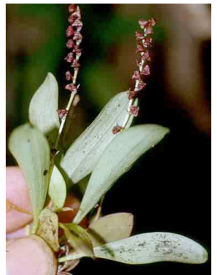
135 Stelis ORCHIDACEAE