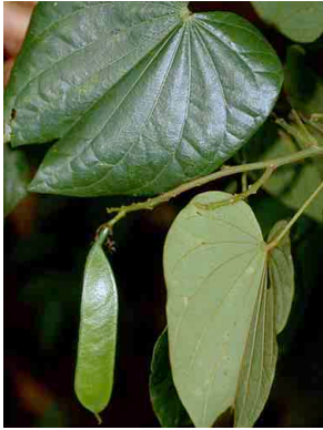
81 Bauhinia glabra FABACEAE

© Environmental & Conservation Programs, The Field Museum, Chicago, IL 60605 USA. [RRC@fmnh.org] Rapid Color Guide # 106 version 1.1