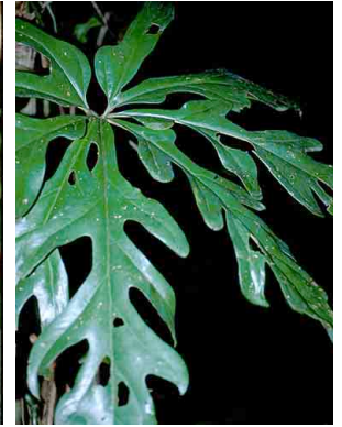
5 Anthurium clavigerum ARACEAE