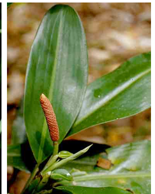
20 Stenospermation ARACEAE