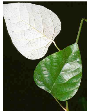
120 Chondrodendron tomentosum MENISPERMACEAE