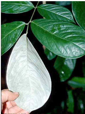
86 Machaerium cuspidatum FABACEAE