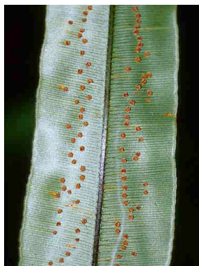
178 Oleandra PTERIDOPHYTA