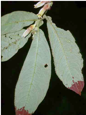
91 Columnnea guttata GESNERIACEAE