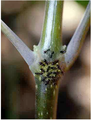
41 Paragonia pyramidata BIGNONIACEAE

© Environmental & Conservation Programs, The Field Museum, Chicago, IL 60605 USA. [RRC@fmnh.org] Rapid Color Guide # 106 version 1.1