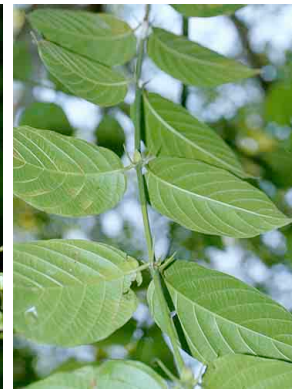
149 Uncaria tomentosa RUBIACEAE