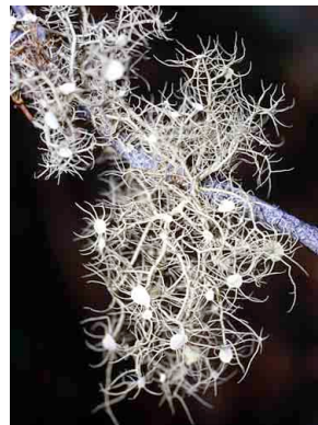
198 Usnea LICHEN