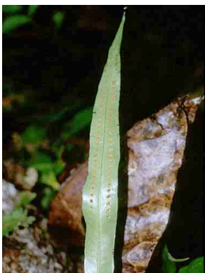
176 Microgramma PTERIDOPHYTA