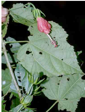
112 Malvaviscus MALVACEAE