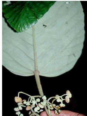
53 Coussapoa villosa CECROPIACEAE