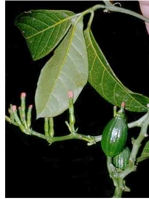
64 Psiguria CUCURBITACEAE