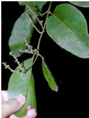
106 Phthirusa pyrifolia LORANTHACEAE