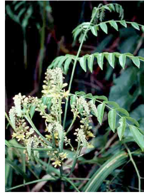
84 Caesalpinia bonduc FABACEAE