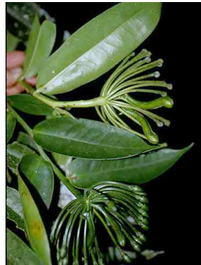
114 Marcgravia MARCRAVIACEAE