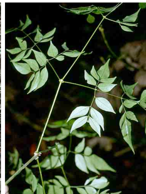
39 Memora jasminifolia BIGNONIACEAE