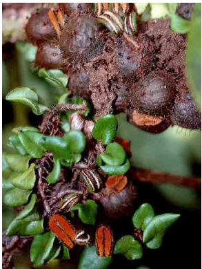
186 Solanopteris sp. nov. PTERIDOPHYTA