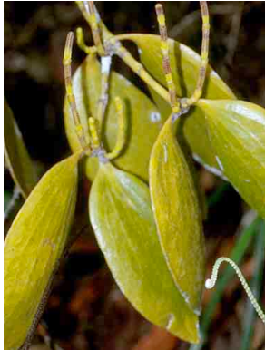
101 Phoradendron LORANTHACEAE

Rapid Color Guide # 106 version 1.1