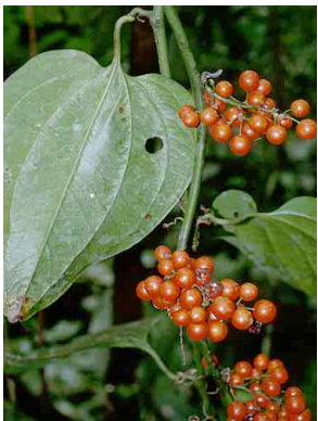
156 Smilax SMILACACEAE