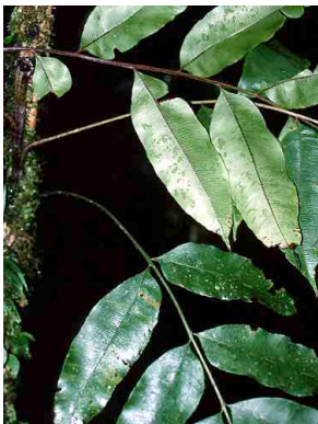
171 Lomariopsis japurensis PTERIDOPHYTA