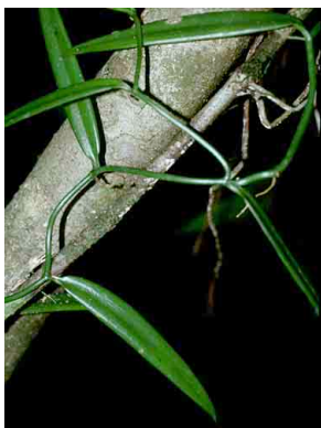
136 Vanilla ORCHIDACEAE