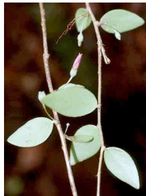
78 Sphyrropermum ERICACEAE