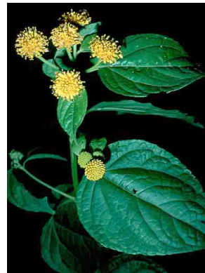
29 Wulffia baccata ASTERACEAE