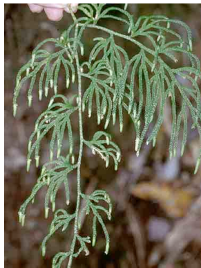
173 Lycopodiella cernua PTERIDOPHYTA