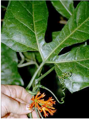
61 Gurania CUCURBITACEAE

[RRC@fmnh.org] Rapid Color Guide # 106 version 1.1