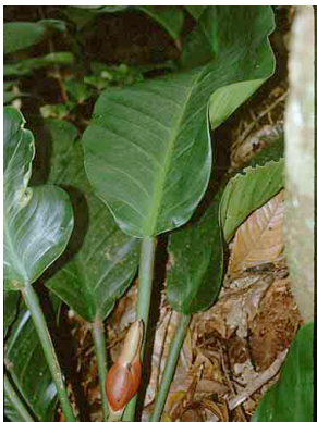
16 Philodendron ARACEAE