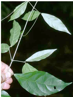
36 Clytostoma BIGNONIACEAE