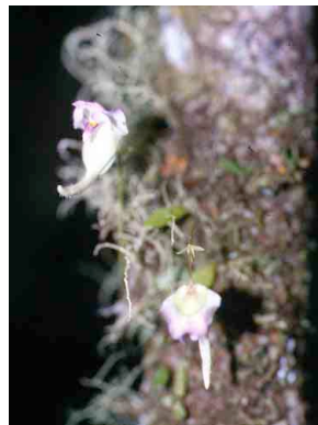
98 Utricularia LENTIBULARIACEAE