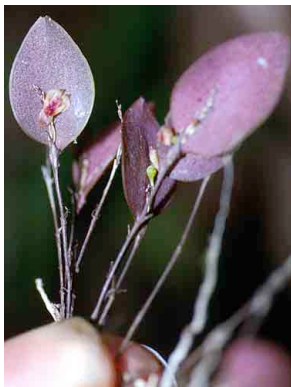
131 Lpanthes ORCHIDACEAE