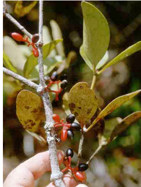
103 Psittacanthus LORANTHACEAE