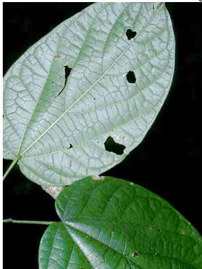
121 Odontocarya MENISPERMACEAE

© Environmental & Conservation Programs, The Field Museum, Chicago, IL 60605 USA. [RRC@fmnh.org] Rapid Color Guide # 106 version 1.1