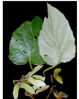
110 Stigmaphyllon MALPIGHIACEAE