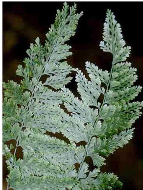
192 Trichomanes PTERIDOPHYTA