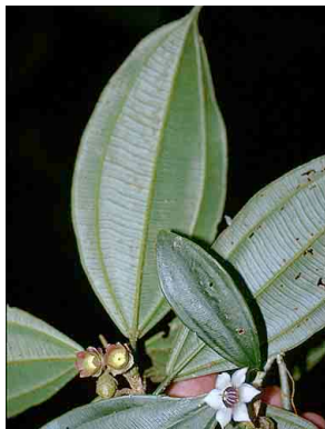
117 Blakea MELASTOMATACEAE