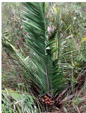
7 Attalea geraensis indaiá-rasteiro