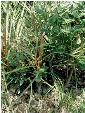
31 Syagrus mendanhensis

Endemicas da Cadeia do Espinhaço em Minas Gerais