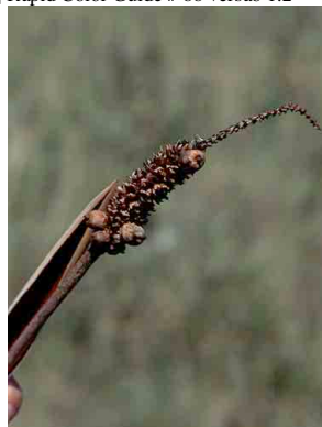
5 Allagoptera campestris buri