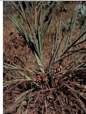
34 Syagrus petraea coco-de-vassoura