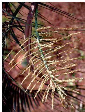
14 Butia capitata butiá-vinagre