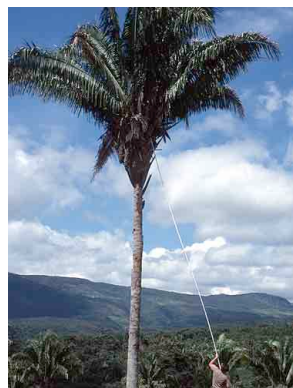
10 Attalea oleifera andaiá