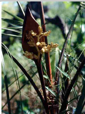
37 Syagrus pleioclada Endêmica da Cadeia do Espinhaço em Minas Gerais