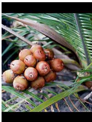
8 Attalea geraensis indaiá-rasteiro