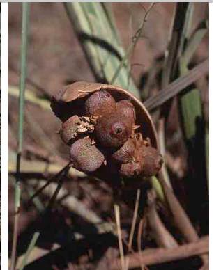
35 Syagrus petraea coco-de-vassoura