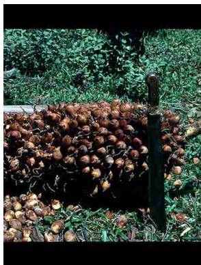
11 Attalea oleifera andaiá