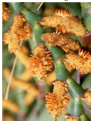
19 Mauritia flexuosa buriti