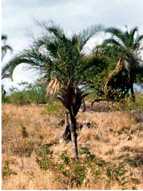
21 Syagrus coronata licuri

Photos by A.C. Marcato. Produced by: A.C. Marcato, J.R. Pirani, R.B. Foster M.R. Metz, K. Steffes, & E. Currano, with support from the Andrew Mellon Foundation. ©A.C. Marcato & J.R. Pirani [jpirani@ib.usp.br]; & Environmental & Conservation Programs, The Field Museum, Chicago, IL 60605 USA. [RRC@fmnh.org] Rapid Color Guide# 88 version 1.2