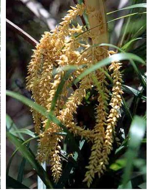
25 Syagrus flexuosa coco-de-raposa