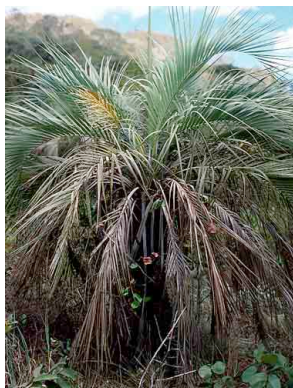
13 Butia capitata butiá-vinagre