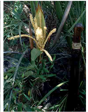
30 Syagrus mendanhensis

Endemicas da Cadeia do Espinhaço em Minas Gerais