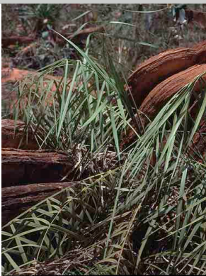
36 Syagrus pleioclada Endêmica da Cadeia do Espinhaço em Minas Gerais