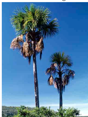
18 Mauritia flexuosa buriti