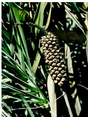
6 Allagoptera campestris buri