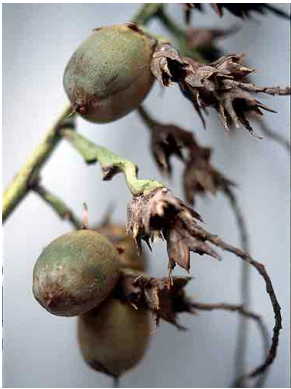
26 Syagrus flexuosa coco-de-raposa