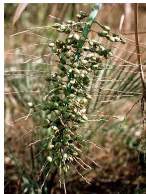
15 Butia capitata butiá-vinagre