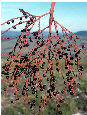
17 Geonoma brevispatha ouricana