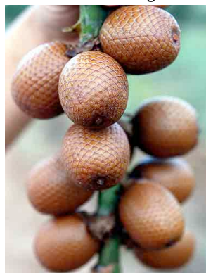
20 Mauritia flexuosa buriti