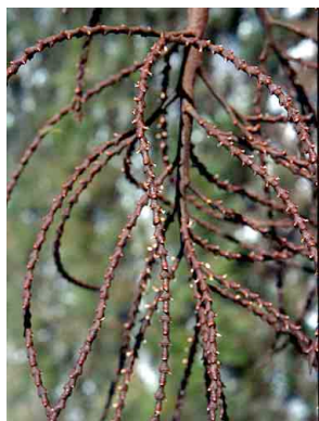
16 Geonoma brevispatha ouricana