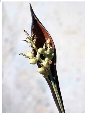
38 Syagrus pleioclada Endêmica da Cadeia do Espinhaço em Minas Gerais