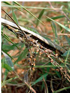
12 Butia archeri butiá