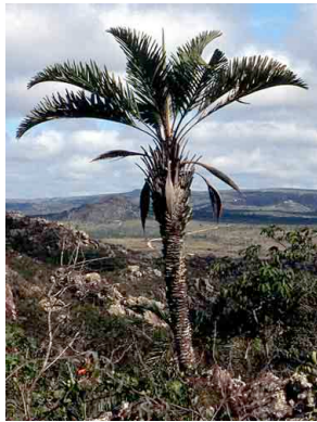
27 Syagrus glaucescens