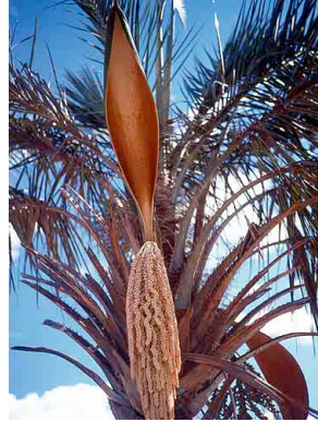
23 Syagrus coronata licuri