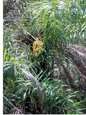
24 Syagrus flexuosa coco-de-raposa