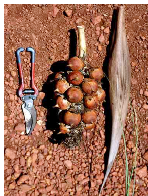
9 Attalea geraensis indaiá-rasteiro