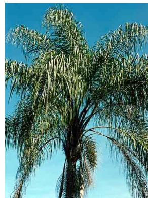
39 Syagrus romanzoffiana jerivá