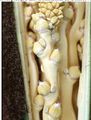
2 Acrocomia aculeata macaúba