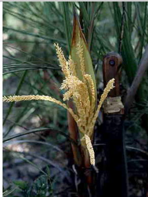
32 Syagrus mendanhensis