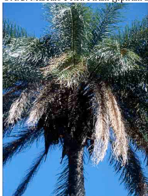
1 Acrocomia aculeata macaúba

Rapid Color Guide # 88 versão 1.2