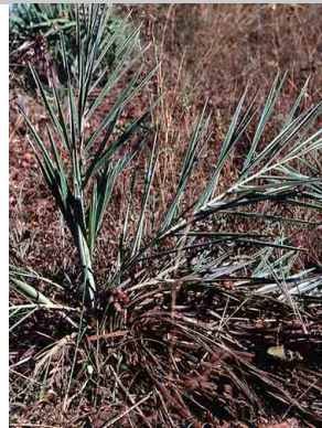
33 Syagrus petraea coco-de-vassoura