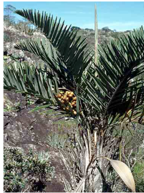
28 Syagrus glaucescens