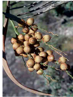
29 Syagrus glaucescens