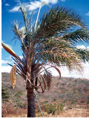
22 Syagrus coronata licuri