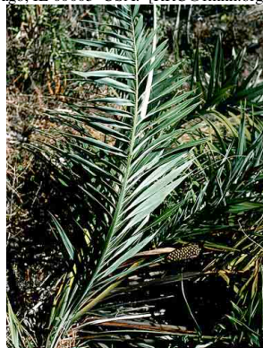
4 Allagoptera campestris buri