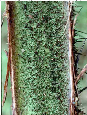
3 Acrocomia aculeata macaúba