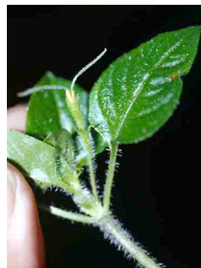
19 Nasa LOASACEAE