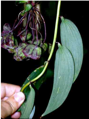
1 Bomarea irsuta ALSTROEMERIACEAE

Producido por: R. B. Foster, M. R. Metz, H. Betz, T. Theim, con el apoyo del Andrew Mellon Foundation y K. Romoleroux, L. Jost. [RRC@fmnh.org] Rapid Color Guide # 66 version 1.3