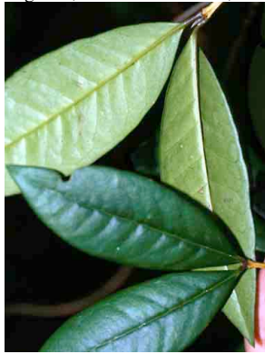
22 Myrcianthes rhopaloides MYRTACEAE