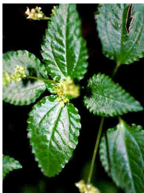
37 Pilea hitchcockii cf. URTICACEAE