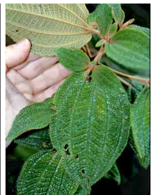
20 Miconia papillosa MELASTOMATACEAE