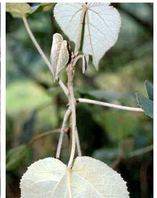
15 Croton coriaceus EUPHORBIACEAE