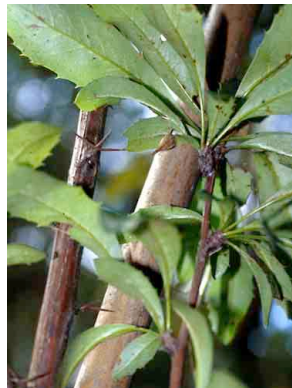
8 Berberis paniculata BERBERIDACEAE