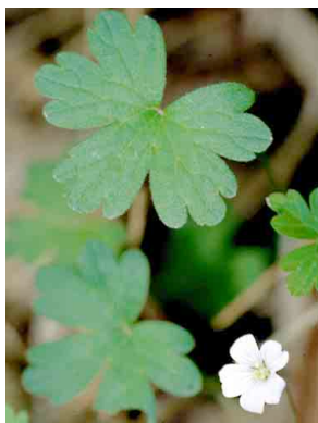
17 Geranium reptans GERANIACEAE