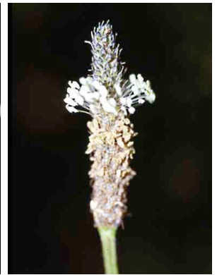
30 Plantago australis PLANTAGINACEAE