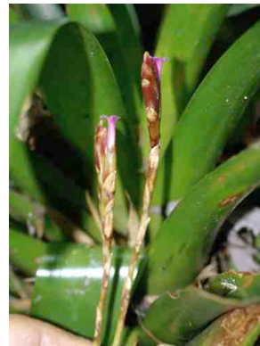
9 Tillandsia complanata BROMELIACEAE