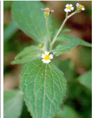
5 Galinsoga parviflora ASTERACEAE