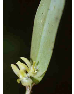
25 Pleurothallis ORCHIDACEAE