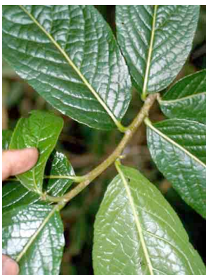
16 Casearia mexiae FLACOURTIACEAE