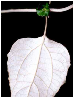
7 Liabum igniarum ASTERACEAE