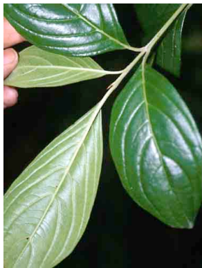
12 Cornus peruviana CORNACEAE