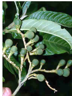
34 Solanum oblongifolium SOLANACEAE