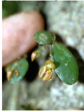
23 Lepanthes ORCHIDACEAE