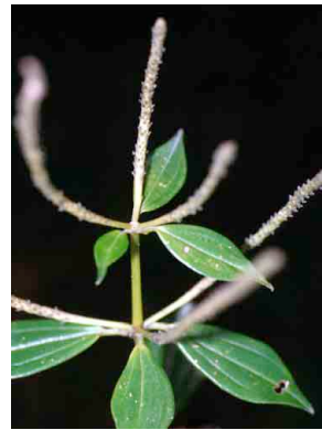
29 Peperomia fruticetorum PIPERACEAE