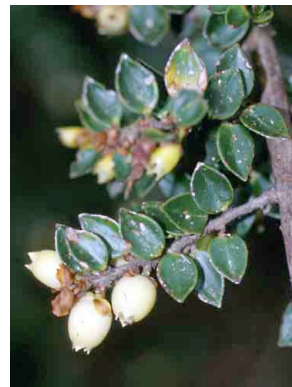
14 Disterigma acuminatum ERICACEAE