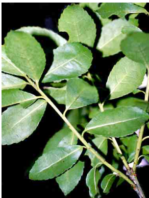
11 Maytenus verticillata CELASTRACEAE