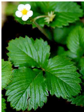
32 Fragaria vesca ROSACEAE