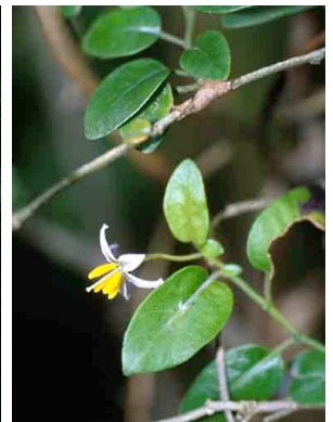
35 Solanum brevifolium SOLANACEAE