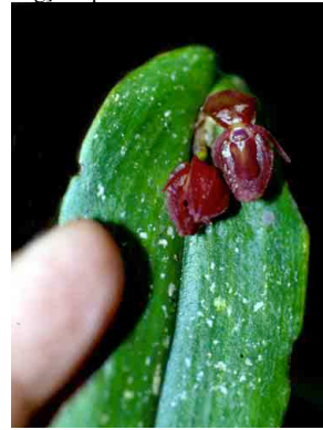
24 Pleurothallis ORCHIDACEAE