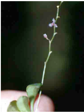
26 Stelis ORCHIDACEAE