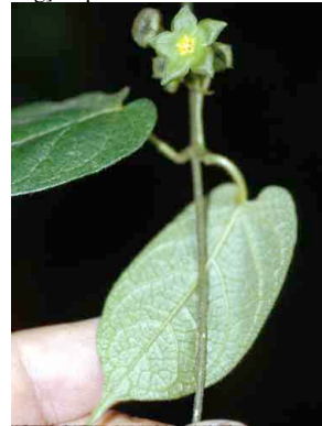
4 Matelea humboldtiana ASCLEPIADACEAE