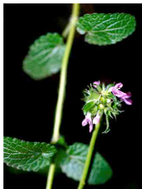
18 Stachys elliptica LAMIACEAE