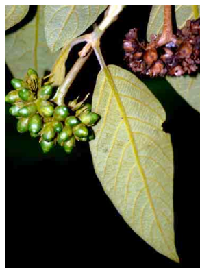
38 Aegiphila ferruginea VERBENACEAE