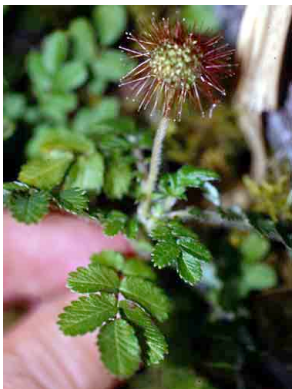
31 Acaena ovalifolia ROSACEAE