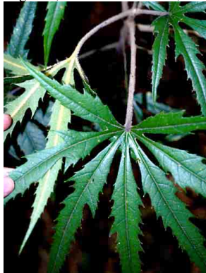
2 Oreopanax ecuadorensis (juvenil) ARALIACEAE