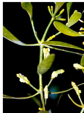
39 Dendrophthora clavata VISACEAE