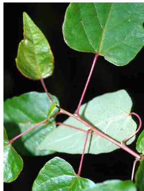
13 Vallea stipularis ELAEOCARPACEAE