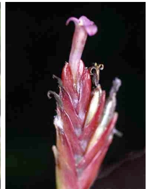
10 Tillandsia complanata BROMELIACEAE