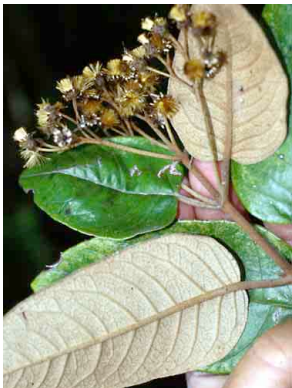
6 Gynoxys acostae ASTERACEAE