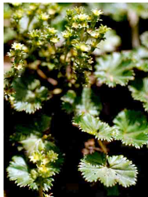
33 Lachemilla orbiculata ROSACEAE