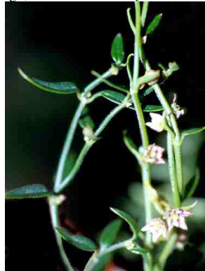
3 Cynanchum microphyllum ASCLEPIADACEAE