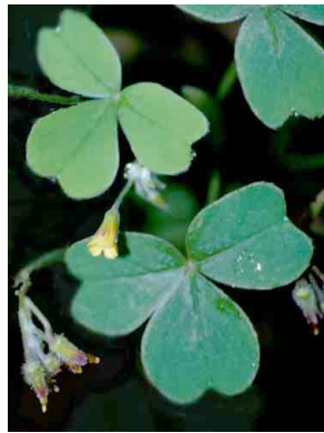
28 Oxalis lotoides OXALIDACEAE