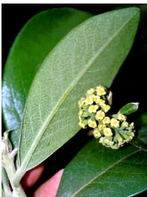
36 Daphnopsis THYMELEACEAE