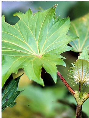
7 Erato vulcanica ASTERACEAE