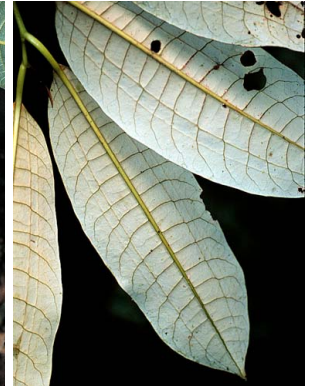
30 Otoba lehmannii MYRISTICACEAE