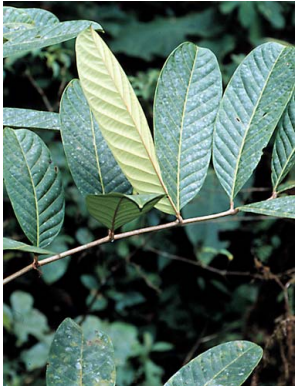
26 Carapa guianensis MELIACEAE