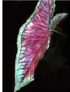
4 Xanthosoma ARACEAE