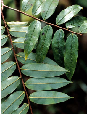
1 Xylopia ANNONACEAE

© Environmental & Conservation Programs, The Field Museum, Chicago, IL 60605 USA. [RRC@fmnh.org] Rapid Color Guide # 11 versión 2