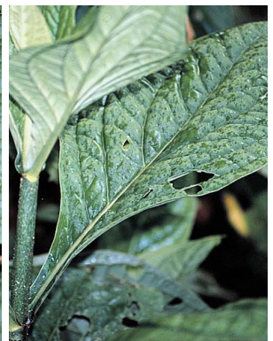
20 Macrocarpaea GENTIANACEAE