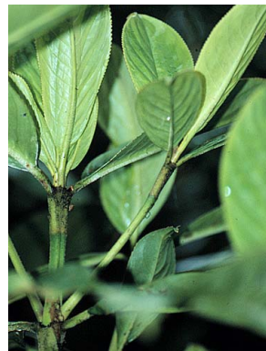
14 Hedyosmum bonplandianum CHLORANTHACEAE