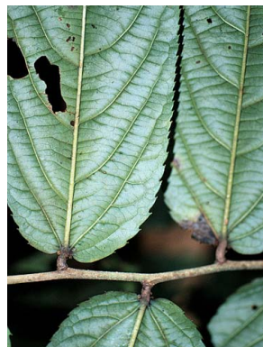
19 Banara guianensis FLACOURTIACEAE