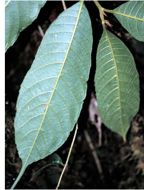
29 Perebea MORACEAE