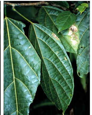
10 Matisia alcornifolia aff. BOMBACACEAE