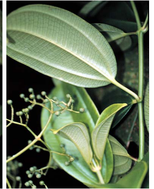
25 Miconia theizans cf. MELASTOMATACEAE