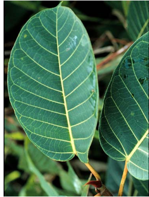
28 Ficus macbridei MORACEAE