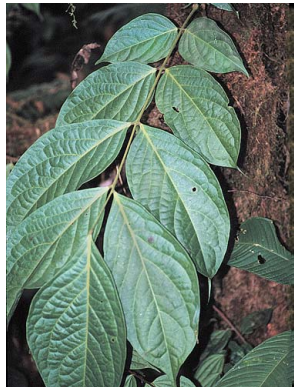
32 Picramnia sphaerocarpa cf. PICRAMNIACEAE