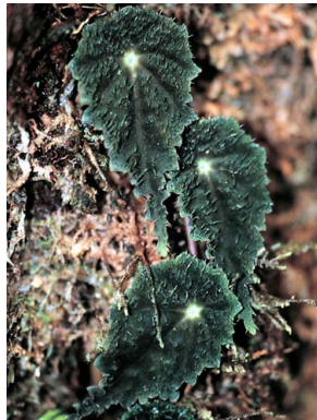
8 Begonia maurandiae BEGONIACEAE