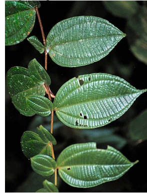
24 Clidemia hirta MELASTOMATACEAE