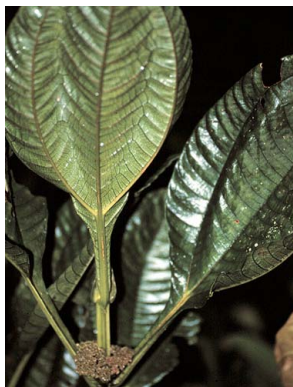
38 Pilea pteropodon URTICACEAE