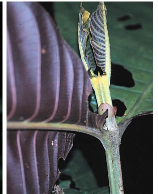
35 Elaeagia karstenii cf. RUBIACEAE