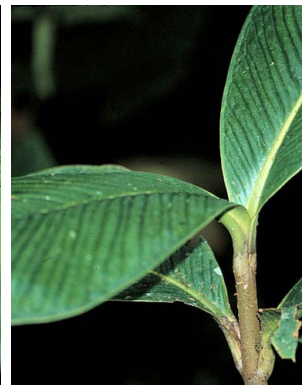
15 Clusia garciabarrigae cf. CLUSIACEAE