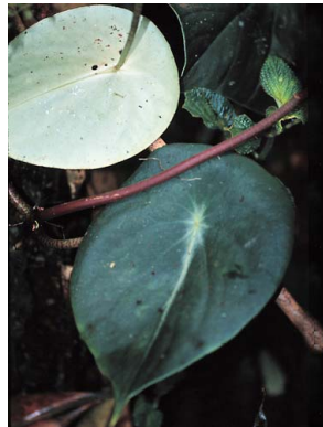
33 Peperomia hernandiifolia PIPERACEAE