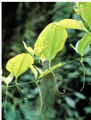
37 Smilax spinosa SMILACACEAE