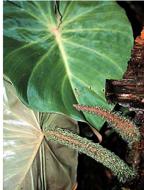
3 Philodendron verrucosum aff. ARACEAE