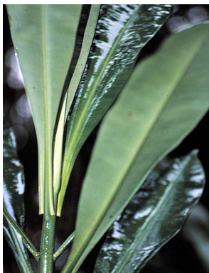
16 Tovomita weddelliana CLUSIACEAE