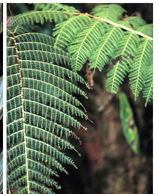
40 Asplenium rutaceum cf. PTERIDOPHYTA