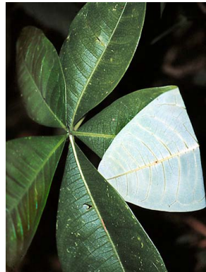
9 Pachira patinoi BOMBACACEAE