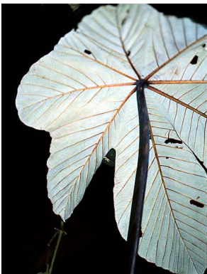
12 Cecropia gabrielis CECROPIACEAE