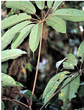
6 Schefflera decagyna cf. ARALIACEAE