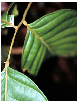
36 Matayba SAPINDACEAE