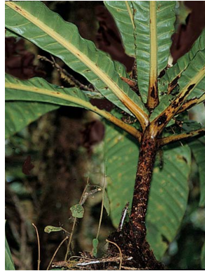
23 Grias neuberthii LECYTHIDACEAE