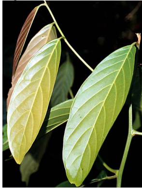
22 Nectandra LAURACEAE