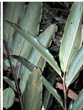
39 Renealmia lucida ZINGIBERACEAE