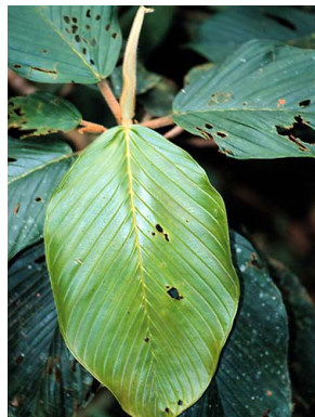
13 Coussapoa contorta CECROPIACEAE