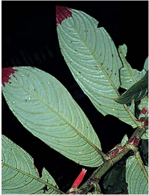
21 Columnnea rubriacuta GESNERIACEAE

Rapid Color Guide # 11 versión 2