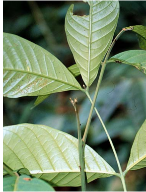
27 Guarea MELIACEAE