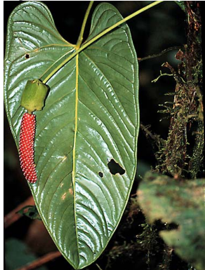
2 Anthurium ARACEAE