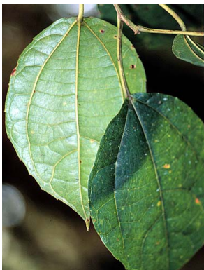
17 Alchornea glandulosa cf. EUPHORBIACEAE