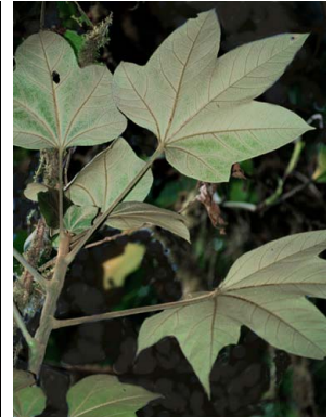
5 Oreopanax ARALIACEAE