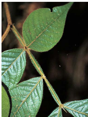
18 Inga FABACEAE