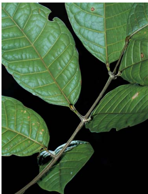
11 Protium BURSERACEAE